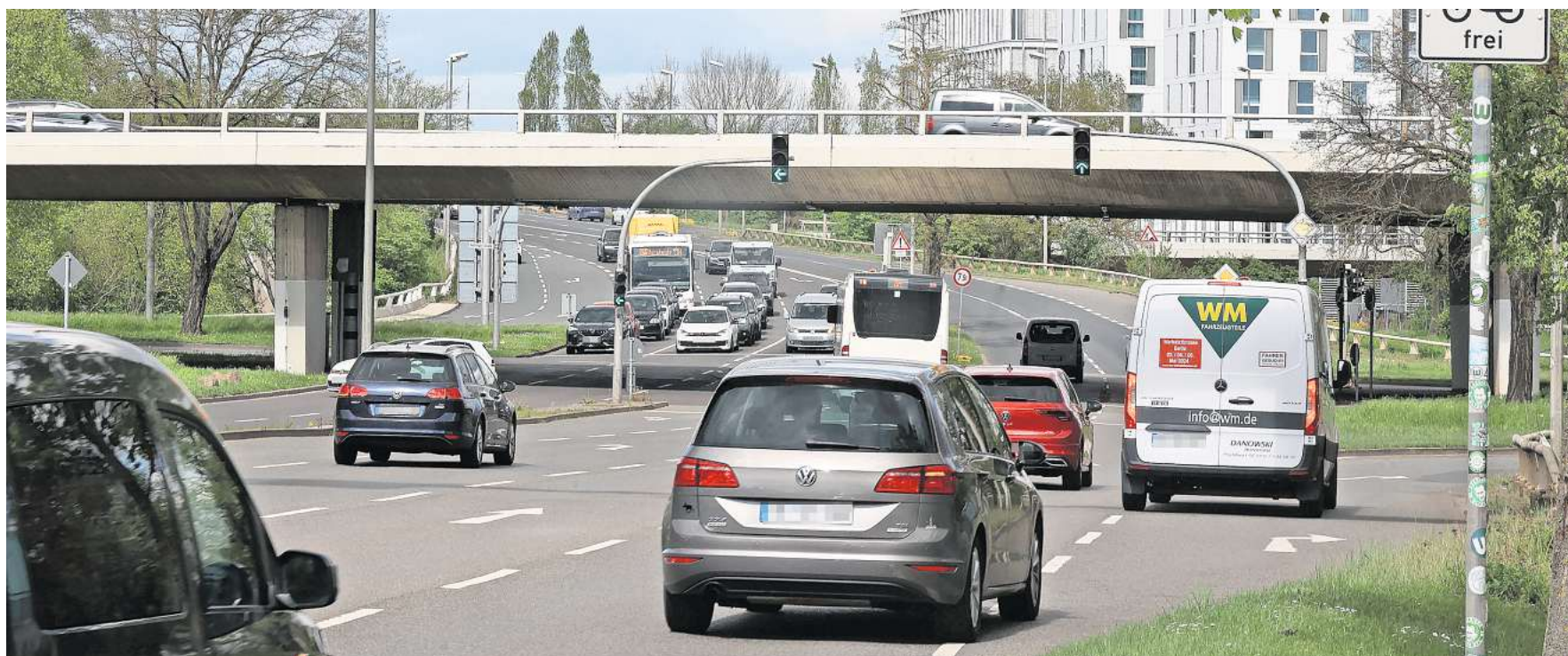
Der St.-Annen-Knoten ist einer der Verkehrsunfallsschwerpunkte in der Stadt.