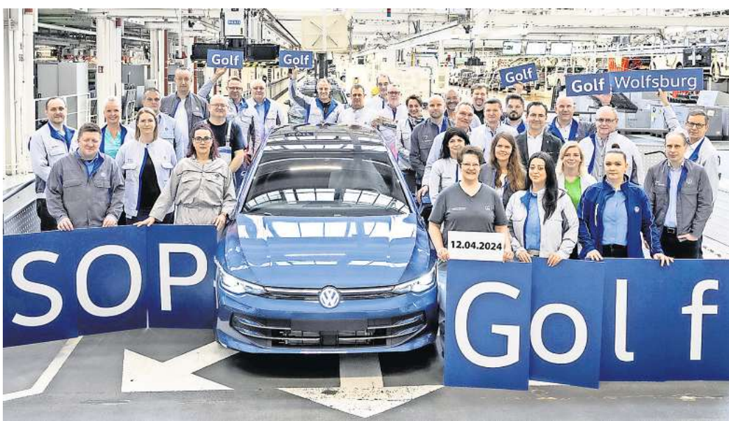
Produktionsstart: Der erste Golf VIII mit Produktaufwertung lief im Wolfsburger Volkswagen-Werk vom Band.