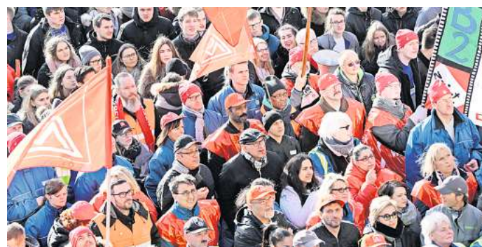
Die IG Metall startet am 1. Mai ihre Kundgebung.

„Wir erleben eine Zeit massiver Umwälzungen. Viele Menschen sind deshalb verunsichert. Gerade in schwierigen Zeiten wie diesen braucht es Solidarität und eine vereinte, starke Arbeitnehmerschaft. Nur so können Arbeitsrechte erkämpft und verteidigt werden. Und nur so lässt sich sicherstellen, dass Digitalisierung und Transformation sozial gerecht ablaufen. Deswegen rufe ich alle Menschen in der Re-