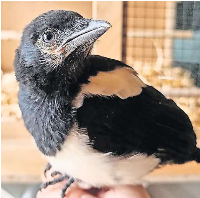
Nach ihrem tagelangen Verschwinden wurde die Wolfsburger Elster „Elsa“ nun wieder gesehen.