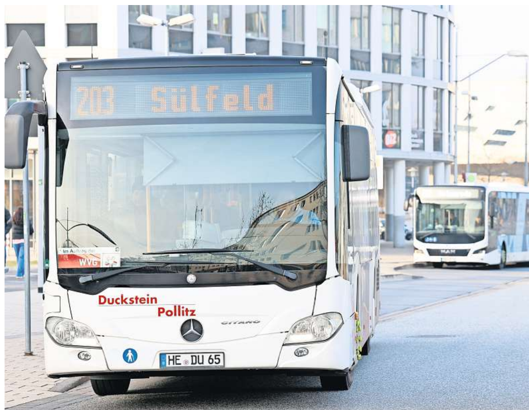
Auch die Busse in Wolfsburg fahren wieder zuverlässiger: Es gibt einen Tarifabschluss für Beschäftigte im ÖPNV.