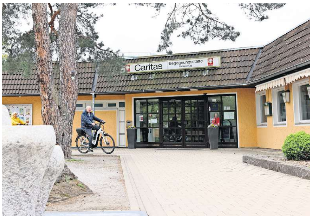
Sollten die Pläne von St. Christophorus Realität werden, könnte auf dem Gelände des heutigen Föhrenkrugs der Neubau entstehen.

In unmittelbarer Nachbarschaft hat die Diakonie bereits ihren Neubau erhalten, in dem ein Teil des St.-Elisabeth-Heims neu errichtet wurde. Wenige Meter weiter in Richtung Porschestraße sollen in absehbarer Zeit die Brawo-Arkaden entstehen.