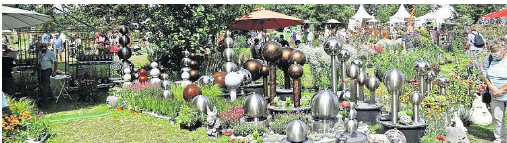
Wer seinen Garten verschönern möchte, kann sich Anfang Mai in Wienhausen auf der Gartenmesse „Blumen & Ambiente“ inspirieren lassen.

Die Besuchenden können durch verschiedene Gartenwelten schlendern, die von Garten-