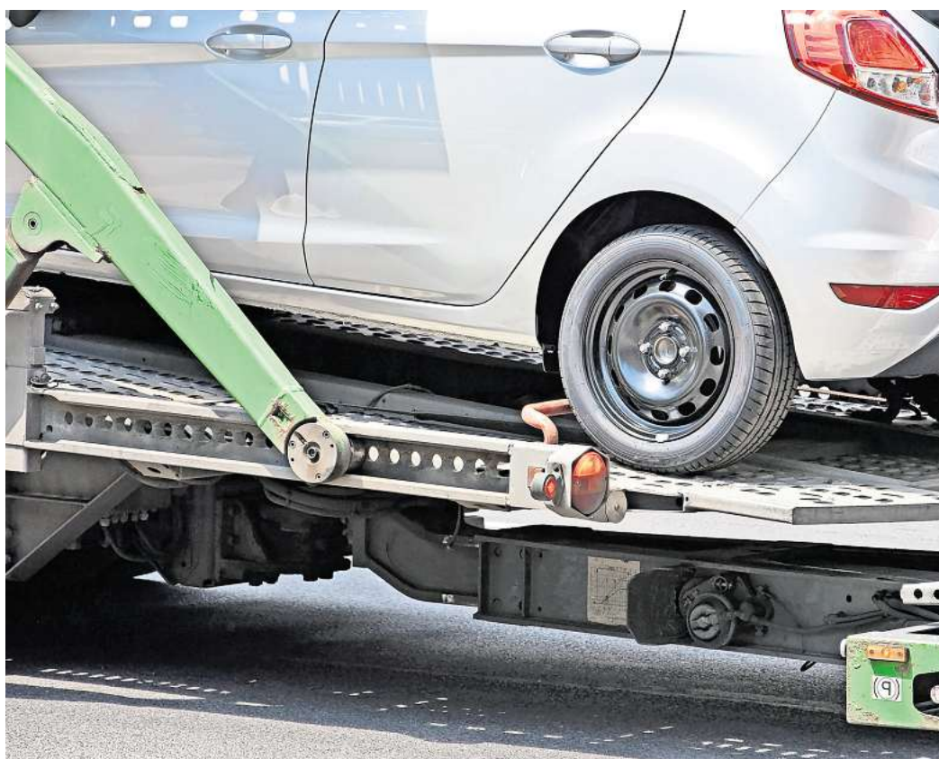
Rund 200 Mal im Jahr rückt in Wolfsburg der Abschleppwagen an.

Wo werden die Autos abgestellt, bis sie von ihren Eigentümern wieder abgeholt werden?