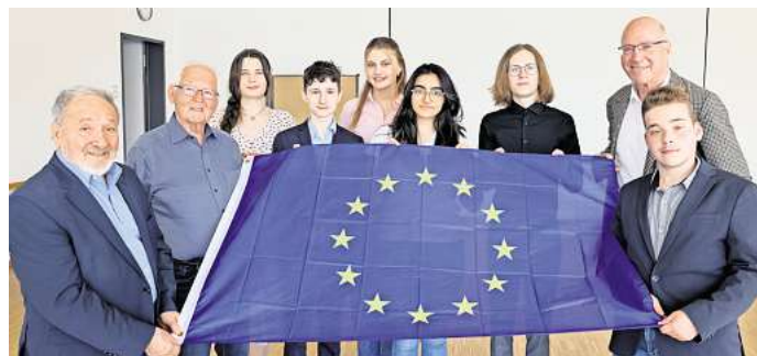
Wollen Jugendliche zur Stimmabgabe bei der EU-Wahl motivieren: Wolfsburger Ehrenbürger und der Stadtschülerrat bei der Vorstellung ihres Projekts.