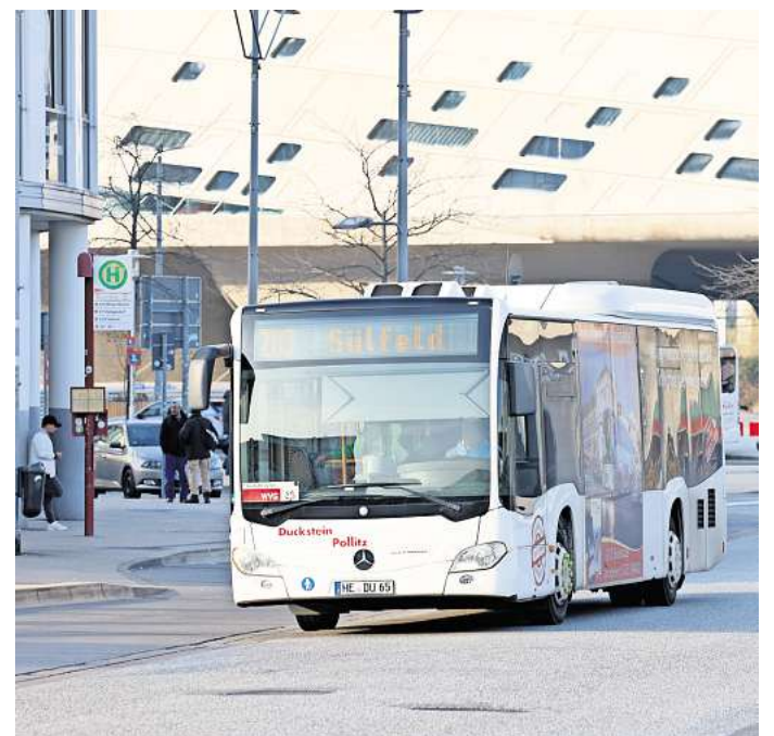
Die Wolfsburger Verkehrsbetriebe (WVG) zählten im April, wie viele Schwerbehinderte die Busse nutzen.

Es wird nicht exakt gezählt, wie viele Schwerbehinderte die Busse der WVG täglich nutzen, sondern ein Quotient erstellt. „Aus den Fahrplandaten wird ein Stichprobenumfang mit den zu erhebenden Fahrten je Erhebungsperiode ermittelt. Das Zählpersonal erfasst dann die