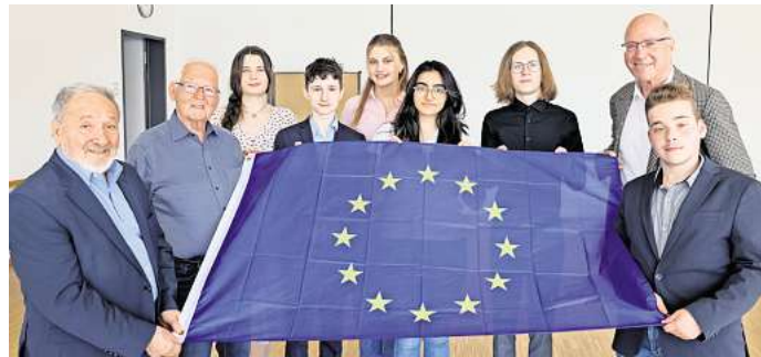
Wollen Jugendliche zur Stimmabgabe bei der EU-Wahl motivieren: Wolfsburger Ehrenbürger und der Stadtschülerrat bei der Vorstellung ihres Projekts.