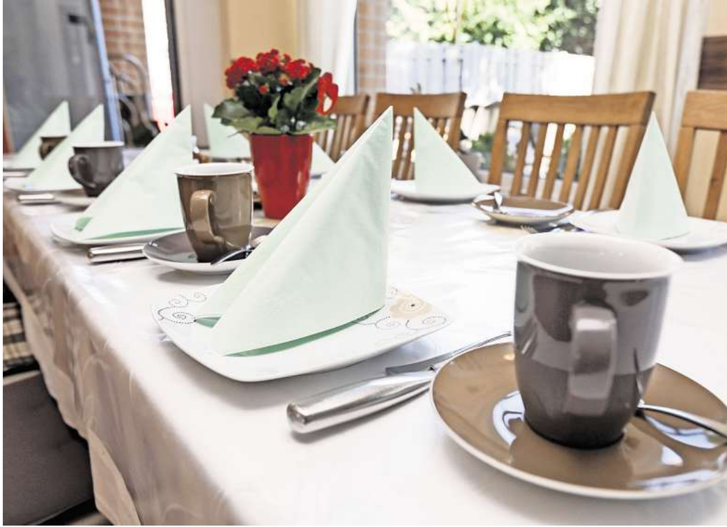
Umfrage: Wie viel würden Sie für eine Tasse Kaffee bezahlen?

Wir würden in diesem Zusammenhang gerne von Ihnen wis-