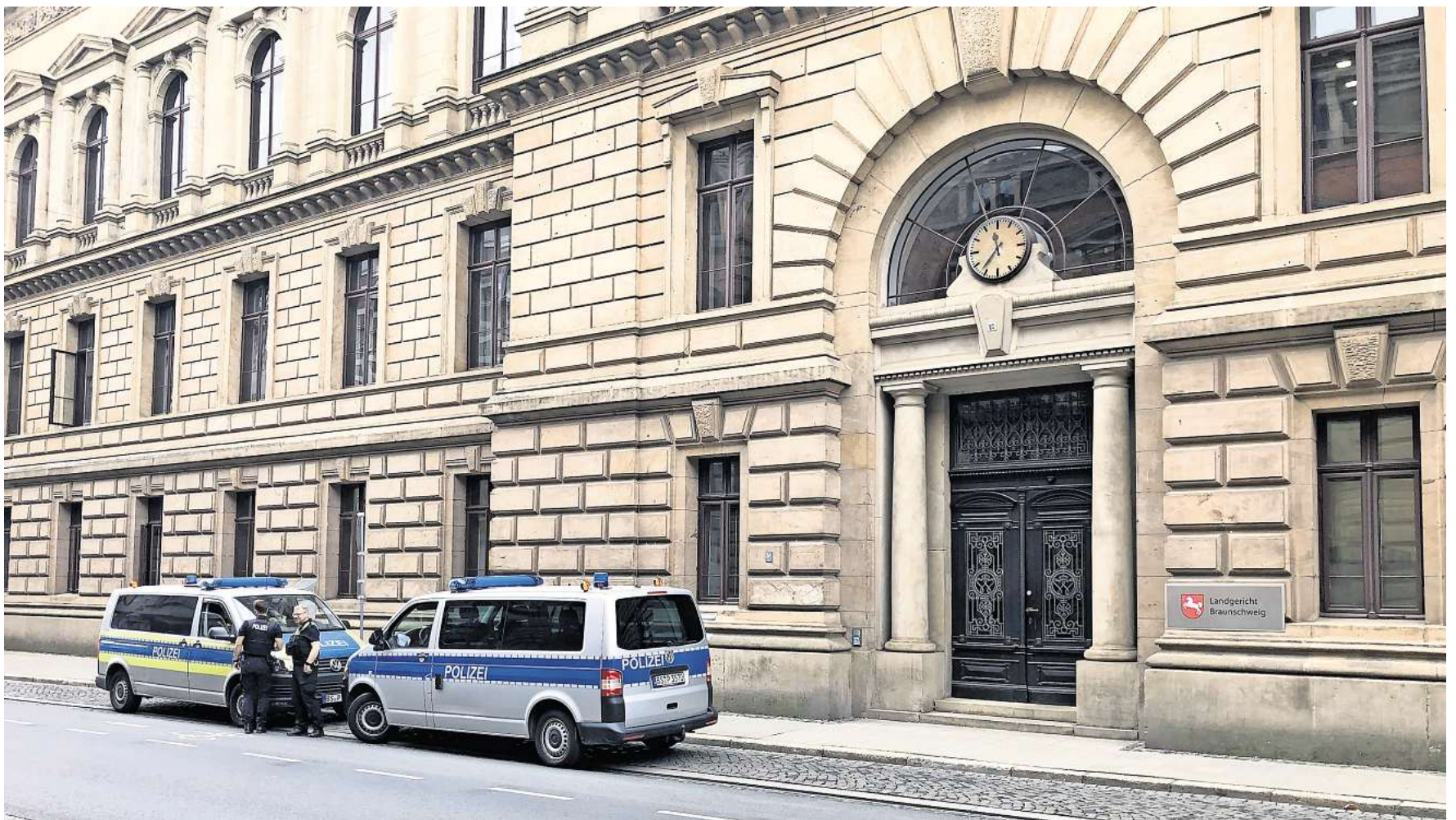
Am Landgericht Braunschweig wurde ein 22-Jähriger verurteilt: Er hat in Wolfsburg unter anderem einen Studenten mit einem spitzen Gegenstand verletzt.

Das Urteil sei in Ordnung, sagte der Verteidiger zur WAZ. Er werde einen Antrag zur Änderung der Vollstreckungsreihenfolge stellen und parallel einen Antrag zur Drogentherapie: „Mit der Strafe hat der junge Mann eine Perspektive.“