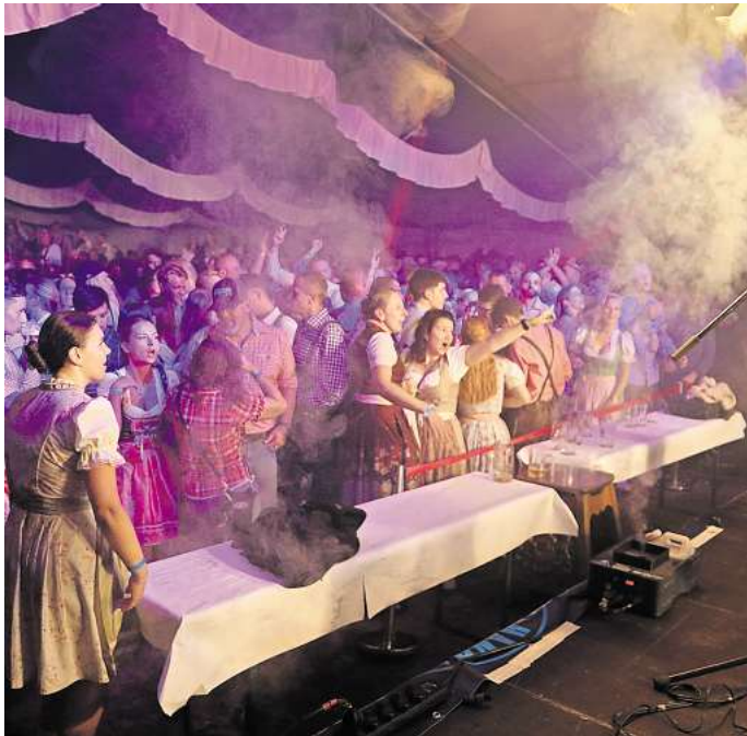
Kartenvorverkauf startet: Das Fallersleber Oktoberfest mit der Band „Members“ steigt am 14. September.

Im Zelt rockt wieder die erfahrene Hausband „Members“, die unter anderem bei den Cannstatter Wasen in Stuttgart auftritt. „Die wird von den Gäs-