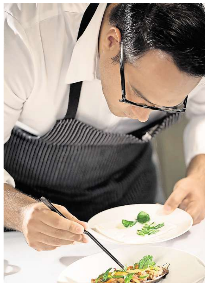
Blick in Hotel-Küche: In der Gastronomie-Branche sowie in der Pflege werden Fachkräfte dringend gebraucht.