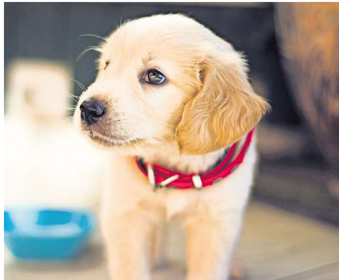
Der richtige Zeitpunkt, einen Welpen auf „Junior“- oder Adult“-Futter umzustellen, hängt von der Rasse ab.

Tatsächlich sind Welpen auf hochwertiges und nahrhaftes Futter angewiesen, damit aus ihnen gesunde und kräftige Hunde