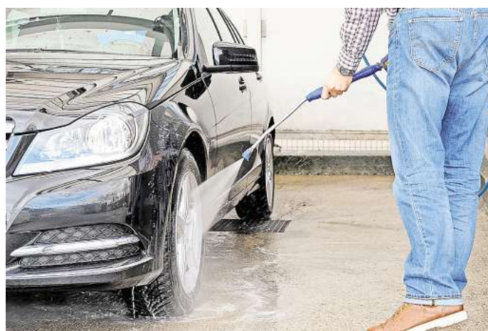
Wer nicht in die Waschanlage fahren will, kann sein Auto auch selbst waschen. Doch Vorsicht: Das Auto privat zu waschen, ist an vielen Stellen nicht erlaubt.

Gilt am Wohnort ein Waschverbot, bleibt Autobesitzern nur die Waschanlage oder eine SB-Waschbox, um ihren Wagen zu säubern. Viele schätzen vor allem den Komfort der automatischen Wäsche in einer Anlage. Doch ist das Fahrzeug anschließend nicht nur blitzblank, sondern auch beschädigt, ist das ärgerlich. „Sind beispielsweise Kratzer im Lack oder ist ein Außenspiegel abgerissen, haftet nicht automatisch der Waschanlagenbetreiber“, so die Juristin. „Er ist nur für Schäden verantwortlich, die nachweislich durch den Waschvorgang entstanden sind.“ Betreiber sind dazu verpflichtet, das Risiko für Beschädigungen so gering wie möglich zu halten. Das bedeutet, sie müssen dafür sorgen, dass alle Sicherheitsstandards eingehalten werden und die Technik auf dem neusten Stand ist. Außerdem müssen sie ihre Kunden über die Benutzung der Anlage und eventuelle Gefahren informieren. „Details zur Haftung legen meist die Allgemeinen Geschäftsbedin-