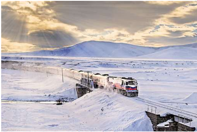
Der Dogu Express von Ankara nach Kars ist eine der bekanntesten und schönsten Zugstrecken der Türkei.

Weitere interessante Haltepunkte des Doğu Express sind unter anderem Erzurum, wo je nach Jahreszeit Skifahren, Wandern oder Rafting auf dem Pro-