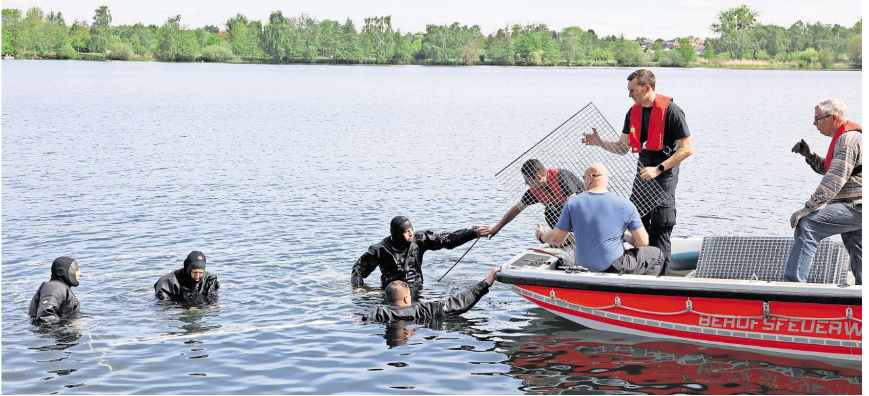
Gemeinschaftsprojekt: Tauchclub und Berufsfeuerwehr versenken die Unterwasserplattform im Allersee.