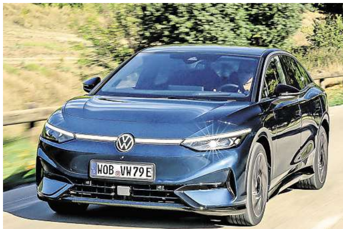
Prestigeerfolg: Der ID.7 von Volkswagen hat beim ADAC-Autotest die Note „Sehr gut“ erreicht.