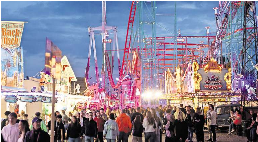
Volks- und Schützenfest in Wolfsburg: Der Festplatz im Allerpark war stets gut gefüllt.

Von den Ausstellern hat Bronsnyk nur positive Rückmeldungen bekommen: „Die sind alle durchweg zufrieden. Auch von vielen Besuchern haben wir positive Stimmen gehört.“ Die Geschäfte auf dem Festplatz waren dieses Mal etwas anders gestellt und die Gänge deutlich breiter. Bei den Kinderfahrgeschäften gab es Freiräume, um sich außerhalb des Besucherstroms aufzuhalten. Beson-