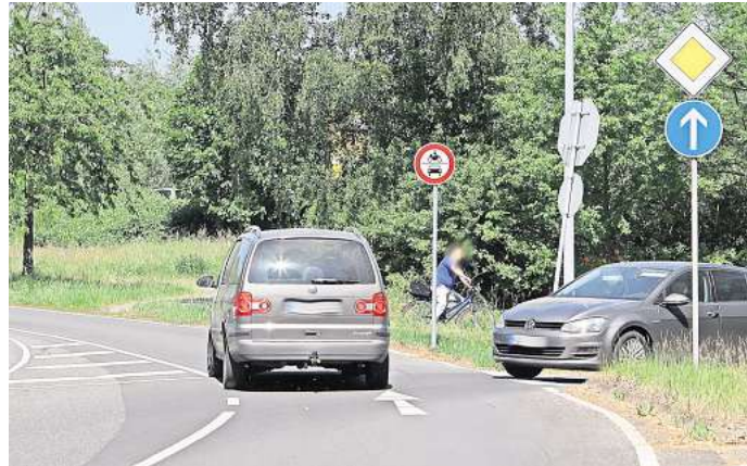
Verboten: Die Durchfahrt in Richtung „Breiter Föhrd“ ist für Kraftfahrzeuge nun tabu.

Schon im Januar 2020 forderten CDU, SPD und PUG in einem Antrag, das Linksabbiegen in den Ort zu unterbinden. Neben der VW Academy befindet sich die Einmündung zur Straße „Breiter Föhrd“. Diese Straße führt direkt durch Käs-