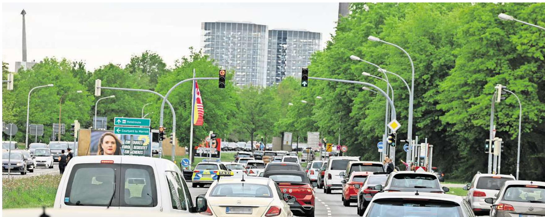
Verkehrschao: An Tagen von Großveranstaltungen gibt es in Wolfsburg lange Staus. Experten meinen, man könnte sie verhindern.