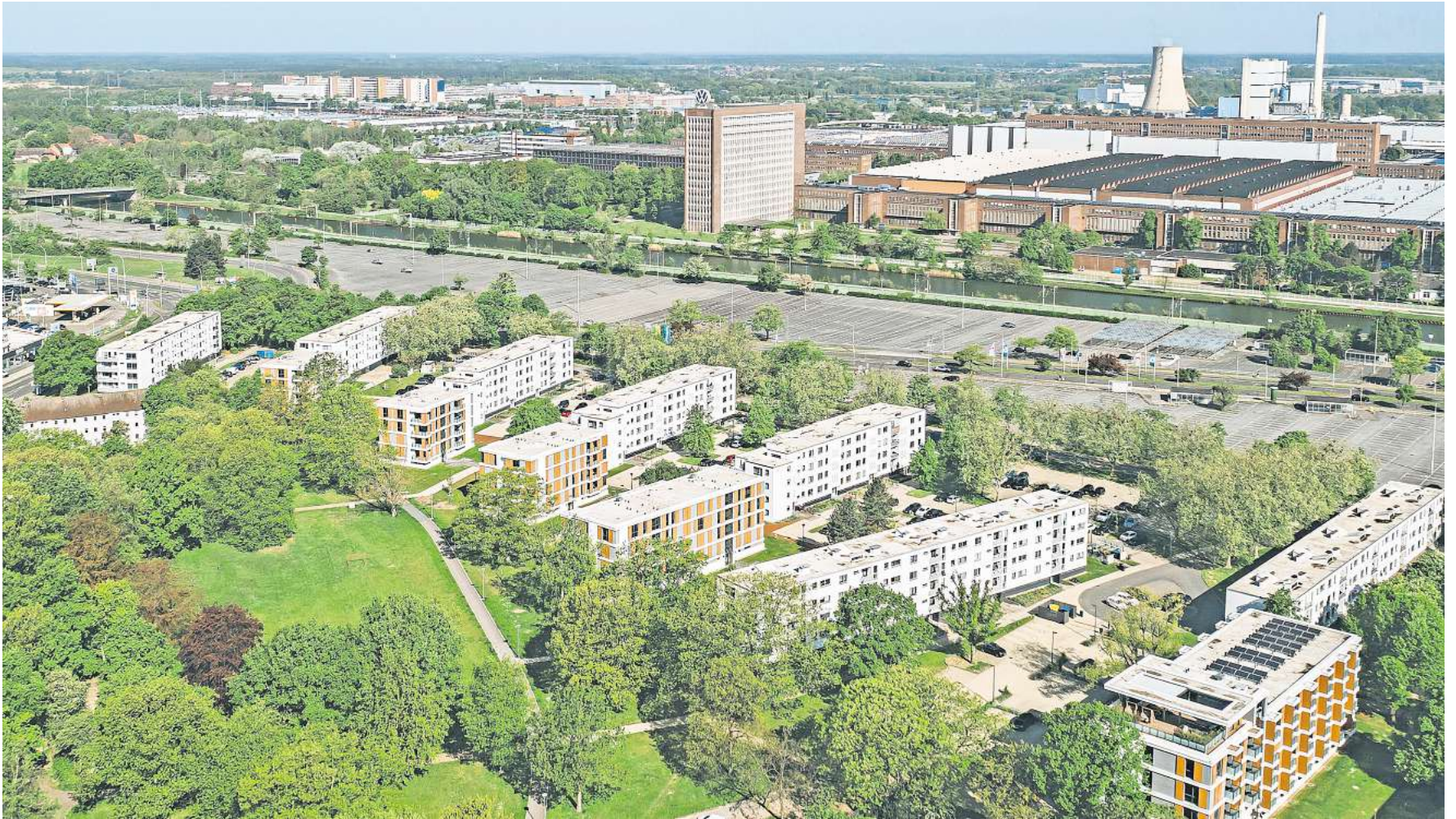
Luftbild vom Quartier Wellekamp: Die neuen Mehrfamilienhäuser und das Space ergänzen die Bestandsgebäude aus den 1960er-Jahren.