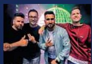
AFTER-WORK-PARTY DJ ALLSTARS Donnerstag, 04. Juli