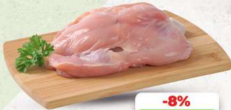
Hähnchenschenkel aufgelöst ohne Knochen an unserer Frischetheke je 1 kg