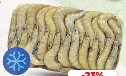
Garnelen Equador mit Kopf & Schale 30/40 tiefgefroren je 1 kg