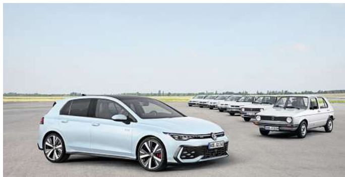
Das Facelift des Golf VIII: Er soll bis Ende des Jahrzehnts vom Golf IX abgelöst werden.

Wann genau der Elektro-Golf auf den Markt kommen soll, ließ Schäfer offen. Medien spekulieren, dass der neue Golf auf der kommenden Fahrzeugplattform SSP (Scalable Systems Platform) gebaut werde, die nicht vor 2028 an den Start gehe. Innerhalb des Konzerns rechne man Insidern