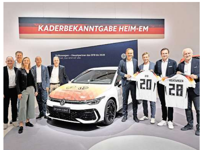
Verlängerung: Volkswagen bleibt für vier weitere Jahre Hauptpartner des DFB.