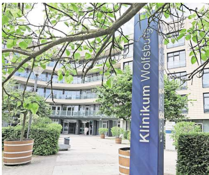
Die Patienten sind mit der Behandlung im Wolfsburger Klinikum zufrieden. Einige kritisierten aber ihre Behandlung in der Notaufnahme.

Die meisten Beschwerden gab es aufgrund der Behandlungsqualität (20 Prozent), auch rüg-