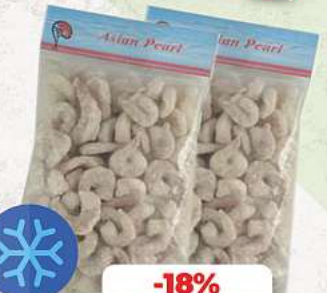
Garnelen geschält und entdarmt tiefgefroren, 750g (1 kg = 18,68*)