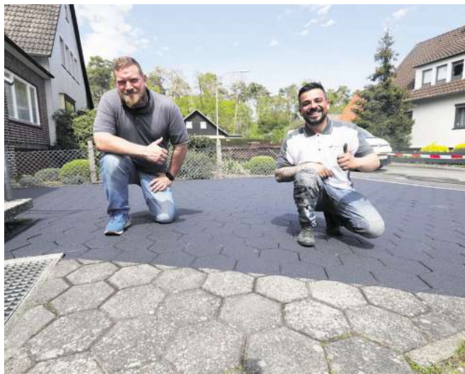
Eine mit dem „Steinfresh“-Verfahren sanierte Pflasterung. Das geniale Pflegesystem verhindert Flechten und Schwarzalgen.