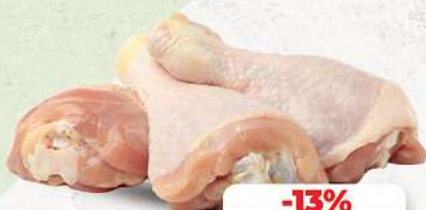
Hähnchenschenkel mit Knochen an unserer Frischetheke je 1 kg