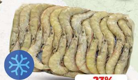
Garnelen Equador mit Kopf & Schale 30/40 tiefgefroren je 1 kg