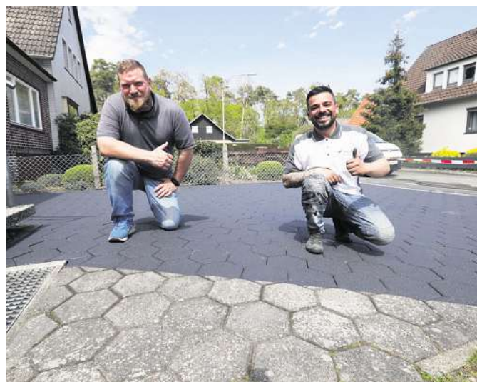
Eine mit dem „Steinfresh“-Verfahren sanierte Pflasterung. Das geniale Pflegesystem verhindert Flechten und Schwarzalgen.