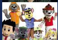
PAW PATROL UNITED KIDS FOUNDATIONS- FAMILIENTAG Sonntag, 07. Juli