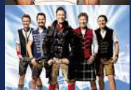
KÖNIGLICH BAYERISCHES VOLL- SINGERENSEMBLE "SOMMER WIES'N" Dienstag, 09. Juli