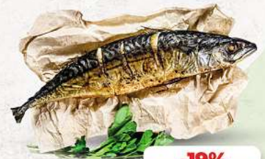
Makrele heiß geräuchert an unserer Frischetheke je 1 kg

PUTENOBBERKEULE | SCHWEINENACKEN HAUSGEMACHT MARINIERT