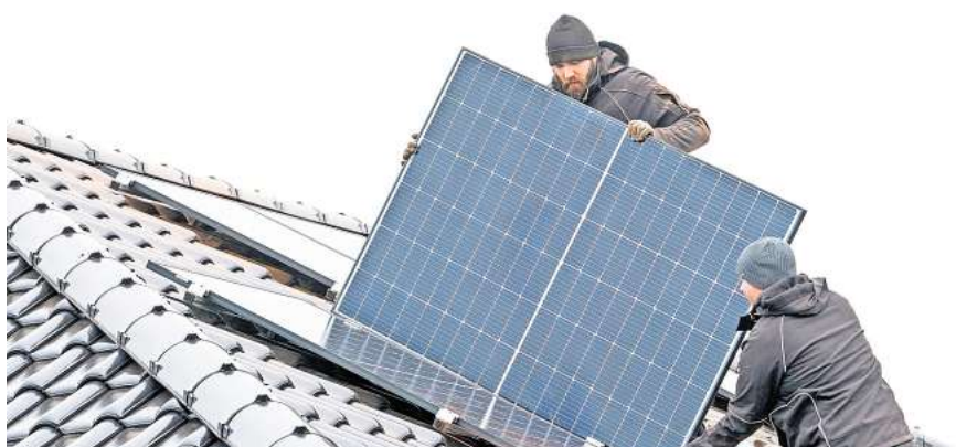
Gute Resonanz auf das Photovoltaik-Förderprogramm: Mehr als 180 Wolfsburger erhalten von der Stadt Wolfsburg einen Zuschuss für ihre PV-Anlage.

Während des gesamten Antragszeitraums gab es seitens der Stadtverwaltung keine technischen oder IT-Probleme, was zu einem reibungslosen Ablauf des Verfahrens führte.