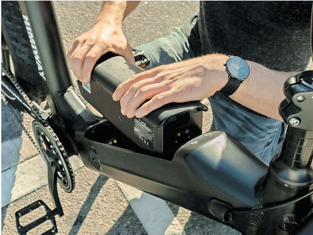
Um den Zustand des Akkus, dessen Kapazität mit der Zeit weniger wird, zu bewerten, können im Fachhandel die jeweiligen Fabrikate ausgelesen werden.

Beim Kauf vor Ort bei Privatleuten gibt es keine Versandkosten. Allerdings ist es schwierig, den Zustand eines E-Bikes selbst zu bewerten. Während der Gesamtzustand noch mit Blick auf Reifen, Bremsbeläge, Kette oder Antriebsriemen und Rahmen zu beurteilen ist, gestaltet sich das