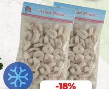
Garnelen geschält und entdarmt tiefgefroren, 750g (1 kg = 18,68*)