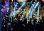
LADIES NIGHT GOODFELLAS Donnerstag, 11. Juli