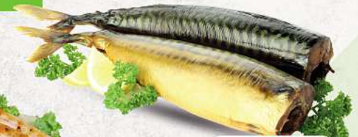
Makrele ohne Kopf, kalt geräuchert an unserer Frischetheke je 1 kg

HÄHNCHENSCHENKEL | SCHWEINEBAUCH | SCHWEINENACKEN HAUSGEMACHT MARINIERT