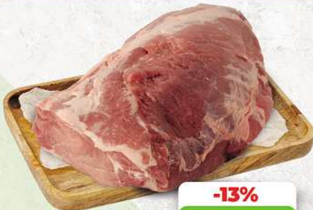
Schweinenacken ohne Knochen an unserer Frischetheke je 1 kg

Herkunftsnachweise von unseren Produkten - siehe Etikettierung