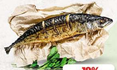
Makrele heiß geräuchert an unserer Frischetheke je 1 kg

PUTENOBBERKEULE | SCHWEINENACKEN HAUSGEMACHT MARINIERT