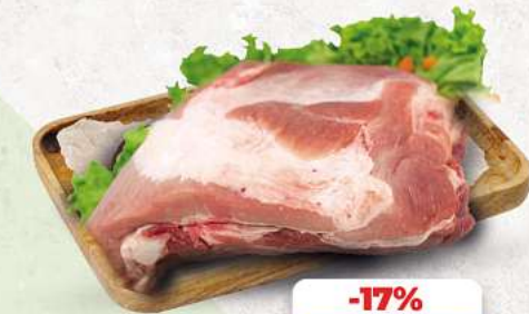
Dicke Rippe vom Schwein an unserer Frischetheke je 1 kg

Herkunftsnachweise von unseren Produkten - siehe Etikettierung