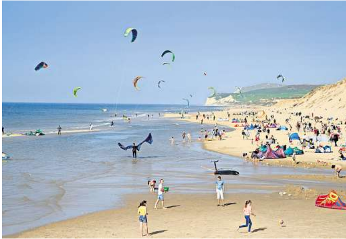
Die Opalküste bietet Traumstrände und tolle Wassersportbedingungen. Und das ist nicht alles.

Beeindruckend ist auch eine Wanderung in der etwa 60 Kilometer entfernten Naturlandschaft beim Cap Blanc Nez. Zwischen den 134 Meter hohen Steilklippen, die sich hier dem Ärmelkanal entgegenstemmen,