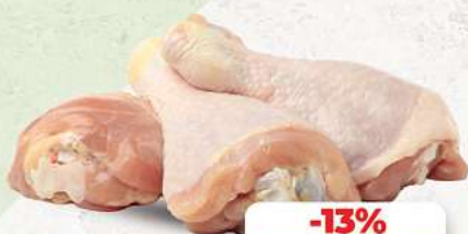
Hähnchenschenkel mit Knochen an unserer Frischetheke je 1 kg