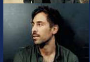
MAX GIESINGER SOMMERTOUR 2024 Samstag, 06. Juli