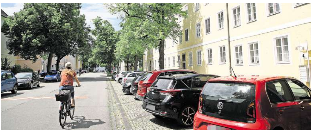
Mietwohnungen der Neuland in der Bebelstraße.