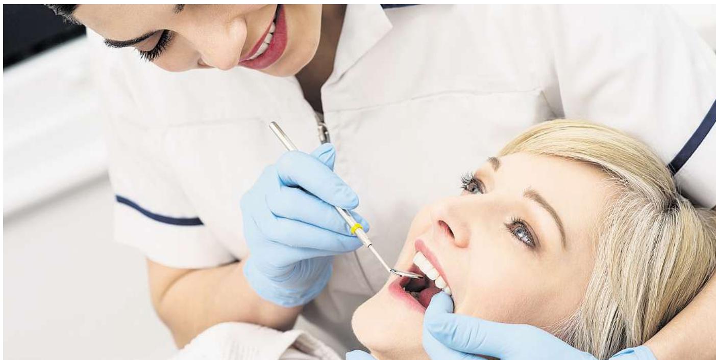
Mit einem Protesttag wollen die Zahnärzte auf ihre Situation aufmerksam machen.