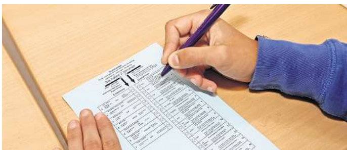
Am 9. Juni ist Europawahl: Wissen Sie schon, wen Sie wählen werden?

Wir würden in diesem Zusammenhang gerne von Ihnen wissen: Haben Sie sich schon entschieden, wen Sie am 9. Juni wählen werden? Oder sind Sie noch unentschieden und nutzen Entscheidungshilfen wie den Wahl-O-Mat? Machen Sie mit bei unserer Umfrage und sichern sich die Chance auf einen 50-Euro-Gutschein von Media-Markt. Was Sie dafür tun müs-