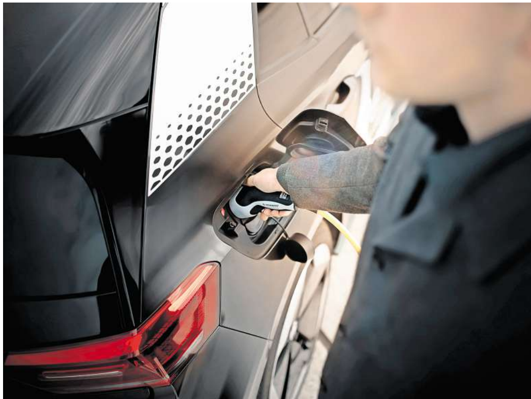
Mit bidirektionalem Laden kann ein E-Auto Strom speichern und wieder abgeben.

„Bidirektionales Laden wird in Zukunft ein attraktives Zusatzangebot für die Nutzerinnen und Nutzer von Elektroautos sein: Das eigene Auto wird damit zum Stromspeicher – zuerst für den Verbrauch im eigenen Zuhause und in Zukunft auch für die Rückspeisung ins Stromnetz.“