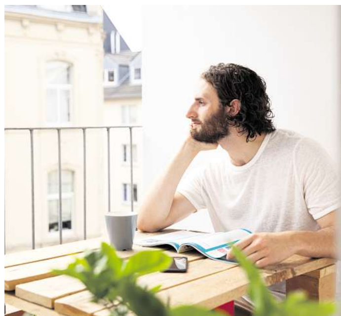
Geranien pflanzen, Wäsche trocknen, grillen: Was ist Mietern auf ihrem Balkon erlaubt? Und wofür brauchen sie das Einverständnis ihres Vermieters?

aus Umwelt- oder Kostengründen eine Solaranlage auf dem Balkon zu installieren. Sogenannte Stecker-Solargeräte können Strom für den Eigenbedarf produzieren und einige Städte und Kommunen bezuschussen eine Anschaffung sogar. „Mieter müssen ihren Vermieter vor dem Aufstellen eines solchen Balkonkraftwerks um Erlaubnis fragen“, so Brandl. Aber: „Ist die Montage baurechtlich zulässig, stört die Anlage optisch nicht, ist fachmännisch installiert, leicht zurückbaubar und besteht keine Brandgefahr, darf der Vermieter die Anlage nach einem Urteil des Amtsgerichts Stuttgart nur aus einem triftigen und sachlichen Grund ablehnen.“