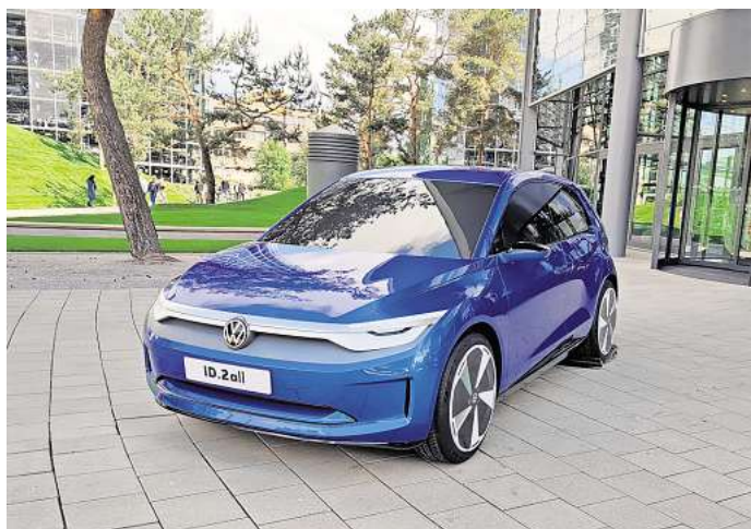
Hingucker in der Autostadt: Die AZ/WAZ erwischt den ID.2all am Kunden-Center – der ID.1 soll ein ähnliches Design bekommen.