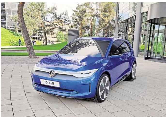
Hingucker in der Autostadt: Die AZ/WAZ erwischt den ID.2all am Kunden-Center – der ID.1 soll ein ähnliches Design bekommen.