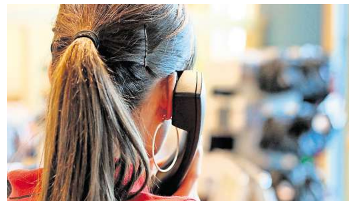
Unseriöse Anrufe: Unbekannte geben Wolfsburgern vor, im Namen der LSW neue Stromverträge anzubieten.