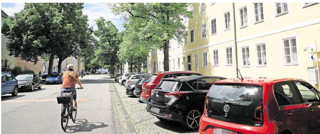
Mietwohnungen der Neuland in der Bebelstraße.