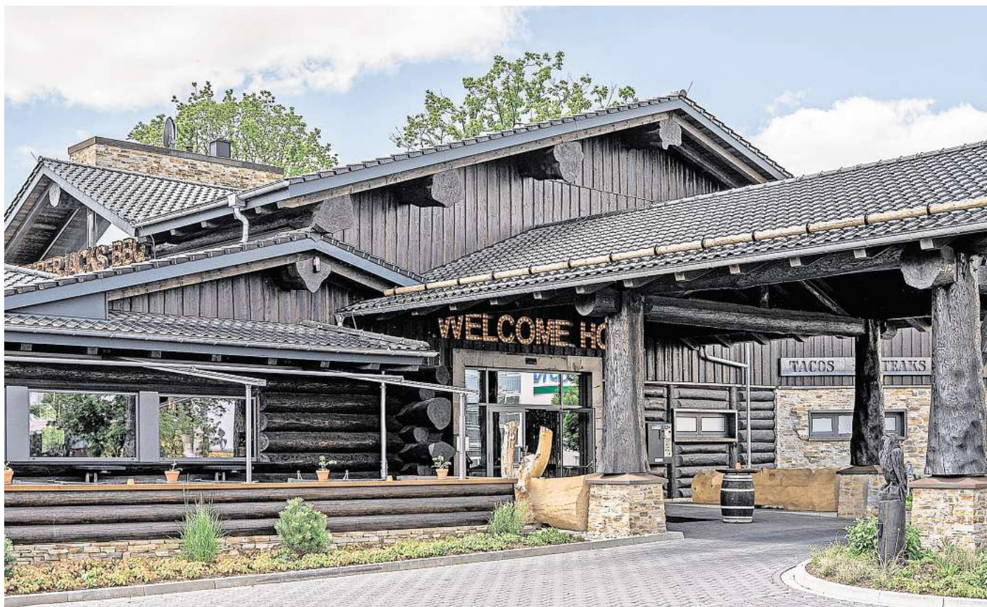
Das „Timberjacks BBQ Restaurant“ wird in Wolfsburg eröffnet.

Damit könnte das Wolfsburger Timberjacks bald die ersten Speisen und Getränke servieren. Das Restaurant im amerikanischen Stil soll auf einer Fläche von 7.500 Quadratmeter im Gewerbegebiet Westerlinge entstehen. Laut Planung sollen 260 Gäste im Innenbereich und 180 Gäste im Außenbereich Platz finden. Das Konzept soll unter dem Motto „Beef, Beer und BBQ“ neben Speisen und Getränken auch Highlights wie Bullenreiten, Live-Musik und eine Cocktail-Bar bereithalten. Dazu soll es eine LED-Leinwand und einen Kamin geben. Das Unternehmen plant, etwa 60 neue Mitarbeiter am Stand-