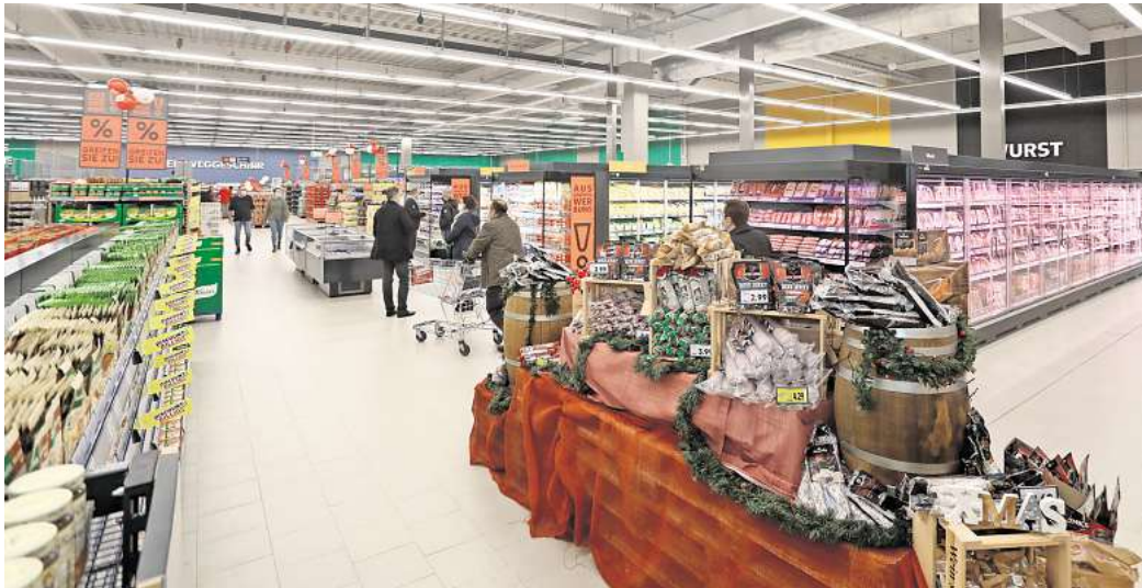
Steigende Preise bei Lebensmitteln: Sahra Wagenknecht sieht darin ein deutliches Versagen der Ampel-Regierung.

Sie fordert daher einen „Supermarktgipfel im Kanzleramt, der die Handelsketten zu deutlichen Preissenkungen auf Vorkriegsniveau“ auffordern solle.