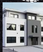
Fenster & Rollläden Schiebeanlagen Faltanlagen

V. Gloger Direktförderung ohne komplizierte Antragstellung auf alle Produkte