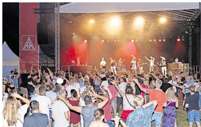
Tagsüber Familien-Programm, abends Konzert-Feeling: In diesem Jahr wird Zoe Wees der Hauptact beim Sommerfest der IG Metall sein.

Als Hauptact des Abends wird die international bekannte Sängerin Zoe Wees auftreten und das Publikum mit ihrer kraftvollen Stimme und ihren emotionalen Songs begeistern. Zoe Wees wurde bekannt durch ihre Debütsingle „Control“, die mit über drei Milliarden Streams in mehr als 20 Ländern Gold- und Platinstatus erreichte. „Mit dem Familien-