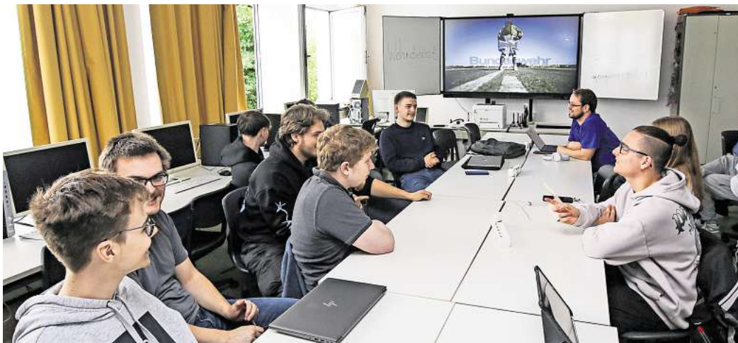
Wolfsburger Schüler diskutieren über die neuen Pläne zur Wehrpflicht bei der Bundeswehr.

Insgesamt sollen 52 Prozent der Befragten der Forsa-Umfrage für einen verpflichtenden Dienst bei der Bundeswehr gewesen sein. 43 Prozent äußerten sich dagegen, fünf Prozent hatten keine Meinung zu einer Wiedereinführung der Wehrpflicht. Unter dem damaligen Verteidigungsminister Karl-Theodor zu Guttenberg (CSU) war die Wehrpflicht in Deutschland im Juli 2011 ausgesetzt worden. Abgeschafft ist die Wehrpflicht nicht, dennoch bedeutete die Entscheidung nach 55 Jahren das zwischenzeitliche Ende des Wehr- und Zivildienstes. Alle nötigen Strukturen wurden im Vorfeld aufgelöst, obwohl die Wehrpflicht im Spannungs- und Verteidigungsfall wieder auflebt. Um die Verteidigungsfähigkeit zu stärken, soll die Bundeswehr an Rekruten gewinnen. Die Frage, ob die aktuellen Vorstellungen für den geforderten Zuwachs ausreichen, bleibt zunächst offen. Der Plan des Verteidigungsministers muss erst durch ein entsprechendes Gesetz verabschiedet werden.