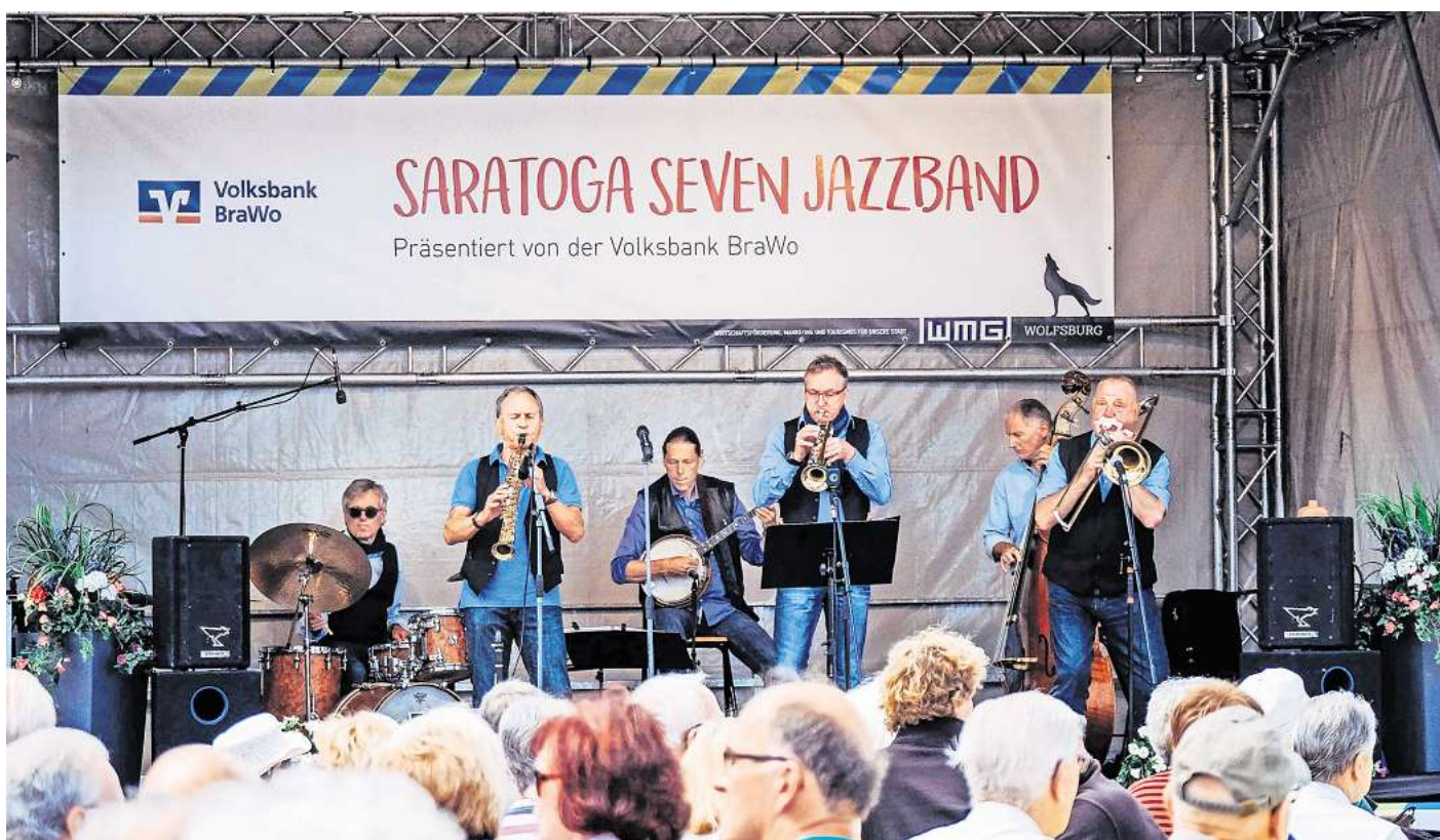
Freut sich schon auf ihren Auftritt: Die Saratoga Seven Jazzband spielt am kommenden Samstag zum Auftakt der diesjährigen „Jazz & more“-Reihe in Wolfsburg.