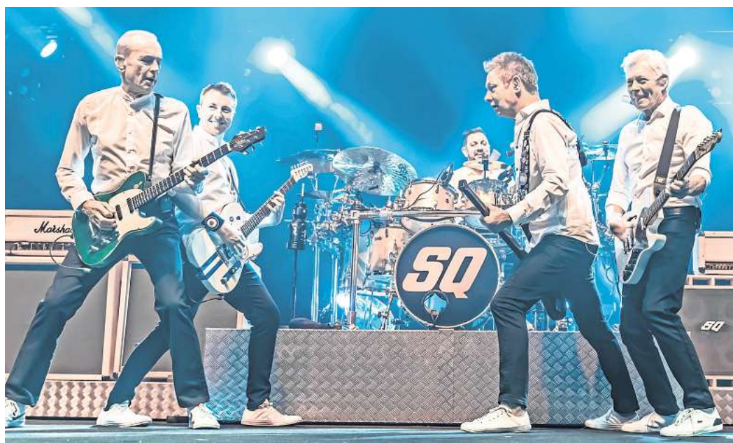
„Status Quo“ kommt nach Wolfsburg. Sänger und Gitarrist Francis Rossi (l.) ist das letzte verbliebene Gründungsmitglied.

Nein, ich verfolge Fußball nicht besonders. Wenn ich es einrichten kann, schaue ich mir Spiele der Engländer an. Leider verliert England oft bei Turnieren – sie sind überzeugt, zu verlieren. Das ist der Unterschied zu den südamerikanischen Mannschaften. Die sind überzeugt davon zu gewinnen, und das tun sie auch. Aber gute Mannschaften sind sicherlich auch Holland, Frankreich, Deutschland oder Spanien.