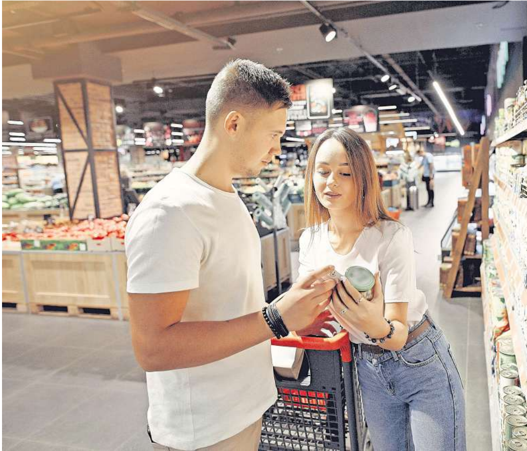
Ein Vorbild auch für Deutschland? In Frankreich schützt ein neues Gesetz Verbraucher vor Mogelpackungen. Ab dem 1. Juli müssen „Shrinkflation“-Produkte gekennzeichnet sein.

In Frankreich macht die Regierung jetzt Ernst. Große und mittelgroße Geschäfte müssen bald kenntlich machen, ob ein Nahrungsmittelprodukt von „Shrinkflation“ betroffen ist. Nimmt die Menge ab und der Preis bleibt unverändert oder steigt, muss in der Nähe des Produkts beispielsweise ein Plakat