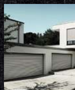
Garagentore Deckenlauffore Kastenrolltore