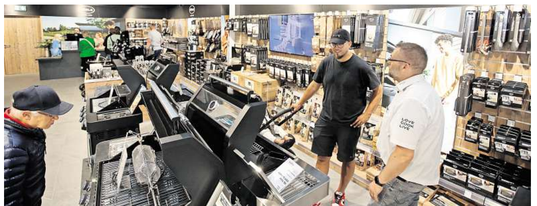
In dieser Woche hat Rösle ein neues Geschäft im DOW eröffnet.

Dabei soll es aber nicht bleiben. Weitere Geschäfte sollen in den Designer Outlets eröffnen und derzeitiger Leerstand aufgefüllt