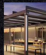
Terrassen- überdachungen Glasoasen Markisen