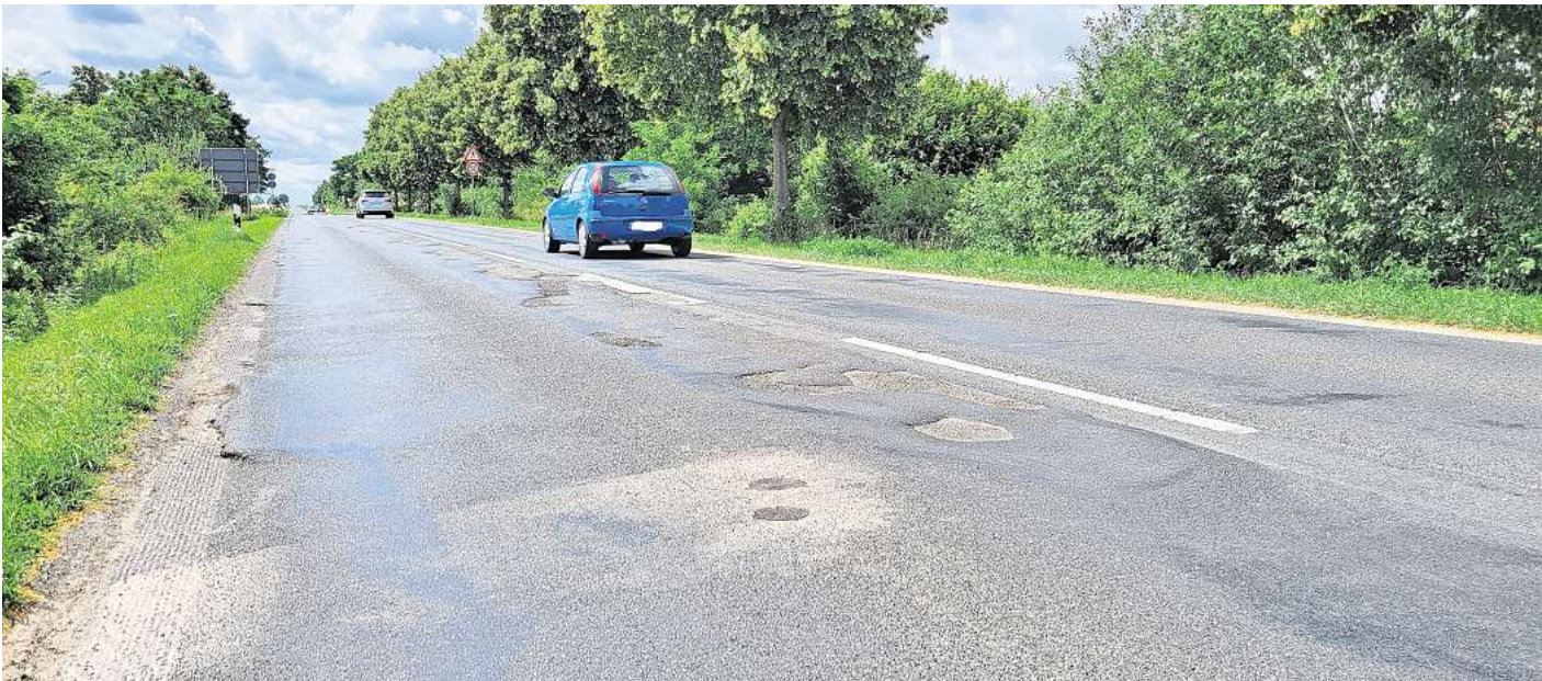
Die Landesstraße 290 weist zwischen Hehlingen und Reislingen eine hohe Zahl schadhafte Stellen im Asphalt auf.

Ein weiterer entscheidender Punkt bei der Frage der Instandsetzung der L290 ist die Baustelle auf der Nordsteimker Straße. Solange die Landesstraße als Umleitungsstrecke für den Verkehr dient, der über die Reislinger und die Dieselstraße