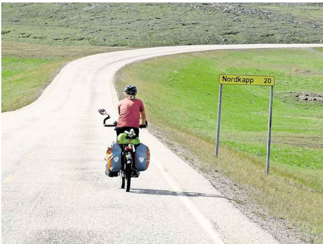
Aktivurlaub oder Strand-Erholung: Welcher Urlaubstyp sind Sie?

Jeder Urlaubstyp ist anders – wir würden gerne von Ihnen wissen, wie Sie Ihre freie Zeit am liebsten verbringen. Bevorzugen Sie den Aktivurlaub und powern sich gerne aus? Steht für Sie das Kennenlernen anderer Kulturen im Vordergrund oder zählt vor allem die Entspannung fernab des Alltags? Machen Sie mit bei unserer Umfrage und gewinnen Sie einen Gutschein von Media Markt.