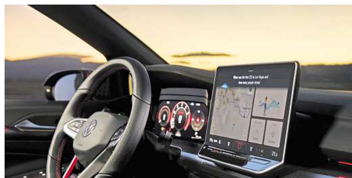
Eine Neuerung: Volkswagen setzt bei seinen Modellen auf die Nutzung von ChatGPT. Die Künstliche Intelligenz kommt in einigen Modellen zum Einsatz.

Laut Volkswagen erhält der Chatbot auch keinen Zugriff auf die Fahrzeugdaten. Außerdem würden Fragen und Antworten im Sinne des Datenschutzes umgehend wieder gelöscht. Wer den Online-Sprachassistenten nicht nutzen will, kann außerdem in den Privatsphäre-Einstellungen im Infotainment diesen jederzeit deaktivieren.