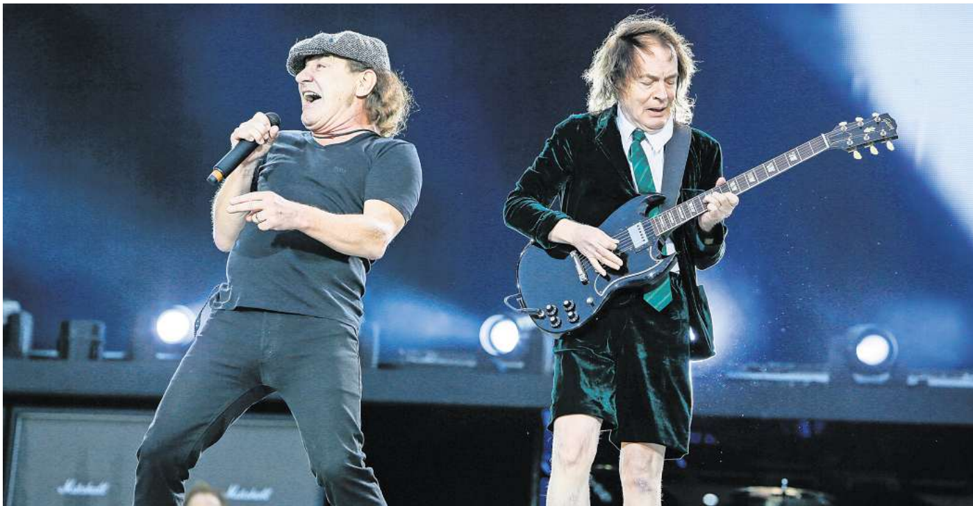
Vor neun Jahren: 2015 haben AC/DC ebenfalls auf dem Messegelände in Hannover gespielt. Hier rocken Brian Johnson (links) und Angus Young die Bühne.

Das bedeutet auch: Mit dem zweiten Termin am 4. August in Hannover feiert die Hardrock-Band um Kultgitarrist Angus Young in Hannover nach elf Konzerten ihr Deutschland-Finale. Die beiden Konzerte in Hannover werden die einzigen AC/DC-Shows in Norddeutschland im Rahmen der „Power up“-Tour sein – neun Jahre nach