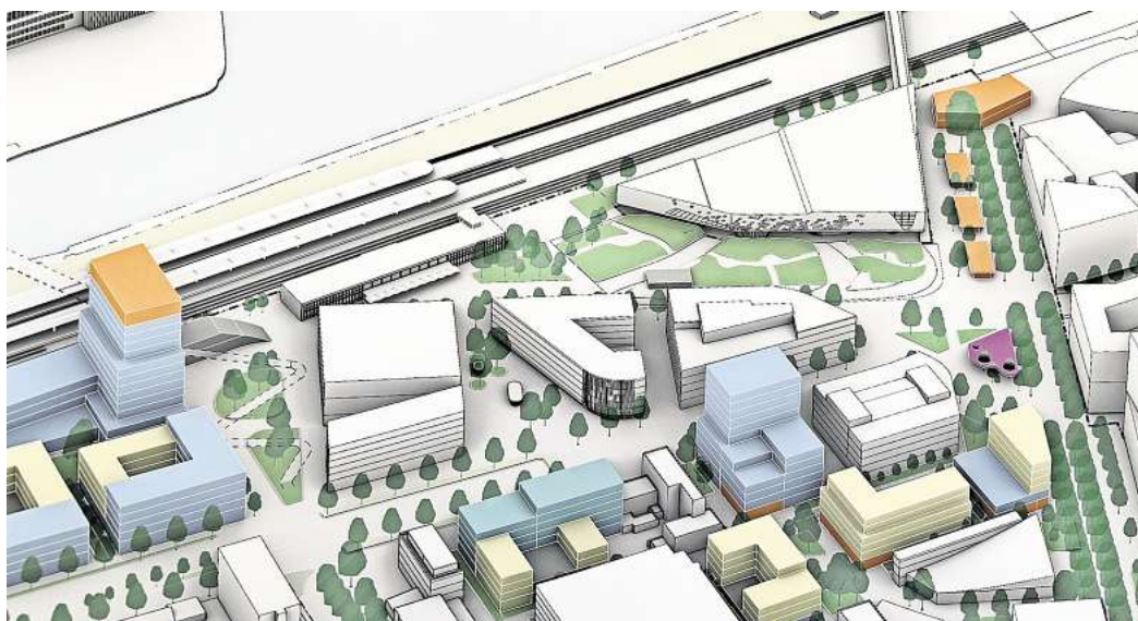
„Drehscheibe“: Die Variante 2 bildet die Grundlage für die Planungen am Nordkopf.

In den kommenden Wochen werden deshalb noch einmal planerische Anpassungen vorgenommen. Das Votum der Bürgerinnen und Bürger fließt dabei ebenso ein wie die Rückmeldung von Politik, Verwaltung, hiesigem Handel, Anliegerinnen und Anliegern. Außerdem Anregungen von externen Fachleuten – darunter Verkehrs-, Landschafts- und Stadtplanern sowie aus Wirtschaft und Handel. Berücksichtigung finden dabei in jedem Fall der Wunsch nach mehr Grün im gesamten Bereich des Nordkopfs sowie eine verbesserte Anbindung des Designer Outlet Wolfsburg (DOW) an