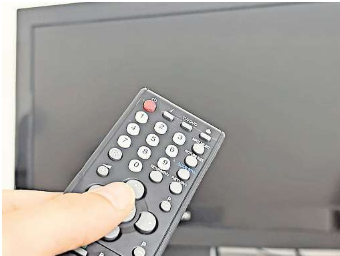
Neuregelung beim Kabelfernsehen: Nutzen Sie die Gelegenheit zum Umstieg auf andere Techniken?

Mieterinnen und Mietern steht ab Sommer die Wahl des