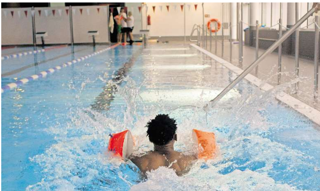
„Schenke ein Lächeln“: Dank der Initiative konnten 16 jugendliche Flüchtlinge Schwimmen lernen.

In den vergangenen Wochen konnten die 16 Jugendlichen in zwei Kursen fleißig im Gifhorner Hallenbad üben. In acht Einheiten zu je 1,5 Stunden Training wurde geschwommen, getaucht, gelernt und gesprungen, bis die