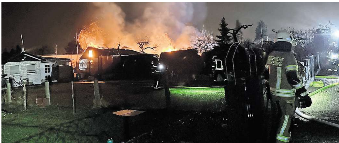
Mehr als ein Dutzend Gartenlauben in Wolfsburg gingen zwischen Ende Dezember und Anfang Februar Feuer. Die Gebäude wurden zerstört oder stark beschädigt. Inzwischen konnte ein Tatverdächtiger ermittelt werden.

Die Ermittler gehen davon aus, dass alle Taten von demselben Täter begangen wurden. Ob es sich bei dem Tatverdächtigen um den tatsächlichen Brandstifter handelt, der zum Jahreswechsel viele Gartenlauben in Brand gesteckt hatte, ist noch offen. „Die Ermittlungen dazu dauern noch an. Es finden weiterhin Zeugenvernehmungen statt“, sagt die Polizeisprecherin. Die Polizei hat in diesem Zusammenhang noch keine Person festgenommen.