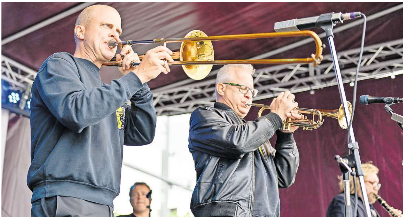
Reist aus Hamburg an: Die Traditional Old Merry Tale Jazzband kennt die Wolfsburger Konzertreihe „Jazz & more“ gut – sie ist von Beginn an dabei.

Ein ergänzendes Catering-Angebot rundet das kostenfreie Konzerterlebnis unter freiem Himmel, das von der WMG veranstaltet wird, ab. Für den Besuch ist keine Voranmeldung oder Reservierung notwendig, es gilt freier Zugang und freie Platzwahl. Ein barrierefreier Zugang ist ebenfalls sichergestellt.