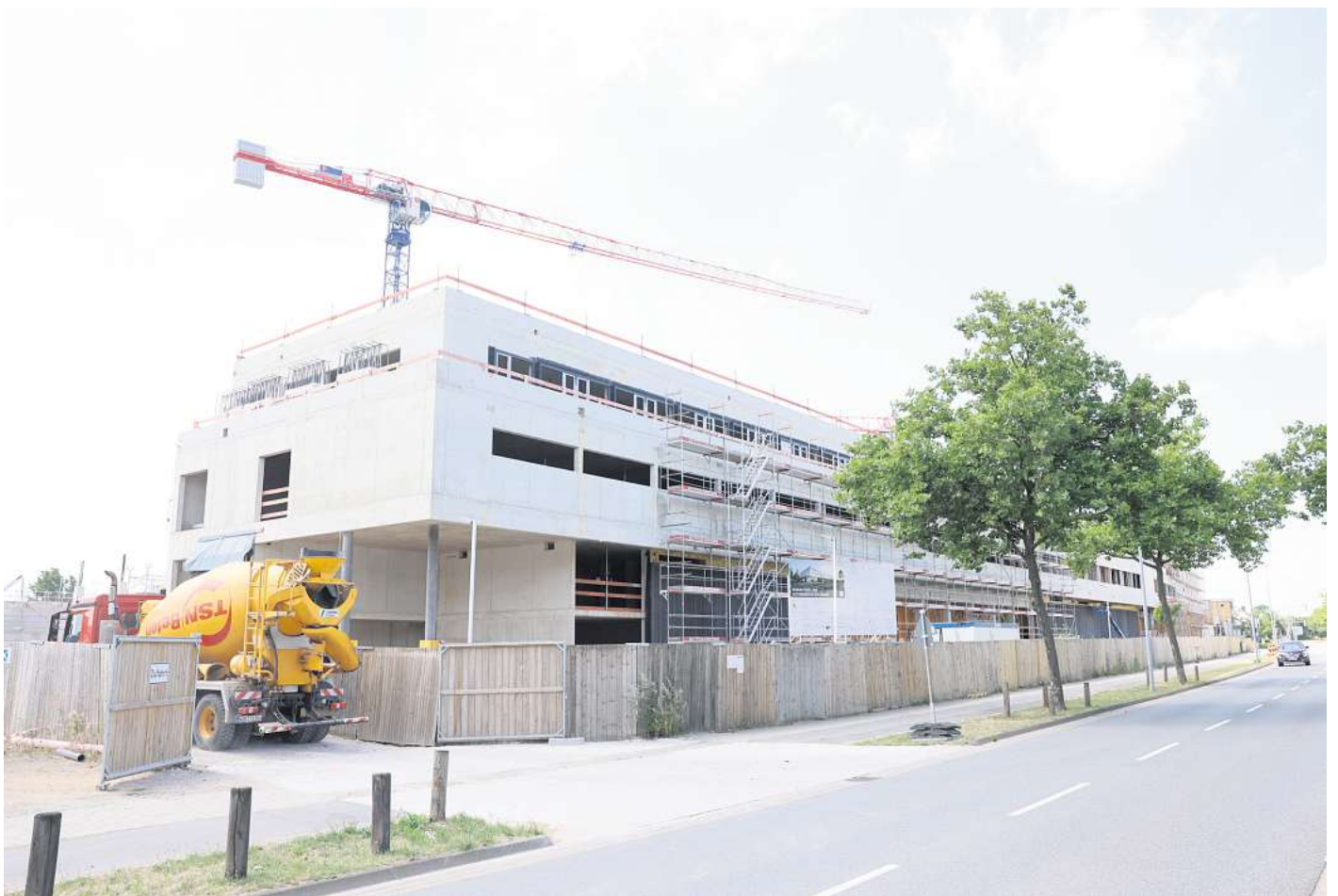
Allmählich sind die gewaltigen Ausmaße der neuen Feuerwache an der Dieselstraße in Wolfsburg zu erkennen.

Der riesige Gebäudekomplex soll genügend Platz bieten für Leitstelle, Werkstätten, eine Atemschutzübungsstrecke sowie Büro-, Ruhe- und Verpflegungsräume für die Mitarbeiter im 24-Stunden Dienst. In einer Multifunktionshalle sollen