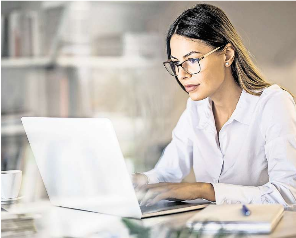
Künstliche Intelligenz (KI) ist heutzutage in vielen Bereichen in unserem Alltag präsent.

Die Digitalisierung hat bereits dazu beigetragen, das tägliche Leben zu vereinfachen. Mit LLMs wie ChatGPT eröffnen sich nun zahlreiche weitere nützliche Alltagshilfen. Viele Schüler und Studenten nutzen die Tech-