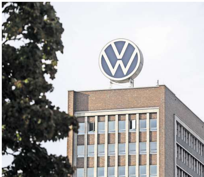
Getrübbte Stimmung: Die Entscheidungen rund um die Dual Studierenden und die Externen der Hochschule 73 werfen bei VW-Beschäftigten Fragen auf.

VW habe viel Geld in die Einarbeitung in die Fachabteilungen und das Studium investiert und nun sei das Geld in den meisten Fällen verloren, da die meisten dualen Studenten nicht ans Band gehen würden. „Auf alle Fälle zerstört VW seine gesamte Reputation im Ausbildungsmarkt. Mein Vertrauen in das Unternehmen hat stark gelitten“, schreibt einer der Betroffenen.