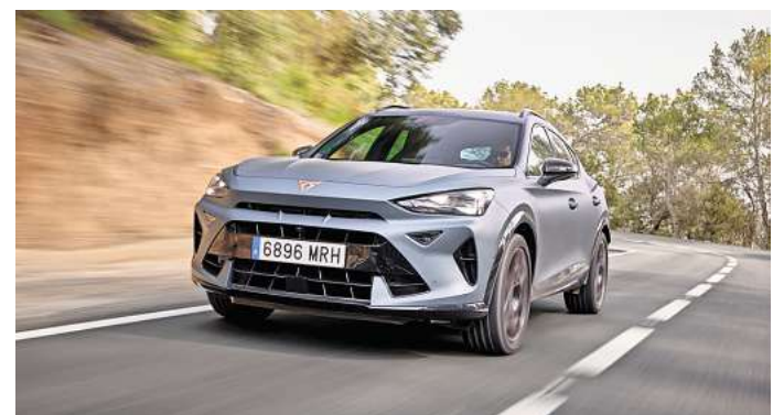
Der wichtigste Cupra: Der Formentor verkörpert die neue Designsprache.

Zurück zu Cupra: die Spanier bringen noch in diesem Jahr mit dem SUV Terramar ein neues Modell mit Verbrenner / Hybrid auf den Markt. Zusammen mit den Updates vom Leon und Formentor erhofft sich Marketingchef Galindo zusätzliche Impulse: „Wir haben eine attraktive neue Angebotsstruktur geschaffen. Sie ist weniger komplex.“ Über die potenzielle Kundenschaft sagt er: „Es sind Leute, die ausdrücken wollen, was sie denken und was sie fühlen.“