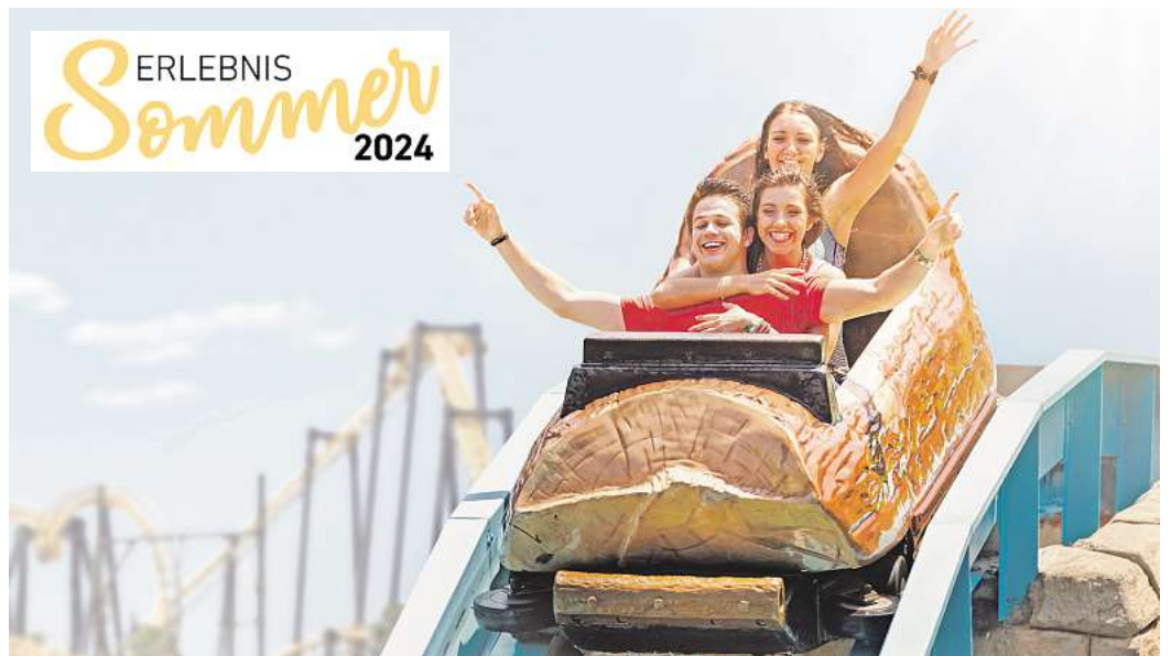
Das Abenteuer ruft, günstige Ticketpreise locken: Der „Erlebnissommer 2024“ bietet erneut jede Menge Freizeitspaß für wenig Geld.

Die Tickets sind (nur solange der Vorrat reicht) online unter www.erlebnissommer-tickets.de erhältlich.