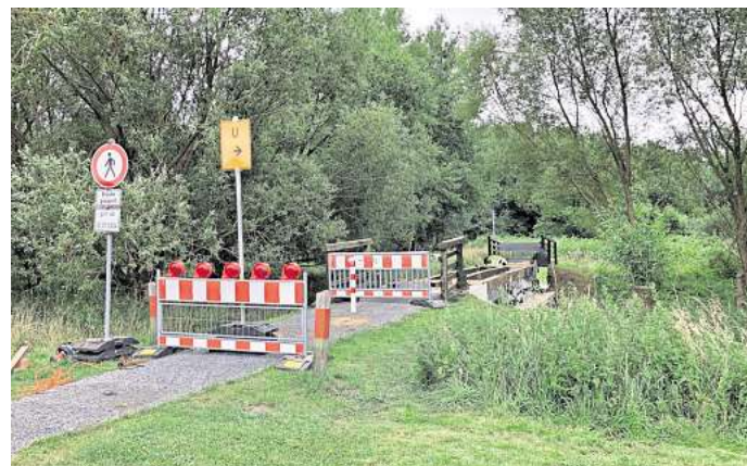
Die Brücke im östlichen Teil des Allerparks ist marode und wird saniert. Eine Umleitung ist ausgeschildert.

Wer aus Richtung Westen an den Sportvereinen am Allerpark vorbeikommt, muss sich bei der Hundefreilauf-Fläche rechts orientieren. Spaziergänger und Radfahrer, die vom Norden kommen und ursprünglich über die gesperrte Brücke wollen, folgen der Umleitung und biegen dann links ab.