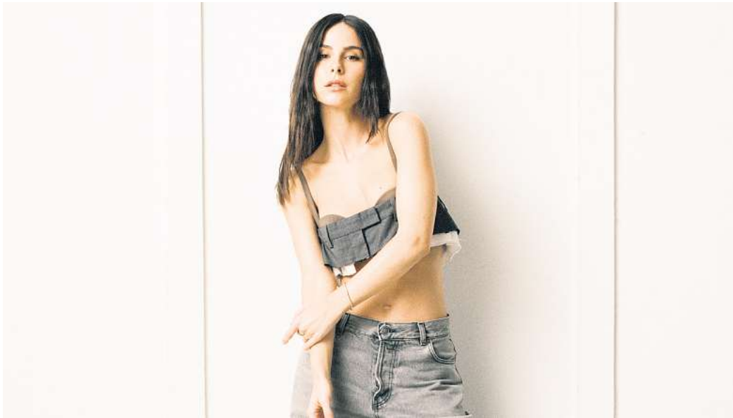
Seien Sie dabei: Lena tritt am 20. Juli in der Autostadt auf. Die AZ/WAZ verlost für das Konzert ein Ticketpaket mit zwei Eintrittskarten.

Zu den Top-Acts, die in diesem Jahr dabei sind, gehört unter anderem Lena. Ihr Konzert steigt am Samstag, 20. Juli, um 20 Uhr auf der Lagunenbühne – und dank der AZ/WAZ kann ein Fan mit einer Begleitperson live und gratis dabei sein. Die deutsche Sängerin Lena Meyer-Landrut, bekannt unter ihrem Künstlernamen Lena, hat seit ihrem Durchbruch beim Eurovision Song Contest 2010 mit ihrem Hit „Satellite“ die Herzen von Millionen Fans weltweit erobert. Mit ihrer ein-