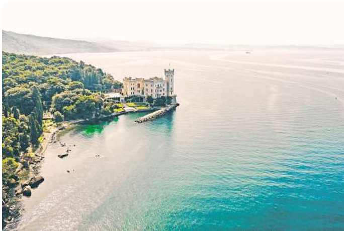
Weiß leuchtend und mit Traumblick auf den Golf von Triest: Das Schloss Miramare.