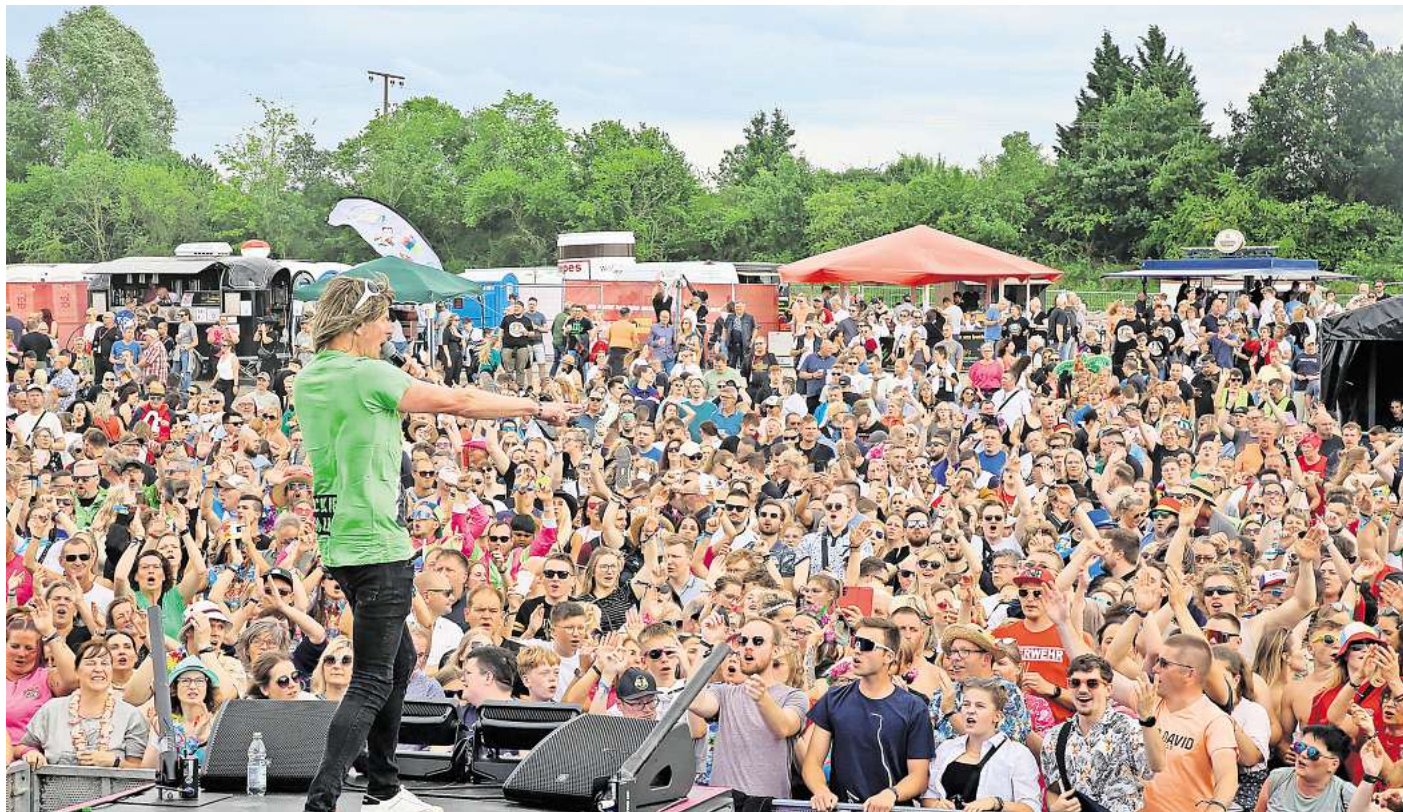
Heizte ein: Mickie Krause war einer der Stars beim KP One Festival in Neindorf. Der zweite Tag war eine Ballermann-Party.