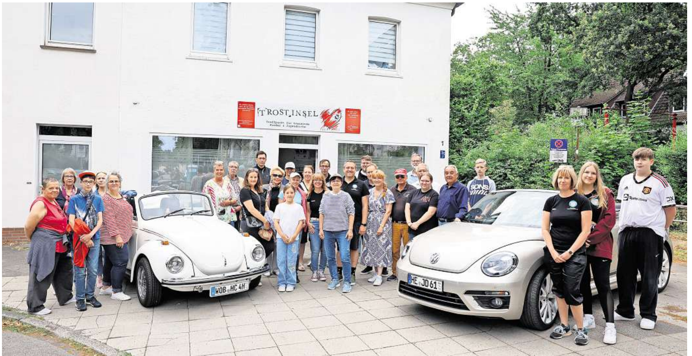
Schöne Ablenkung: Die Mitglieder des 1. Käfer Clubs Wolfsburg und des Beetle Clubs haben die Kinder und Jugendlichen der Trostinsel mit auf eine Cabrio-Spritztour genommen.