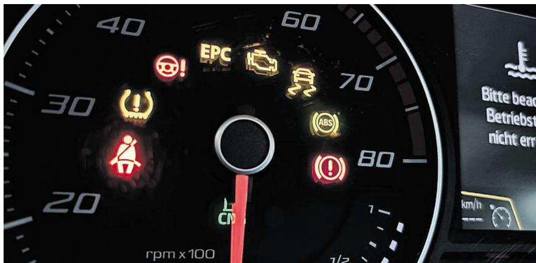
Warnleuchten im Tachometer: Viele Assistenzsysteme sind für Neuwagen in der EU nun Pflicht.