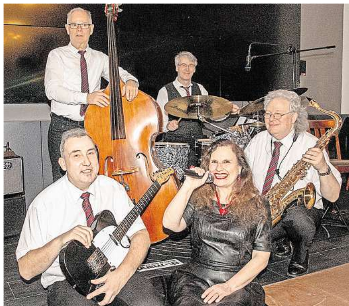
Sind zum ersten Mal bei „Jazz & more“ dabei: „Jazz2Jazz“ spielt Klassiker aus Swing und Blues im Stil des traditionellen Jazz der 50er-Jahre.