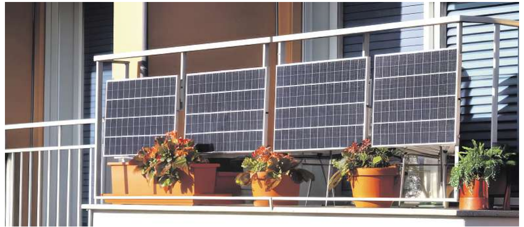
Solarmodule für ein sogenanntes Balkonkraftwerk hängen an einem Balkon.