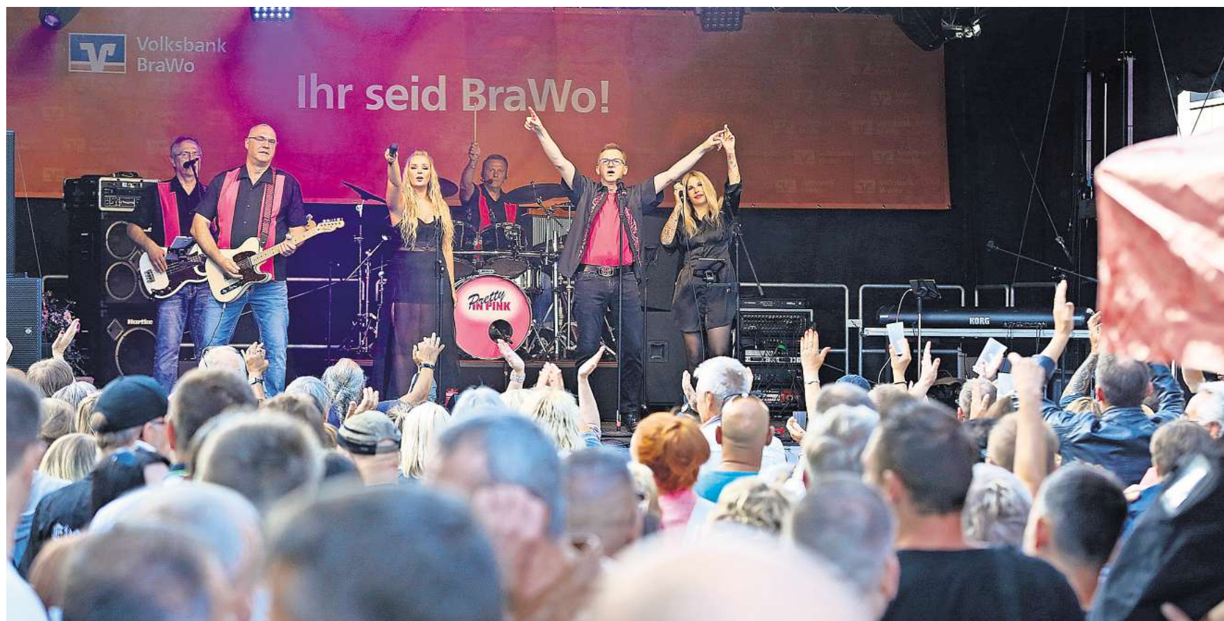
Jede Menge Live-Musik: Vier Bühnen stehen entlang der Eberfest-Partymeile, für jeden Musikgeschmack wird etwas dabei sein.

Zustellung (0800) 1234-909 · Geschäftskunden (05361) 200-163-130 · Kleinanzeigen (0800) 1234-906 · Redaktion (05371) 808-122