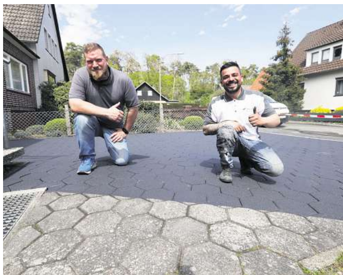
Eine mit dem „Steinfresh“-Verfahren sanierte Pflasterung. Das geniale Pflegesystem verhindert Flechten und Schwarzalgen.