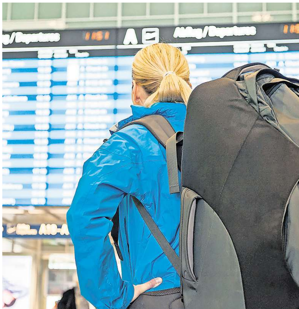
Flugverspätung, schmutziger Pool, Ungeziefer im Hotel oder Baulärm – bei Ärger im Pauschalurlaub können Urlauber den Reisepreis mindern.