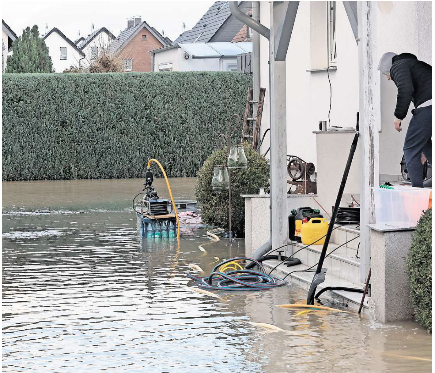
Rückblick: Im Winter war besonders Vorfälle von den Regenmassen betroffen. Häusereinfahrten wurden vom Wasser komplett geflutet.

Im Mittelpunkt des Masterplans steht die Aufgabe, die Feuerwehren in Wolfsburg entsprechend für die Zukunft zu wappnen. Es gehe darum, Lagerkapazitäten zur Verfügung zu haben, damit beispielsweise auf eine erneute Pandemie reagiert werden kann oder eine Vielzahl Geflüchteter bei weiteren Entwicklungen in Sachen Krieg aufgenommen werden könnte. Auch gesetzliche Veränderungen im Sinne der Anforderungen müssen im Blick behalten werden: Nach einem