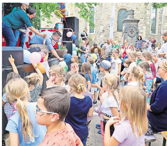
Radiergummis und Süßigkeiten: Beim Kinderfest werden auch diesmal Schultüten an die baldigen ABC-Schützen verteilt.

„Gute Stimmung und ein Programm für alle Generationen machen den Besuch unseres Eberfestes für Jung und Alt lohnenswert“, lädt der Verkehrsverein Vorsfelde live schon jetzt alle zum Mitfeiern ein.