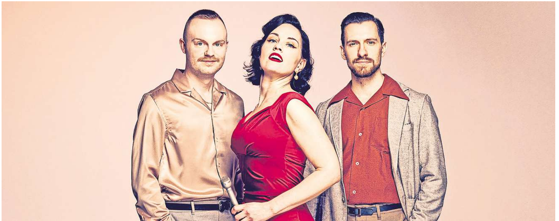
„Trouble Ahead“ tritt beim fünften „Jazz & more“-Samstag in der Wolfsburger Innenstadt auf.

Fünfter Konzerttag des Wolfsburger Jazz-Festivals in der Innenstadt