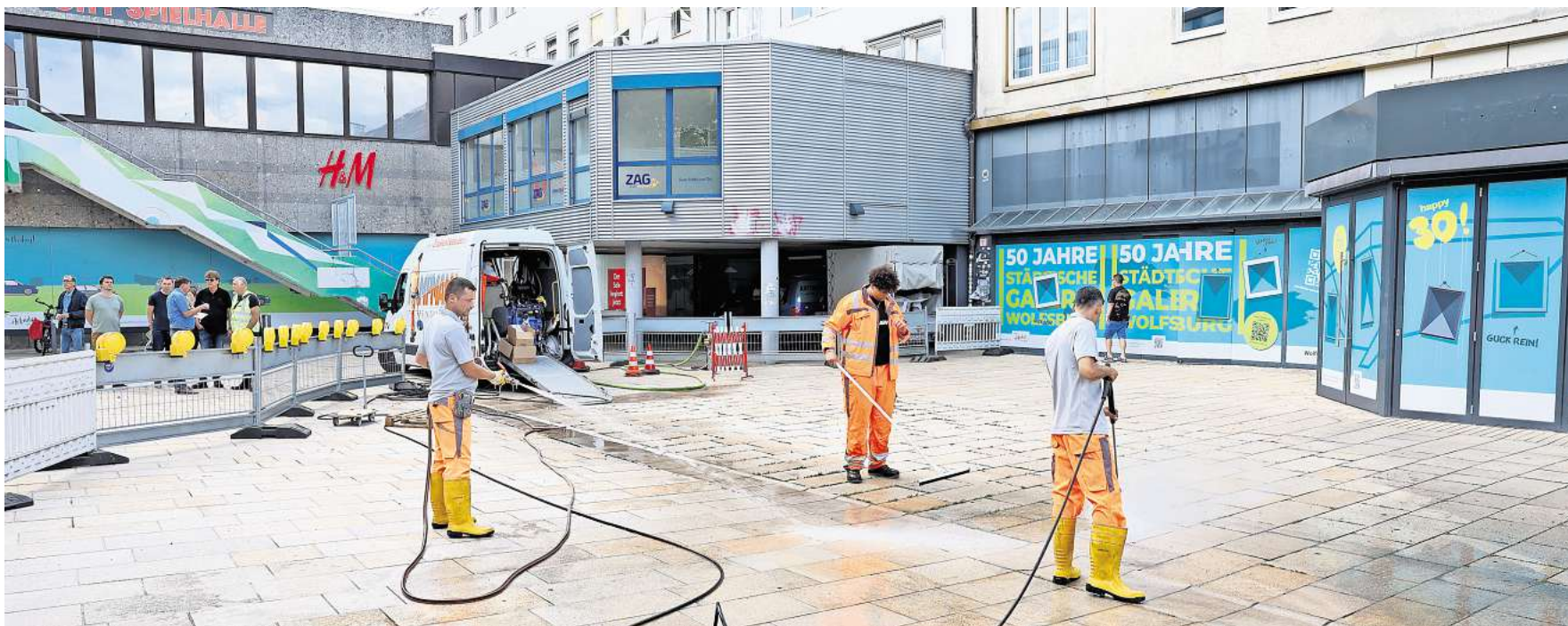
Über drei Wochen reinigt eine Spezialfirma die Wolfsburger Innenstadt mit Hochdruckreinigern.