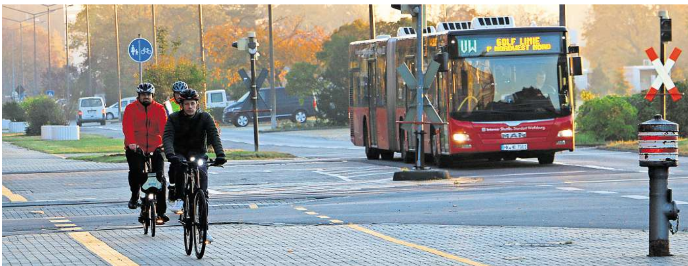
Treten in die Pedale: 1.000 VW-Beschäftigte nehmen inzwischen an dem Projekt „Mit dem Rad ins Werk“ teil. Bald könnten es noch mehr werden.

„Es ist geplant, in Kürze weitere Bereiche im Werk für das Projekt ‚Mit Deinem Rad ins Werk‘ zu ertüchtigen“, erklärt der Sprecher auf AZ/WAZ-Anfrage. Damit das auch umgesetzt werden kann, finden derzeit bereits auf dem Werksgelände die notwendigen Infrastrukturmaßnahmen statt. Dazu werden neue Fahrradwege gebaut und markiert. Wenn das geschehen ist, müssen die einzelnen Abschnitte noch einer internen Prüfung unterzogen und anschließend freigegeben werden. Erst dann können laut Volkswagen weitere Teilnehmer aufgenommen werden. Die Warteliste für das Projekt ist nach wie vor gut gefüllt.