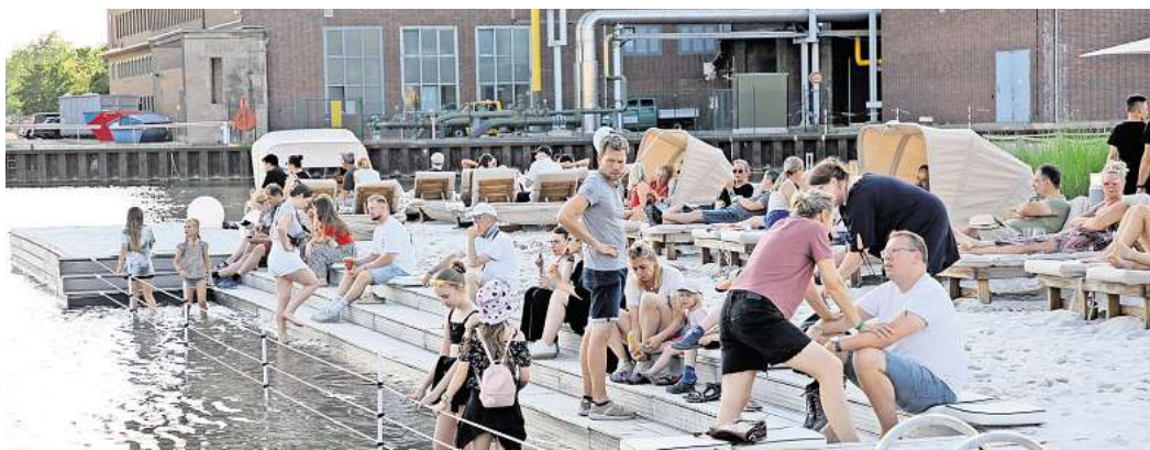
Bei der „Cool Summer Island“ in der Autostadt ist das Baden verboten.