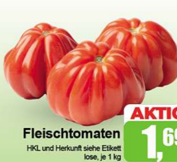
Fleischtomaten HKL und Herkunft siehe Etikett lose, je 1 kg