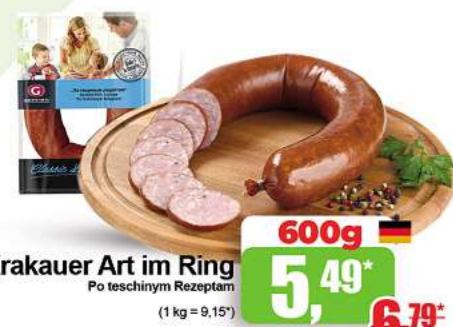
Krakauer Art im Ring Po teschnym Rezeptam