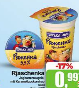
Rjaschenka Joghurtzucce mit Karamellzucce