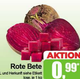
Rote Bete HKL und Herkunft siehe Etikett lose, je 1 kg