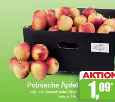
Polnische Äpfel HKL und Herkunft siehe Etikett lose, je 1 kg