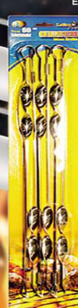
Grillspieße 20 mm breit, 6 St.PK (60 cm) Edelstahl 2 mm