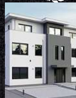
Fenster & Rollläden Schiebeanlagen Faltanlagen

V. Gloger Direktförderung ohne komplizierte Antragstellung auf alle Produkte