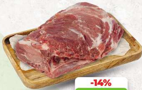
Schweinenacken mit Knochen an unserer Frischetheke je 1 kg

Herkunftsnachweise von unseren Produkten - siehe Etikettierung