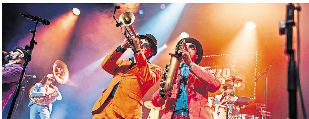
Die Italo-Brass-Band Brazzo Brazzone sorgt mit einem vielfältigen Stilmix aus Jazz, Soul, Funk, Rock, Latin und Balkan für gute Stimmung.

Die traditionsreiche Konzertreihe Jazz & more wird von der Wolfsburg Wirtschaft und Marketing GmbH (WMG) organisiert und findet bereits zum 25. Mal in der Wolfsburger Innenstadt statt. Noch bis 10. August geben verschiedene Jazz- und Bluesbands ihr musikalisches Können zum Besten. Ein Catering-Angebot rundet das kostenfreie Konzerterlebnis unter freiem Himmel ab. Für den Besuch der Jazz & more-Konzerte ist keine Voranmeldung oder Reservierung notwendig. Es gilt freier Zugang und freie Platzwahl. Ein barrierefreier Zugang ist ebenfalls sichergestellt.