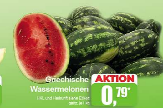
Griechische Wassermelonen HKL und Herkunft siehe Etikett ganz, je 1 kg