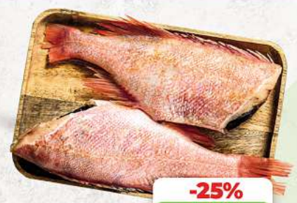
Rotbarsch ohne Kopf, frisch aufgetaut an unserer Frischetheke je 1 kg