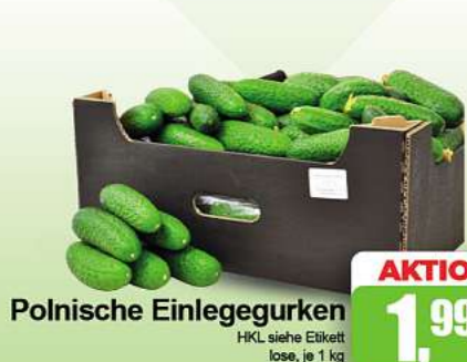
Polnische Einlegegurken HKL siehe Etikett lose, je 1 kg