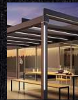
Terrassen- überdachungen Glasoasen Markisen