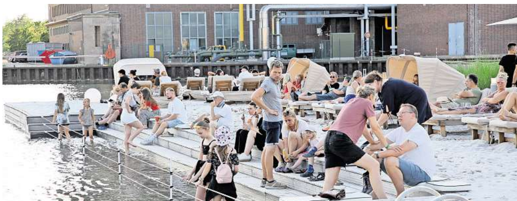
Bei der „Cool Summer Island“ in der Autostadt ist das Baden verboten.