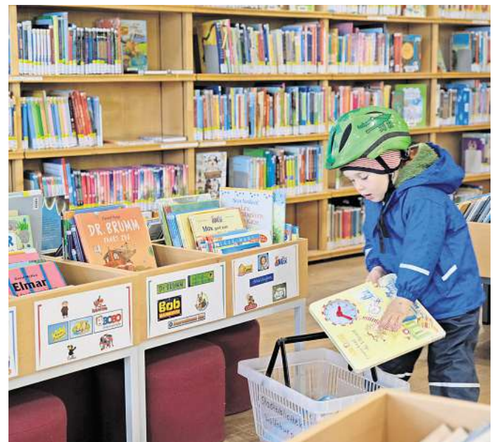
Kinder rücken in den Fokus beim neuen Raumkonzept der Stadtbibliothek.