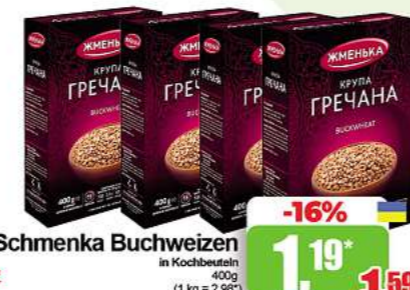
Schmenka Buchweizen in Kochbeutel