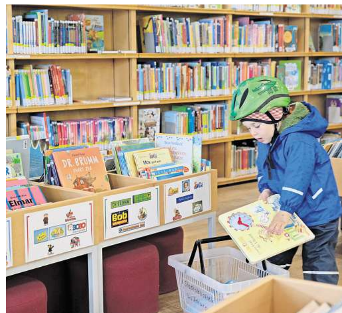
Kinder rücken in den Fokus beim neuen Raumkonzept der Stadtbibliothek.