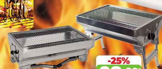
Mangal Angler HLB: 45 x 30 x 12 12/35cm Edelstahl 0,6 mm