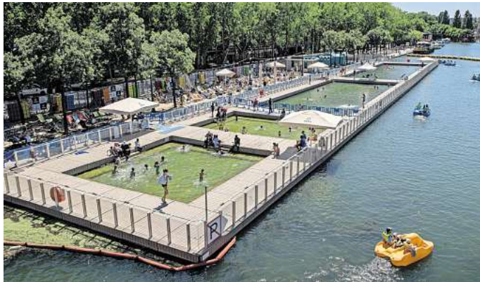
Ein Abschnitt mit Liegestühlen und davor Becken zum Baden im Fluss: Paris übt sich seit einigen Jahren als Flussbadstadt.

2017 wurde das städtische Flussbad erstmals aufgebaut und die Nachfrage war groß. In den verschiedenen Becken zum Schwimmen und Planschen, die