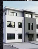
Fenster & Rollläden Schiebeanlagen Faltanlagen

V. Gloger Direktförderung ohne komplizierte Antragstellung auf alle Produkte