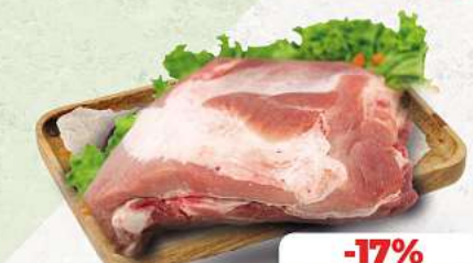
Dicke Rippe vom Schwein ohne Schwarte an unserer Frischetheke je 1 kg