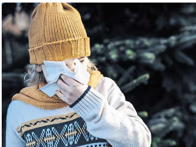
Auffällig viele Erkältungen: In diesem Sommer sind Atemwegserkrankungen häufiger als in dieser Jahreszeit üblich.

„Wir haben vermehrt Erkrankungen wie Husten und Schnupfen, die sonst eher für den Winter typisch sind“, sagt auch Dr.