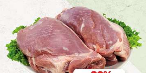
Putenoberkeule ohne Haut und Knochen an unserer Frischetheke je 1 kg

HÄNNCHENSCHENKEL | SCHWEINEBAUCH | SCHWEINENACKEN