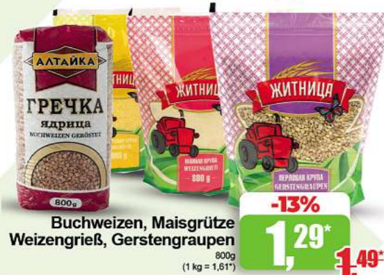
Buchweizen, Maisgrütze, Weizengrieß, Gerstengraupen