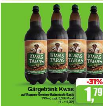
Gärgetränk Kwas auf Roggen-Gemüse-Malzelstängel-Basis