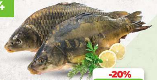
Frischer Karpfen an unserer Frischetheke je 1 kg