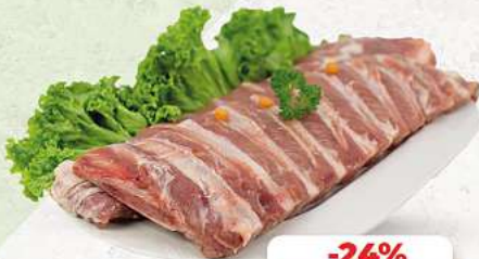
Bauchrippen vom Schwein an unserer Frischetheke je 1 kg