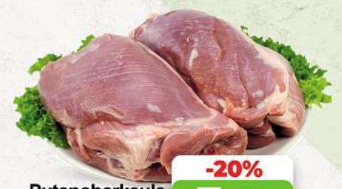
Putenoberkeule ohne Haut und Knochen an unserer Frischetheke je 1 kg

HÄNNCHENSCHENKEL | SCHWEINEBAUCH | SCHWEINENACKEN