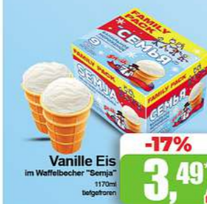
Vanille Eis im Waffelbecher "Smig"

bis zu 24% auf Frische & Tiefkühlprodukte