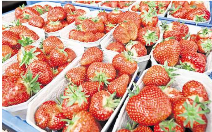
Erdbeeren auf einem Wochenmarkt: Der Ökolandbau in Niedersachsen wächst weiter.