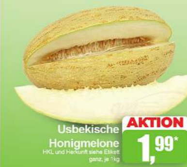
Usbekische Honigmelone HKL und Herkunft siehe Etikett ganz, je 1 kg