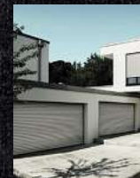
Garagentore Deckenlaufftre Kastenrolltore