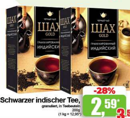
Schwarzer indischer Tee,