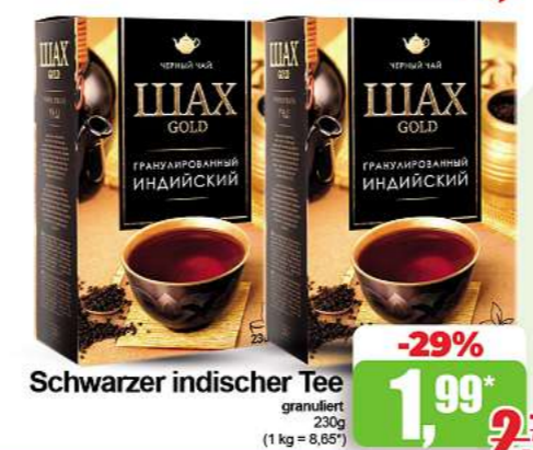
Schwarzer indischer Tee