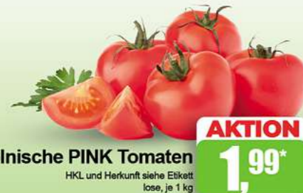
Polnische PINK Tomaten HKL und Herkunft siehe Etikett lose, je 1 kg