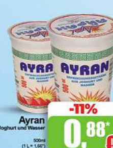
Ayran aus Joghurt und Wasser