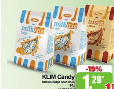
KLIM Candy Milchkugeln oder Imbiss