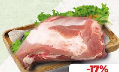
Dicke Rippe vom Schwein ohne Schwarte an unserer Frischetheke je 1 kg