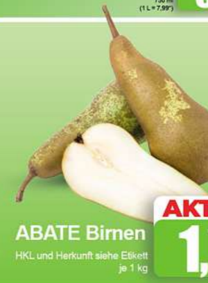
ABATE Birnen HKL und Herkunft siehe Etikett je 1 kg