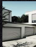
Garagentore Deckenlaufftre Kastenrolltore