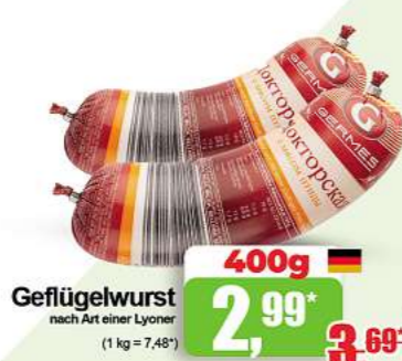
Geflügelwurst nach Art einer Lyoner