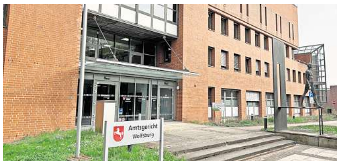
Wegen Körperverletzung musste sich ein 33-Jähriger vor dem Amtsgericht verantworten.

Die 31-Jährige schilderte, dass sie dem 33-Jährigen die Wäsche vor die Tür gelegt hätte und ihn gefragt habe, ob die Sachen weg könnten. Als er dies bejaht habe, habe sie sie in den Müllsack geworfen. Daraufhin sei er von der Seite gekommen und habe ihr mit der Faust auf die linke Brust geschlagen. Es sei nicht das erste Mal gewesen, dass es zu Handgreiflichkeiten seitens ihres Noch-Ehemanns gekommen sei.