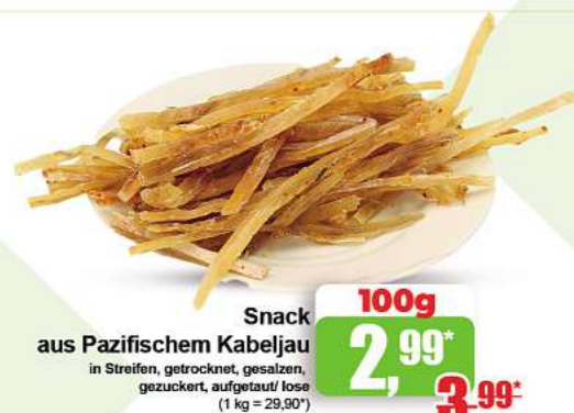
Snack aus Pazifischem Kabeljau in Streifen, getrocknet, gesalzen, gezuckert, aufgetaut/ lose