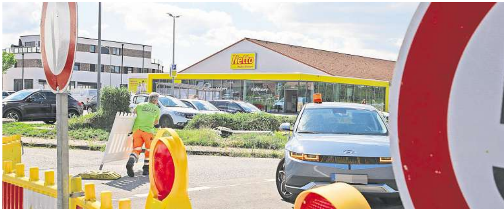
Die Baustellenabsicherung wurde abgebaut. Die Brücke in Sülfeld auf der Calberlaher Straße ist wieder befahrbar.

Die Brücke war im Juli 2023 gesperrt worden. Im Zuge des Ausbaus der Weddeler Schleife mussten diverse Brückenbauwerke, vier allein in Sülfeld, auf der nun zweigleisigen Bahnstrecke erneuert und ausgebaut werden. Über eine der Brücken führt die Calberlaher Straße. Die Eröffnung war ursprünglich für Oktober 2023 angekündigt und dann immer wieder verschoben worden. Auch