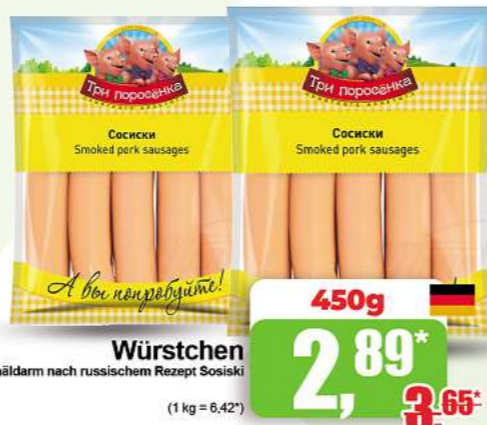
Würstchen im Schälarm nach russischem Rezept Sosiski