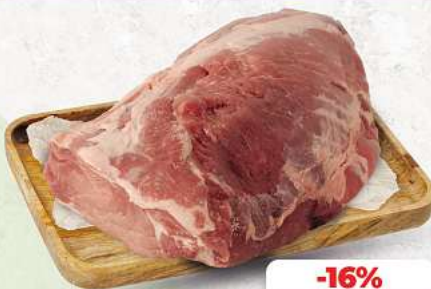
Schweinenacken ohne Knochen an unserer Frischetheke je 1 kg

Herkunftsnachweise von unseren Produkten - siehe Etikettierung