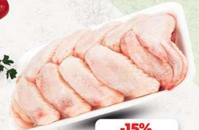
Hähnchenflügel an unserer Frischetheke je 1 kg

PUTENOBERRKEULE | SCHWEINENACKEN HAUSGEMACHT MARINIERT