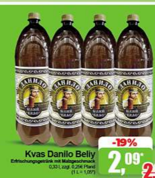
Kvas Danilo Belyi Erfrischungsgetränk mit Malzelstängel