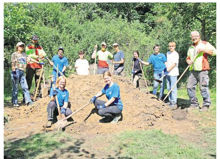
Die Teilnehmenden des diesjährigen Workcamps bauen einen Bienenhügel an der Streuobstwiese am Krankenhaus in Wolfsburg.