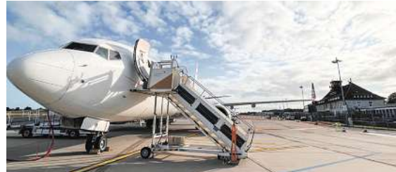
Fliegen ab Braunschweig: Einsteigen und Urlaub!

Den Katalog, weitere Informationen und Buchungsmöglichkeiten dieser exklusiven Angebote unter www.fliegen-ab-braunschweig.de , in vielen Reisebüros oder unter der kostenfreien (aus dem dt. Festnetz) Buchungshotline T. 08 00 / 38 300 38 (Mo.-Fr. 9–18, Sa. 9–13 Uhr).