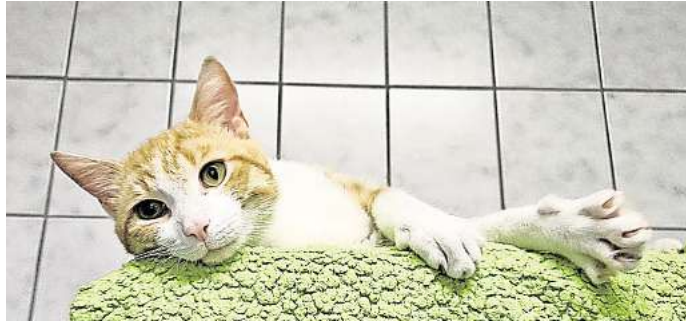
Ein alter Schmusekater: Ivar möchte allerdings auch mal an die frische Luft.

Anfang Juni erfuhr das Peiner Tierheim, dass sich ein rot-weißer Kater mit Bissverletzungen schon seit längerer Zeit im Stadtpark aufhält. Eine Mitarbeiterin hat ihn gesichert und zum Tier-