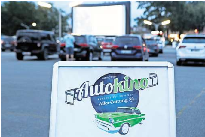
Das Gifhorer Autokino startet am 6. September. Leser können ab sofort beim Online-Voting mitmachen.

Diese Filme stehen für den Wunschfilm am Freitagabend um 20 Uhr zur Auswahl: Sie