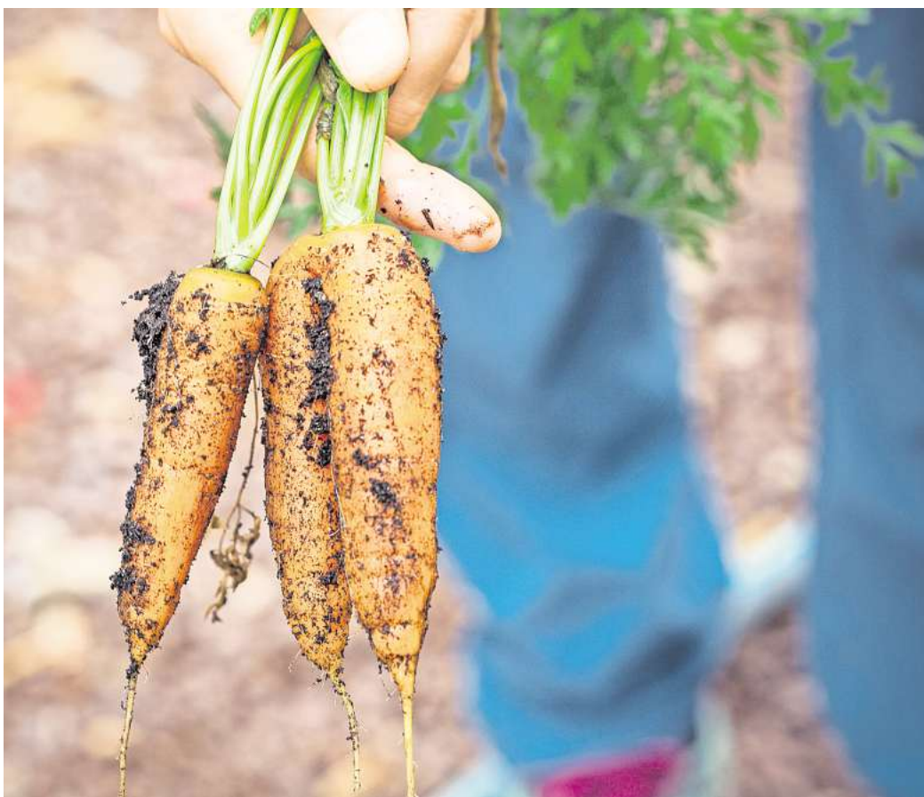
Die ökologisch bewirtschaftete Fläche in Niedersachsen ist 2023 nach Angaben des Landwirtschaftsministeriums gewachsen – um etwa vier Prozent auf rund 154.000 Hektar.

Niedersachsen belegt deutschlandweit nach Bayern und Baden-Württemberg Platz drei bei der Anzahl der ökologisch wirtschaftenden Land-