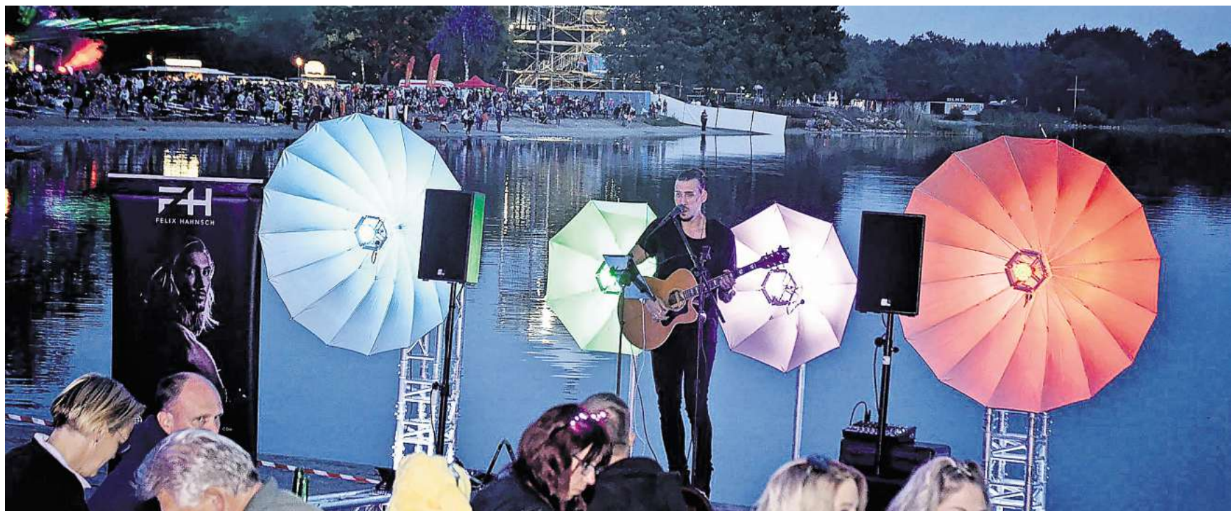
Partystimmung ist am Wochenende am „Strand“ von Wolfsburg angesagt.