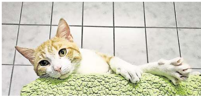
Ein alter Schmusekater: Ivar möchte allerdings auch mal an die frische Luft.

Anfang Juni erfuhr das Peiner Tierheim, dass sich ein rot-weißer Kater mit Bissverletzungen schon seit längerer Zeit im Stadtpark aufhält. Eine Mitarbeiterin hat ihn gesichert und zum Tier-