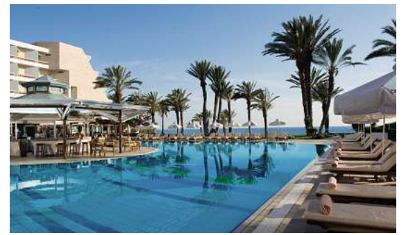
Eines der beliebtesten Hotels überhaupt: Das 4,5* Pioneer (TUI Blue) auf Zypern

Auch in den Herbstferien kann man ab Braunschweig abheben. Aufgrund der großen Nachfrage wurde ein Zusatzflug nach Korfu aufgelegt und auch auf einem Termin nach Andalusien gibt es noch wenige Restplätze. In beiden Destinationen werden auch attraktive Kinderfestpreise ab € 499,- angeboten, um Urlaub