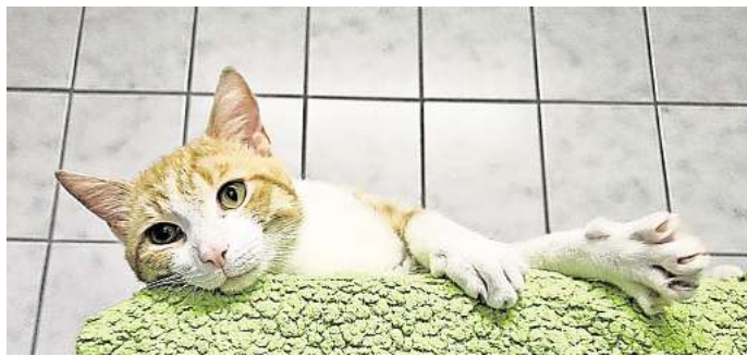
Ein alter Schmusekater: Ivar möchte allerdings auch mal an die frische Luft.

Anfang Juni erfuhr das Peiner Tierheim, dass sich ein rot-weißer Kater mit Bissverletzungen schon seit längerer Zeit im Stadtpark aufhält. Eine Mitarbeiterin hat ihn gesichert und zum Tier-