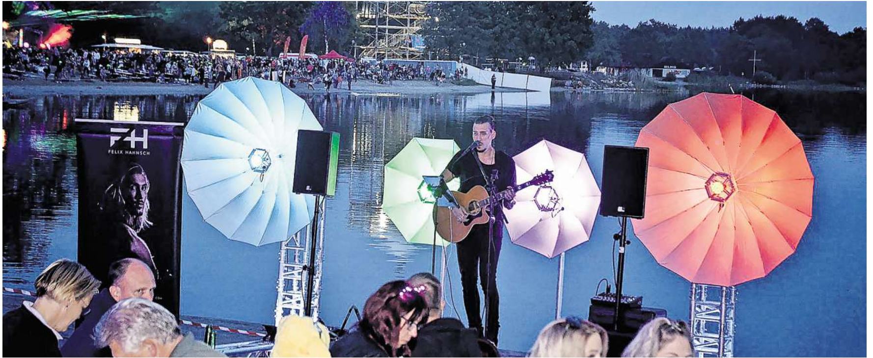
Partystimmung ist am Wochenende am „Strand“ von Wolfsburg angesagt.