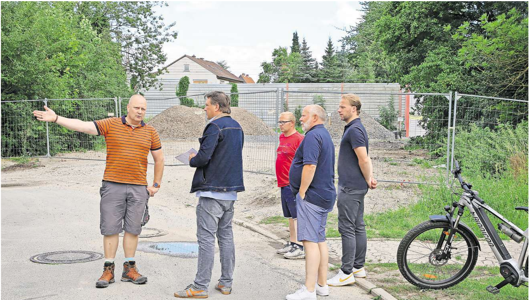
Anwohner aus Sülfeld und die Ortsbürgermeister sprechen über die Folgen der Bauarbeiten am Dietzebergweg.

Calberlaher Straße: Brücke war lange gesperrt – Baufahrzeuge fuhr durch das Wohngebiet