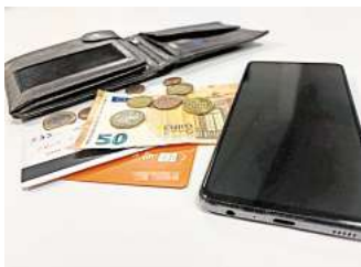
Bargeld, EC-Karte oder Smartphone: Welche Zahlungsmittel bevorzugen Sie?

Auch die repräsentative Umfrage „Postbank Digitalstudie 2024“ unter 3.171 Erwachsenen zeigt, dass die Liebe zum Bargeld bröckelt. Die Postbank untersucht seit 2015 die Akzeptanz von verschiedenen Bezahlverfahren. Im ersten Jahr der Studie sagten nur 13 Prozent, dass sie kontaktlos bezahlen. 2020 lag der Wert schon bei 47 Prozent, 2022 dann bei 60 Prozent. Parallel dazu geht die Gruppe der Kontaktlos-Verweigerer zurück. 2015 sagten noch 66 Prozent, dass sie nicht kontaktlos bezahlen wollen. 2020 schrumpfte die Zahl auf 34 Prozent. 2022 lag der Wert dann bei 26 Prozent. Aktuell nutzt ein