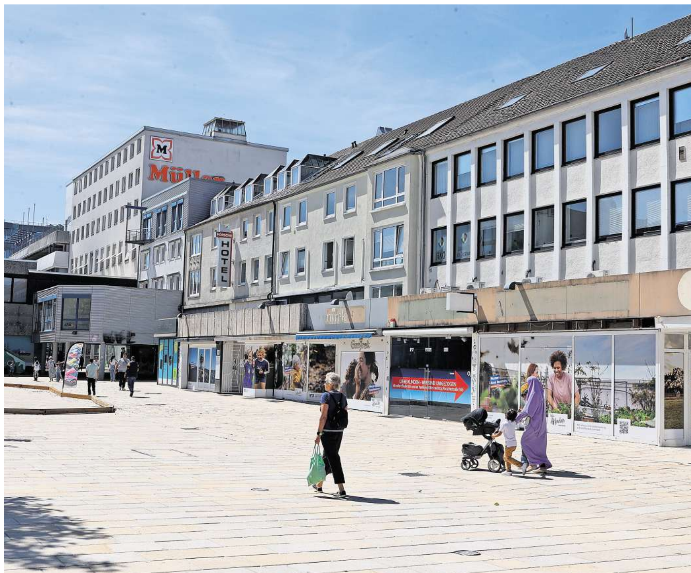
Fühlen Sie sich in der Stadt sicher? Diese Frage haben einige Wolfsburgerinnen beantwortet.

In Deutschland wurde jüngst verstärkt über Gewaltdelikte diskutiert, unter anderem mit Blick auf Messerangriffe. Laut dem ARD-Deutschlandtrend