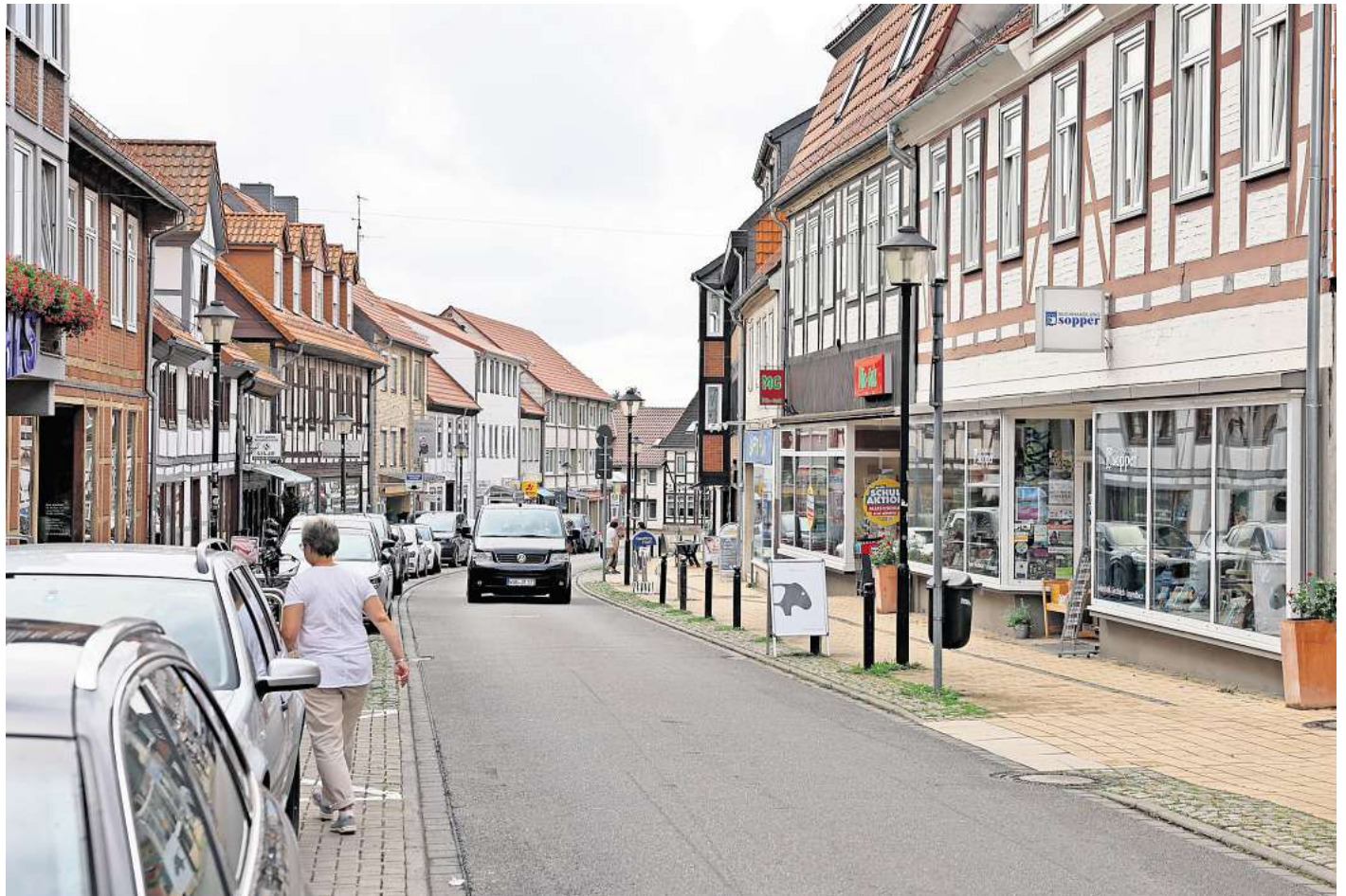
Vorsfelde: Wie kann es gelingen, Leerstand zu reduzieren?