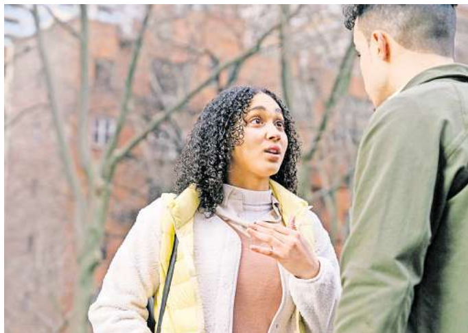
Besonders für Menschen mit viel Harmoniebedarf ist Streiten ein Graus. Doch ein Disput kann durchaus positiv sein.