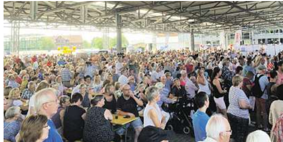
Viele Besucher werden erwartet. Das große Dach über dem Eventbereich im SchmidtTerminal in Wolfenbüttel sorgt für gute Stimmung bei jedem Wetter.

Der Eintritt ist frei. Parkplätze stehen im Umfeld zur Verfügung.