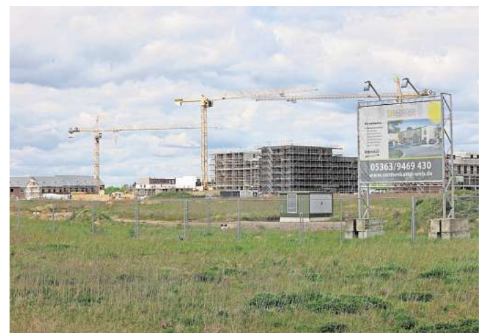
Der Rat soll über die weitere Erschließung im Baugebiet Sonnenkamp entscheiden.