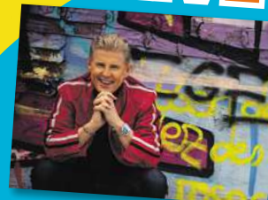
MARKUS (ICH WILL SPASS)