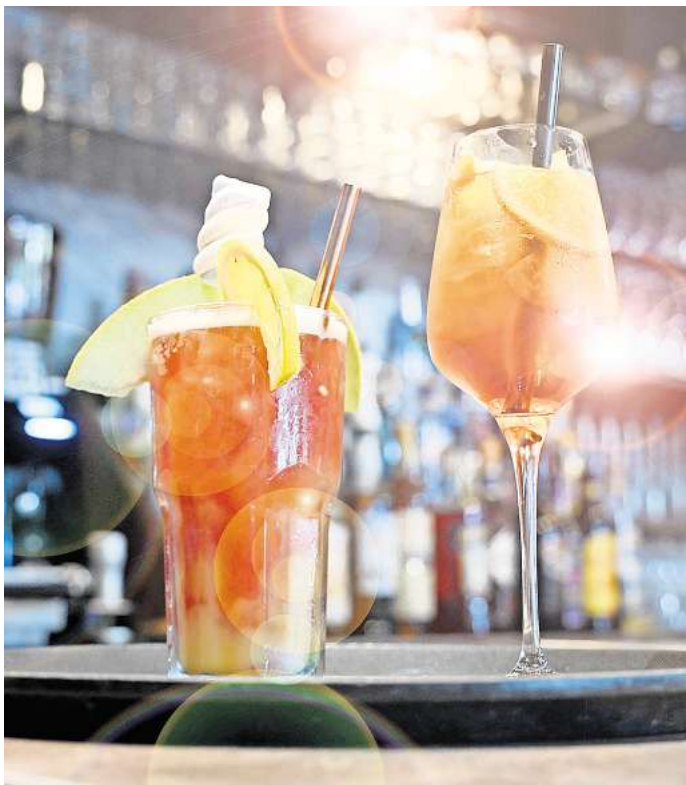
Cocktails: Immer öfter werden alkoholfreie Alternativen nachgefragt.

Direkt zur Umfrage: Einfach den QR-Code mit dem Handy scannen.