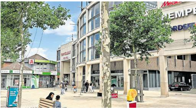
Porschestraße: In der City-Galerie zieht ein neues Geschäft ein.

Oktober 2007 in Deutschland vertreten und eröffnete 1994 die erste Filiale in Großbritannien. In Deutschland verfügt TK Maxx derzeit über 175 Stores; europaweit zählt das Off-Price-Unternehmen mehr als 630 Filialen in den Ländern Deutschland, Großbritannien, Irland, Polen, Österreich und in den Niederlanden.