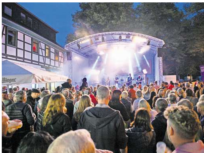
Ausgelassene Stimmung und unterhaltsame Live-Musik – auch dafür steht das Fallersleber Altstadtfest.

Und auch das Line-Up kann sich sehen lassen: 33 Künstler und Bands werden in diesem Jahr auf erstmals fünf statt auf drei Bühnen – auf dem Denkmalplatz, in der Bahnhofstraße, am Piepenpahl, in der Westerstraße und auf der Hoffmannwiese – unterhalten und den Besuchern von Donnerstag bis Samstag ein bunt gemischtes Programm von Rock bis Schlager und von Pop bis African Dance beschere und auf der ganzen Festmeile für ausgelassene Stimmung sorgen. Beim Livemusik-Programm haben die Veranstalter auf bekannte Bands gesetzt. Als Headliner werden drei Top-Bands spielen. So werden am Donnerstag die Ärzte-Tribute-Band „Die Kassenpatienten“ und am Freitag die Poprock-Band „Stürmer Deluxe“ (beide ab 20.45 Uhr) sowie am Samstag ab 21.30 Uhr die Status-Quo-Coverband „Quotime“ auftreten.