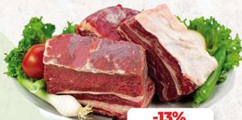
Suppenfleisch vom Rind an unserer Frischetheke je 1 kg

Herkunftsnachweise von unseren Produkten - siehe Etikettierung