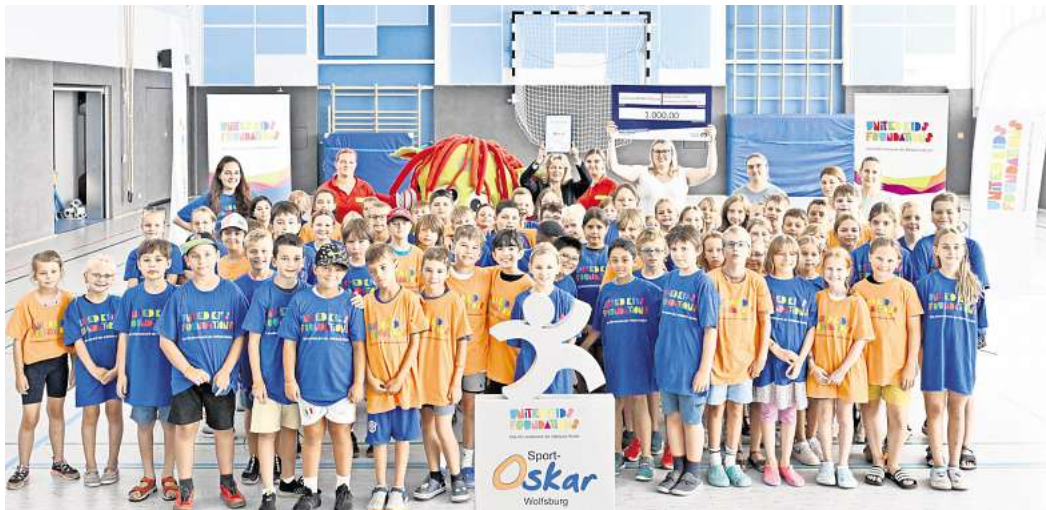
Der Sport-Oskar-Tag motivierte die gesamte Grundschule Sülfeld zu einem Tag voller Spiel, Sport und Spaß.

Schule bekam Zuschlag – Förderverein erhält 1000 Euro