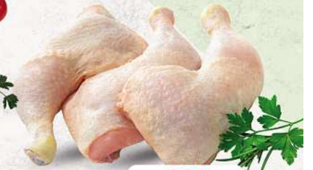
Hähnchenschenkel an unserer Frischetheke je 1 kg