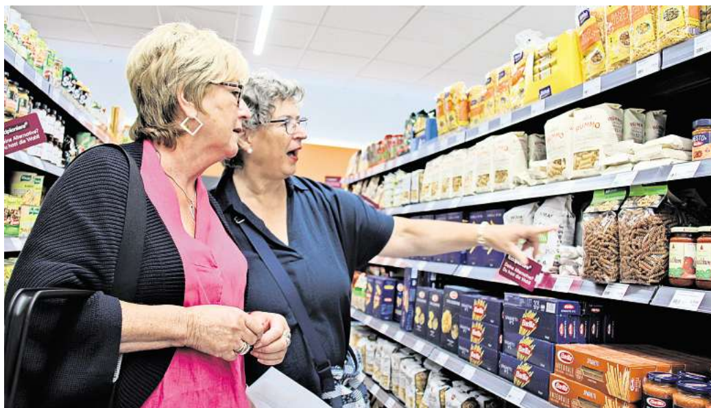
Kundinnen kaufen ein bei „Tante Enso“ in Gülzow.