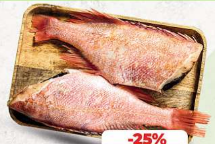
Rotbarsch frisch aufgetaut an unserer Frischetheke je 1 kg

HÄHNCHENSCHENKEL | SCHWEINEBAUCH | SCHWEINENACKEN