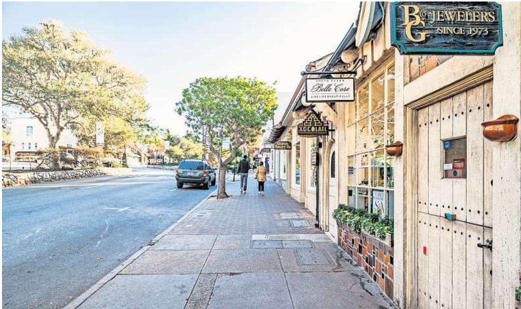
Weder Hausnummern noch Adressen findest du in Carmel-by-the-Sea.

Wo ist das nächste Geschäft oder Restaurant? Wie komme ich am schnellsten vom Hotel oder der Ferienwohnung zum Strand? Wer Einheimische fragt, bekommt dann nahe gelegene Orientierungspunkte beschrieben, berichtet der „Independent“. Zum Beispiel die Farbe oder den Stil eines Hauses, die