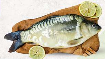
Spiegelkarpfen oder Schuppenkarpfen an unserer Frischetheke je 1 kg

PUTENOBBERKEULE | SCHWEINENACKEN HAUSGEMACHT MARINIERT