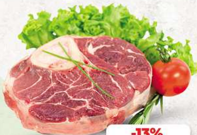
Rinderbeinscheiben an unserer Frischetheke je 1 kg

Herkunftsnachweise von unseren Produkten - siehe Etikettierung