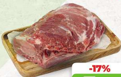
Schweinenacken mit Knochen an unserer Frischetheke je 1 kg