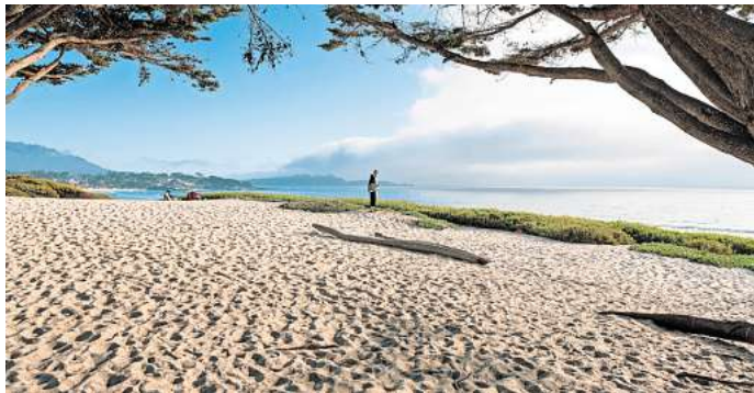
Die Küstenstadt Carmel-by-the-Sea in Kalifornien hat einen traumhaften Strand, aber keine Straßennamen.

Ob Carmel-by-the-Sea bald wirklich wenigstens Hausnummern bekommt, hängt auch von neuen Wahlen im November 2024 ab. Dann wählen die rund 3220 Bürgerinnen und Bürger der Kleinstadt einen neuen Bürgermeister und Stadtrat, beide müssen dann über die Zukunft des Ortes und ob es Adressen geben soll, entscheiden.