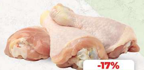
Hähnchenunterkeulen an unserer Frischetheke je 1 kg