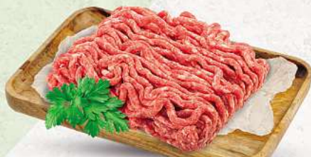
Schweinehackfleisch an unserer Frischetheke je 1 kg