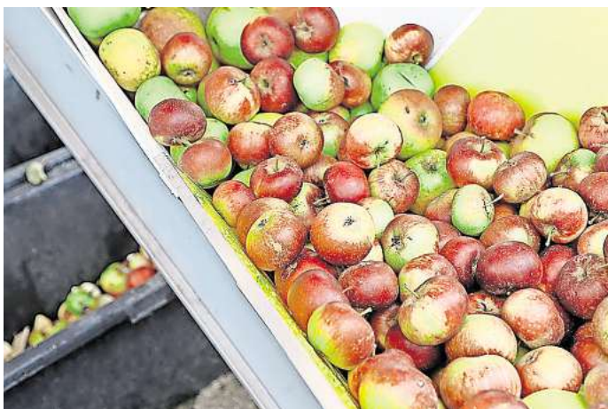
Geerntete Äpfel: Nutzen Sie Früchte aus dem eigenen Garten für Marmelade, Mus oder Kuchen?

Direkt zur Umfrage: Einfach den QR-Code mit dem Handy scannen.