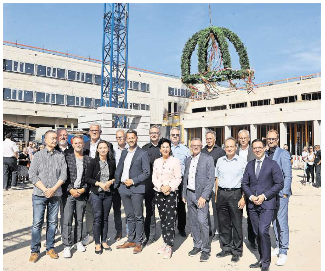
Richtfest der neuen Feuerwache in Wolfsburg: Vertreter aus Politik und Verwaltung haben die Baustelle in der Dieselstraße besichtigt.