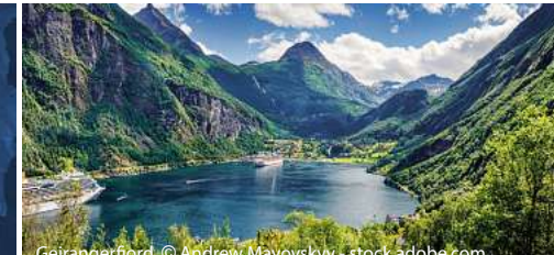
Geirangerfjord, © Andrew Mayovsky - stock.adobe.com