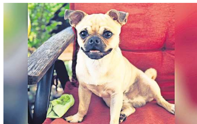
Milow bereits im Alter von acht Monaten sein gewohntes Zuhause verloren.

Interessierte erfahren Details über Kolja unter der Telefonnummer (0 53 74) 44 34 oder per Mail info@tierschutzgifhorn.de