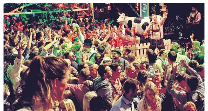
Premiere im Gebrauchtwagenzentrum der Automeile Wolfsburg: Am Samstag, 28. September, steigt dort das Oktoberfest Wolfsburg mit den Alpenbanditen.

Direkt zur Verlosung: Einfach den QR-Code mit dem Handy scannen.