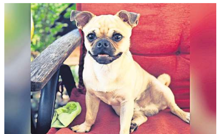
Milow bereits im Alter von acht Monaten sein gewohntes Zuhause verloren.

Interessierte erfahren Details über Kolja unter der Telefonnummer (0 53 74) 44 34 oder per Mail info@tierschutzgifhorn.de