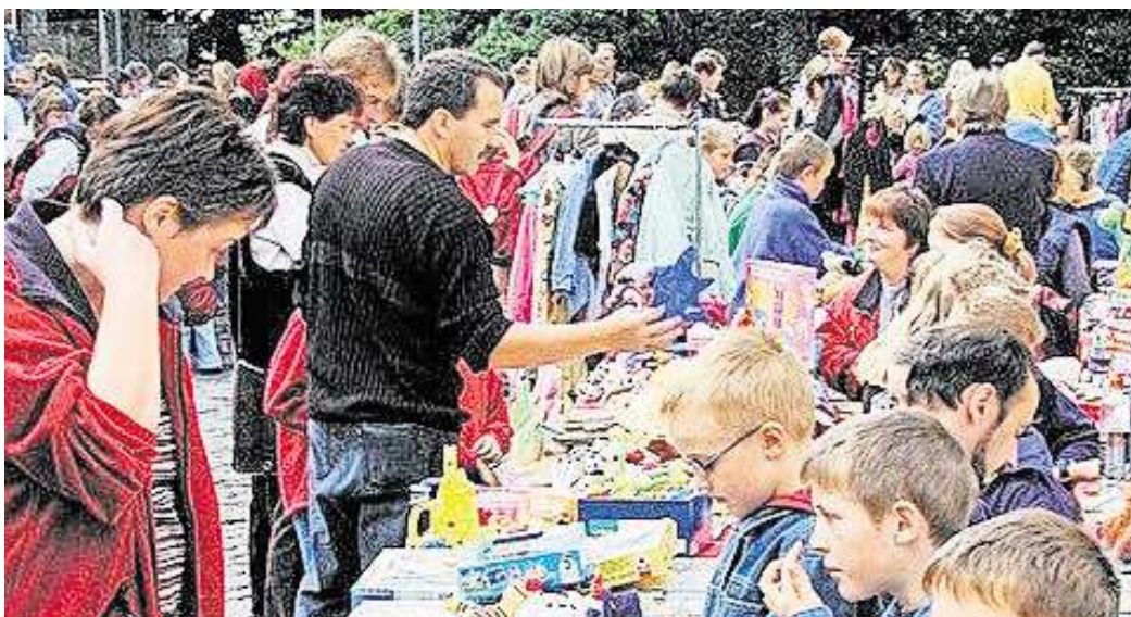
Beim Großflohmarkt in Velpke bleiben keine Wünsche offen.

Das reichhaltige Angebot lässt fast keine Wünsche offen. Egal ob Haushaltswaren, Kinderspielzeug, Bekleidung oder sogar frisches Obst und Blumen, es gibt fast nichts, das es nicht gibt. Auch für das leibliche Wohl wird gesorgt, von Döner über Bratwurst, Bier und Popcorn ist für jeden Geschmack etwas dabei.