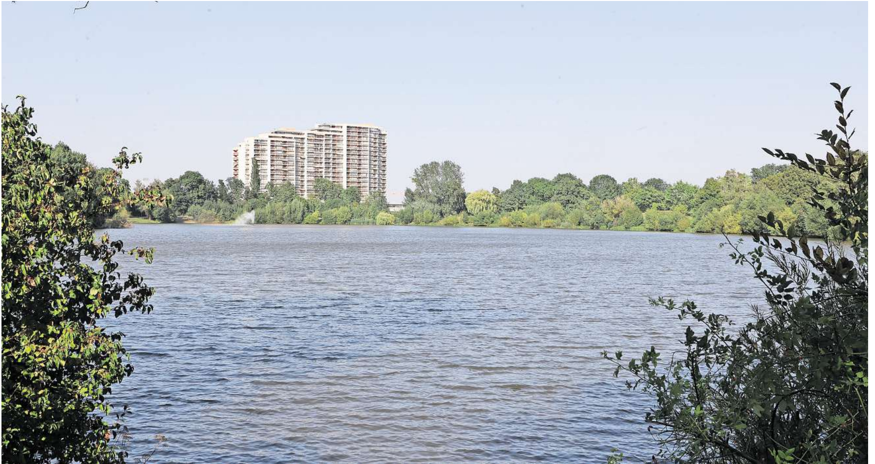
Durch die Entwürfe der Studierenden soll der Schillerteich attraktiver gestaltet werden.