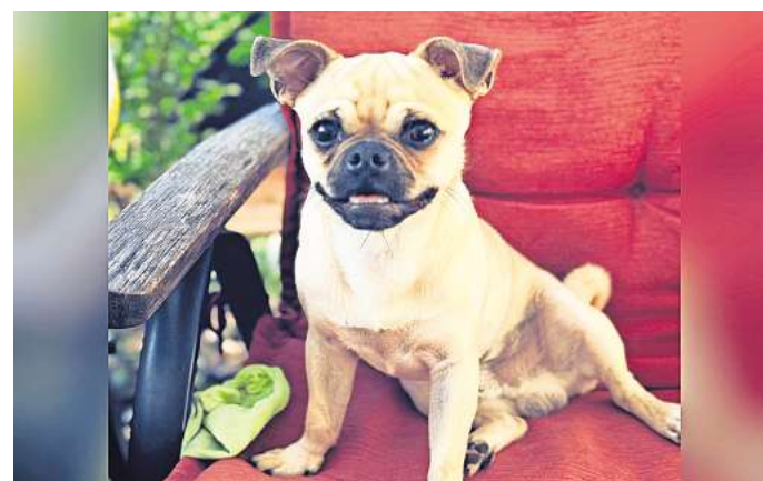
Milow bereits im Alter von acht Monaten sein gewohntes Zuhause verloren.

Interessierte erfahren Details über Kolja unter der Telefonnummer (0 53 74) 44 34 oder per Mail info@tierschutzgifhorn.de