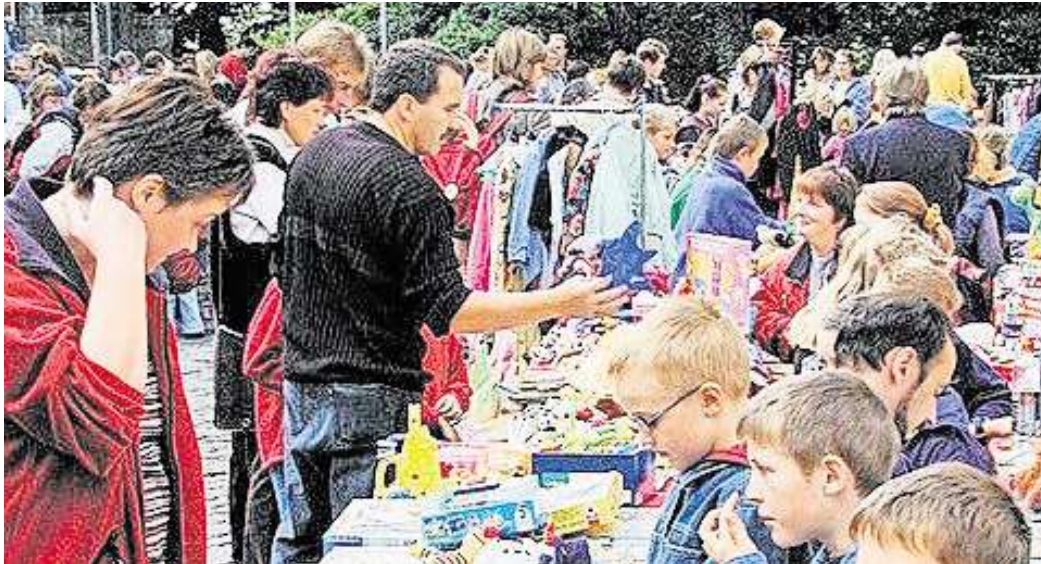
Beim Großflohmarkt in Velpke bleiben keine Wünsche offen.

Das reichhaltige Angebot lässt fast keine Wünsche offen. Egal ob Haushaltswaren, Kinderspielzeug, Bekleidung oder sogar frisches Obst und Blumen, es gibt fast nichts, das es nicht gibt. Auch für das leibliche Wohl wird gesorgt, von Döner über Bratwurst, Bier und Popcorn ist für jeden Geschmack etwas dabei.