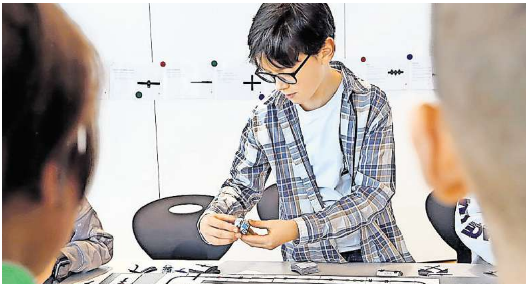
Im Herbstferienprogramm der Autostadt wird für Kinder ein vielseitiges Programm angeboten.

Mit dem Bau einer „Vertical Farm“ entsteht beim Workshop