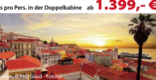
Lissabon, © Phil Good - Fotolia

Unsere inkludierten Leistungen: ✓ Transfer zum/ab Schiff ✓ Übernachtung in der gebuchten Kabinenkategorie ✓ Kreuzfahrt gemäß Routenbeschreibung ✓ Deutschsprachige Ansprechpartner an Bord ✓ Gepäcktransport bei Ein- und Ausschiffung ✓ Wahl der Tischzeit in den Hauptrestaurants (Verfügbarkeit vorausgesetzt) ✓ Alle Mahlzeiten im Haupt- und Buffetrestaurant, Spezialitätenrestaurants (Aufpreis) ✓ Betreuung im Squok-Kinderclub für Kinder/Jugendliche von 3-17 Jahre ✓ Vielfältiges Unterhaltungsprogramm ✓ Nutzung des Fitnesscenters, der Pools und der Bibliothek ✓ Alle Hafensteuern, Gebühren, Trinkgeld/Serviceentgelt ✓ Fuhrmann Mundstock Reisebegleitung an Bord ab 20 Teilnehmern ✓ My Italien Genusspaket zubuchbar für 34,- € p.P. / Tag ✓ Haustürabholung zubuchbar für 60,- € p.P.