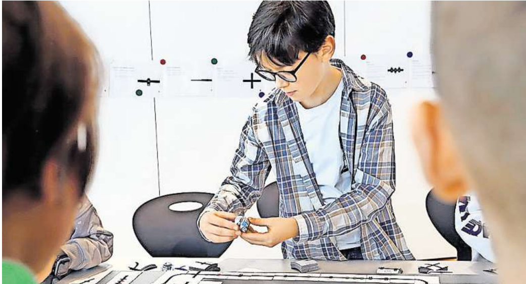
Im Herbstferienprogramm der Autostadt wird für Kinder ein vielseitiges Programm angeboten.

Mit dem Bau einer „Vertical Farm“ entsteht beim Workshop