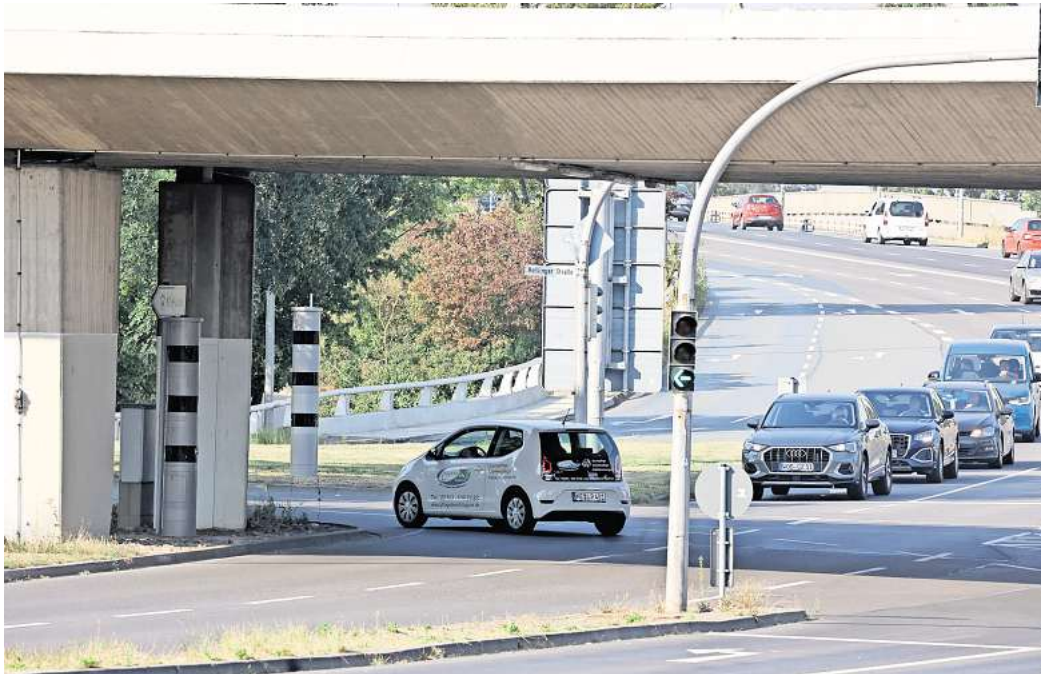
Der St. Annen Knoten in Wolfsburg gehört zur Unfallstelle Nummer eins in der Volkswagenstadt.

Der Raser des Jahres 2023 in Wolfsburg überschritt die erlaubte Geschwindigkeit um 81 Kilometer die Stunde. Er wurde an der Frankfurter Straße in Fahrtrichtung Süden erwischt. Statt der erlaubten 50 Stundenkilometer war er mit Tempo 131