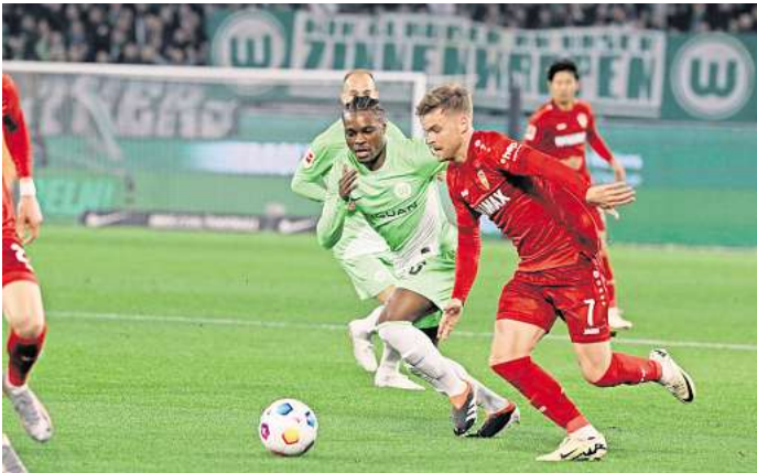
Für das Spiel des VfL Wolfsburg gegen den VfB Stuttgart können Leser Eintrittskarten gewinnen.

spiel hat es in sich: Mit dem VfB Stuttgart kommt der Tabellenzweite der vorherigen Saison am Samstag, 28. September, in die Volkswagen Arena nach Wolfsburg. Doch auch Stuttgart ist durchwachsen in die Saison gestartet. In den ersten drei Spielen gab es für den VfB nur einen Sieg, zudem ein Unentschieden und eine Niederlage. Für die Partie des VfL Wolfsburg gegen den VfB Stuttgart können WAZ-Leser 2x2 Eintrittskarten gewinnen. Was Sie dafür tun müssen? Gehen Sie einfach auf unsere Gewinn-