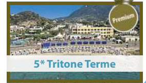
5* Tritone Terme