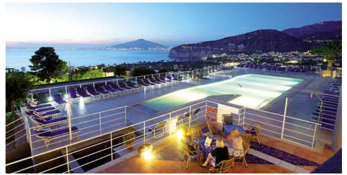
Viele einzigartige Hotelerlebnisse, wie hier das 4* Arthotel Gran Paradiso an der Amalfiküste, sind buchbar.

In allen Zielen kann man aus einem großen und vielfältigen Hotelangebot wählen.