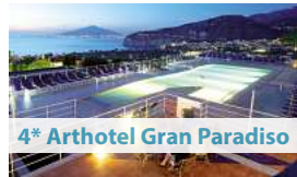
4* Arthotel Gran Paradiso