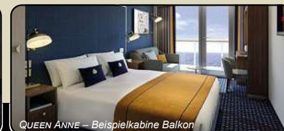
QUEEN ANNE – Beispielkabine Balkon