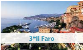
3* Il Faro