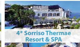
4* Sorriso Thermae Resort & SPA