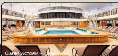
QUEEN VICTORIA – Pavilion Pool