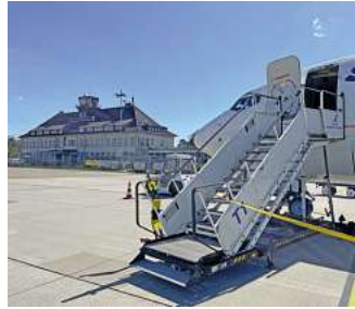
Fliegen ab Braunschweig mit momento - ein exklusives Erlebnis.

garve (auch in Kombination mit Lissabon). Den Katalog, weitere Informationen und Buchungsmöglichkeit dieser exklusiven Angebote unter der kostenfreien (aus dem dt. Festnetz) Buchungshotline T. 08 00 / 38 300 38 (Mo-Fr. 9 - 18, Sa. 9 - 13 Uhr), im FIRST Reisebüro Schmidt und weiteren Reisebüros oder unter www.fliegen-ab-braunschweig.de