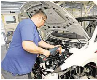
Tarifverhandlungen bei VW: Wird es am Ende trotz der Krise ein Lohnplus für die Mitarbeiter geben?

schätzung wissen: Was glauben Sie, werden die Tarifverhandlungen mit einem Lohnplus für die VW-Beschäftigten enden? Machen Sie mit bei unserer Umfrage und gewinnen Sie einen 50-Euro-Gutschein von Media Markt. Einfach den QR-Code scannen oder diesem Link folgen: https://aktion.waz-online.de/umfrage/tarif24 .