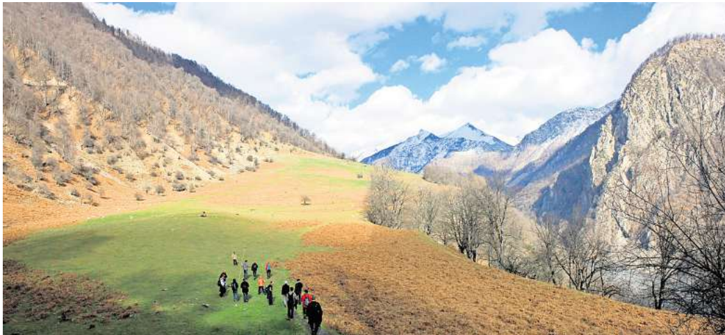
Auf Wanderungen durch die Region Gabala zeigen sich die weißen Spitzen der Viertausender im Kaukasus.

Für Touren durch den Kaukasus bietet sich Gabala deshalb als