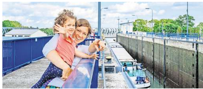
Die Führung "Sülfelder Schleuse" wird vor allem Technikbegeisterte faszinieren.

Mit dem Start der Weihnachtszeit sind auch die beliebten Weihnachtsmarktführungen „HoHo-Hoch“ wieder Teil des Stadtführungsprogramms. Am 28. November sowie am 5., 12. und 19. Dezember geht es für die Teilneh-