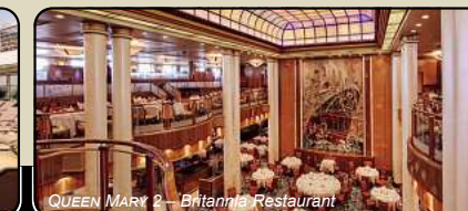
QUEEN MARY 2 – Britannia Restaurant

Buchung und Beratung unter 05302-920 200 kreuzfahrten@fumu-reisen.de • www.fumu-reisen.de/hochseereisen