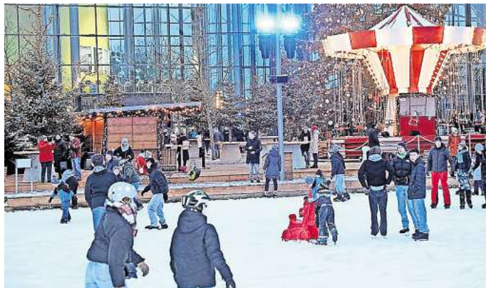
Bummeln, Rodeln, Schlittschuhlaufen: Das Winterwunderland in der Autostadt.

In einer festlichen Winterkulisse lässt es sich an liebevoll dekorierten Ständen verweilen und vieles entdecken. Besucherinnen und Besucher können sich nach handgefertigtem Kunsthandwerk, kleinen Souvenirs sowie klassischen Weihnachtsartikeln oder modernen Accessoires und Spielzeug umsehen. Für das leibliche Wohl sorgen zahlreiche Stände, an denen heißer Punsch, Kaiserschmarrn, Waffeln und Mandeln, Käsespätzle oder Spießbraten serviert werden. Wer es gesellig mag, sollte den beliebten Hüttenzauber direkt an der Eisfläche besuchen. In der großen XXL-Hütte können Gäste bei Feuerzangenbowle und stimmungsvollen Après-Ski-Hits den Abend genießen und in gemütlicher Atmosphäre feiern. Sportlich wird es auf der großzügigen 4.000 Quadratmeter großen Eisfläche. Hier können die Gäste Schlittschuhlaufen oder sich im Curling versuchen.