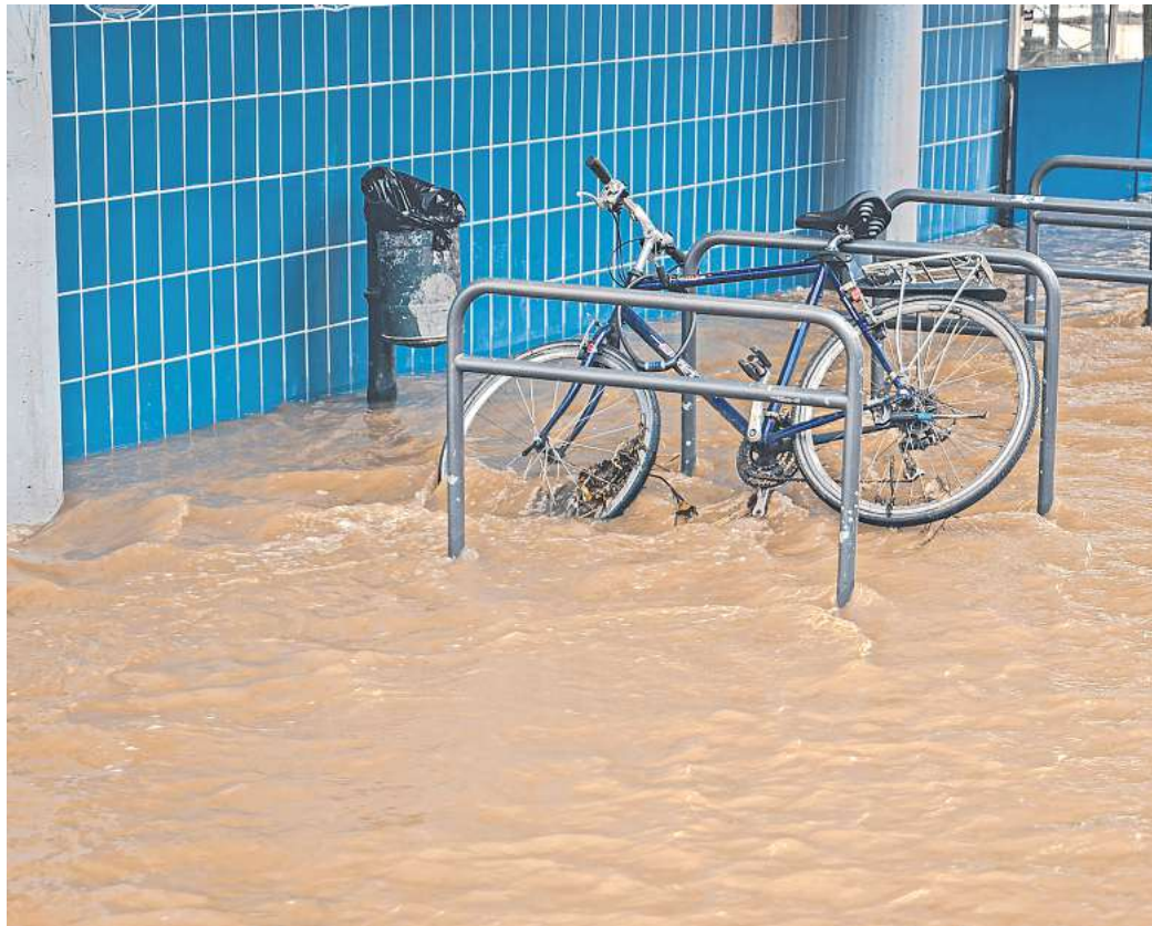
Die Folgen der Flutkatastrophen in unseren Nachbarländern sind dramatisch: zerstörte Ortschaften und Existenzen.

Mit der weiteren Erderwärmung durch die Nutzung fossiler Brennstoffe würden Starkregen-Episoden noch heftiger und häufiger, warnen die Wissenschaftler. Die Kosten der Klimakatastrophen drohten zu eskalieren. „Der Klimawandel ist eine existenzielle Bedrohung, insbesondere für die ärmeren Teile der Gesellschaft, und alle Europäer