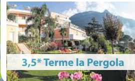
3,5* Terme la Pergola