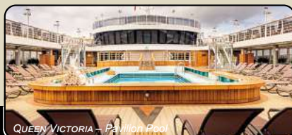
QUEEN VICTORIA – Pavilion Pool