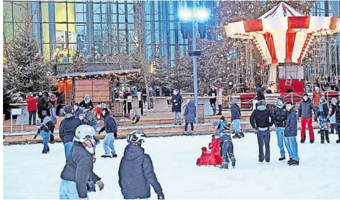
Bummeln, Rodeln, Schlittschuhlaufen: Das Winterwunderland in der Autostadt.

In einer festlichen Winterkulisse lässt es sich an liebevoll dekorierten Ständen verweilen und vieles entdecken. Besucherinnen und Besucher können sich nach handgefertigtem Kunsthandwerk, kleinen Souvenirs sowie klassischen Weihnachtsartikeln oder modernen Accessoires und Spielzeug umsehen. Für das leibliche Wohl sorgen zahlreiche Stände, an denen heißer Punsch, Kaiserschmarrn, Waffeln und Mandeln, Käsespätzle oder Spießbraten serviert werden. Wer es gesellig mag, sollte den beliebten Hüttenzauber direkt an der Eisfläche besuchen. In der großen XXL-Hütte können Gäste bei Feuerzangenbowle und stimmungsvollen Après-Ski-Hits den Abend genießen und in gemütlicher Atmosphäre feiern. Sportlich wird es auf der großzügigen 4.000 Quadratmeter großen Eisfläche. Hier können die Gäste Schlittschuhlaufen oder sich im Curling versuchen.