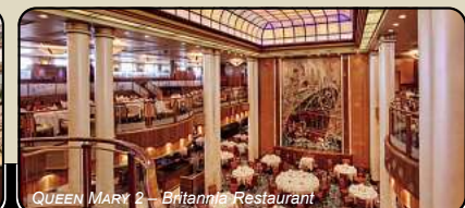
QUEEN MARY 2 – Britannia Restaurant

Buchung und Beratung unter 05302-920 200 kreuzfahrten@fumu-reisen.de • www.fumu-reisen.de/hochseereisen