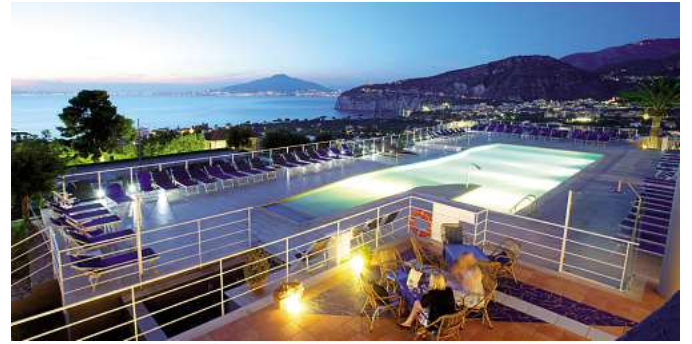
Viele einzigartige Hotelerlebnisse, wie hier das 4* Arthotel Gran Paradiso an der Amalfiküste, sind buchbar.

In allen Zielen kann man aus einem großen und vielfältigen Hotelangebot wählen.