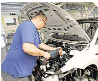
Tarifverhandlungen bei VW: Wird es am Ende trotz der Krise ein Lohnplus für die Mitarbeiter geben?

schätzung wissen: Was glauben Sie, werden die Tarifverhandlungen mit einem Lohnplus für die VW-Beschäftigten enden? Machen Sie mit bei unserer Umfrage und gewinnen Sie einen 50-Euro-Gutschein von Media Markt. Einfach den QR-Code scannen oder diesem Link folgen: https://aktion.waz-online.de/umfrage/tarif24 .