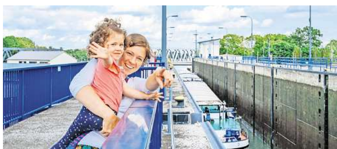
Die Führung "Sülfelder Schleuse" wird vor allem Technikbegeisterte faszinieren.

Mit dem Start der Weihnachtszeit sind auch die beliebten Weihnachtsmarktführungen „HoHo-Hoch“ wieder Teil des Stadtführungsprogramms. Am 28. November sowie am 5., 12. und 19. Dezember geht es für die Teilneh-