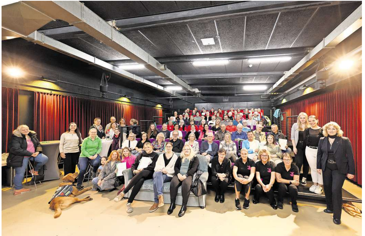
Teilnehmer und Gewinner der Aktion Gemeinsam helfen trafen sich im Wolfsburger Hallenbad.

Das große Engagement der Wolfsburger betonte auch WAZ-Geschäftsführer Carsten Winkler: „Wir wollten erneut nicht allein auswählen, welche Projekte besonders förderungswürdig sind. Deshalb haben wir im siebten Aktionsjahr wieder unsere Leserinnen und Leser entscheiden lassen, welche Initiativen es auf die vorderen drei Plätze schaffen. Denn verdient hätte es jedes Projekt“, so Winkler, der hinzufügt: „Mehr als 2500 Stimmen wurden beim Online-Voting abgegeben, so viele wie noch nie, die Hilfsbereitschaft in Wolfsburg ist nicht