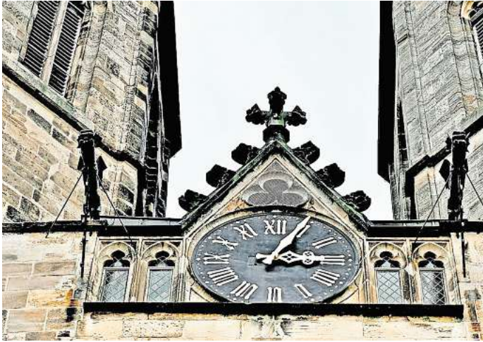
Direkt zur Umfrage: Einfach den QR-Code mit dem Smartphone-scannen.

WAZ-Umfrage mitmachen und Chance auf 50-Euro-Gutschein von Media Markt sichern