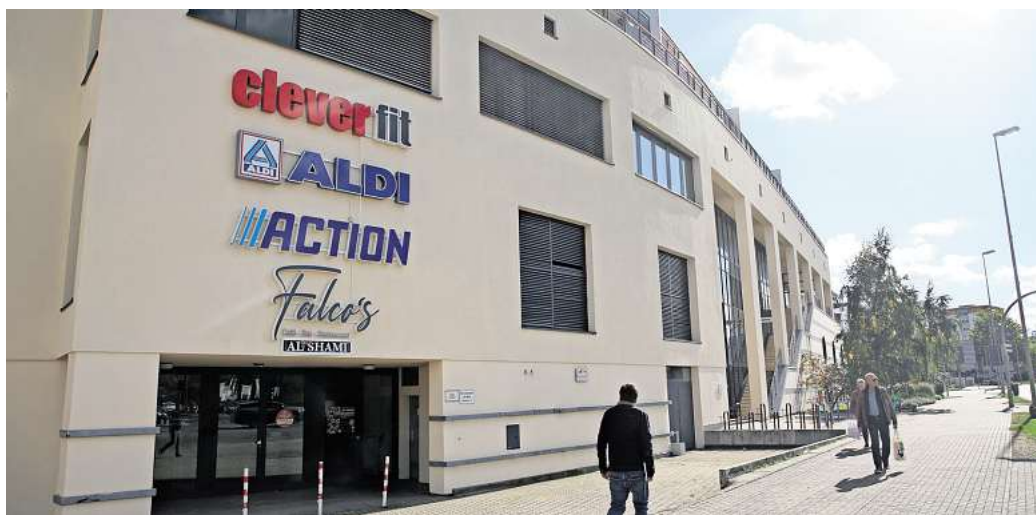
Auf der Rückseite der Museums-Arcaden soll ein Fahrstuhl gebaut werden. Die Installation verzögert sich.