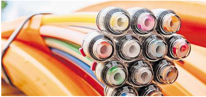
Glasfaseranschlüsse: Noch bis 30. November können diese kostenlos ans Haus verlegt werden.

Seit August haben die Hausbegehungen durch die netzkontor nord GmbH begonnen. Während dieser Besprechung wird gemeinsam mit den Hauseigentümern der Bau des Glasfaser-Hausanschlusses besprochen. Die netzkontor nord GmbH meldet sich proaktiv bei all denjenigen, die bereits einen Glasfaser-