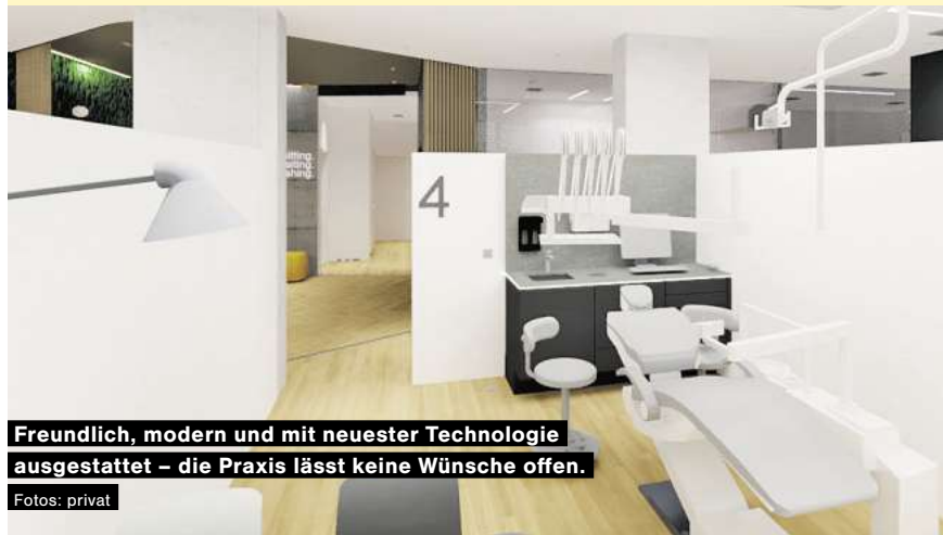
Freundlich, modern und mit neuester Technologie ausgestattet – die Praxis lässt keine Wünsche offen.