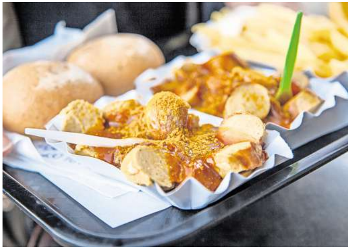
Wo gibt es in Wolfsburg die beste Currywurst?

Die WAZ hat eine Top-Ten-Liste aus etlichen Leserstimmen erstellt. Jetzt können Sie final wählen.