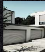
Garagentore Deckenlauftore Kastenrolltore