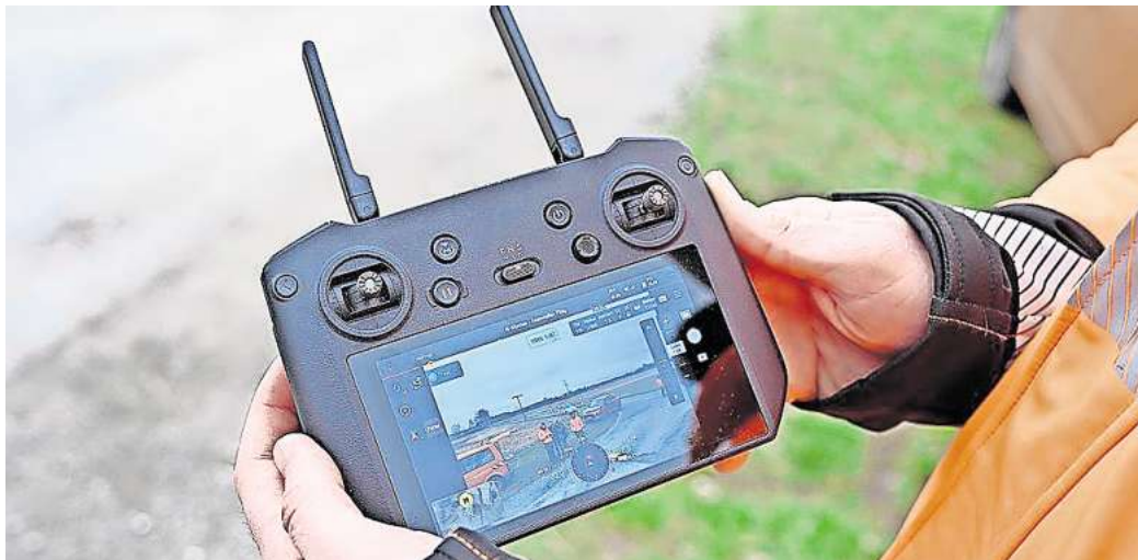
Bei den Katasterämtern hat moderne Technik Einzug gehalten. Hier erfolgt eine Vermessung per Drohne.

Von den insgesamt gut 1.500 Beschäftigten müssten rund 290 an den jeweils aufzunehmenden Standort innerhalb der