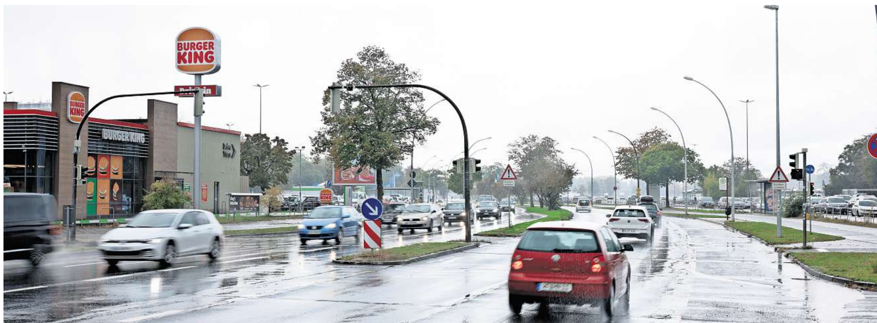
Die Sanierung der Fahrbahn auf der Heinrich-Nordhoff-Straße wird 2025 zwischen Lessingstraße und Saarstraße fortgesetzt.