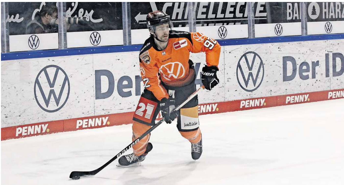
Am 20. Oktober treffen die Grizzlys Wolfsburg in der EisArena auf die Eisbären Berlin. (Symbolbild)

Direkt zur Verlosung: Einfach den QR-Code mit dem Handy scannen.