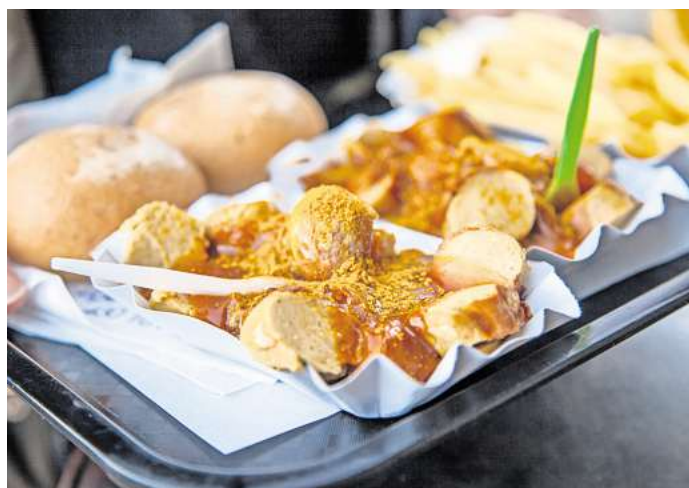
Wo gibt es in Wolfsburg die beste Currywurst?

Die WAZ hat eine Top-Ten-Liste aus etlichen Leserstimmen erstellt. Jetzt können Sie final wählen.