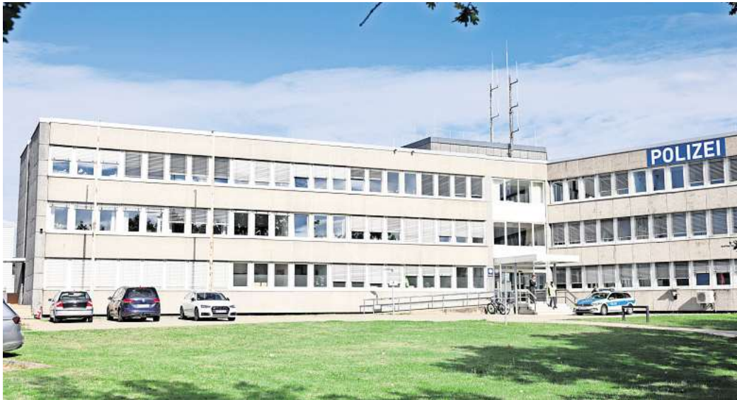
In die Jahre gekommen: Das 1971 errichtete Gebäude der Polizeiinspektion Wolfsburg-Helmstedt ist marode.

Zudem fordert die Gewerkschaft, marode Gebäude zu mo-