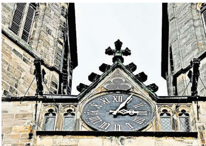
Direkt zur Umfrage: Einfach den QR-Code mit dem Smartphone-scannen.

WAZ-Umfrage mitmachen und Chance auf 50-Euro-Gutschein von Media Markt sichern