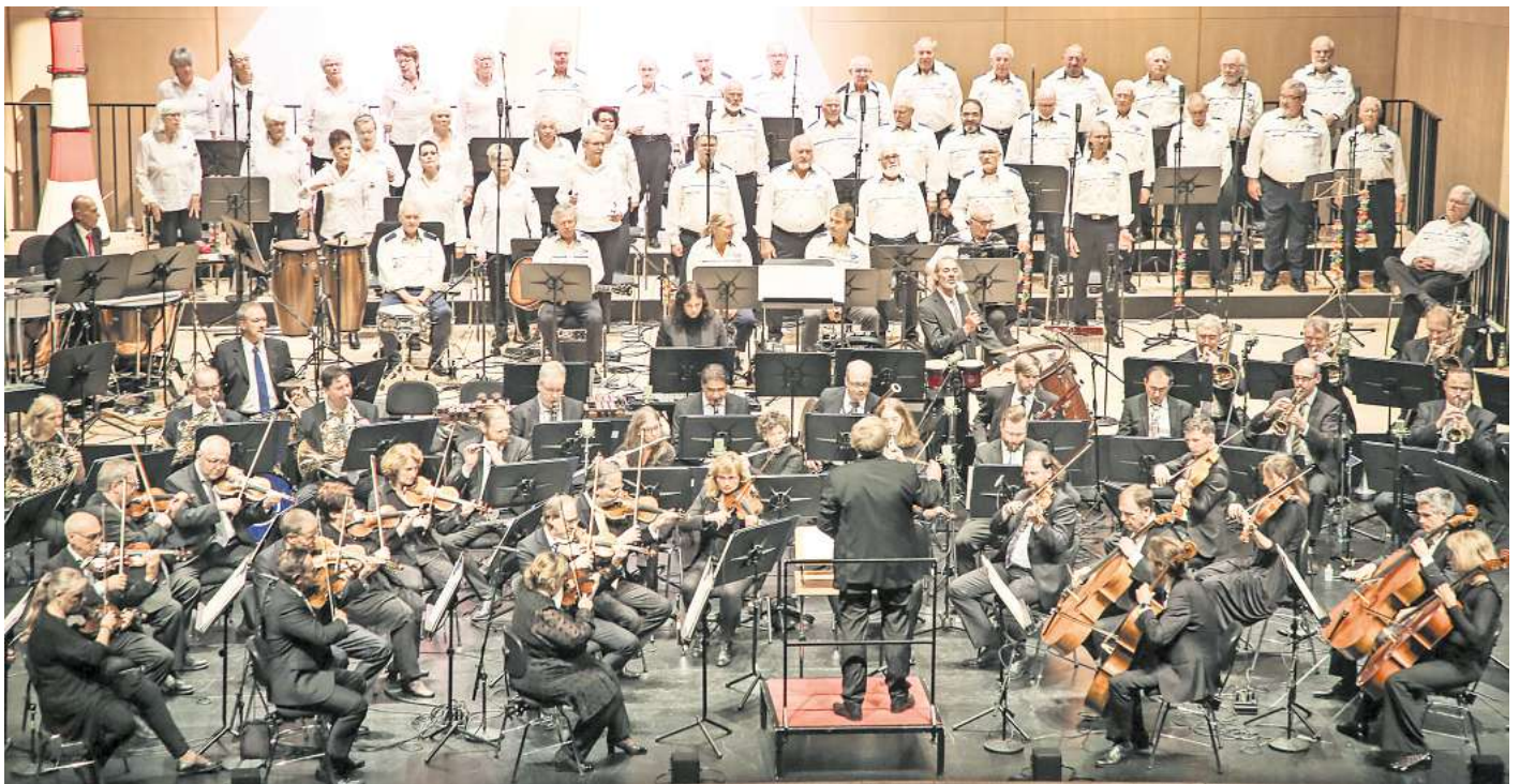
Shanty, Swing & More: Maritimer Chor und Philharmonic Volkswagen Orchestra begeistern im Scharoun-Theater.

Das gilt auch für Titel wie „Capitano“, „Rolling home“ oder „I am sailing“. Der lebendige Ausdruck des Gesangs bleibt erhalten, während er zu sinfonischer Größe anwächst. Auf den Klangkörper zugeschnitten, schreibt Ingo Laufs (Musikhochschule Hannover) seit Jahren die perfekten Arrangements.