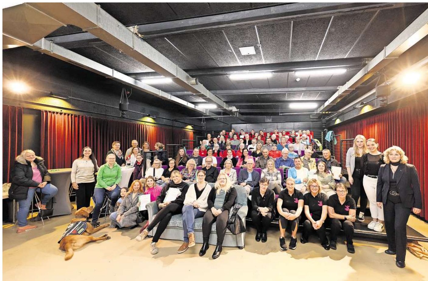
Teilnehmer und Gewinner der Aktion Gemeinsam helfen trafen sich im Wolfsburger Hallenbad.

Das große Engagement der Wolfsburger betonte auch WAZ-Geschäftsführer Carsten Winkler: „Wir wollten erneut nicht allein auswählen, welche Projekte besonders förderungswürdig sind. Deshalb haben wir im siebten Aktionsjahr wieder unsere Leserinnen und Leser entscheiden lassen, welche Initiativen es auf die vorderen drei Plätze schaffen. Denn verdient hätte es jedes Projekt“, so Winkler, der hinzufügt: „Mehr als 2500 Stimmen wurden beim Online-Voting abgegeben, so viele wie noch nie, die Hilfsbereitschaft in Wolfsburg ist nicht