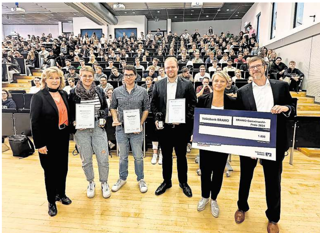
Für herausragendes ehrenamtliches Engagement: Zum Start des neuen Semesters wurden vier Studierende des Campus Wolfsburg geehrt.

Anlässlich der Erstsemesterbegrüßung fand auch die Verleihung des Brawo-Gemeinwohl-Preises statt. Mit diesem Preis würdigen die Volksbank Brawo, das Engagement-Zentrum als gemeinwohl-