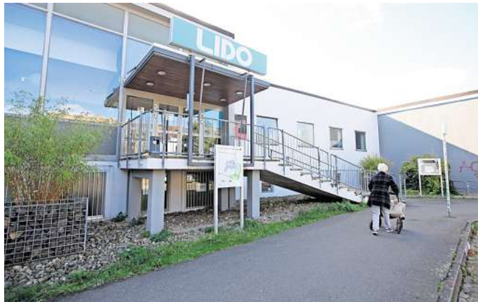
Keine Gastronomie mehr: Das Lido hat dauerhaft geschlossen.

Ursprünglich gab es dort sowohl die Abendgastronomie als auch einen Mittagstisch. Letzterer wurde in der Coronazeit eingestellt und im Gegensatz zur