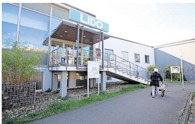
Keine Gastronomie mehr: Das Lido hat dauerhaft geschlossen.

Ursprünglich gab es dort sowohl die Abendgastronomie als auch einen Mittagstisch. Letzterer wurde in der Coronazeit eingestellt und im Gegensatz zur