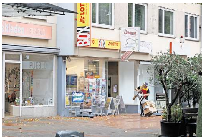
Kiosk an der Porschestraße in Wolfsburg: Zur City Shop West GmbH gehören drei Filialen in Wolfsburg sowie eine in Gifhorn.