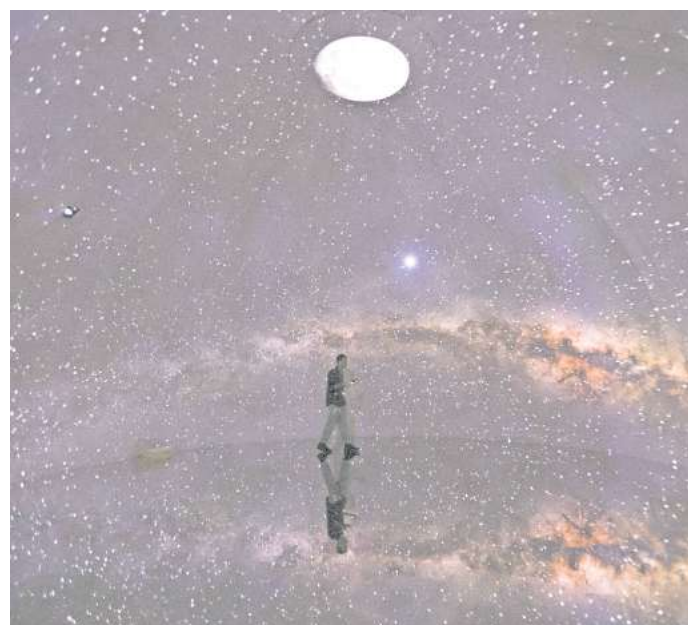
Spaziergang durch die Milchstraße: Besucher im Inneren der Großskulptur „Moon“ von Leandro Erlich.

Beitin hatte den argentinischen Künstler Erlich eingeladen, für seine erste Einzelausstellung in Deutschland die gro-