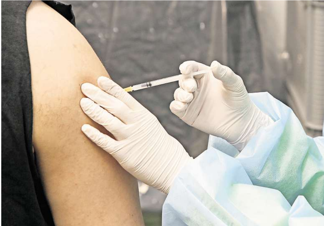
Umfrage: Lassen Sie sich gegen Grippe und Corona impfen?

Laut dem Robert Koch-Institut (RKI) ist eine Basisimmunität dann erreicht, wenn das Immunsystem dreimal Kontakt mit Bestandteilen des Erregers (Impfung) oder dem Erreger selbst (Infektion) hatte. Mindestens einer der drei Kon-