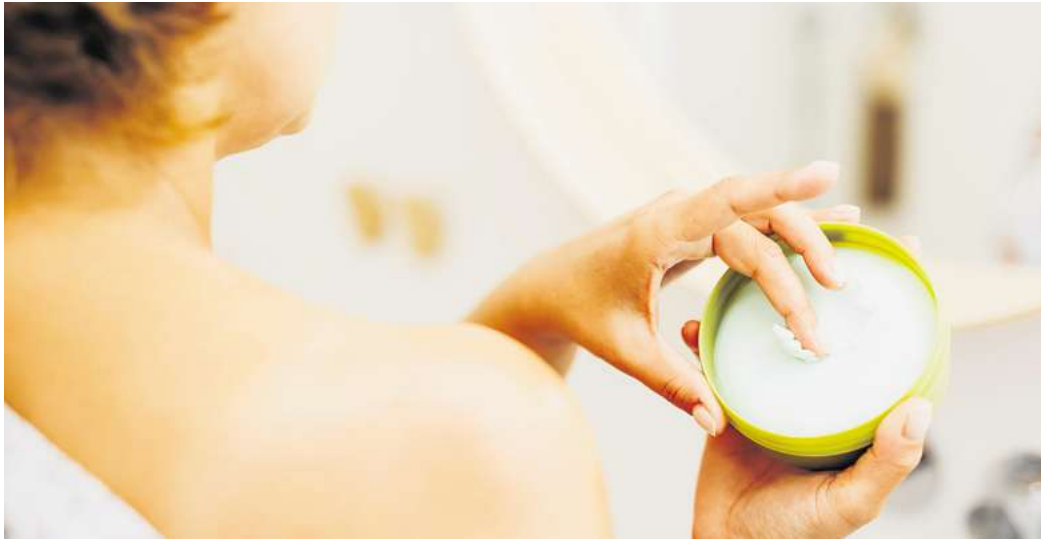
Weichmacher können unter anderem durch Kosmetikprodukte in den Körper gelangen.

Auch bei der Textilveredlung werden weichmachende Substanzen eingesetzt, um die Griffigkeit und Geschmeidigkeit von Stoffen zu verbessern. Neben Harzen, ölartigen Stoffen und Naturstoffen werden häufig Phthalate eingesetzt. Dabei handelt es sich um chemische Substanzen, die eine schädigende Wirkung haben können. Kein Weichmacher im eigentlichen Sinn ist die Substanz Bisphenol A (BPA), die zum Beispiel in Plastikdosen und Trinkflaschen enthalten ist sowie in der