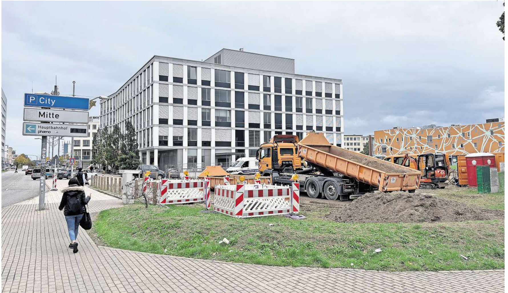
Bauarbeiten am Nordkopf haben begonnen: Als Vorbereitung für den Neubau werden derzeit Fernwärmeleitungen verlegt.