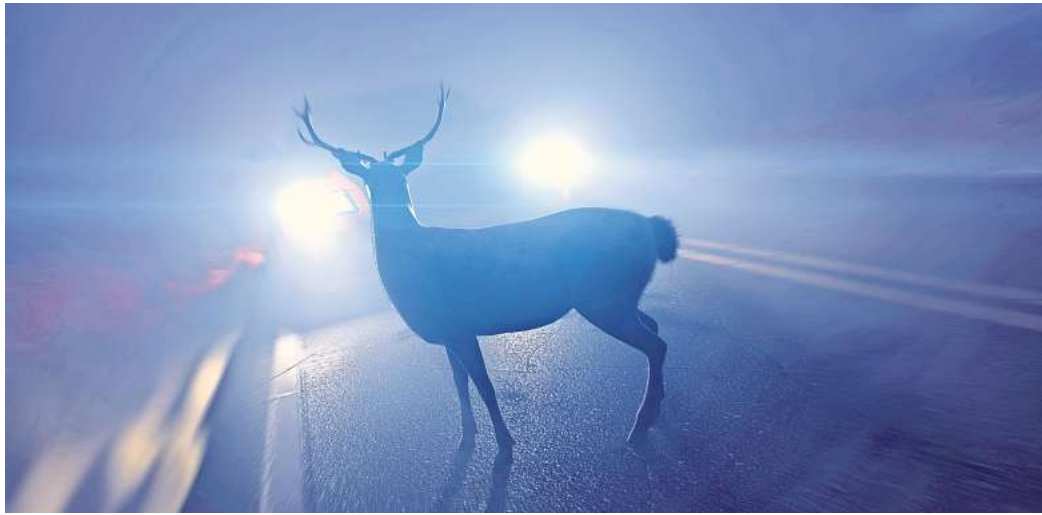
Wildunfälle im Herbst: Autofahrer sollten besonders aufpassen.

Kreisjägermeister verrät, worauf Autofahrer jetzt achten sollten