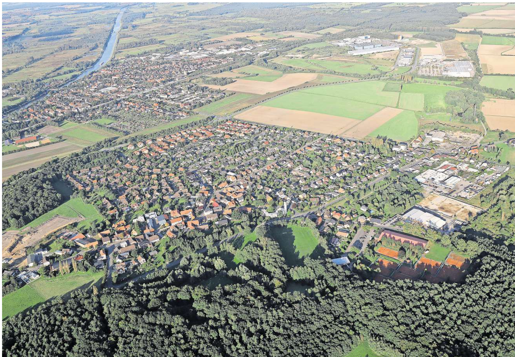
Reislingen: Südlich der Sandkrugstraße soll ein neues Wohngebiet entstehen. Anlieger waren jetzt zur Bürgerbeteiligung eingeladen.