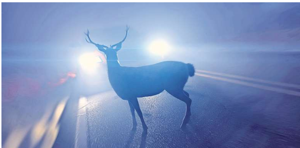
Wildunfälle im Herbst: Autofahrer sollten besonders aufpassen.

Kreisjägermeister verrät, worauf Autofahrer jetzt achten sollten