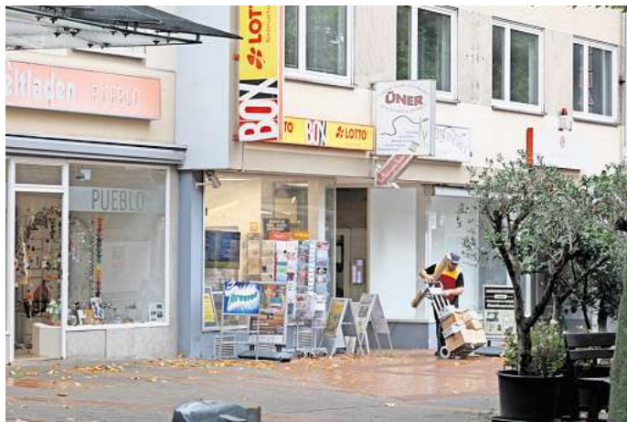
Kiosk an der Porschestraße in Wolfsburg: Zur City Shop West GmbH gehören drei Filialen in Wolfsburg sowie eine in Gifhorn.

„Aufgrund der Zeitungsberichterstattung haben sich diverse Übernahmeinteressenten gemeldet“, teilte Hartwig auf WAZ-Anfrage mit. Es sei ein Bieterverfahren eingeleitet worden. Zwei große Player aus der Branche sollen Interesse haben. „Alle mir bisher vorliegenden Angebote beinhalten die Übernahme aller Filialen und aller Arbeitsplätze“, so Hartwig. Die City Shop West GmbH betreibt drei Kioske in