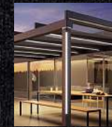
Terrassen- überdachungen Glasoasen Markisen