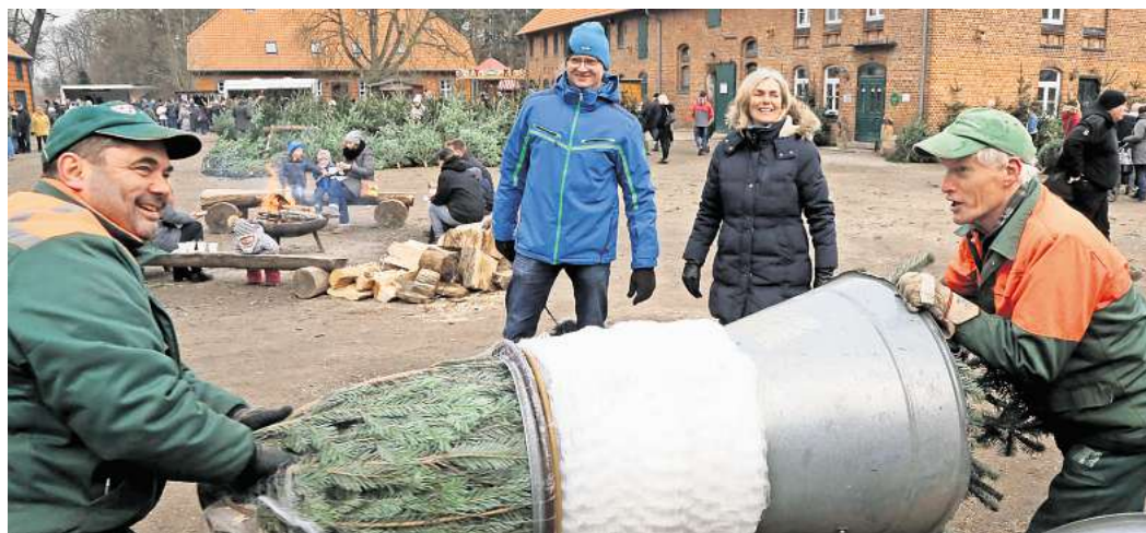
Weihnachtsbaumverkauf auf dem Gutshof in Kaiserwinkel: Zum besseren Transport werden die Bäume eingepaket.