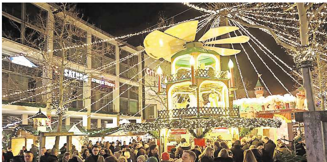
Achtung, es weihnachtet sehr: Der Wolfsburger Weihnachtsmarkt in der Porschestraße startet am 25. November.

„Das stimmungsvolle Programm hält tolle Attraktionen für die