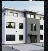
Fenster & Rollläden Schiebeanlagen Faltanlagen

V. Gloger Direktförderung ohne komplizierte Antragstellung auf alle Produkte