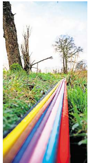
Verlegung von Glasfaser-Leitungen - das schnelle Internet soll in Wolfsburg bald flächendeckend nutzbar sein.

Die Voraussetzungen für einen kostenlosen Anschluss sind, dass sich die Bewohner der betroffenen Gebiete bis zum 30. November 2024 für einen Glasfaseranschluss entscheiden, eine Grundstücksnutzungsvereinbarung unterzeichnen und die Wobcom beauftragen. Beides können Interessierte sowohl persönlich als auch online erledigen. Weitere Informationen gibt es im Internet unter: www.wobcom.de/graue-flecken . Außerdem können sich alle Glasfaser-Interessenten im Wobcom-Kundencenter an der Heßlinger Straße 1-5 in Wolfsburg persönlich beraten lassen.