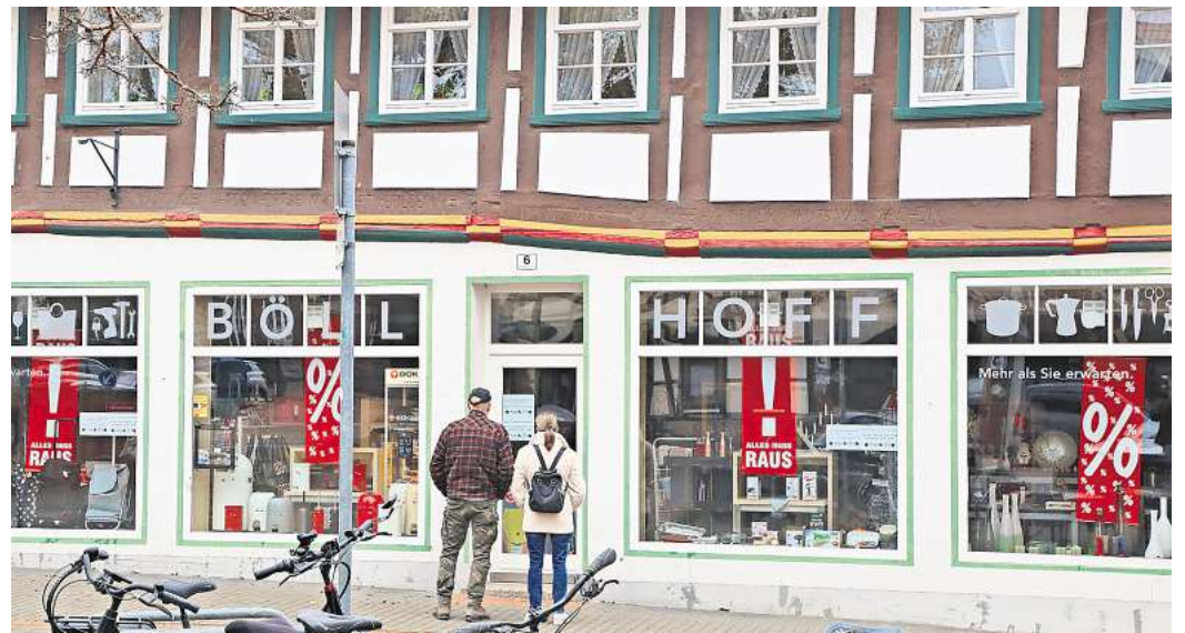
Auch bei Böllhoff hat der Räumungsverkauf begonnen.

Ihr Geschäft sei jedoch mehr gewesen als ein Laden, in dem man etwas kauft und dann wieder geht. Hier habe es auch persönliche Kontakte gegeben.