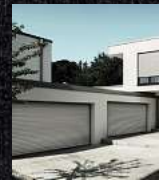
Garagentore Deckenlauf- kastenroll- tore