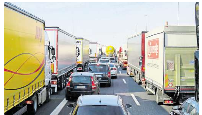
Auf der A2 zwischen Rennau und Königslutter brauchen Autofahrer jede Menge Geduld.

Die Autobahn GmbH bittet um Verständnis für die notwendigen Arbeiten und um erhöhte Aufmerksamkeit auf den Umleitungsstrecken.