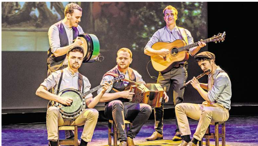
THE CELTIC SPIRIT – Achtung, Kundenfoto! Nur nach Absprache mit LM Redaktion zu verwenden. Verlosung Celtic Spirit Christmas WOB

Das irische Weihnachtskonzert nach keltischer Art kommt nach Wolfsburg: Gewinnen Sie 3 x 2 Karten