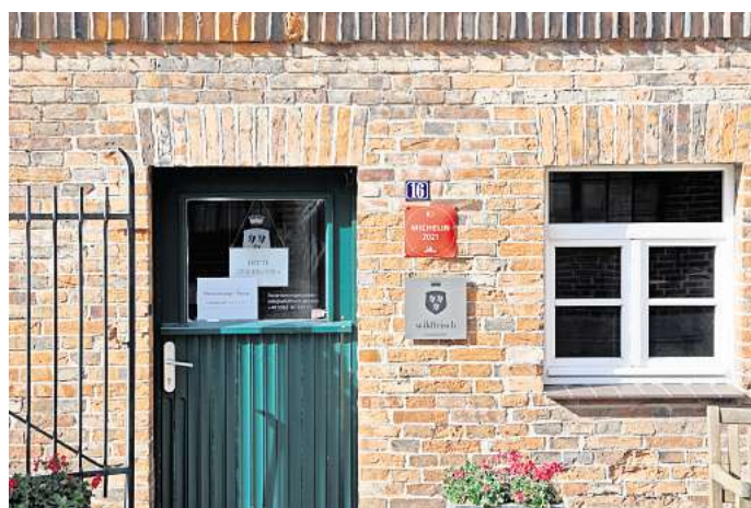
„Wildfrisch“ in Nordsteimke: Das Restaurant soll demnächst wieder eröffnen.

Christian Heymer, kulinarischer Direktor der „mein.lieblingsort“-Hotels und kreativer Kopf der anderen „fritz“-Restaurants, sieht mit dem Team des „Wildfrisch“ den neuen Möglichkeiten mit großer Begeisterung entgegen. Heymer beschreibt seine Küche als stetigen Gedankenaustausch untereinander. Verbunden mit herausragendem Können und ausgewählten lokalen Produkten sei dies die Grundlage für eine ganz persönliche Interpretation der Speisekarte des Wildfrisch – ganz im „fritzstyle“ mit überraschenden