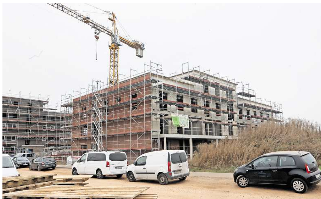
Baustelle im Sonnenkamp: Die neue Kita soll im September 2025 den Betrieb aufnehmen.