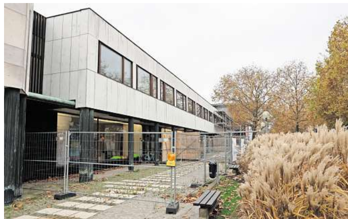
Schon lange eingerüstet: das Alvar-Aalto-Kulturhaus.

Mit dem Start der Lokalität am Allersee ist der Gastronom zufrieden. „Es ist sehr gut angelaufen.“ Es kämen viele Gäste, die neugierig seien. Zudem habe er bereits viele Reservierungen für Hochzeiten und Geburtstage vorliegen. Für ihn sei es „der schönste Arbeitsplatz der Stadt“. Geöffnet hat das Aalto am See im Winterhalbjahr von Montag bis Samstag jeweils ab 17 Uhr, ledig-