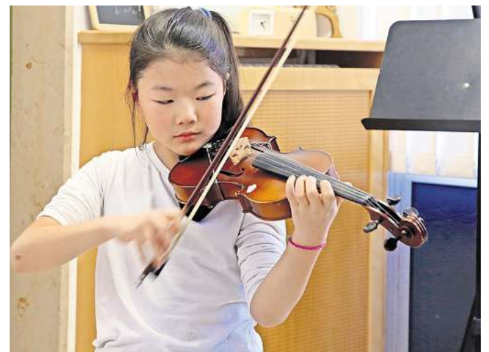
Die Gebühren für Kurse an der Musikschule der Stadt Wolfsburg sollen steigen.