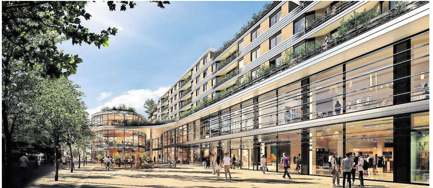
So könnten die BraWo Arkaden einmal aussehen wenn die beiden Bauabschnitte fertig sind.

Damit die Pläne des Investors umgesetzt werden können, war ein sogenannter Satzungsbeschluss durch den Rat der Stadt nötig. Dieser städtebauliche Vertrag regelt unter anderem die konkreten Nutzungen im Gebäude, den Ablauf der Bauleitplanung, notwendige Planungen und Anpassungen an den angrenzenden Straßen und Gehwegen sowie die Kostenübernahme hierfür. Die Wünsche der