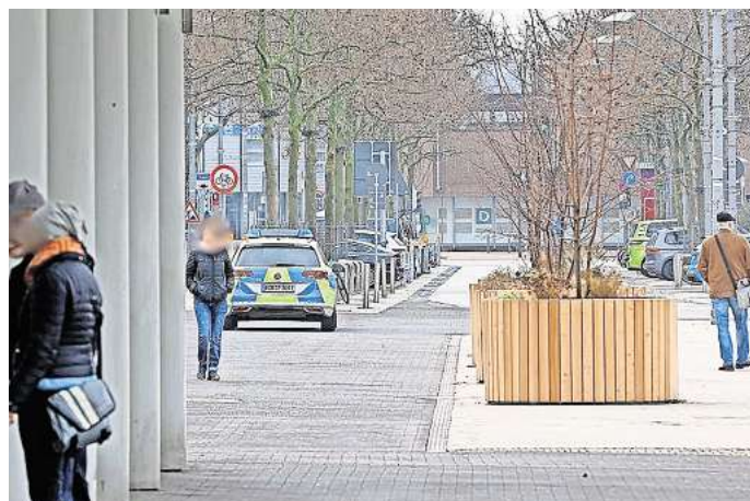
Polizeiwagen am Nordkopf in Wolfsburg: Nach einem gewaltvollen Streit hatte die Polizei einen Tatverdächtigen im März festgenommen.

Die Waffenverbotszone ist damit eine wichtige Ergänzung des Teilprojektes Aufenthaltsqualität der Kampagne Perspektive Innenstadt. Bereits im Sommer 2022 startete die Wolfsburg Wirtschaft und Marketing GmbH (WMG) die Innenstadt-Kampagne Ehrensache, die einen Fokus auf Sauberkeit und Sicherheit in Wolfsburgs Innenstadt legt und in diesem Zuge die Porschestraße zur Ehrenzone erklärte.