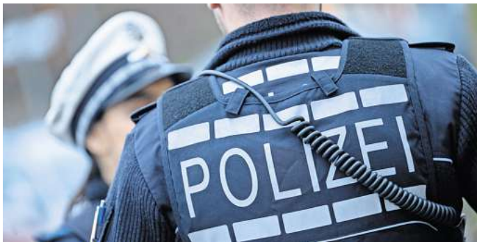
Versuchte Vergewaltigung in Hattorf: Die Polizei sucht nach Zeugen.

Die Ermittler suchen nach Zeugen, die verdächtige Beobachtungen gemacht haben oder den Täter aufgrund der Beschreibung erkennen. Hinweise können unter der Telefonnummer 05361/46460 gemeldet werden. Zusätzlich bittet die Polizei darum, keine Spekulationen oder Gerüchte über den Täter zu verbreiten. Stattdessen sollen relevante Informationen direkt mitgeteilt werden. Auch Fotos oder Videos, die mit der Tat in Verbindung stehen könnten, können an pressestelle@piwob.polizei.niedersachsen.de gesendet werden. Durch das schnelle Eingreifen aufmerk-