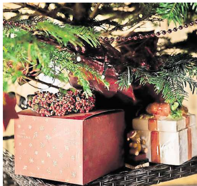
Die Teilnahme ist ganz einfach: Scannen Sie den QR-Code mit dem Smartphone.