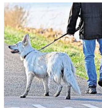
Hunde müssen in Wäldern und Gehölsen ab sofort wieder an die Leine genommen werden.

Ganzjährig gilt die Leinenpflicht für Hunde im Wendschotter Drömling, Barnbruch und Ilkerbruch. Ebenso gilt die Leinenpflicht im Allerpark Wolfsburg bis auf den eigens für Hunde eingerichteten Hundefreilauf am östlichen Ufer des Allersees. In der Porschestraße, auf dem Sara-Frenkel-Platz und auf dem Willy-Brandt-Platz sind Hunde generell an der Leine zu führen. Die Anleinenpflicht gilt außerdem bei Umzügen, Veranstaltungen, Festen und nach Einbruch der Dunkelheit.