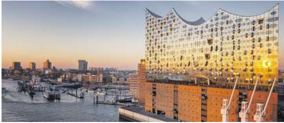
Gilt als das berühmteste Konzerthaus Europas: Die Hamburger Elbphilharmonie

und bemerkenswerter Akustik ist, so eng ist die Bindung der Braunschweiger zu „Ihrem“ Staatsorchester. Beides, sozusagen in Eintracht, zu erleben, dazu hat man 2025 die Gelegenheit. Der Reiseanbieter „DER SCHMIDT“ mietet die Elbphilharmonie und lässt dort exklusiv das Braunschweiger Staatsorchester auftreten.