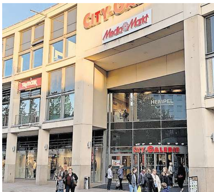
In der City Galerie in der Porschestraße siedeln sich neue Mieter an.

Mit dem Einzug von Ernsting's Family rücke das Thema Familie in der City-Galerie stärker in den Vordergrund, so Schwarzkopf. Er hoffe, dass nach dem Modegeschäft im nächsten Jahr zügig noch weitere Mieter für die leerstehenden Flächen gewonnen werden können.