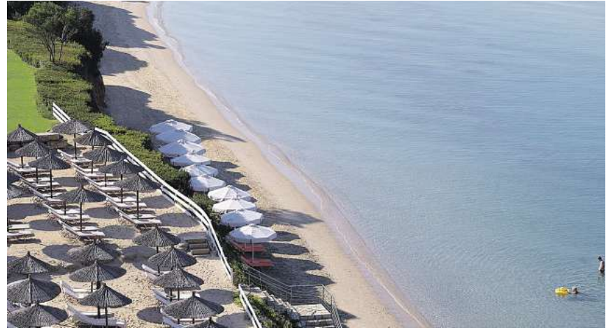
Besondere Hotellebnisse an Traumstränden, wie hier im 5* Premium Iston Club auf der Chalkidiki, sind buchbar

Wer auf Lust auf Traumstrände, Gastfreundschaft und Naturhighlights hat, der sollte vielleicht einmal einen echten Geheimtipp in Griechenland in Betracht ziehen: Die Chalkidiki. Diese 3 Landzungen mit den „Fingern“ Kassandra, Sithonia und Athos südlich von Thessaloniki bieten nicht nur beste Bademöglichkeiten, sondern viel Natur und Kultur rundherum. Die „Blaue Fahne“, die vielen Küstenabschnitten verliehen wurde, zeugt von bester Wasserqualität. Aus der Ferne kann man den sagenumwobenen Berg Olymp erkennen und viele Sehenswürdigkeiten wie z. B. die weltbekannten Meteora Klöster sind auf Tagesausflügen erreichbar. Auch eine Bootsfahrt entlang der Mönchrepublik Athos oder ein Besuch von Thessaloniki selbst bieten sich an. Vielfältige Hotels – vom Top Preis bis zum Premium – sind wähl- und bereits ab € 699,- inkl. Flug buchbar.