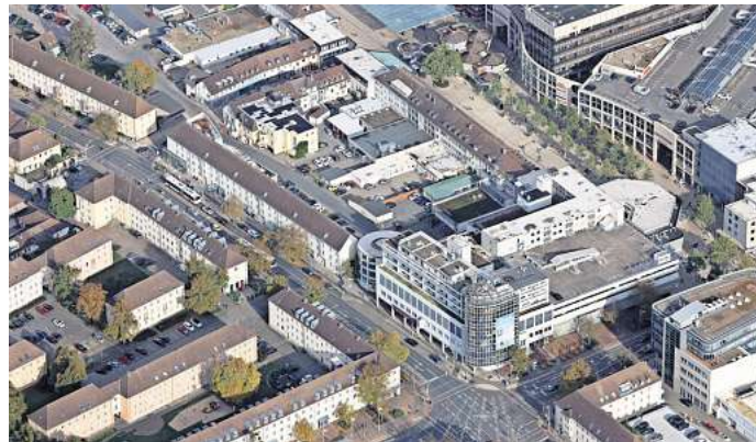
Wolfsburg von oben: Das Areal rund um Schillergalerie, Sparkasse und City-Galerie.