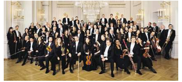
Exklusiv am Samstag, 22. Februar in der Elbphilharmonie: das Braunschweiger Staatsorchester

Um diesem Ereignis beiwohnen zu können hat DER SCHMIDT verschiedene Reisepakete geschnürt. Ob Tagesfahrt oder mit Übernachtung, ob günstige