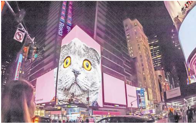
In New York City und anderen Orten der Welt gibt es Katzen, die immer wieder Reisende anlocken und begeistern.

Die viele Katzen in Istanbul sind kein Phänomen der Neuzeit. Schon zu Zeiten des Osmanischen Reichs lebten sie zu Tausenden in den Straßen der Stadt.