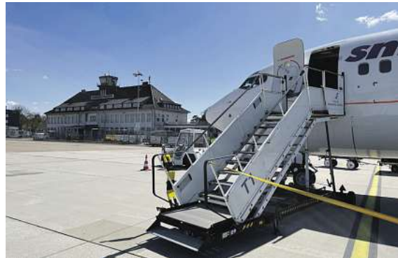
Einzigartige Erlebnisse direkt ab Braunschweig angefliegen: Exklusiv mit momento by DER SCHMIDT

Den Katalog, weitere Informationen und Buchungsmöglichkeit dieser exklusiven Angebote unter der kostenfreien (aus dem dt. Festnetz) Buchungshotline T. 08 00 / 38 300 38 (Mo-Fr. 9–18, Sa. 9–13 Uhr), im FIRST Reisebüro Schmidt und weiteren Reisebüros oder unter www.fliegen-ab-braunschweig.de .