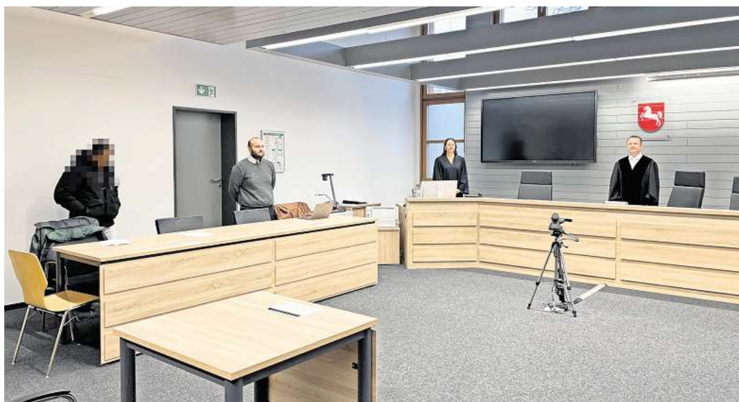
Amtsgericht Wolfsburg: Ein 28-Jähriger hat kinderpornografische Dateien heruntergeladen und gespeichert.

Nach dem Herunterladen speicherte der Angeklagte die Dateien auf verschiedenen Geräten. Bei der Durchsuchung am 31. März 2023 entdeckte die Polizei einen USB-Stick, eine SD-Karte, einen Laptop und verschiedene Telefone. Insgesamt sind in der Wohnung des Angeklagten acht Gegenstände sichergestellt worden. Dem Richter zufolge waren