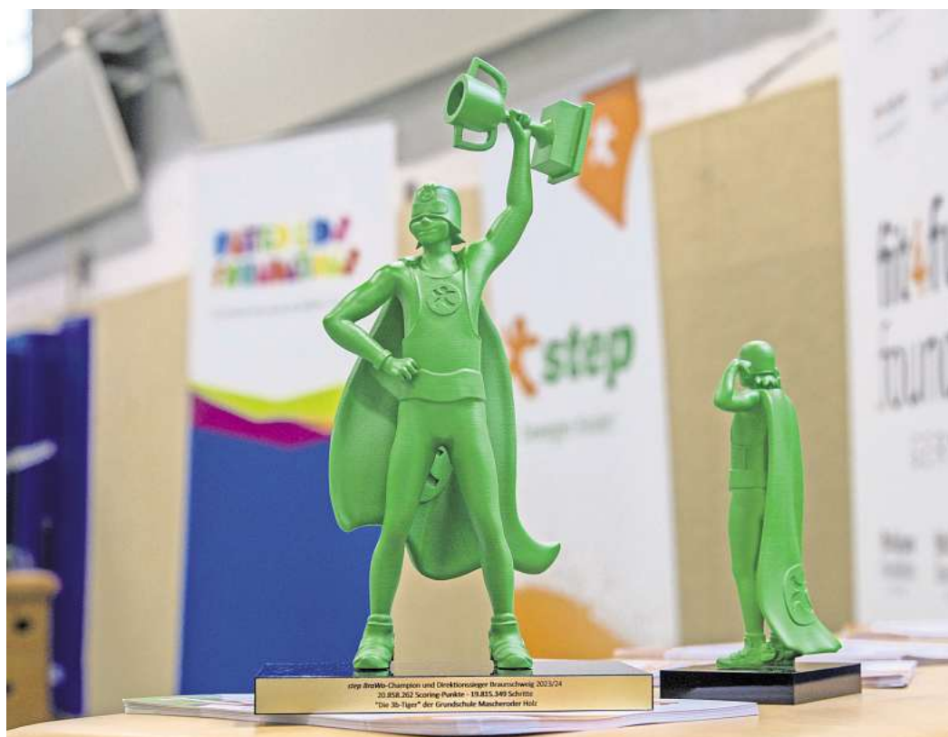
Schritte für den grünen Champion-Pokal: Die Brawo-Stiftung veranstaltet wieder einen Schrittwettbewerb.