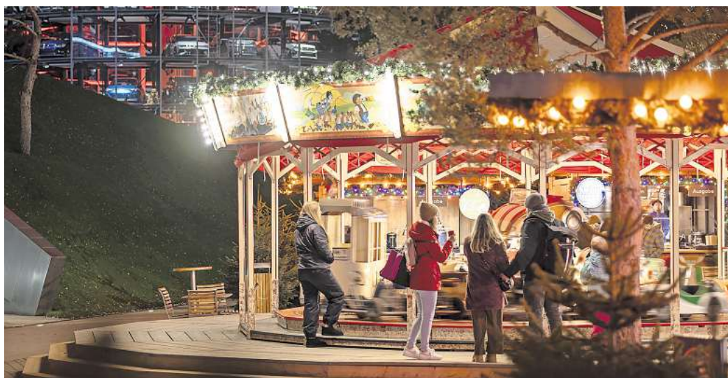
Der Weihnachtsmarkt in der Autostadt. Für viele ist er fast schon Tradition.

Direkt zur Umfrage: Einfach den QR-Code mit dem Handy scannen.