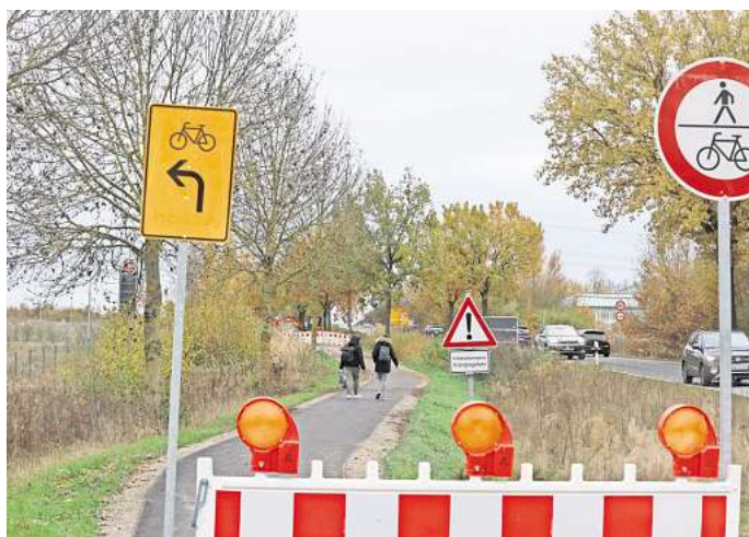
Umleitung: Der frisch sanierte Radweg an der L294 ist in Höhe des Industriegebietes Heinenkamp II gesperrt.

Die Landesbehörde teilte auf Anfrage mit, dass die Arbeiten abgeschlossen seien, und verwies an die Stadt. Der Grund für die derzeitige Baustelle liegt unter dem Radweg: „Die Wolfsburger Entwässerungsbetriebe