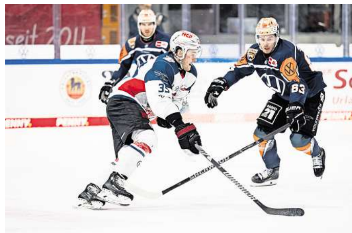
Für das Spiel der Grizzlys Wolfsburg gegen die Nürnberg Ice Tigers können Hallo-Leser Tickets gewinnen.

Direkt zur Verlosung: Einfach den QR-Code mit dem Handy scannen.