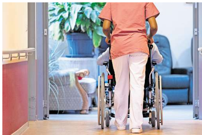
Blick in ein Pflegeheim: Die Belastung der Wolfsburger Stadtkasse durch Sozialhilfe für Heimbewohner ist stark gestiegen.