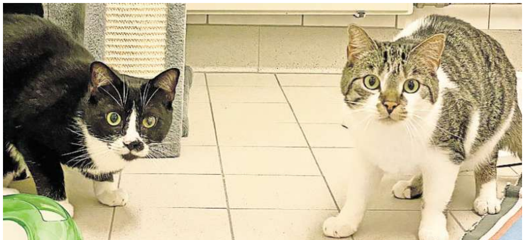
Suchen eine Pflegestelle: Die Kater Krickel (r.) und Krackel sind Wolfsburgs Heimtiere des Monats.

Wer sich vorstellen kann, den beiden Jungs ein neues Zuhause zu geben, wer Fragen zu FeLV hat, kann einen Termin mit dem Tierheim vereinbaren: dienstags bis donnerstags 10 bis 12 Uhr Tel. (05362) 51063, außerhalb der Sprechzeiten läuft der Anrufbeantworter.