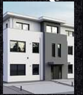
Fenster & Rollläden Schiebeanlagen Faltanlagen

V. Gloger Direktförderung ohne komplizierte Antragstellung auf alle Produkte