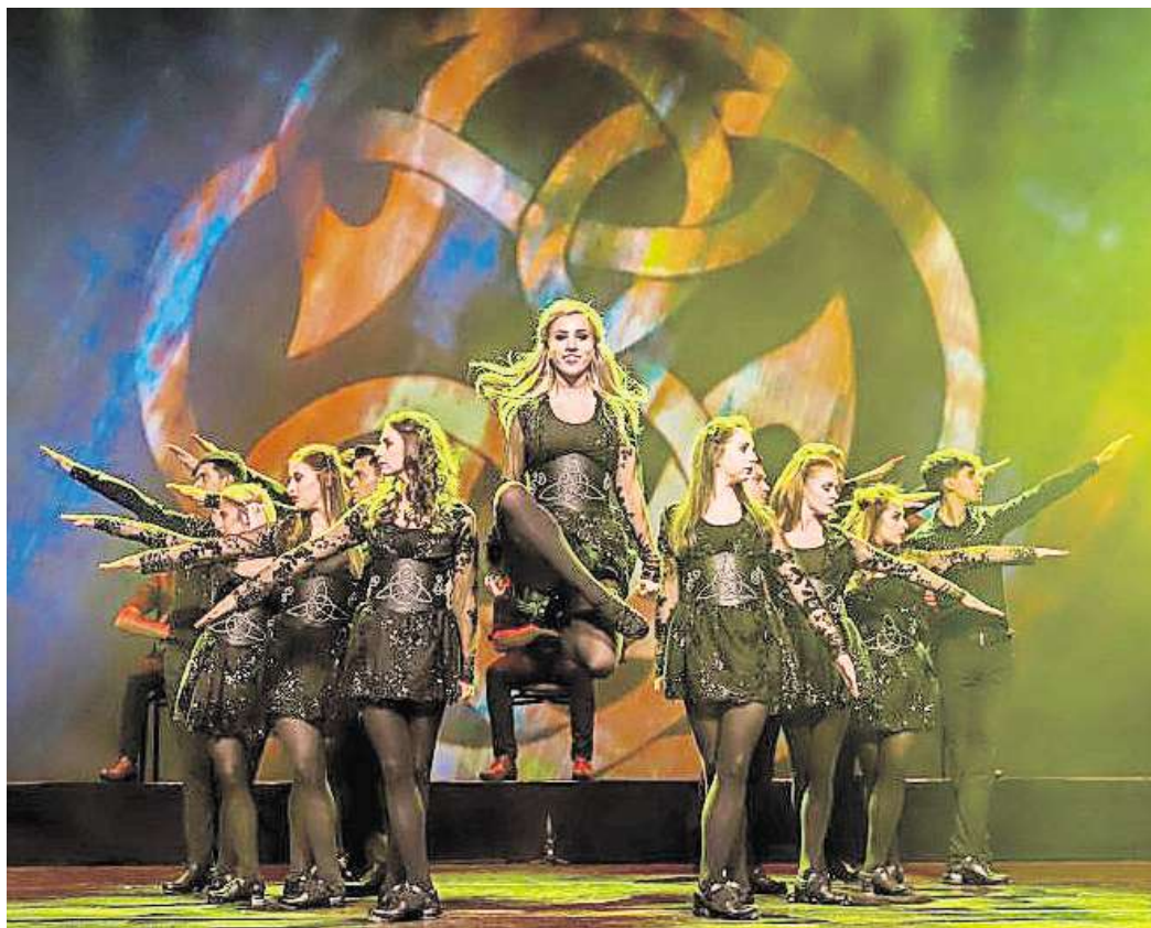
Jubiläumsshow: Rhythm of the Dance kommt im Januar 2025 in die Stadthalle Gifhorn.

Direkt zur Verlosung: Einfach den QR-Code mit dem Handy scannen.