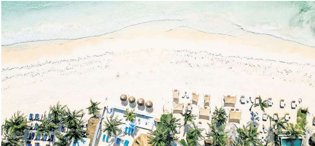
Der weißeste Strand der Welt befindet sich laut dem Ranking in Mexiko.

Der Tulum Beach ist laut der Analyse von CV Villas der weißeste Strand der Welt. Dieses weiße Wunder findest du an der Karibikküste Mexikos, angrenzend an die Küstenstadt Tulum auf der Halbinsel Yucatán. Hier trifft schneeweißer Pudersand auf kristallklares Meerwasser – ein echtes Postkartenmotiv. Ab-