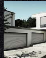
Garagentore Deckenlauffore Kastenrolltore