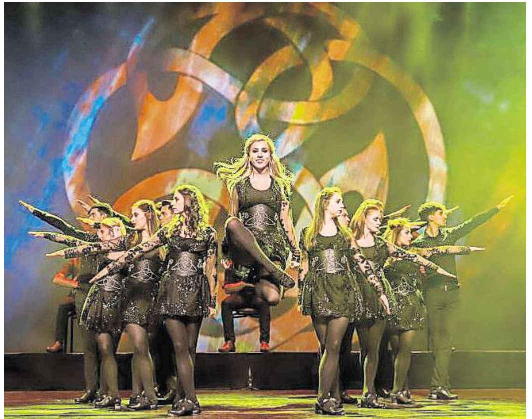
Jubiläumsshow: Rhythm of the Dance kommt im Januar 2025 in die Stadthalle Gifhorn.

Direkt zur Verlosung: Einfach den QR-Code mit dem Handy scannen.