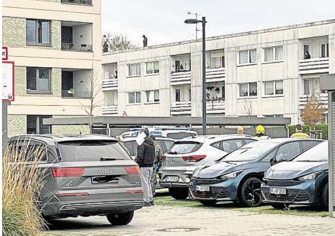
Am Donnerstagmittag gab es im Wolfsburger Stadtteil Detmerode wegen einer Bedrohungslage einen Großeinsatz der Polizei.

Die Beamten konnten den Mann trotz langer Verhandlungen nicht dazu bewegen, seine Tochter freizulassen, sodass Beamte des MEK und SEK hinzugezogen wurden, berichtet aktuell24. Der psychisch auffällige Mann begab sich immer wieder auf den Balkon. Er hielt seine Tochter vor seiner Brust, wie Anwohner berichten. Zudem soll er auch immer wieder Kleidungsstücke und Gegenstände vom Balkon geworfen haben. Laut aktuell24 versuchten die Beam-