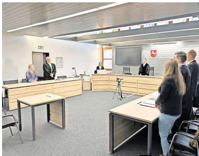
Verhandlung um einen Unfall: Die Angeklagte gab an, dass die Ampel grün gezeigt habe.

Auf die dramatischen Folgen ging auch der Richter ein. „Eine richtige Reaktion des Rechtes gibt es auf so eine Situation nicht“, sagte er. Es handele sich um einen Rotlichtverstoß, dessen Folgen jedoch sehr schwer seien.