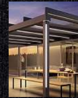
Terrassen- überdachungen Glasoasen Markisen