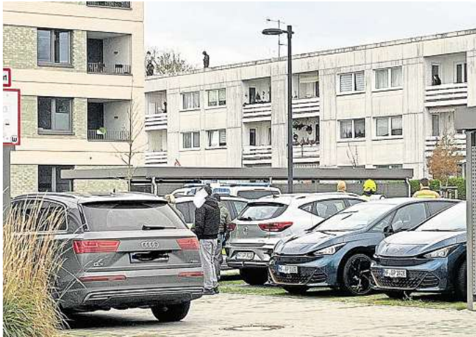
Am Donnerstagmittag gab es im Wolfsburger Stadtteil Detmerode wegen einer Bedrohungslage einen Großeinsatz der Polizei.

Die Beamten konnten den Mann trotz langer Verhandlungen nicht dazu bewegen, seine Tochter freizulassen, sodass Beamte des MEK und SEK hinzugezogen wurden, berichtet aktuell24. Der psychisch auffällige Mann begab sich immer wieder auf den Balkon. Er hielt seine Tochter vor seiner Brust, wie Anwohner berichten. Zudem soll er auch immer wieder Kleidungsstücke und Gegenstände vom Balkon geworfen haben. Laut aktuell24 versuchten die Beam-