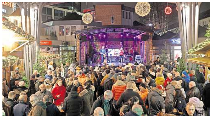
Ein vielfältiges Musikprogramm lockt in der Woche vor Heiligabend auf den Wolfsburger Weihnachtsmarkt.

In der Woche vor den Feiertagen startet das Bühnenprogramm am Donnerstag, 19. Dezember, mit dem wöchentlichen After-Work-Abend des DJ-Duos Silberfunk von 17 bis 21 Uhr. Am Freitag, 20. Dezember, sorgt das DJ-Duo tonArt für Stimmung unter dem Glasdach. Im Anschluss spielt die Coverband Impuls von 19.30 bis 22 Uhr bekannte Party-Hits. Das musikalische Finale startet am Samstag, 21. Dezember, von 15 bis 17.30 Uhr direkt mit Livemusik von Pretty in Pink . Die bekannte Wolfsburger Coverband bringt beliebte Rock'n'Roll-Songs auf die Bühne. Von 19.30