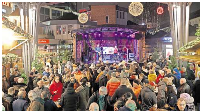
Ein vielfältiges Musikprogramm lockt in der Woche vor Heiligabend auf den Wolfsburger Weihnachtsmarkt.

In der Woche vor den Feiertagen startet das Bühnenprogramm am Donnerstag, 19. Dezember, mit dem wöchentlichen After-Work-Abend des DJ-Duos Silberfunk von 17 bis 21 Uhr. Am Freitag, 20. Dezember, sorgt das DJ-Duo tonArt für Stimmung unter dem Glasdach. Im Anschluss spielt die Coverband Impuls von 19.30 bis 22 Uhr bekannte Party-Hits. Das musikalische Finale startet am Samstag, 21. Dezember, von 15 bis 17.30 Uhr direkt mit Livemusik von Pretty in Pink . Die bekannte Wolfsburger Coverband bringt beliebte Rock'n'Roll-Songs auf die Bühne. Von 19.30