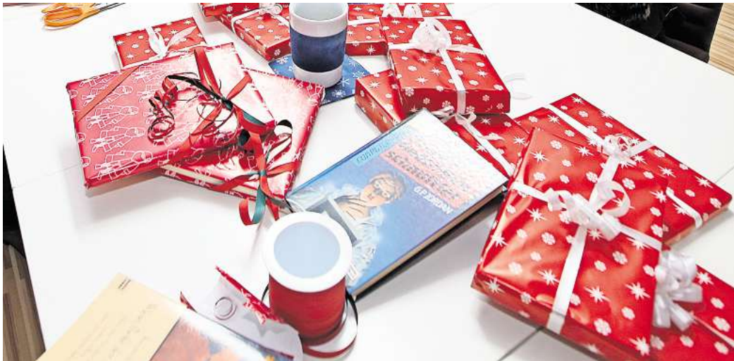
Wie viel Geld geben Sie dieses Jahr für Weihnachtsgeschenke aus?

Während einige großzügig schenken und bis zu 1.000 Euro ausgeben, halten sich andere – teils aus finanziellen Gründen – zurück und setzen auf Selbstgemachtes oder kleinere Aufmerksamkeiten. Vor allem die steigenden Lebenshaltungskosten haben bei vielen die Kaufkraft geschmälert. Gleichzeitig zeigt sich ein Gegentrend: Immer mehr Menschen entscheiden sich für nachhaltige und