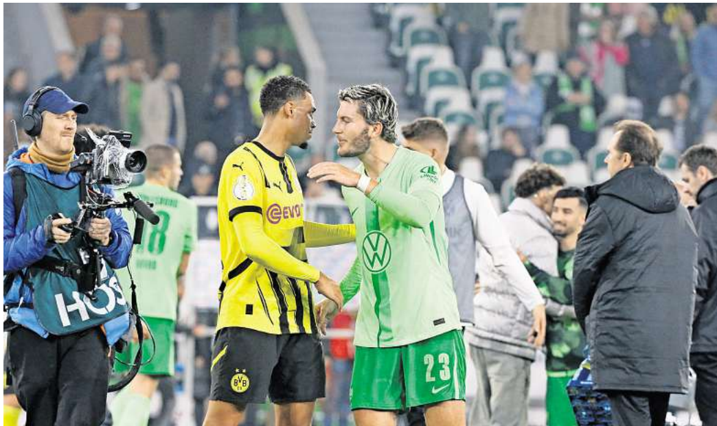
Für das Spiel des VfL Wolfsburg gegen Borussia Dortmund können Leser Tickets gewinnen.

Hallo-Wochenende verlost 1x2 Eintrittskarten