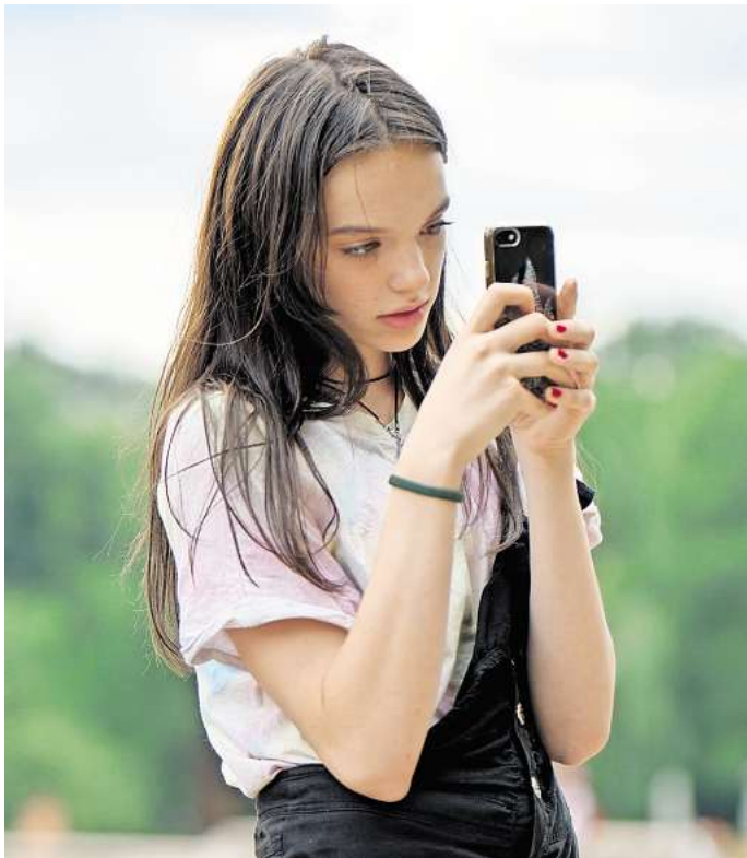
Der digitale Allrounder Smartphone ist im Leben auch vieler minderjähriger Kinder wichtiges Kommunikations- und Statusmedium.

Telefonieren, chatten, posten, Musik und Videos streamen, fotografieren: Der digitale Allrounder Smartphone ist im Leben auch vieler minderjähriger Kinder wichtiges Kommunikations- und Statusmedium. Darauf deuten aktuelle Ergebnisse einer forsa-Umfrage im Auftrag der KKH Kaufmännische Krankenkasse unter Heranwachsenden hin. Demnach nutzen 59 Prozent der 12- und 13-jährigen Mädchen und Jungen digitale Medien- und Online-Angebote für soziale Kontakte wie den Austausch mit Freunden und Bekannten. 38 Prozent in diesem Alter dienen sie dazu, um schnell an Informationen zu kommen, und fast ebenso vielen, um ihr Wissen zu erweitern und Neues