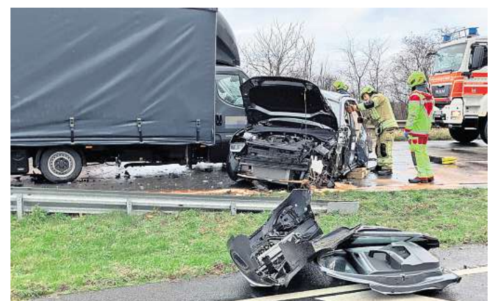
Bei einem schweren Unfall verstarb ein 89-jähriger Autofahrer.

Alle Fahrzeuge wurden abgeschleppt. Die Bundesstraße wurde bis 15 Uhr in beide Richtungen gesperrt. Zudem bildete sich ein langer Stau auf der Hannoverschen Straße durch den ausweichenden Verkehr.