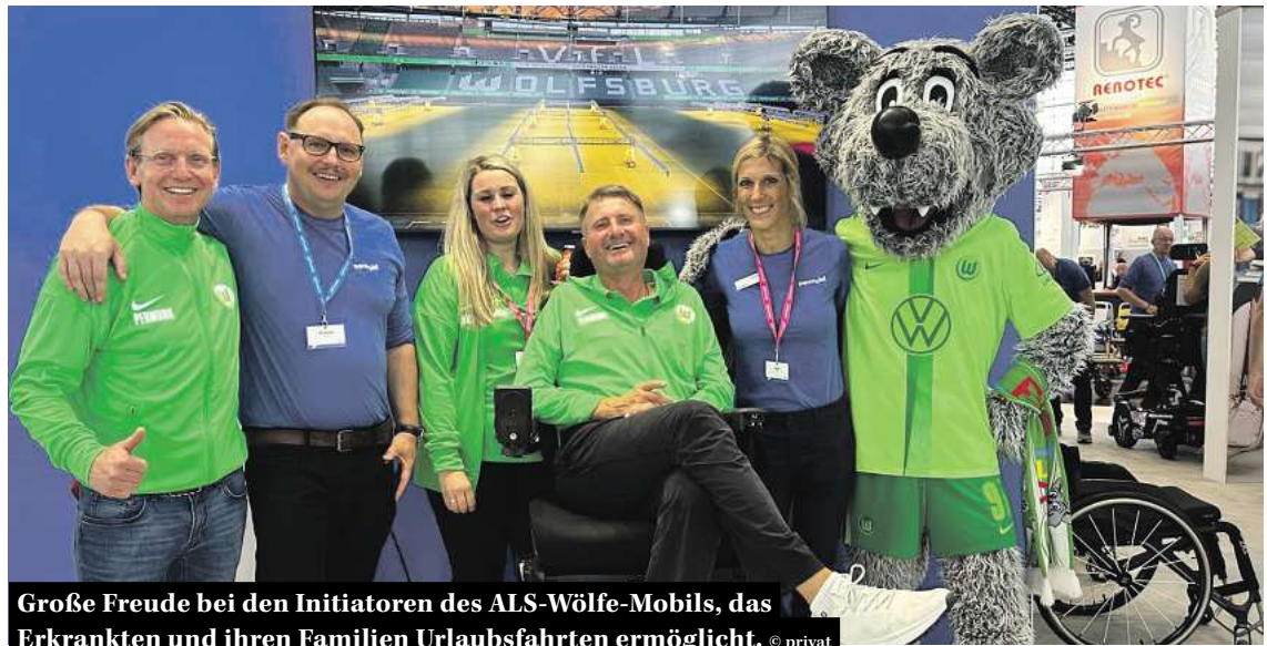
Große Freude bei den Initiatoren des ALS-Wölfe-Mobils, das Erkrankten und ihren Familien Urlaubsfahrten ermöglicht.

E s geschehen Einschnitte im Leben, die alles Bisherige unwiederbringlich verändern. So ein Schicksalsschlag ist die Diagnose ALS – Amyotrophe Lateralsklerose. Betroffenen, die mit der unheilbaren schweren Erkrankung des Nervensystems leben müssen, und ihren Angehörigen schafft die Krzysztof Nowak-Stiftung jetzt mit dem ALS-Wölfe-Mobil ein Stück Lebensfreude und Normalität.