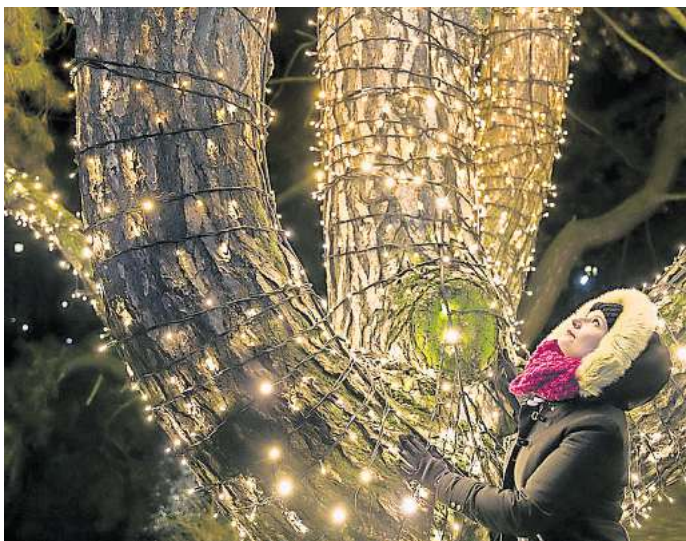
Die WAZ verlost Tickets für den Christmas Garden im Hannover Zoo. Gewinnen Sie Tickets für den "Christmas Garden" in Hannover.

Wer bei dem Gewinnspiel kein Glück hat, kann auch Tickets an der Abendkasse für 28,50 Euro kaufen. Online liegen die Preise zwischen 15,50 Euro und 28,50 Euro. Dabei müssen Besucher einen Tag und eine Zeit wählen,