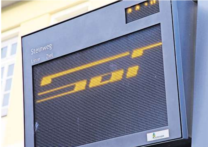
Anzeigetafel kaputt: In Wolfsburg wurden sie bereits ausgetauscht, in Gifhorn wird das bald der Fall sein.

Im neuen Jahr sollen die bereits installierten defekten Anzeigen flottgemacht oder ausge-