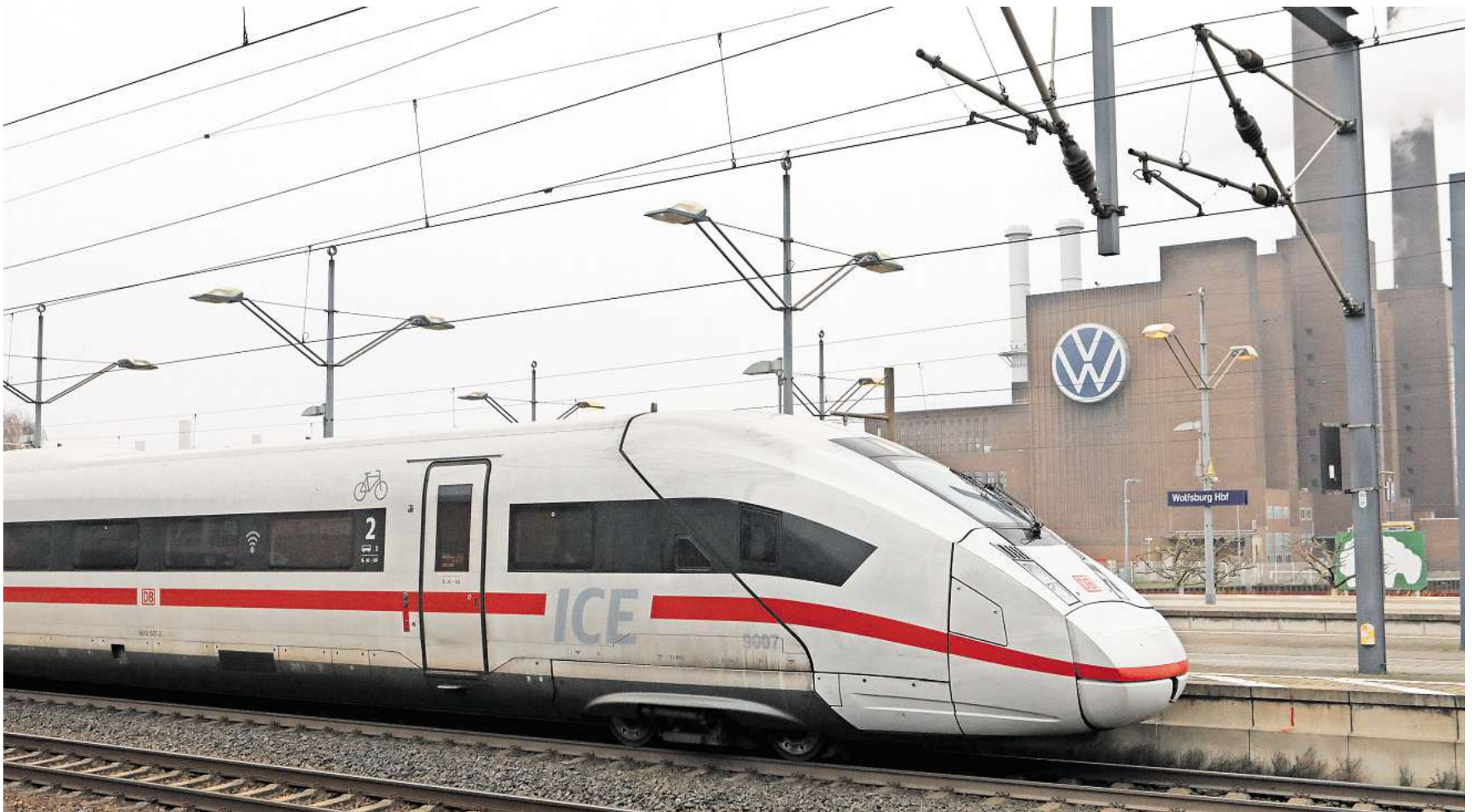
Weitere Verbindung nach Berlin: Am frühen Morgen gibt es in Wolfsburg jetzt eine weitere Möglichkeit, mit dem ICE in die Bundeshauptstadt zu reisen.