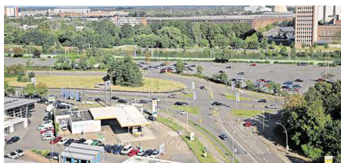
Ab den Sommerferien Baustelle: Die Fahrbahnsanierung der Heinrich-Nordhoff-Straße wird auch 2025 vorangetrieben. Für den nächsten Abschnitt muss unter anderem die Einmündung der Oststraße voll gesperrt werden. Die Saarstraße kann aus Richtung Osten kommend nicht befahren werden.

Auch wer zum VW-Tor Sandkamp oder zum VW-Parkplatz südlich des Mittellandkanals möchte, muss für die Dauer der Arbeiten Einschränkungen in Kauf nehmen. Der Grund: Die