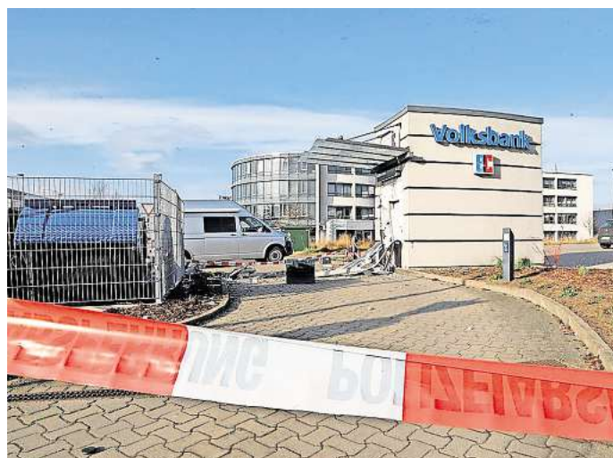
Spurensicherung: Ermittler der Polizei Wolfsburg untersuchen das Gelände rund um den gesprengten Geldautomaten im Heinenkamp. Der Geldautomat war im Februar 2022 gesprengt worden.

Wie die Ermittlungen ergaben, hätten die Täter vorwiegend Sprengstoff der „Marke Eigenbau“ benutzt. Aus Feuerwerken mit hohem Gefährdungsgrad seien sogenannte „Sprengpacks“ hergestellt worden, um die Geldautomaten in die Luft zu jagen. „Sprengungen zu anderen Zwecken als dem Diebstahl von Bargeld aus Geldautomaten wurden in Niedersachsen bisher nur in Ausnahmefällen festgestellt“, berichtet Röhr.