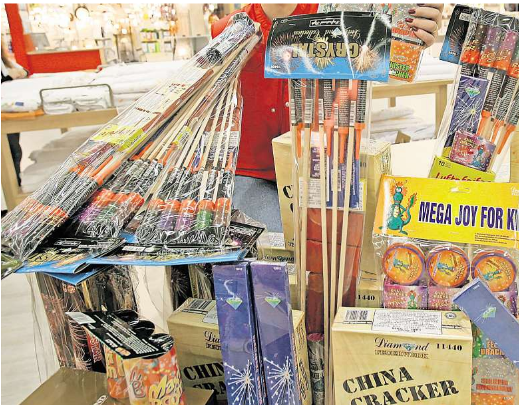
Nicht mehr lange und dann steht Silvester bevor – und es wird laut. Wie stehen Sie zu dem Thema Silvester-Böller? (Symbolbild)

Für Tiere ist das laute Geböller jedes Jahr eine erschreckende