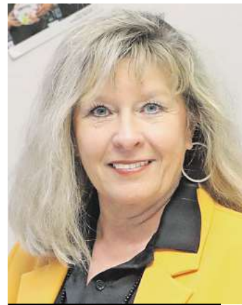
Melanie Stallmann © Archiv