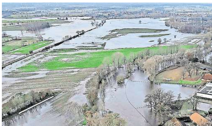
Besonders zum vergangenen Jahreswechsel war das Hochwasser in der Region ein großes Problem. Hier ist der Zusammenfluss von Aller und Oker in Müden (Landkreis Gifhorn) zu sehen.