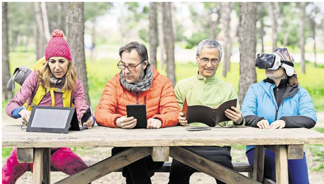
Wer spektakuläre Wanderungen sehen will, muss heutzutage nicht mehr rausgehen.

Die Umsetzung der digitalen Wanderungen in Südafrika fand zu Beginn der Corona-Pandemie statt. Wie das Magazin „Northridge“ damals berichtete, blieben die Berge und Strän-