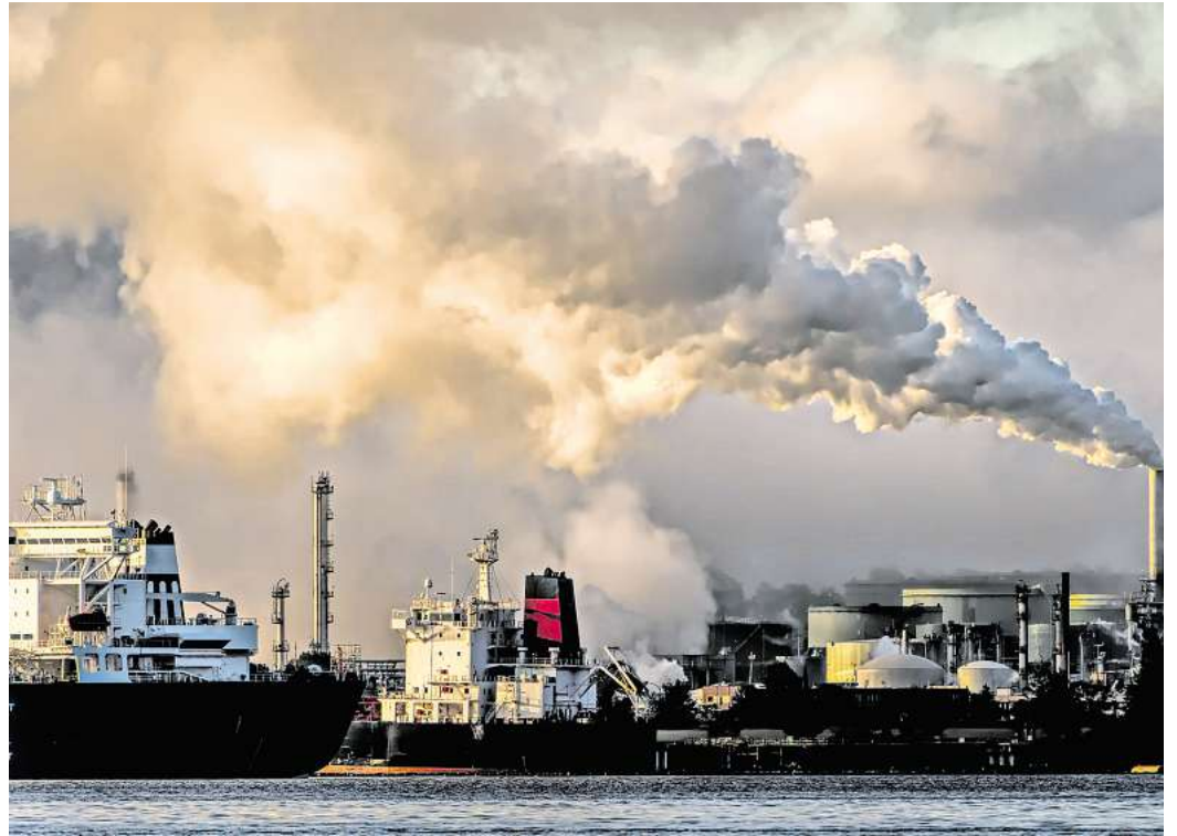
In diesem Jahr dürfte die weltweiten fossilen Kohlendioxid-Emissionen auf ein neues Rekordhoch klettern.

Land-Ökosysteme konnten im Jahr 2023 dem Bericht zufolge durch den Klimawandel etwa 27 Prozent weniger CO 2 aufnehmen als noch 2014. Das liege unter anderem an einem geringeren Niederschlag und höheren Temperaturen in bestimmten Regionen. Die Meere konnten demnach in dieser Zeit knapp 6