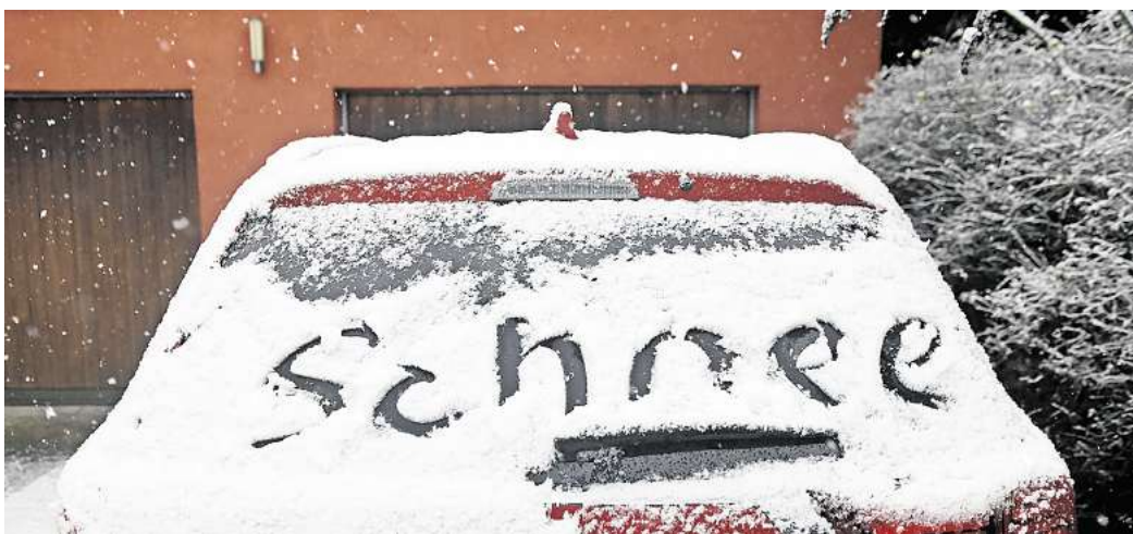
Der Winter ist bislang mehr oder weniger ausgefallen. Wünschen Sie sich noch einmal Schnee in diesem Frühjahr? (Symbolbild) RALF BÜCHLER

Für viele Winterfans ist das eine Enttäuschung. Sie vermissen ver-