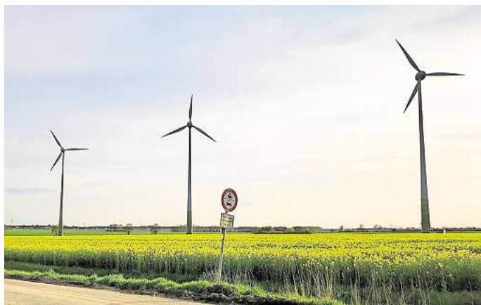
Die Windräder in Ehmern, aufgenommen im Jahr 2022: Die Stadt möchte nicht in direkter Nachbarschaft weitere Windräder aufstellen lassen.

Genau diese Teilfläche mit einer Größe von rund 43 Hektar passt der Stadt überhaupt nicht. Zum einen ist sie lediglich etwa zwei Kilometer von den drei Windrädern bei Ehmern entfernt. „Die Windräder beider Flächen wären so optisch sehr dominant“,