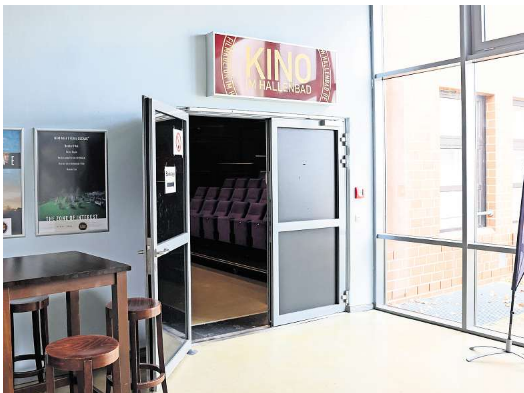
Das Kino im Hallenbad muss schließen