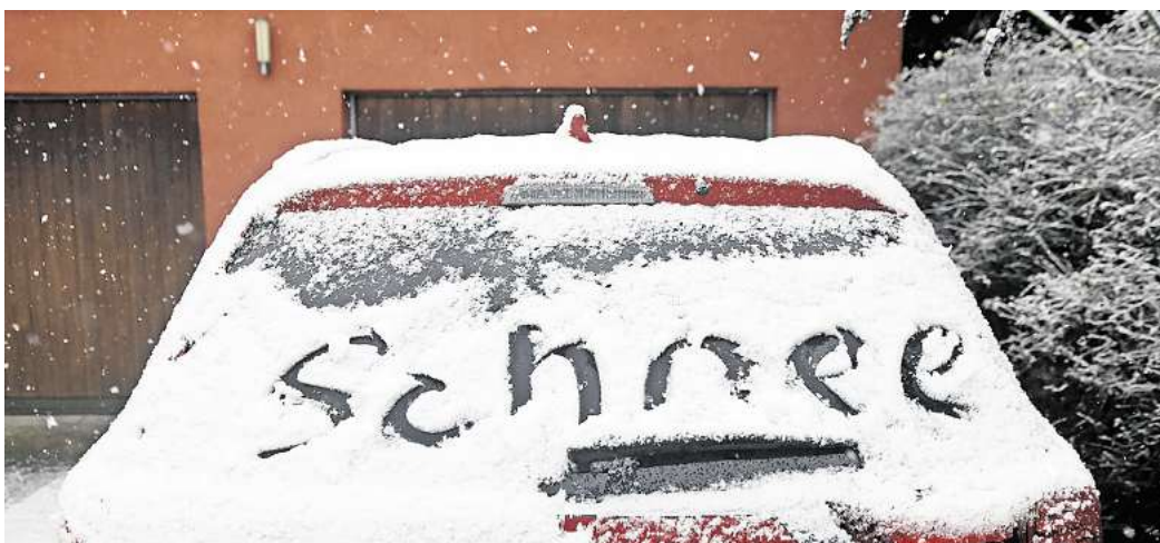
Der Winter ist bislang mehr oder weniger ausgefallen. Wünschen Sie sich noch einmal Schnee in diesem Frühjahr? (Symbolbild) RALF BÜCHLER

Für viele Winterfans ist das eine Enttäuschung. Sie vermissen ver-