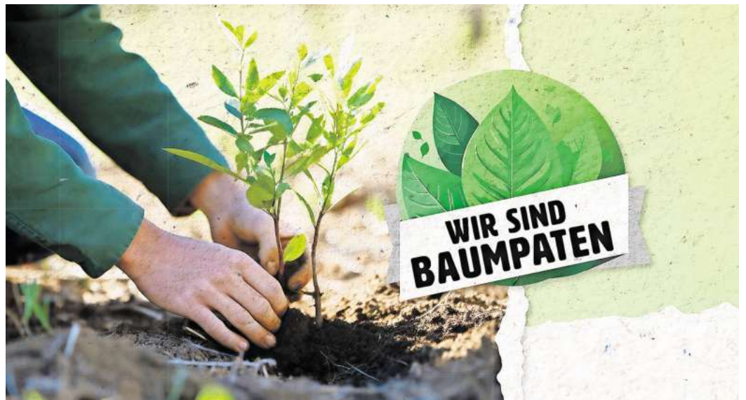
AZ und WAZ suchen 333 Freiwillige, die dabei helfen, Bäume in den Wolfsburger Stadtwald zu pflanzen.