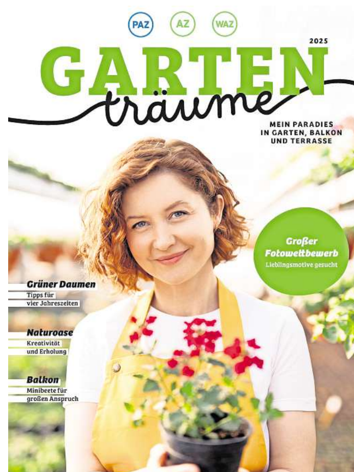
Das neue AZ/WAZ/PAZ-Gartenmagazin erscheint im März.

Mit einer Druckauflage von über 30.000 Exemplaren findet der Wettbewerb in der Region große Beachtung. Zusätzlich steht den mehr als 8.000 E-Paper-Abonnenten der PAZ, AZ und WAZ das Magazin eine Woche als Blätter-PDF zur Verfügung. Die Online-Reichweite ohne Mehrkosten ist zudem ein besonderer Service für Anzei-