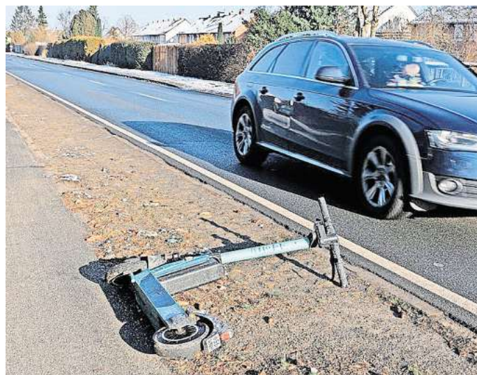
Werden gerne mitten im Weg abgestellt: Falsch geparkte E-Scooter in Wolfsburg.

Zuletzt seien Parkbereiche und Parkverbotszonen eingerichtet worden, die Kommunikationswege zwischen Anbietern und Stadt verbessern sollen und die, die Sensibilität für das korrekte Abstellen der Roller bei den Nutzern erhöhen sollen. Außerdem wird beispielsweise ein Foto nachweis beim Abstellen der E-Scooter gefordert. Hinweise dazu gibt es in den Anbieterapps.