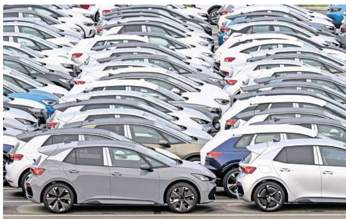
Auch online an Frau und Mann bringen: Der Verkauf von Fahrzeugen übers Internet wird immer wichtiger. Gleichzeitig FOTO: HENDRIK SCHMIDT

Die Vermarktung über digitale Kanäle soll laut Volkswagen über alle Regionen hinweg ausgeweitet werden. Ein Schwerpunkt: Die Marke will die On-