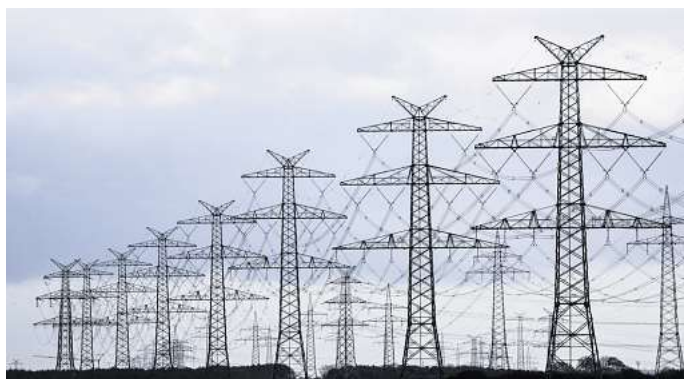
Strommasten stehen hintereinander: Wenn der Strom ausfällt, tritt ein Notfallplan in Kraft.

Sollte in Wolfsburg der Strom flächendeckend ausfallen, würde die Stadt innerhalb kürzester Zeit das notwendige Material aus dem Katastrophenschutzlager an die als Bevölkerungsschutz-Leuchttürme ausgewählten Stellen im Stadtgebiet bringen. Dies sind größtenteils Feuerwehrhäuser, aber auch Schulgebäude. Zusätzlich gibt es eine mobile Einheit. Parallel würde die Alarmierung der Freiwilligen Feuerwehr und der Mitarbeiter der Stadt zur Be-