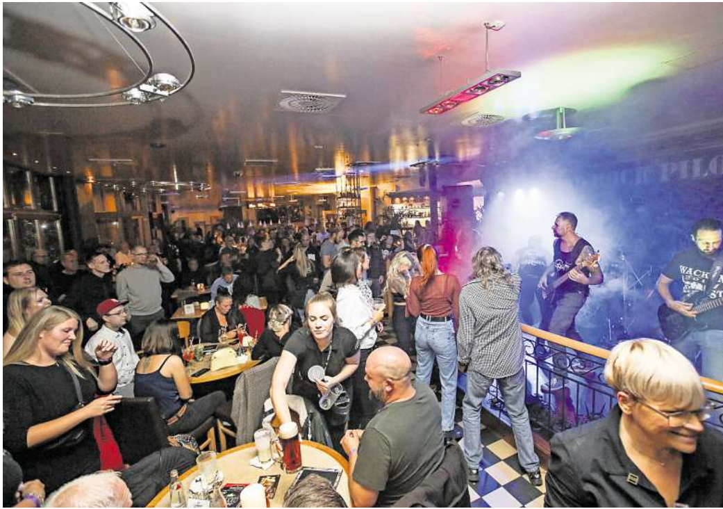
Das Honky-Tonk in Wolfsburg war beliebt. In der Bar Celona spielte 2022 die Band Dead Rock Pilots.

Der Geschäftsführer der Agentur habe das Kneipenfestival vor über 30 Jahren gegründet. Seitdem gibt es das Konzept „einmal Eintritt zahlen, viele unterschiedliche Konzerte erleben“ in Deutschland. Vor der Corona-Pandemie wurde es dem Veranstalter zufolge noch in 28 Städten angeboten. In diesem Jahr konzentriert sich die Eventagentur auf weniger Städte, momentan werden acht Festivals geplant, darunter beispielsweise Eisenach, Stralsund und Mühlhausen. Das Braunschweiger Fest wird am 26. April angeboten.