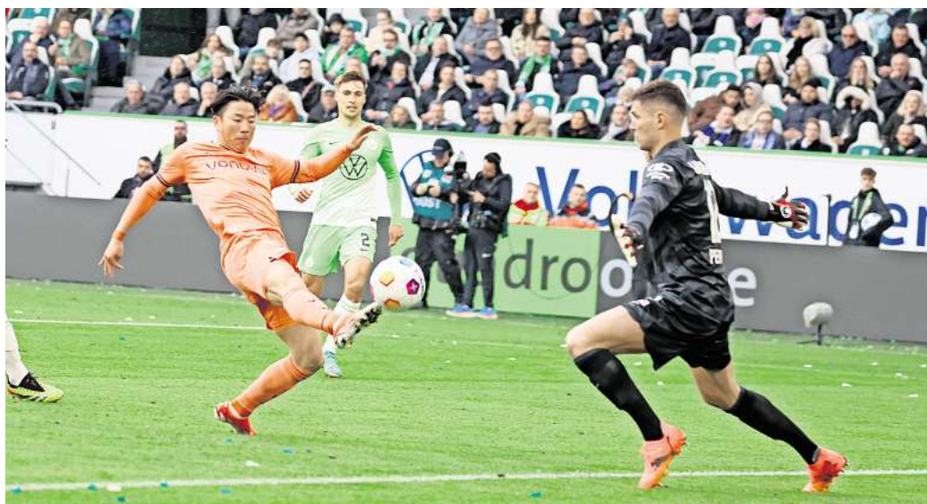
Für das Spiel des VfL Wolfsburg gegen den VfL Bochum können Leser Eintrittskarten gewinnen.

Für die Partie des VfL Wolfsburg gegen den VfL Bochum können hallo-Leser 2x2 Eintrittskarten gewinnen. Was Sie