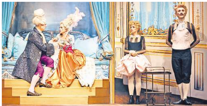
Marie-Antoinette – oder Kuchen für alle: Die Komödie am Kurfürstendamm präsentiert ein brüllend komisches Kostüm-Drama.

Das liebenswert-schräge Schauspiel „Der erste letzte Tag“ stellt am Samstag, 22. März, sehr