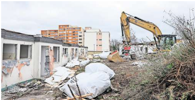
Neue Reihe in Wolfsburg: Hier werden die Bungalows abgerissen. Die Neuland plant dreigeschossigen Mietwohnungsbau zu errichten.

Eintrittskarten gibt es für acht Euro für Kinder und Erwachsene an der Tageskasse. Wer lange Wartezeiten an der Kasse vermeiden möchte, kann sich seine Tickets im Vorverkauf bei eventim sichern. Einlass am Veranstaltungstag ist ab 14.30 Uhr.