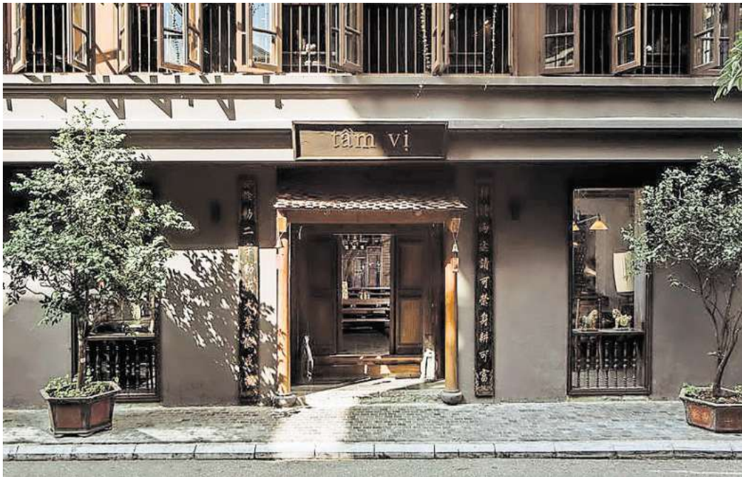
Das Tăm Vi in Hanoi hält einen Michelin-Stern.

Auf der Karte stehen klassische Gerichte und Spezialitäten aus der nordvietnamesischen Küche. So gibt es die traditionelle Vorspeise chả ốc – vietname-