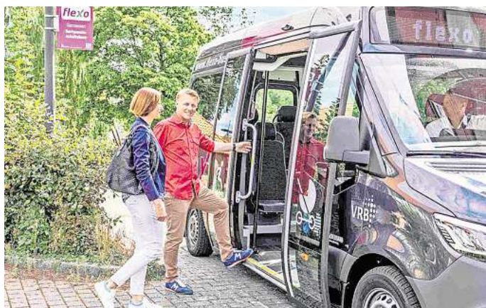
Bessere Vernetzung der On-Demand-Angebote im Nahverkehr: Nicht nur der Flexo, sondern auch Anruf-Sammel- und Anruf-Linien-Taxis sollen künftig per App buchbar sein.

Wo sind flexible Nahverkehrsangebote am sinnvollsten? Das will der Regionalverband über digitale Verkehrsmodellierung analysieren. Dies soll dann künftig auch eine Grundlage für die Vergabe von ÖPNV-Leistungen, insbesondere auf dem Land, sein. Mithilfe seines regionalen Verkehrsmodells will der Regio-