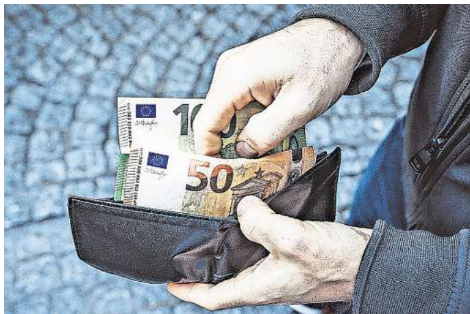
Mit einer neuen Betrugsmasche haben Täter in Wolfsburg und auch Braunschweig schon mehrere Tausend Euro erbeutet. (Symbolbild)

Dabei spielen die Betrüger vor, dass sie nicht auf ihr Konto zugreifen können und kein Geld zur Verfügung haben. Deshalb