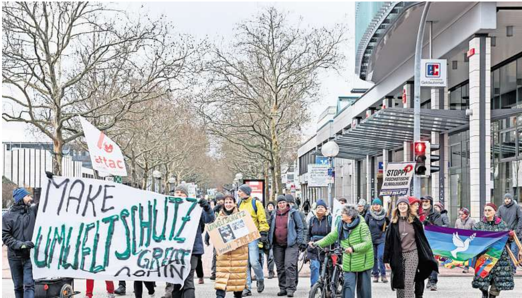
Durch die Innenstadt führte am Freitag eine Demonstration zum Klimastreik.