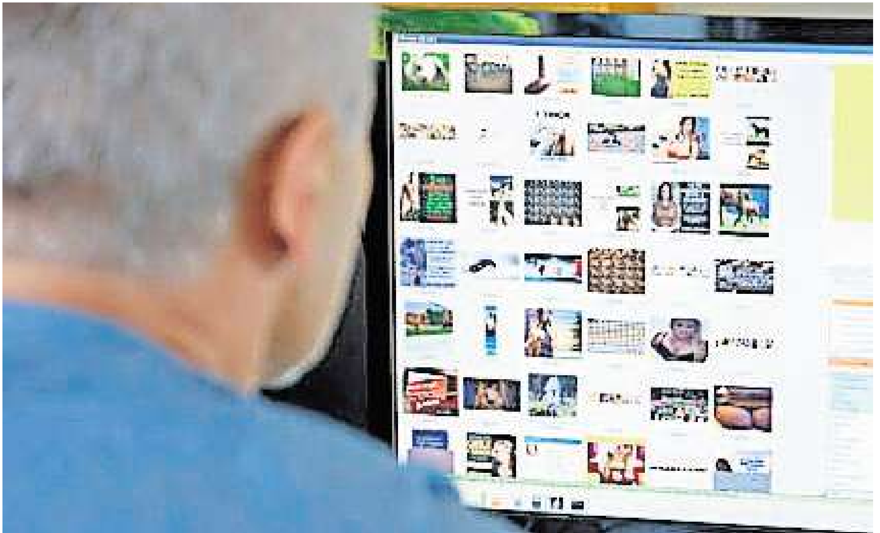
Ein 55-Jähriger hatte 1.500 Fotos und Videos mit Kinder- und Jugendpornografie auf seinen Rechner gespeichert und wurde jetzt vom Amtsgericht Wolfsburg verurteilt.

Der Richter verurteilte den 55-Jährigen zu einer zehnmonatigen Freiheitsstrafe. Die Bewährungszeit legte er auf drei Jahre fest. Überdies muss der Mann 2.000 Euro an den Verein „Kinderjugendschutz Wolfsburg“ zahlen und drei Beratungsgespräche bei einem Sexualtherapeuten in Anspruch nehmen. Der Richter sprach von einer positiven Sozialprognose. „Da Sie in geregelten Verhältnissen leben, ist ein Bewährungshelfer nicht erforderlich.“