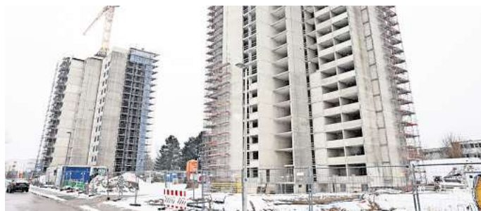
Bei der Sanierung der Hochhäuser Don Camillo und Peppone kam es immer wieder zu Verzögerungen.

Doch eines hängt am anderen: Weil das Treppenhaus noch nicht fertig ist, konnten die Arbeiten