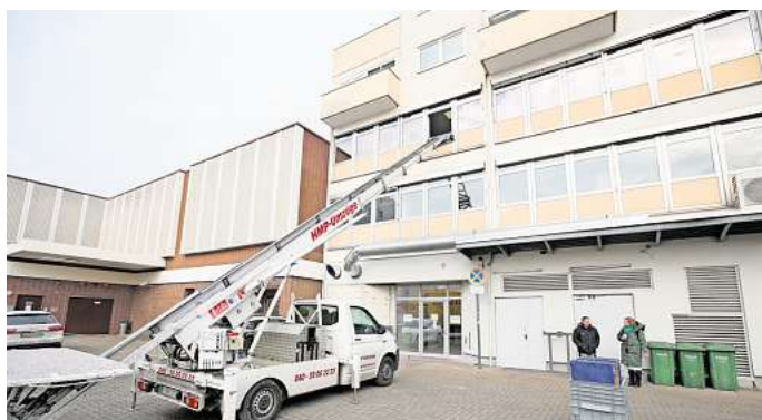
Das Jobcenter ist umgezogen. Der Zugang zum Empfangsbereich ist über die Kolpingstraße möglich.

Nachdem das Mietverhältnis am alten Standort mit Ende des vergangenen Jahres geendet hatte, seien alle Hebel in Bewegung gesetzt worden, neue Räume zu