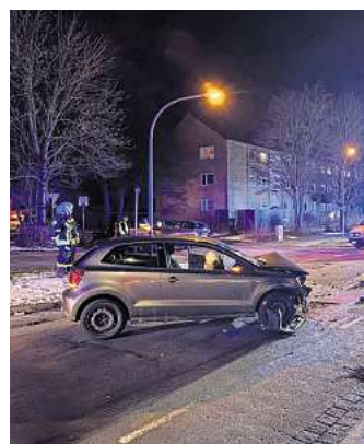
Am Freitagabend sind in Fallersleben zwei Autos zusammengestoßen.