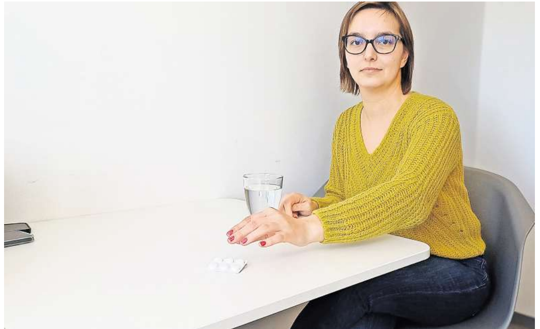
Bei der Paracetamol-Challenge nehmen Jugendliche eine Überdosis des Schmerzmittels. Die Berufsfeuerwehr Wolfsburg warnt vor dem gefährlichen Trend.

Eine Überdosierung kann laut der Berufsfeuerwehr unter anderem zu Krampfanfällen und Koma führen. Gefährlich ist laut