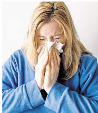
Die Erkältungs- und Grippewelle tobt.