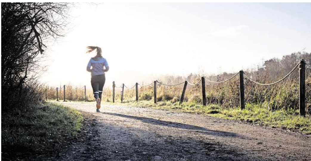
Eine Frau joggt. In Sülfeld wurde eine Joggerin von einem Hund angegriffen.

Zunächst beschrieb die Klägerin, sie war in Vertretung ihres Mannes, dem Halter des Hundes, vor Gericht erschienen. Am Morgen eines Advents-Sonntages des Jahres 2022 war die 81-jährige Frau mit dem Familienhund, einem Jack-Russell-Terrier, in Sülfeld auf dem