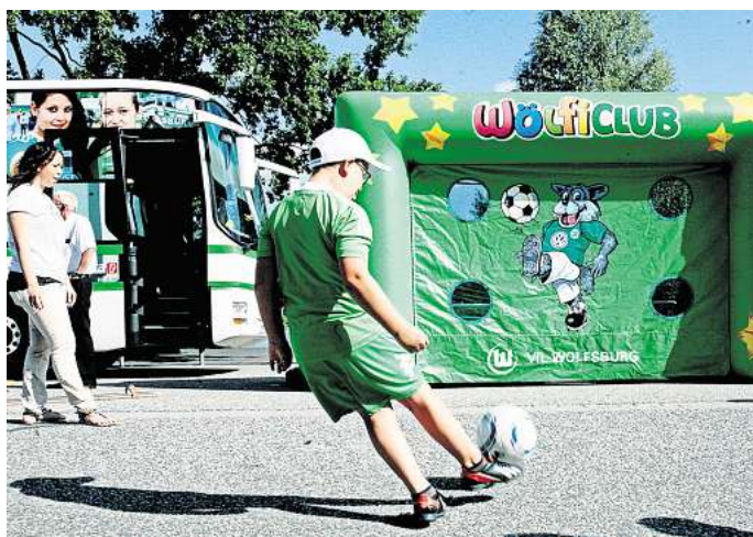
Wer wird der beste Torwandschütze Wolfsburgs?

Hier haben alle fußballbegeisterten Wolfsburger die Möglichkeit, sich in ihrer Alterskategorie durchzusetzen und das ers-