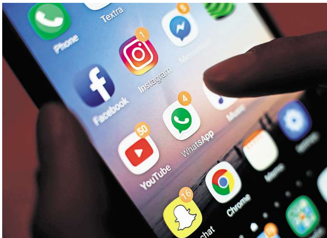
Jugendliche und die Nutzung von sozialen Medien - eines der großen Themen von „Streetlife“.

Auch straffällig gewordenen Jugendlichen nimmt sich „Streetlife“ an. 18 Heranwachsende zwischen 14 und 21 Jahren mussten sich aufgrund von Straftaten vor dem Amtsgericht verantworten. Sieben nahmen in dem Zuge das Beratungsangebot von „Streetlife“ an. Im Jahr 2023 waren noch mehr Heranwachsende straffällig geworden: 23 junge Menschen wurden dem Jugendrichter vorgeführt, acht davon hatten das freiwillige Beratungsangebot wahrgenommen.