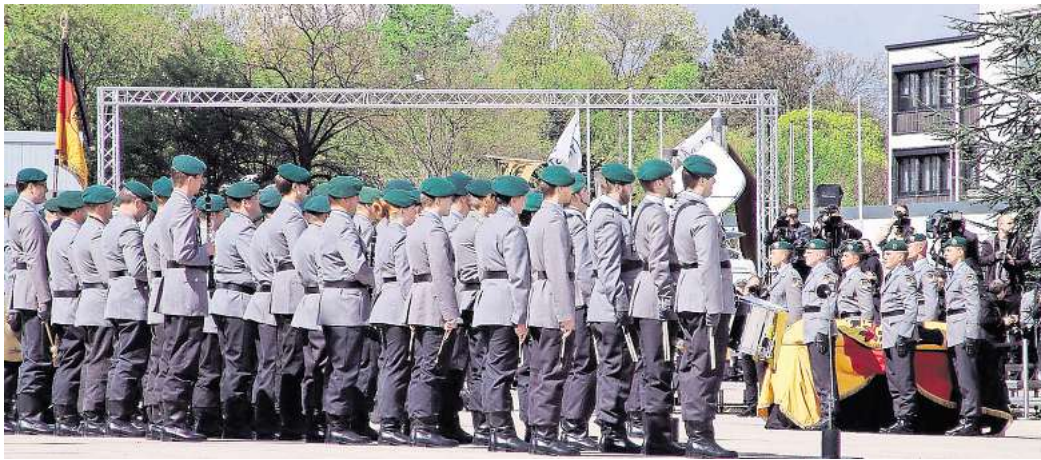
Sind Sie für die Wiedereinführung der Wehrpflicht?