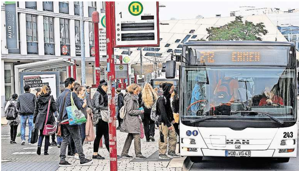
Verkehrskonzept: Auch ein neuer ZOB soll Teil der Planungen sein.