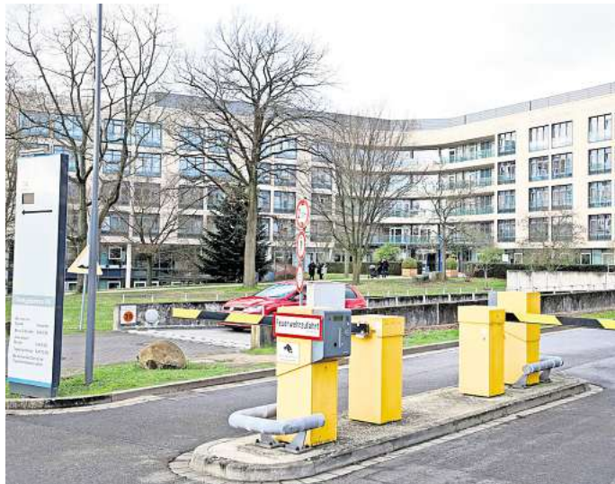
Die Rettungswege am Klinikum Wolfsburg werden nun smart.

Durch die Erkennung widerrechtlich geparkter Fahrzeuge könnten Ressourcen zielgerichtet eingesetzt werden, während die Datenübermittlung dank eines solarbetriebenen Gateways energieeffizient und datenschutzkonform erfolgt. Jens Hofschroer, Dezernent für Wirtschaft und Digitales, er-