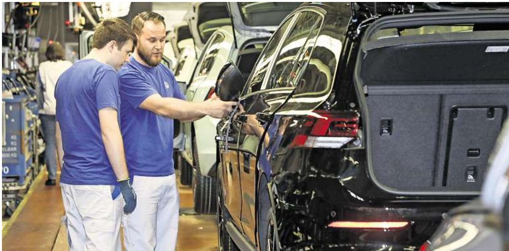
Was halten Sie von der Vier-Tage-Woche? (Symbolfoto)

Wolfsburg. Die Diskussion über die Einführung der Vier-Tage-Woche gewinnt weltweit zunehmend an Bedeutung. Viele Unternehmen und Länder prüfen, ob eine kürzere Arbeitswoche nicht nur die Produktivität steigern, sondern auch das Wohlbefinden der Mitarbeiter verbessern könnte. In Ländern wie Island und Spanien wurden bereits Tests durchgeführt, die positive Ergebnisse hinsichtlich der Work-Life-Balance und der Zufriedenheit der Arbeitnehmer zeigten.