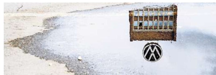
Herabgestuft: Die Kreditwürdigkeit der Volkswagen Group wurde von Moody's schlechter bewertet.

Die Einstufung von Volkswagen liegt aber immer noch um drei Stufen über dem Niveau, ab dem Kredite als spekulativ angesehen werden. Schlechtere Ratings ziehen in der Regel höhere Zinsen bei der Aufnahme neuer Schulden nach sich. Bei Fitch be-