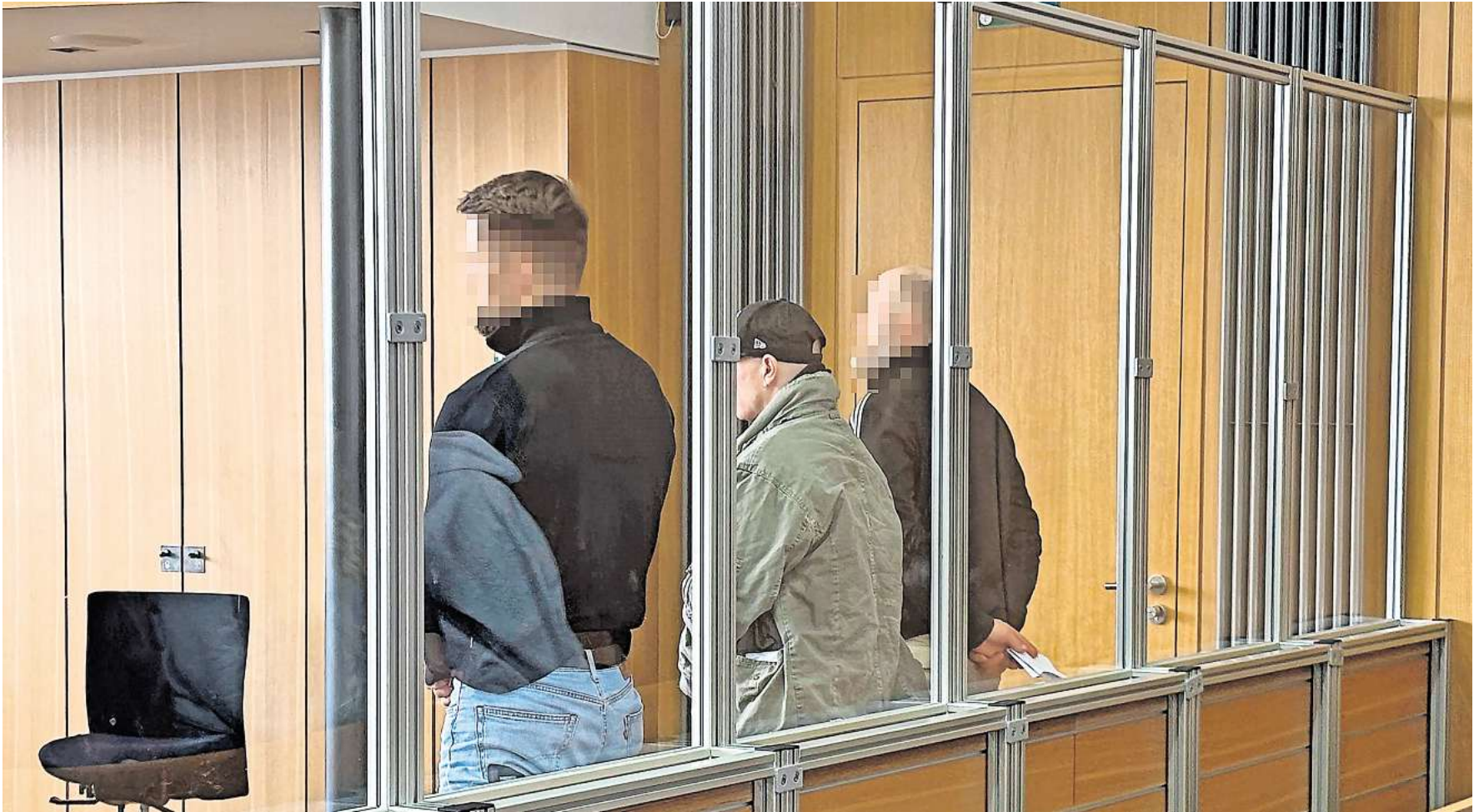
Das Landgericht Braunschweig verurteilt einen 39-Jährigen. Er soll im Zustand der Schuldunfähigkeit drei Straftaten begangen haben.