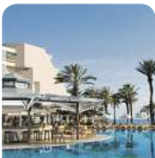
4,5* Hotel Pioneer (TUI Blue)

Auf der drittgrößten Mittelmeerinsel im Süden Europas herrschen nicht nur außergewöhnlich gute Temperaturen, auch die Lebensfreude und einzigartige Kultur sind hier zu Hause.