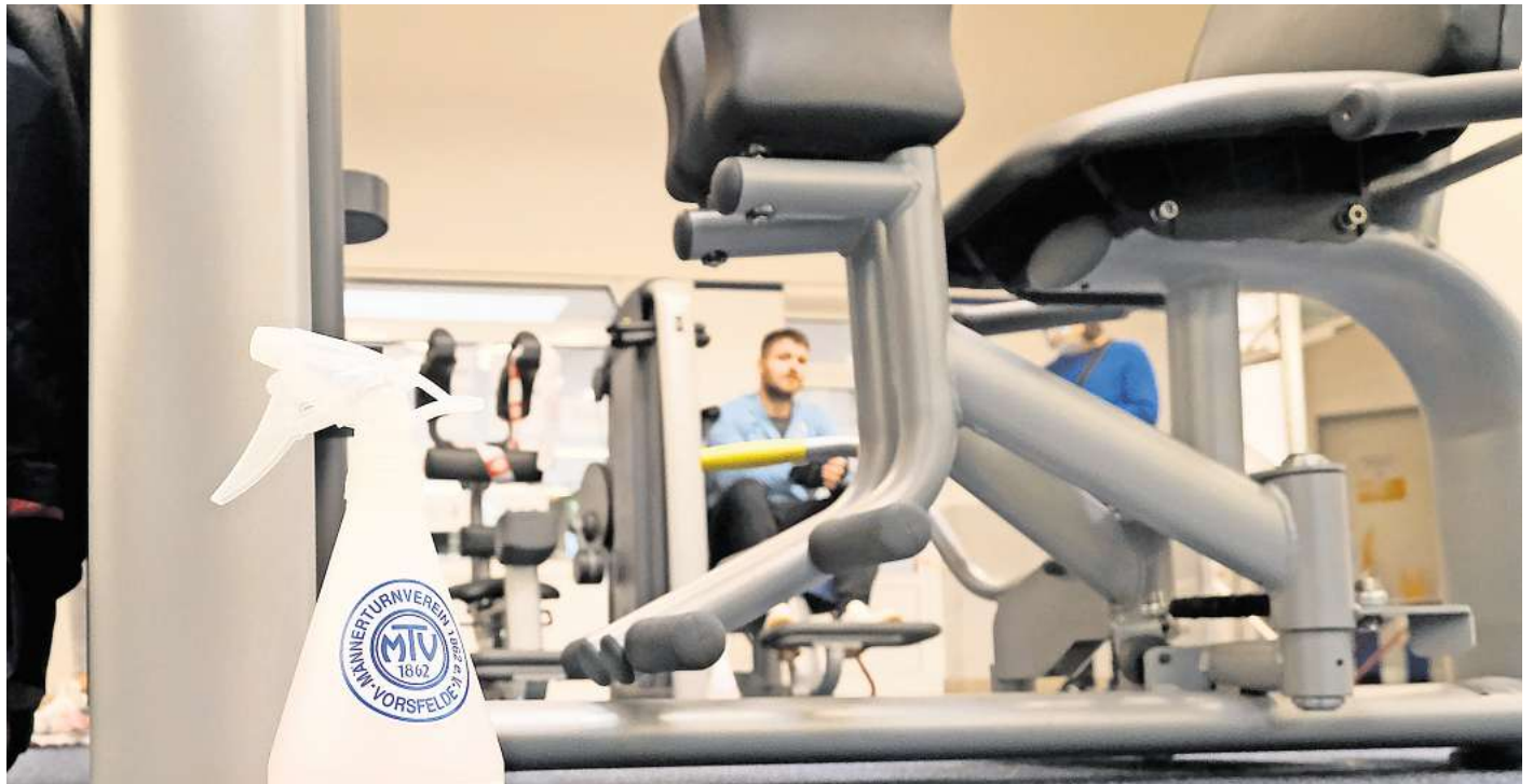
MTV action: Nach mehr als zehn Jahren in Betrieb schließt der MTV Vorsfelde sein Fitness-Center im Schulzentrum. Hier trainieren künftig verstärkt Cheerleader und Dance-Gruppen.

Schon Anfang Februar dieses Jahres hatte der MTV sein Fitness-Center im benachbarten