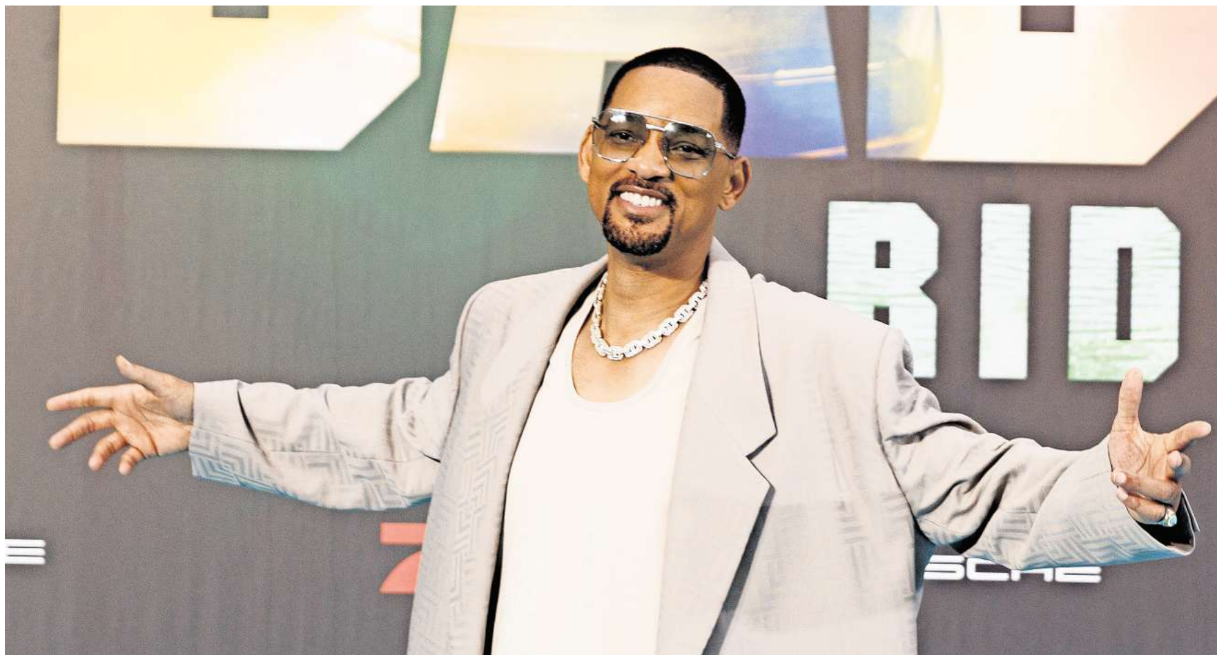
Schauspieler Will Smith kommt nach Wolfsburg.

Die Autostadt gibt auf der Website bekannt, dass Eintrittspreise während der Eventzeiten abweichen können.