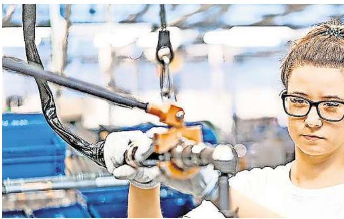
Ausbildung bei Volkswagen: VW verlängert die Bewerbungsfristen bis Ende April. Ab kommenden Jahr ändert sich dann einiges.

Außerdem sollen bei Volkswagen in Zukunft 50 Plätze zur Einstiegsqualifikation angeboten