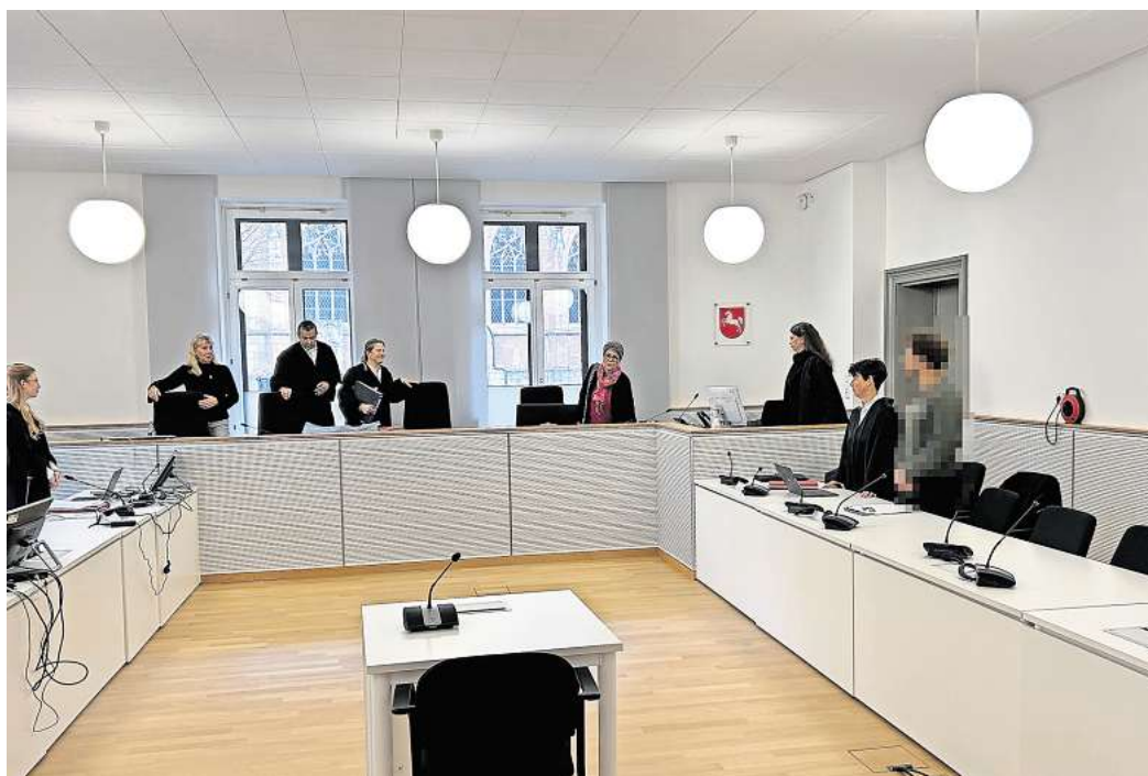
Wegen des Tatvorwurfs der Vergewaltigung unter Verwendung einer Waffe muss sich ein 27-jähriger Wolfsburger vor dem Landgericht verantworten.

Vor einem Nachbarhaus des Wohnhauses des 27-Jährigen habe er sich dann mit der Prostituierten getroffen. Anschließend habe er sie durch den rückseitigen Eingang seines Wohnhauses in das Mehrfamilienhaus geführt. Die 39-Jährige sei in der Annahme mitgekommen, dass der Angeklagte sie in seine Wohnung führe. Als sie jedoch gemerkt habe, dass es in den Keller gehe, habe sie ein ungutes Gefühl gehabt und habe aus dem