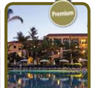
4,5* Porto Mare by PortoBay

► Buchungshotline 0800 - 38 300 38 kostenfrei aus dem dt. Festnetz