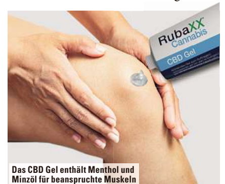
Das CBD Gel enthält Menthol und Minzöl für beanspruchte Muskeln

Mittels eines komplexen CO 2 -Verfahrens wurde aus der Cannabisorte sativa L. hochwertiges CBD isoliert und mit einer Dosierung von ~900 mg CBD im Rubaxx Cannabis CBD Gel aufbereitet. Zudem enthält das Gel Menthol und Minzöl zur Pflege beanspruchter Muskeln. Dank der praktischen Gelform kann das Cannabis CBD Gel je nach Bedarf