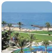
4,5* Hotel Athena Beach