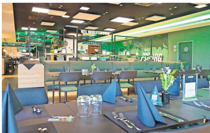
Die PartnerPool-Lounge in der Logenebene: Hallo-Leser haben die Möglichkeit, für das Spiel des VfL Wolfsburg gegen Heidenheim VIP-Karten zu gewinnen.

Nach der enttäuschenden 0:1-Niederlage gegen den FC Augsburg am vergangenen Wochenende tritt der VfL Wolfsburg in der Tabelle weiterhin auf der Stelle. Dank günstiger Ergebnisse der Konkurrenz fällt die Mannschaft von Trainer Ralph Hasenhüttl jedoch nur um eine Position zurück – von Platz 7 auf 8. Nach sieben ungeschlagenen Spielen in Folge, mussten die Wölfe erstmals wieder eine Niederlage hinnehmen. Ein Rückschlag im Kampf um Europa? Kapitän Maximilian Arnold fand in den Katakomben der WWK-Arena eine klare Antwort: „Nein!“ Die Saison sei noch lang, die internationalen Plätze in Reichweite. Auch Hasenhüttl gab sich kämpferisch: „Jetzt müssen wir eine neue Serie