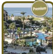
5* Hotel Elysium