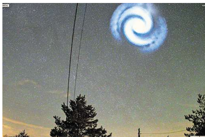
Am Himmel über Norddeutschland war am gestrigen Abend eine spiralförmige Wolke am Himmel zu sehen.

In der Region war das leider nur bedingt der Fall: „Wir haben auf dem Dach des Wolfsburger Planetariums eine Kamera, die den Himmel 24 Stunden lang aufnimmt. Unsere Kamera hat leider nichts Erkennbares aufgezeichnet, weil es bewölkt war“,