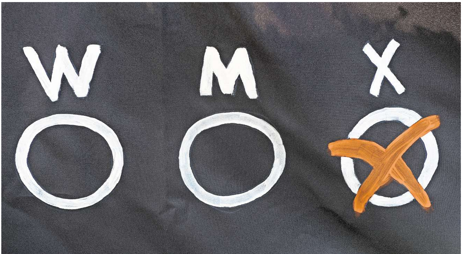
Drei Möglichkeiten für einen Geschlechtseintrag: "W", "M" und "X". Seit dem 1. November 2024 können Menschen in Deutschland ihren Geschlechtseintrag einfacher ändern lassen (Symbolbild).

„Bisher wird noch zu wenig darauf geachtet und ebenso wenig ein Zeichen gesetzt, dass wir als Menschen alle zusammen stehen. Da könnte jeder einzelne Bürger etwas zu beitragen, indem er beispielsweise den CSD besucht, mit uns ins Gespräch kommt oder sich gegen gewalttätige Aussagen an die queere Community stellt. Wenn wir ein großes Miteinander haben, wäre sehr vielen Menschen geholfen“, betont der Sprecher des CSD Wolfsburg.