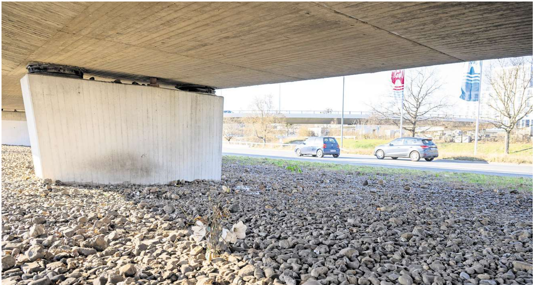
Unter der Brücke am St. Annen-Knoten hatte ein Obdachloser lange Zeit sein Lager aufgeschlagen. Jetzt ist der Mann verschwunden.

Schon oft konnte in der Innenstadt beobachtet werden, wie Menschen, die in Geschäftseingängen saßen oder an anderen Orten lagerten, aufgefordert wurden, den Platz zu verlassen. In solchen Fällen hatte die Stadt Wolfsburg einen vorübergehenden Platzverweis erteilt. Geschah das auch im Fall des Mannes vom St. Annen-Knoten? Wurde ein Platzverweis zu Schutz des Mannes ausgesprochen? Schließlich herrscht auf dem Berliner Ring sehr starker Verkehr.