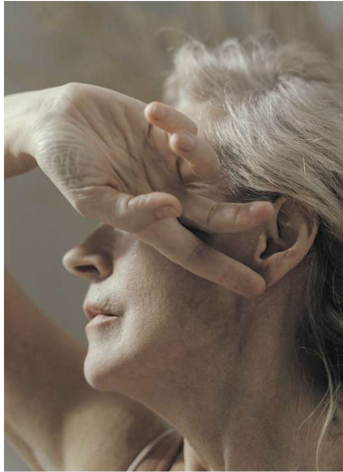
Ältere Menschen sind besonders gefährdet durch die Auswirkungen großer Hitze.

„Ältere Menschen sind besonders gefährdet durch die Auswirkungen großer Hitze“, sagte Jennifer Ailshire, Hauptautorin der Studie. In der Untersuchung seien dabei nicht nur die Temperaturen, sondern auch die Feuchtigkeit berücksichtigt worden. In der Studie weisen die Forscherinnen darauf hin, dass zuvor bereits bei Mäusen beobachtet wurde, wie Hitze die Methylierung von deren DNA und damit die biologische Alterung be-