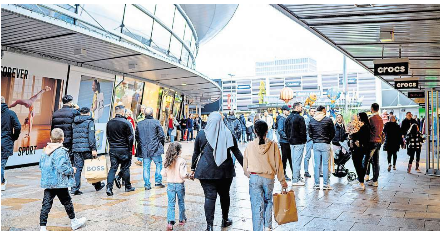
Am 30. März findet in den Designer Outlets der erste verkaufsoffene Sonntag des Jahres statt..

Neben offenen Geschäften begrüßen die Designer Outlets Wolfsburg den Frühling mit einem stimmungsvollen Am-