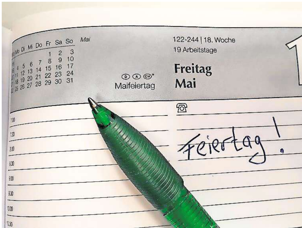
Wären Sie bereit, auf einen Feiertag zu verzichten?

Vielen Befragten wäre es wichtig, eine gewisse Gerechtigkeit bei der Feiertagsverteilung im Lande zu schaffen. Sie würden sich daher wünschen, dass die Bundesländer mit weniger Feiertagen mehr bekommen.