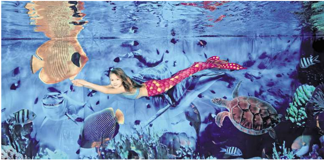
Die Merlympics finden im Badeland statt: Die Meerjungfrauen und Meermänner müssen in einige Disziplinen antreten.

Die Rallye bedeutet 25 Meter Brustschwimmen mit der Flosse, wobei der Kopf aus dem Wasser schaut. Nach 25 Metern wird ein Fuß aus der Flosse genommen