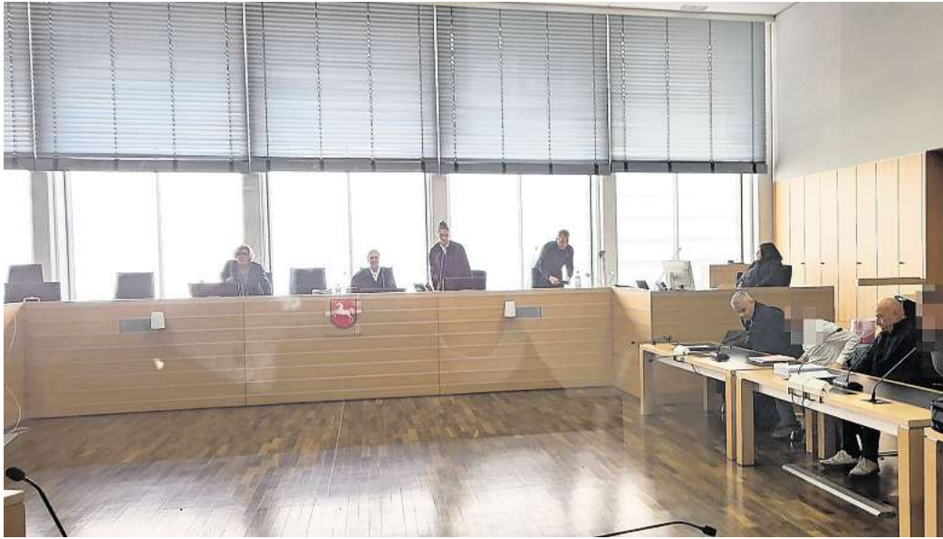
Vor dem Landgericht Braunschweig mussten sich drei Männer aus Jembke und Wolfsburg wegen Drogenhandels verantworten.

Im August 2020 war der Bande die letzte Fahrt nach Berlin zum Verhängnis geworden: Die Ermittler hatten die drei Männer (36, 34 und 35 Jahre alt) schon länger im Visier und griffen schließlich zu. Zuvor war die Bande abgehört worden und komplett von der Polizei observiert. Der 36-Jährige und der 35-Jährige aus Jembke im Landkreis Gifhorn waren in einem Pkw, getrennt von dem 34-Jährigen aus Wolfsburg, in die Bundeshauptstadt gefahren. Dort führten die beiden Gifhorer die Verkaufsgespräche, während der „Fahrer“ in seinem VW Golf wartete. Die beiden Verhandlungsführer