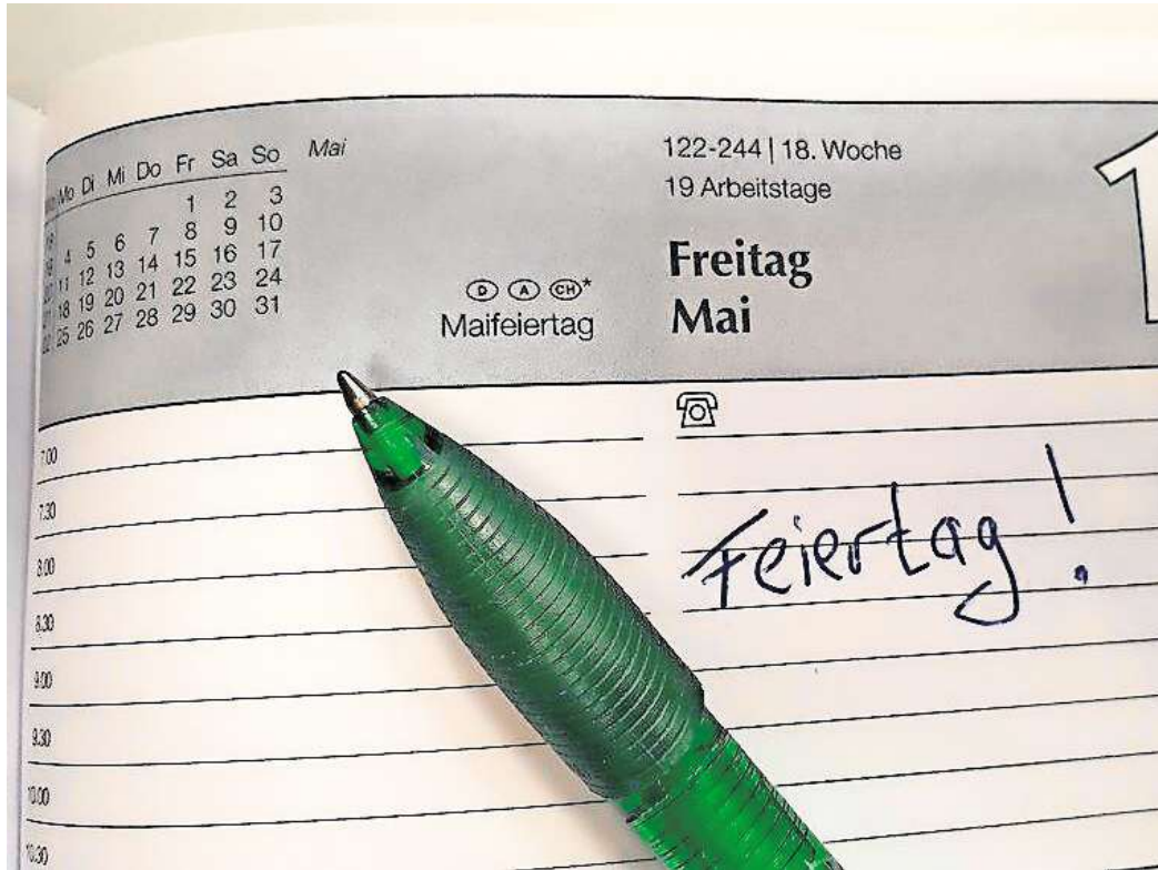
Wären Sie bereit, auf einen Feiertag zu verzichten?

Vielen Befragten wäre es wichtig, eine gewisse Gerechtigkeit bei der Feiertagsverteilung im Lande zu schaffen. Sie würden sich daher wünschen, dass die Bundesländer mit weniger Feiertagen mehr bekommen.