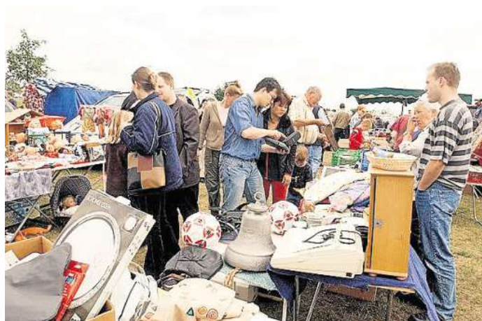
Mekka für Trödelfans: der Flohmarkt am Allerpark.