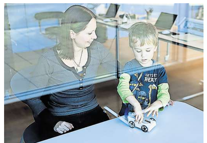
Vielfältiges Ferienprogramm in der Autostadt: Beispielsweise wird als Eltern-Kind-Tandem gemeinsam ein kleines Elektromobil gebastelt.