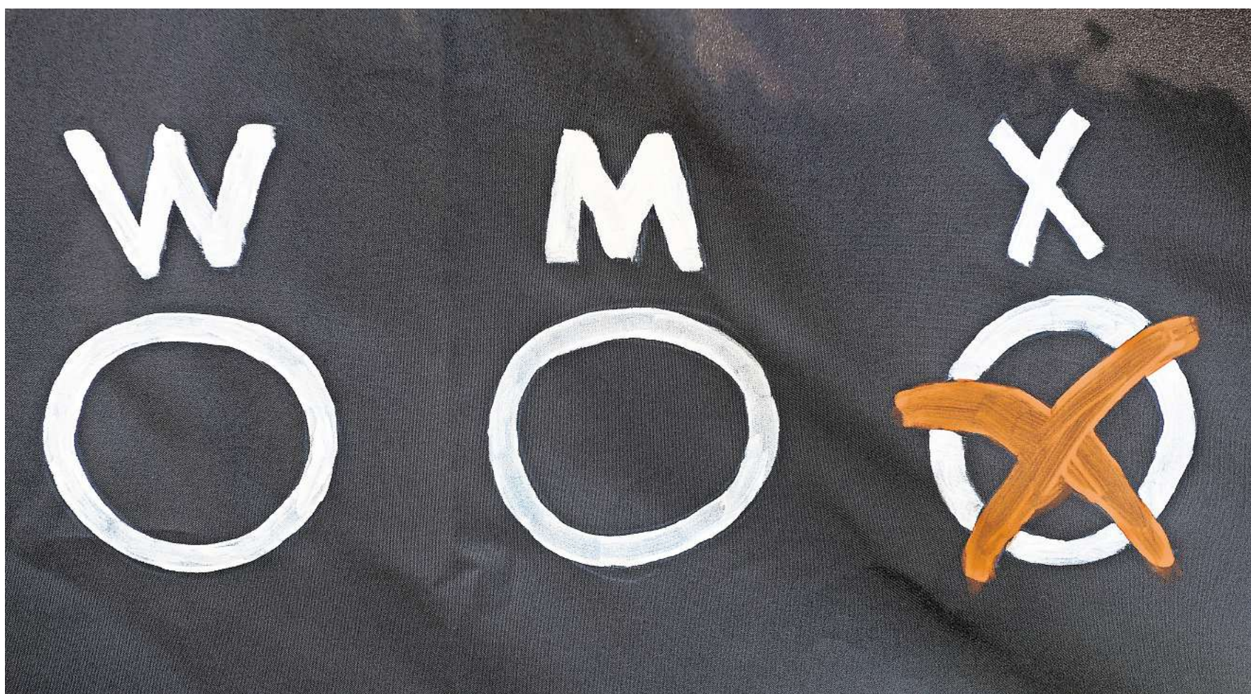
Drei Möglichkeiten für einen Geschlechtseintrag: "W", "M" und "X". Seit dem 1. November 2024 können Menschen in Deutschland ihren Geschlechtseintrag einfacher ändern lassen (Symbolbild).

„Bisher wird noch zu wenig darauf geachtet und ebenso wenig ein Zeichen gesetzt, dass wir als Menschen alle zusammen stehen. Da könnte jeder einzelne Bürger etwas zu beitragen, indem er beispielsweise den CSD besucht, mit uns ins Gespräch kommt oder sich gegen gewalttätige Aussagen an die queere Community stellt. Wenn wir ein großes Miteinander haben, wäre sehr vielen Menschen geholfen“, betont der Sprecher des CSD Wolfsburg.