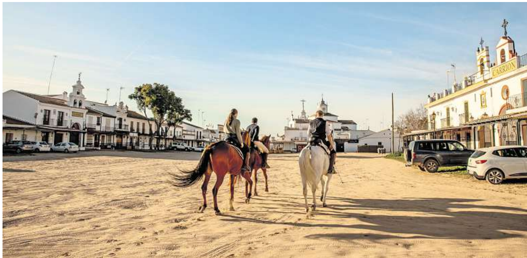
Sand, Staub und Pferde: Willkommen in El Rocío.

Was El Rocío so besonders macht, ist unbestritten das einzigartige Flair. Du wirst bei einem Besuch schnell vergessen, dass du dich gerade mitten in Spanien befindest und die nächste große Stadt nur eine Stunde mit dem Auto entfernt