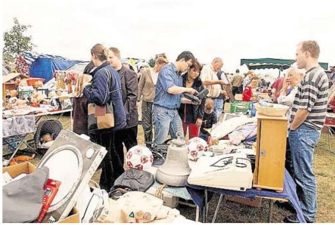
Mekka für Trödelfans: der Flohmarkt am Allerpark.