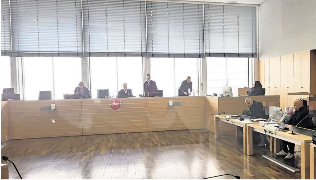
Vor dem Landgericht Braunschweig mussten sich drei Männer aus Jembke und Wolfsburg wegen Drogenhandels verantworten.

Im August 2020 war der Bande die letzte Fahrt nach Berlin zum Verhängnis geworden: Die Ermittler hatten die drei Männer (36, 34 und 35 Jahre alt) schon länger im Visier und griffen schließlich zu. Zuvor war die Bande abgehört worden und komplett von der Polizei observiert. Der 36-Jährige und der 35-Jährige aus Jembke im Landkreis Gifhorn waren in einem Pkw, getrennt von dem 34-Jährigen aus Wolfsburg, in die Bundeshauptstadt gefahren. Dort führten die beiden Gifhorer die Verkaufsgespräche, während der „Fahrer“ in seinem VW Golf wartete. Die beiden Verhandlungsführer