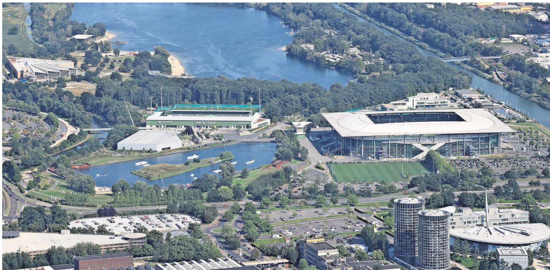
So schöne Ecken hat Wolfsburg: Die Stadt zeichnet sich durch viel Grün aus. Rund um den Allersee und im Allerpark gibt es auf engstem Raum eine Vielzahl von Freizeitangeboten.