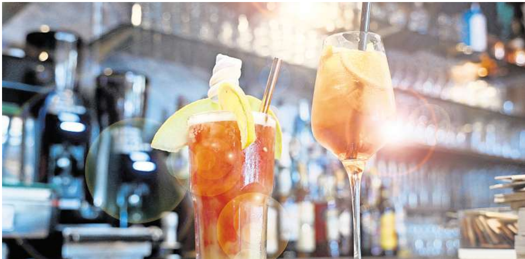
Mal einen Cocktail auf einer Feier trinken - oder doch mehr? Wie viel Alkohol konsumieren Sie?

Laut dem aktuellen Jahrbuch Sucht der Deutschen Hauptstelle für Suchtfragen (DHS) trinken rund 7,9 Millionen Menschen in Deutschland Alkohol in gesundheitlich riskanten Mengen. Etwa 9 Millionen Menschen zeigen sogar einen problematischen Konsum, der bereits zu negativen körperli-