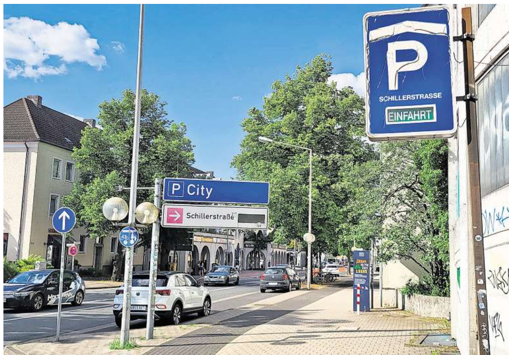
Das Parkleitsystem in Wolfsburg ist veraltet und soll erneuert werden. Das Foto zeigt die Schillerstraße.

Für das Projekt können Mittel des Förderprogramms in Höhe von 825.000 Euro, dies entspricht 65 Prozent der förderfähigen Initialkosten, bereitgestellt werden. Für die Finanzierung des Eigenanteils sind bereits Mittel im Geschäftsbereich Smart City und IT-Services vorhanden. Aufgrund der begrenzten Laufzeit des Förderprogramms ist eine bauliche Umsetzung bereits bis Ende 2025 vorgesehen.