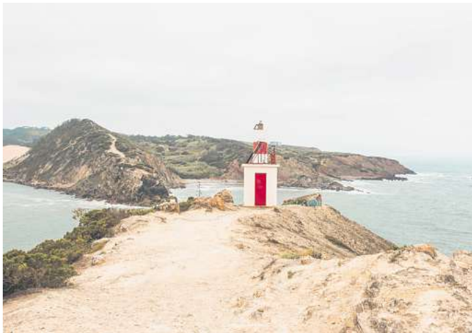
Der Leuchtturm von Sao Martinho do Porto.

Wegen seiner Vielseitigkeit ist dieses Gebiet bei den Einheimischen beliebt: Coimbra erstreckt sich von der Mitte des Landes bis an die Atlantikküste im Westen. Einen der breitesten Strände Europas findest du in Figueira da Foz. Die Küstenstadt liegt auf halber Strecke zwischen Lissabon und Porto und überzeugt mit einer lebendigen Mischung aus Badeort-Vibes und Jugendstil-Architek-