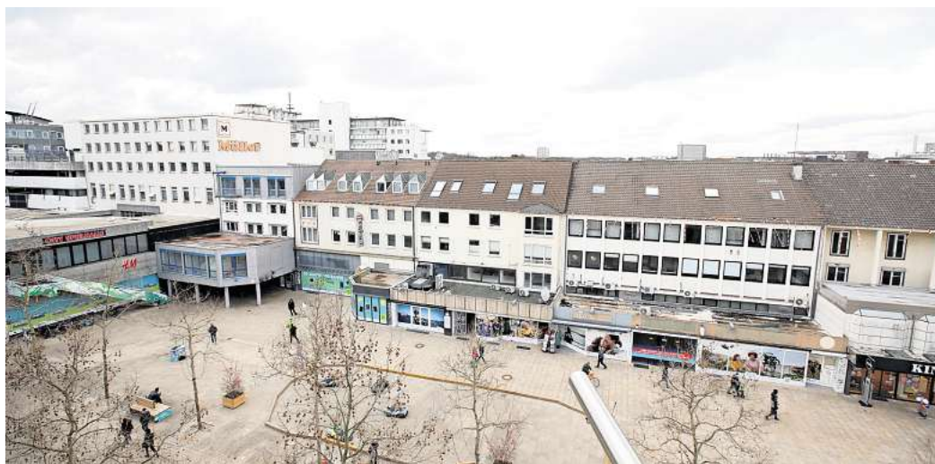
Porschestraße 60-66: Die Häuserzeile wird für die Brawo Arkaden abgerissen. Hier sind die Kosten für Parkplätze besonders hoch.

Andere Ortsräte wie zum Beispiel Vorsfelde oder die Nordstadt sahen noch Beratungsbedarf. Auch im Bauausschuss gab es kürzlich keine Empfehlung aus der Politik, eine weitere Lesung ist erforderlich.