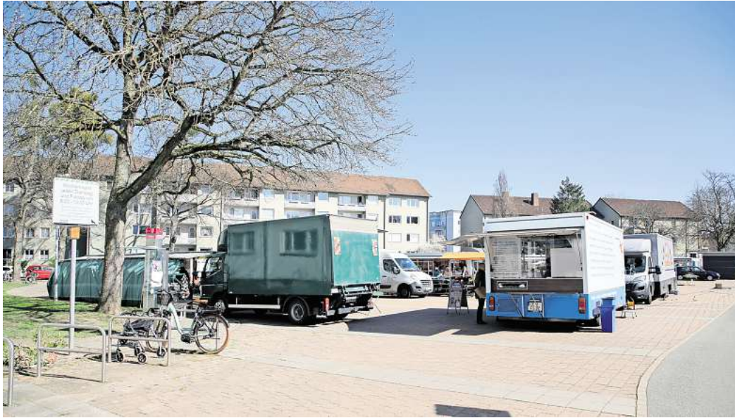
Am Brandenburger Platz soll die „mobiStation“ im westlichen Bereich umgesetzt werden. Parkplätze, die für den Wochenmarkt von Bedeutung sind, sollen nicht angefasst werden.

Ein weiterer Punkt: Durch das Aufstellen der Stationen könne städtischer Raum einer neuen Funktion zugeführt werden und aufgewertet werden. Für die Stationen im gesamten Stadtgebiet plant das Rathaus 925.000 Euro ein. Es werden Fördermittel für