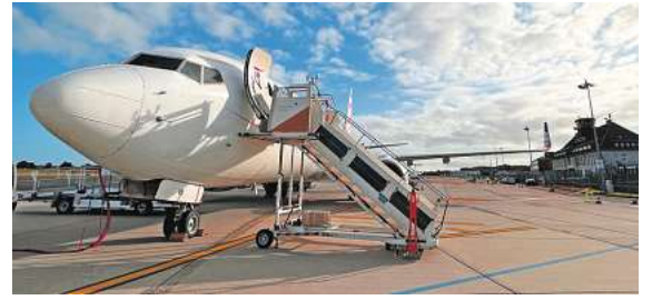
Jetzt noch kurzfristig ab Braunschweig in die Sonne abheben.

Den Katalog, weitere Informationen und Buchungsmöglichkeit dieser exklusiven Angebote unter der kostenfreien (aus dem dt. Festnetz) Buchungshotline T. 08 00 / 38 300 38 (Mo-Fr. 9 - 18, Sa. 9 - 13 Uhr), im FIRST REISEBÜRO SCHMIDT und weiteren Reisebüros oder unter www.fliegen-ab-braunschweig.de .