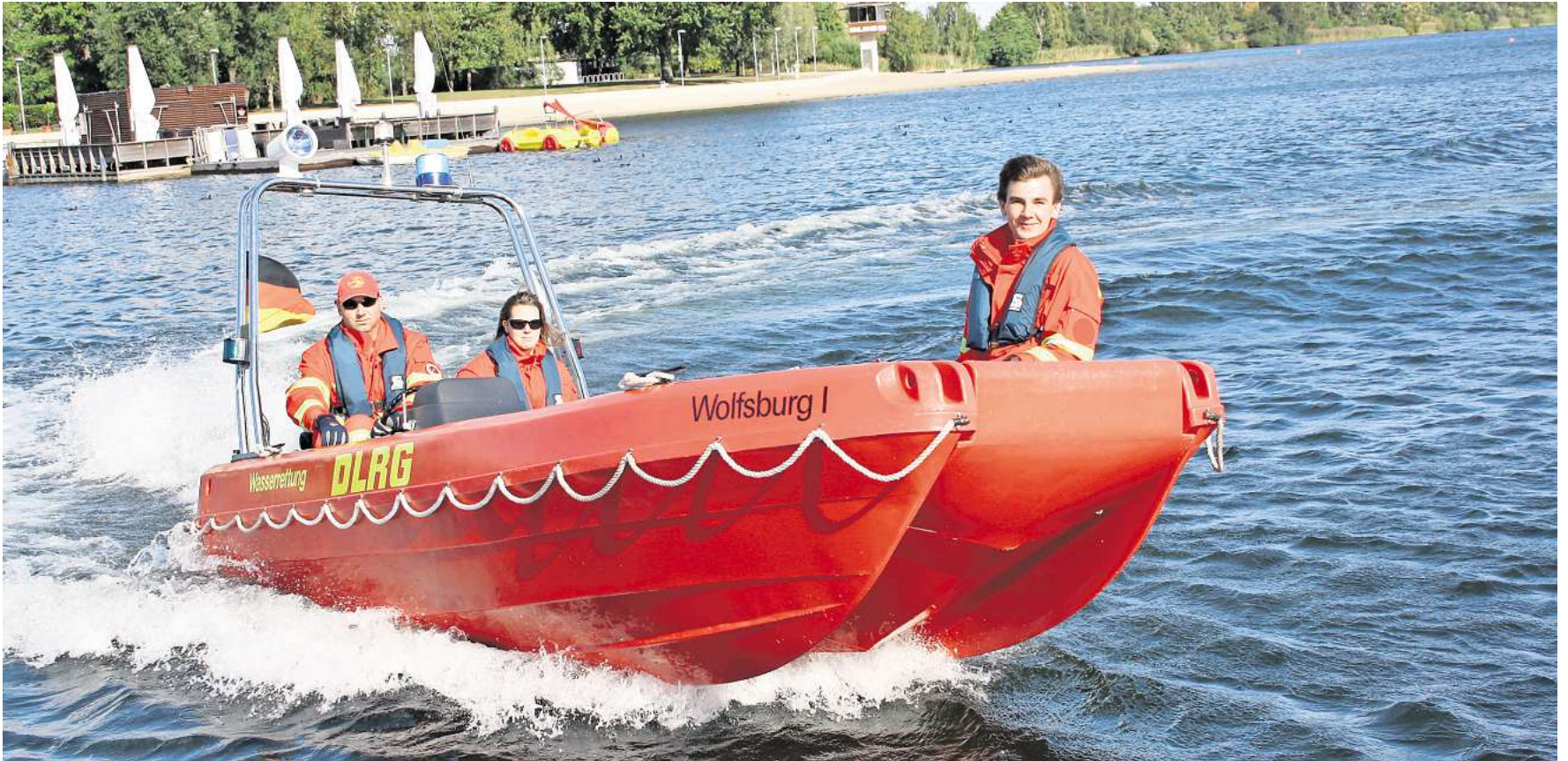
DLRG im Einsatz auf dem Allersee: Die Ehrenamtlichen bereiten sich auf die Freibadesaison vor.