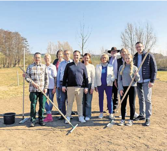
Eine Blühwiese für das Hospiz Heiligendorf: Mitarbeiterinnen und Mitarbeiter der Wobcom packten kräftig an.

tende Geschäftsführerin des Hospizes, ist begeistert: „Mit der naturnahen Blühwiese schaffen wir wertvollen Lebensraum für Insekten und fördern die Artenvielfalt. Gleichzeitig entsteht ein schöner, ruhiger Blickpunkt für unsere Gäste und Mitarbeitenden - ein Ort, der Natur und Hospizarbeit verbindet.“