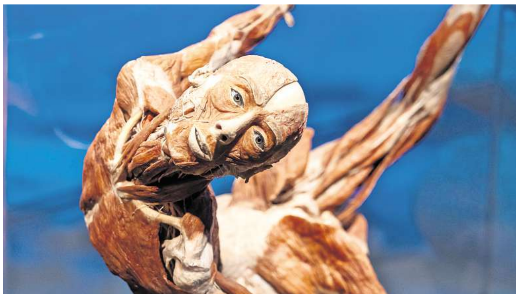
Gewinnen Sie Flex-Tickets für die Körperwelten-Ausstellung in Hannover!

Für diese Ausstellung verlost Hallo Wochenende zusammen mit der WAZ 5 x 2 Flex-Tickets. Die Flex-Tickets ermöglichen Ihnen einen freien Besuch innerhalb der Ausstellungszeiten. Was Sie dafür tun müssen: Ge-