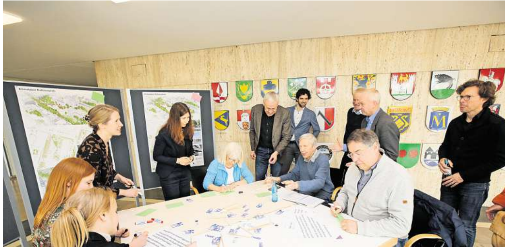
Blick auf die Pläne: Zusammen mit Bürgern wurden die Pläne angeschaut und deren Vorschläge aufgenommen.

Die Mittel, um dies zu erreichen sind Wasser, Grün und eine Bank, die eigentlich viel mehr ist als eine Bank. Ganz nebenbei soll auch noch das Rathaus wieder seinen historischen Eingangsbereich bekommen. „Wir wollen den Rathauseingang wieder als zentralen Punkt inszenieren“, sagt Latz. Dazu soll die historische Treppenanlage wieder freigelegt und das Rathaus selbst auf sein ursprüngliches Niveau gebracht werden. Das bedeutet: Der gesamte untere Bereich des Rathauses wird wieder freigelegt und später so zu sehen sein, wie er es auch 1958 schon war. Denn seit den baulichen Veränderungen der 1970er und 1980er Jahre war dies nur noch teilweise der Fall. „Das Rathaus ist ein faszinieren-