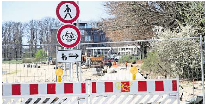
Die Bauarbeiten am Allersee dauern derzeit noch an.

Bereits seit November ist die westliche Promenade am Allersee wegen Bauarbeiten gesperrt. Nach ursprünglichem Zeitplan sollten die Arbeiten eigentlich Ende März abgeschlossen sein. Die SPD-Fraktion wollte in der