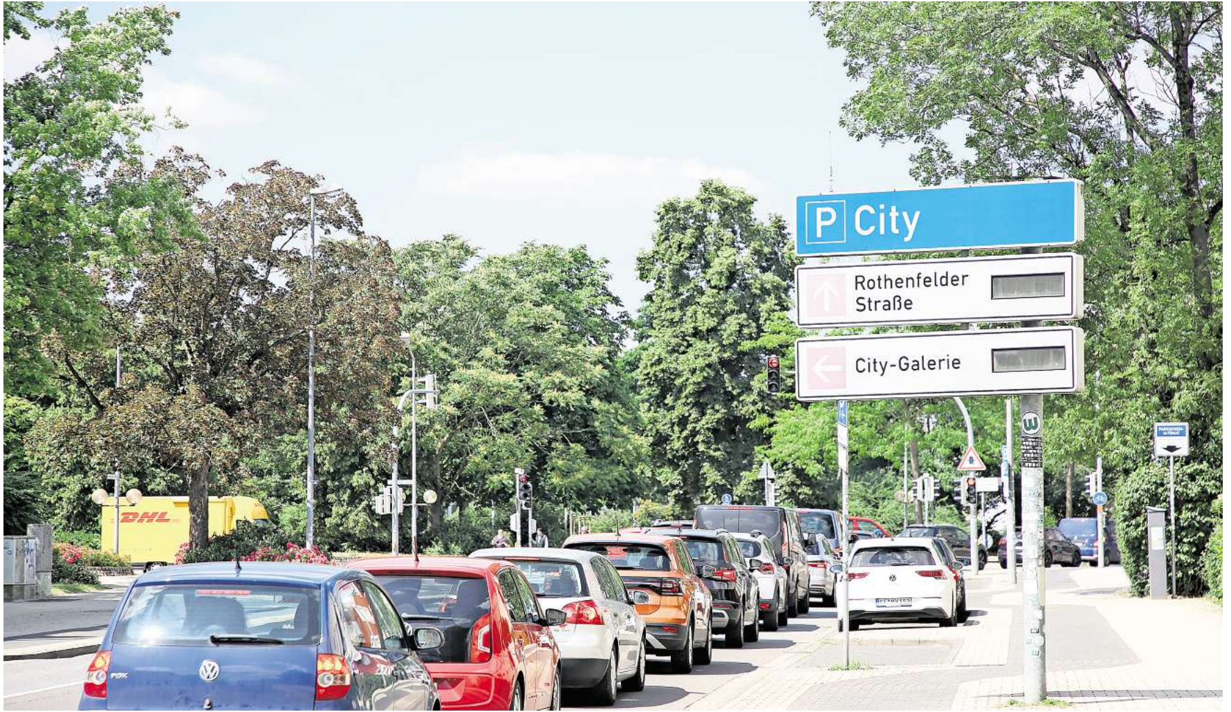
Das Parkleitsystem in Wolfsburg, hier auf der Rothenfelder Straße, wurde 2024 abgeschaltet.