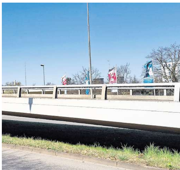
Unter der Brücke am St.-Annen-Knoten lebt ein Obdachloser. Er war für einige Zeit verschwunden.

Wie viele Obdachlose es im gesamten Stadtgebiet gibt, darüber konnte die Stadt Wolfsburg keine Angaben machen.