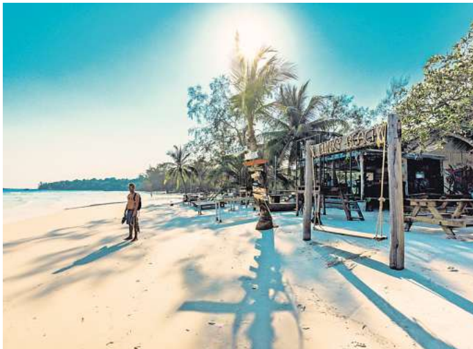
Sandy Beach von Koh Rong – so schön ist es auf der Trauminsel.

Noch ist die Insel aber weitgehend unbekannt, sodass sie im Vergleich zu den thailändischen Inseln Bali oder Phuket ein Geheimtipp unter den Inselparadiesen Südasiens ist. Was du auf Koh Rong erleben kannst und wie du dorthin kommst, verrät dir der reisereporter.