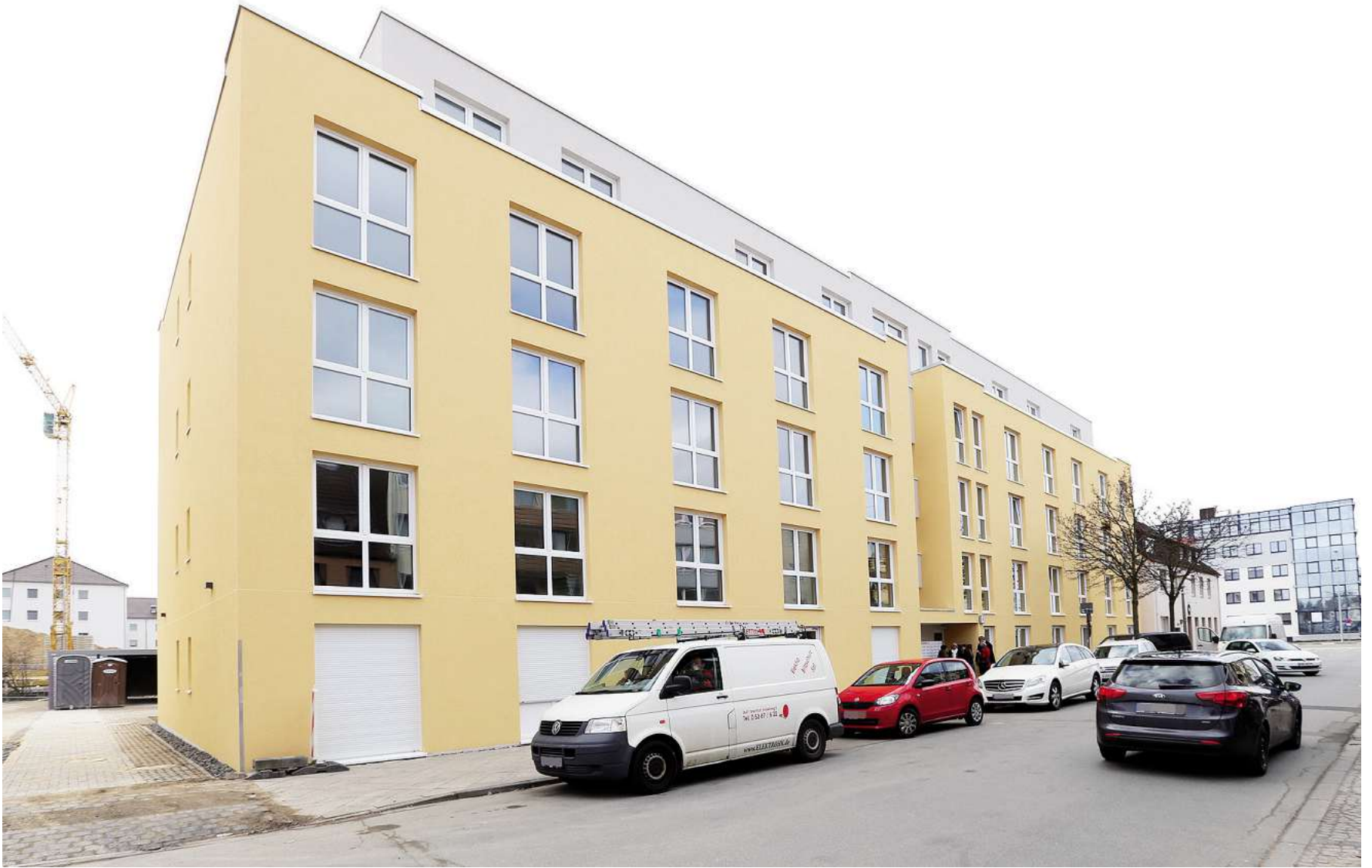
Das Studentenwohnheim in der Seilerstraße: Der Preis für ein Einzelapartment beginnt bei 396 Euro pro Monat.