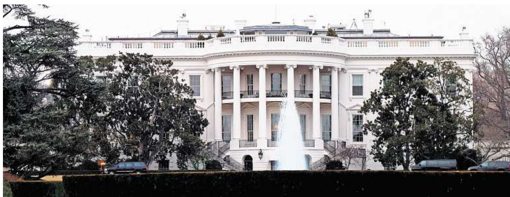
Das Weiße Haus in Washington, D.C. ist Amts- und offizieller Regierungssitz des Präsidenten der Vereinigten Staaten, Donald Trump.

Doch nicht nur wirtschaftlich, auch sicherheitspolitisch gerät Trump ins Visier der Kritik. Nach einem Eklat im Weißen Haus, bei dem er dem ukraini-