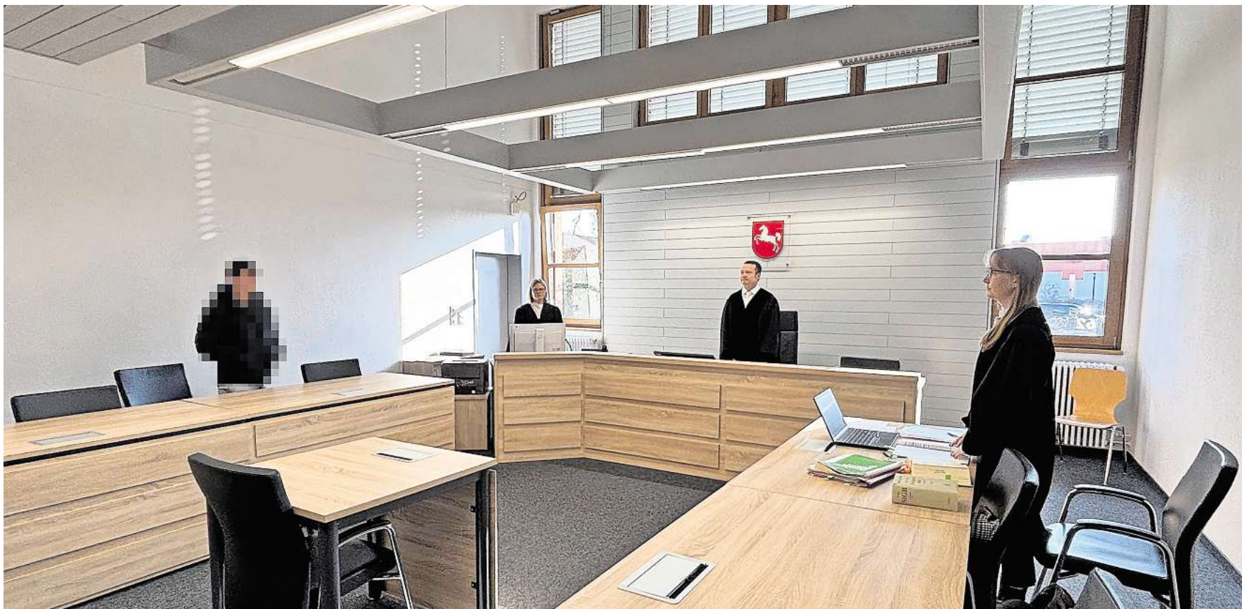
Ein 24-Jähriger hat seine Freundin mit einem Schuhanzieher geschlagen: Der Mann wurde vom Amtsgericht Wolfsburg verurteilt.

Der Richter ordnet ebenfalls ein, dass das Opfer kein Interesse an einer Strafe habe, da dadurch die Beziehung kaputtgehen könnte. Nach der Beweislage sei es zum Schlag gekommen und er müsse sich für die gefährliche Körperverletzung verantworten, betonte der Vorsitzende. Das Gericht verurteilte den 24-Jährigen zur achtmonatigen Freiheitsstrafe, die zur dreijährigen Bewährung ausgesetzt wird. Auch die Auflage mit der Zahlung an den Verein des Frauenhauses muss der junge Mann erfüllen.