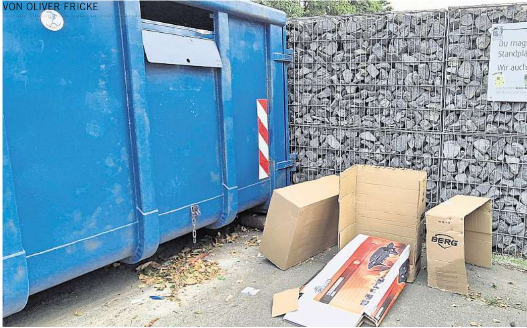
Immer wieder wird Müll neben dem Altpapiercontainer in Kästorf abgelegt.