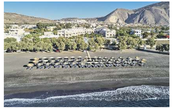
Ausgewählte Hotels, wie hier das 4,5* Premium Santo Miramare auf Santorin stehen in allen Zielen zur Auswahl.

Wer in diesem Frühjahr/Sommer noch ab Braunschweig fliegen möchte, sollte