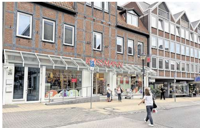
Geschäft wird modernisiert: Der Rossmann in Vorsfelde schließt vorübergehend.

In einigen Regalen herrscht Leere. Hygieneartikel für Damen und Herren sind bis auf wenige Verpackungen komplett ausverkauft. In den Fächern, in denen normalerweise Müsli, Kekse und Öle stehen, ist kaum