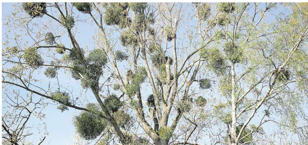
Bekanntes Bild: Einige Bäume im Stadtgebiet sind von Misteln befallen. Wie sie das verkraften, hängt auch von der Art des Baumes ab.

Der Samen keimt dann in der Rinde der Bäume und versucht, in seinem Wirtsbaum Wurzeln zu schlagen. Gesunde Bäume wehren sich gegen den Befall. „Vermutlich hemmen auch Trockenstress und Hitze die Abwehrkräfte der Bäume und er-