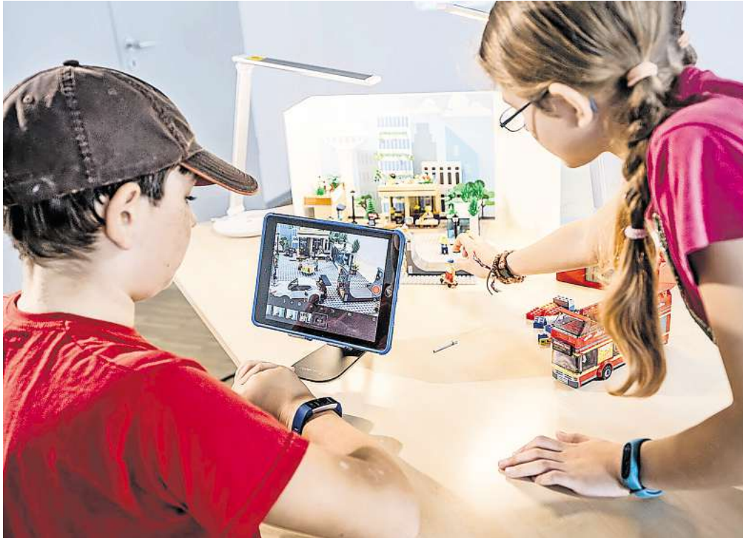
Workshop-Angebote für die ganze Familie gibt es beim Sommerlernspaß in der Autostadt.

• Einige Angebote sind jedoch bereits jetzt fest eingeplant. Dazu gehört die Upcycling-Werkstatt . Hier ist für ein Team, bestehend aus einem Kind und einem Erwachsenen, nachhaltiger Spiele-Spaß garantiert. Von der Autostadt ausgerichtete Computer-Tastaturen sowie Holzspielbretter werden in ein Sudoku-Spiel verwandelt, das sich durch seine ganz persönliche Note auszeichnet. Handwerkliches Geschick und eine ruhige Hand sind gefragt, wenn es darum geht, ganz individuell ein Unikat zu gestalten. Mit dem fertiggestellten Spiel sorgen Eltern und Kinder dafür, ein bleibendes Erinnerungsstück an ihren gemeinsamen Kreativtag zu haben. Zudem ist der Spaß garantiert, wenn das Gehirn mit Sudoku trainiert werden