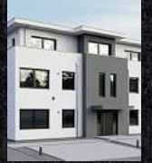
Fenster & Rollläden Schiebeanlagen Faltanlagen

V. Gloger Direktförderung ohne komplizierte Antragstellung auf alle Produkte