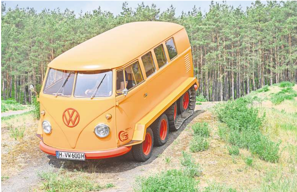
Geländegängig: Der Raupenfuchs ist eines der Fahrzeuge, die in der Autostadt zu sehen sein werden.

Das Spektrum reicht von Einsatzfahrzeugen wie dem Krankenwagen der ersten Generation (T1) und dem T3 Polizeifahrzeug über „Exoten“ wie dem T1 Raupen-Fuchs und einem Weltrekord Allrad T4. Mit dabei sind aber auch der kultige Samba-Bus sowie California-Modelle. Auch Transporter Doppelkabinen aus vielen Jahrzehnten sind zu sehen. Mit den ausgestellten Fahrzeugen soll laut Pressemitteilung