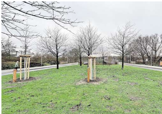
In der Nähe der Eisarena und dem Badeland wurden bereits einige Spendenbäume inklusive Widmungen gepflanzt.

Grundsätzlich gibt es verschiedene Spendenmöglichkeiten von der Neupflanzung eines eigenen Jungbaumes für 300 Euro, über eine Patenschaft für einen bestehenden Baum sowie die Beteiligung an einem Baum per Sammelspende ab 20 Euro. Auch persönliche Widmungen lassen sich