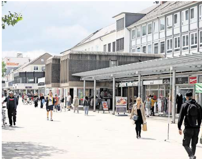
Das Durchschnittsalter der Innenstadtbesucher liegt bei 45,5 Jahren.

Das Durchschnittsalter der Innenstadtbesucher lag bei 45,5 Jahren. Vor allem in der Gruppe der bis 20-Jährigen (3,7 Prozent) sowie in der Gruppe der 21- bis 25-Jährigen (6,1 Prozent) besuchten nur wenige die Innenstadt. Hedde verdeutlicht, dass es für eine attraktive Innenstadt wichtig sei, den richtigen Mix zu finden. Dies bedeute, dass es nicht nur stationären Handel geben müsse, sondern auch ein entsprechend attraktives Angebot an Gastronomie und Freizeitmöglichkeiten. Für eine belebte Innenstadt, so Hedde, sei es wichtig, dass sich deren Attraktivität herumspreche. Hier sieht er in Wolfsburg Potenzial. Denn: Wer die Stadt möge, empfehle sie weiter. Mit jeweils rund 19 Prozent ist in Wolfsburg die Zahl der „Fans“ etwa genauso groß, wie die der Kritiker. Das bedeute, dass es