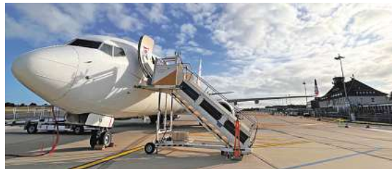
Fliegen ab Braunschweig – exklusiv mit momento by DER SCHMIDT

kostenfreien (aus dem dt. Festnetz) Buchungshotline T. 08 00 / 38 300 38 (Mo-Fr. 9 - 18, Sa. 9 - 13 Uhr), im FIRST REISEBÜRO SCHMIDT und weiteren Reisebüros oder unter www.fliegen-ab-braunschweig.de .