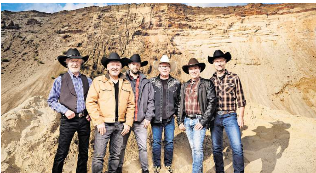
Begeistert seit über 50 Jahren ihre Fans: Die Countryband Truck Stop stellt in der Stadthalle in Gifhorn ihr brandneues Album „Freiheit Pur“ vor.

Seit über 50 Jahren steht die Band für deutschsprachige Countrymusik und blickt auf eine beeindruckende Karriere zurück. Über 6.000 Konzerte, mehr als 20 Millionen verkaufte Tonträger und unzählige Hits wie „Der wilde, wilde Westen“ oder „Take it easy, altes Haus“