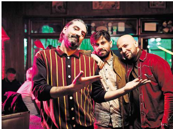
Ein Act bei der Sommerbühne: Šuma Čovjek tritt am 14. Juni im Barockgarten auf.

Prost betont, dass es an den beiden Wochenenden der Sommerbühne ein Genre-Mix gibt, welches für jedes Alter ist. Am Freitag, 20. Juni, möchte die römische Band Veeble das Publikum mitreißen. Die Musiker