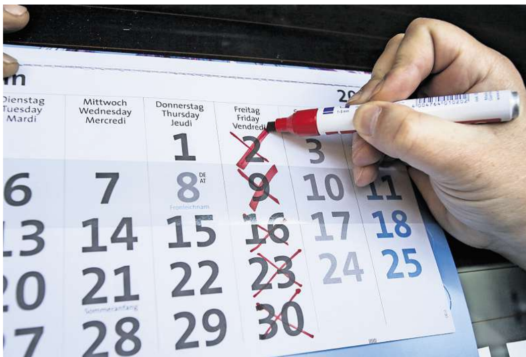
Freitag frei – die neue Realität der 4-Tage-Woche?

Wir möchten Ihre Meinung wissen: Wie stehen Sie zu einer möglichen Einführung der 4-Tage-Woche? Machen Sie mit bei unserer Umfrage. Scannen