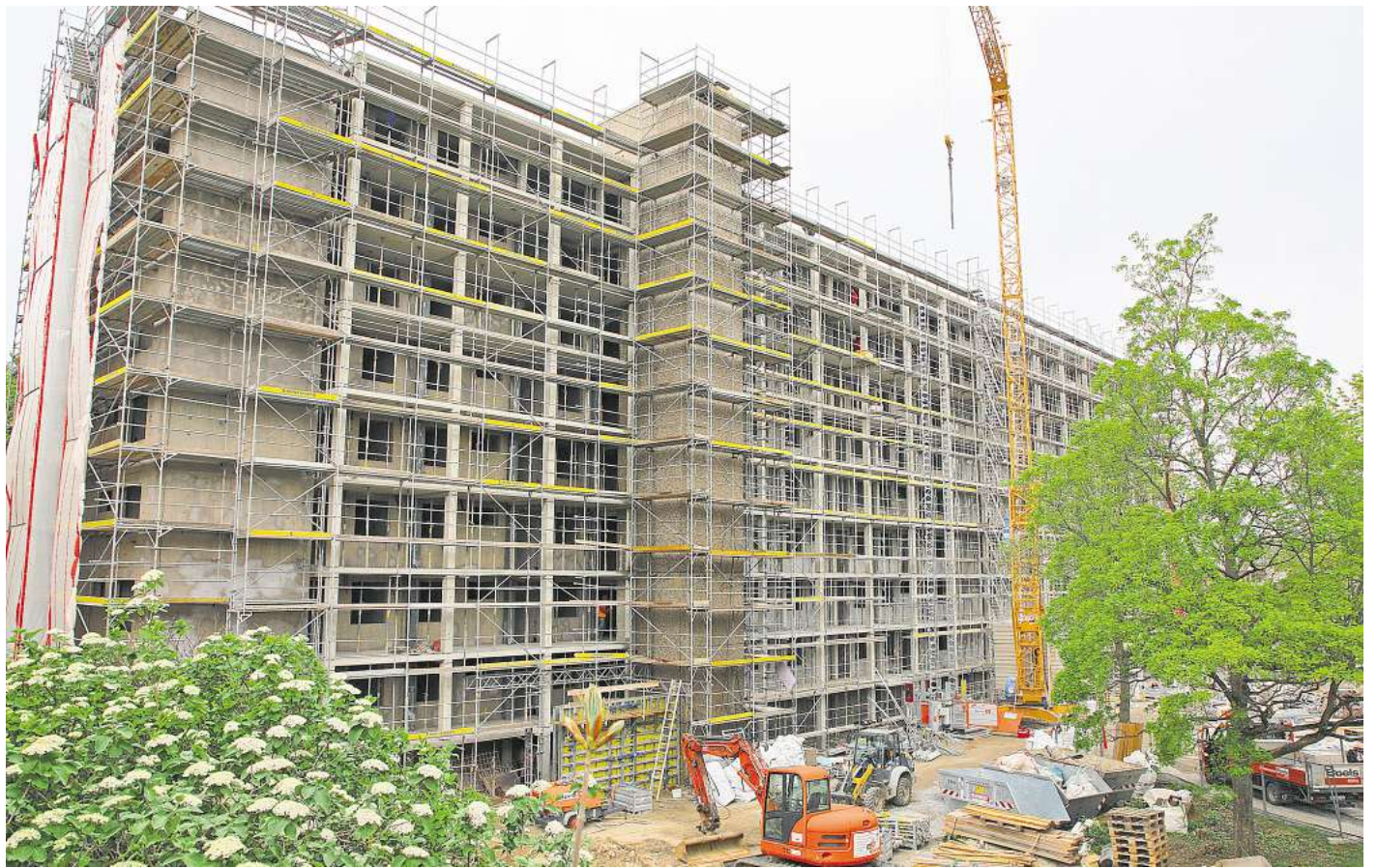
Der Mozartbogen in Fallersleben: VW Immobilien saniert 87 Mietwohnungen. Im Frühjahr 2026 sollen alle Arbeiten abgeschlossen sein.

Auch mit den Laubengängen sei man fertig, die Fenster mit Dreifachverglasung im ersten Bauabschnitt seien schon eingesetzt. Die neuen Fenster seien wesentlich breiter als die vorherigen, was die Wohnungen viel