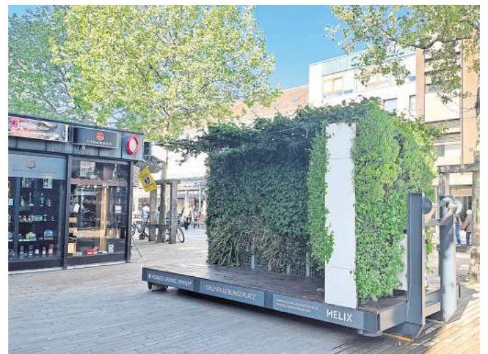
In der Porschestraße wurde ein neues Objekt aufgestellt.

In den kommenden Wochen sollen weitere Spiel-, Sport- und Erholungsangebote folgen, etwa eine mobile 3x3-Basketballfläche, ein Boulderblock, Hüpfspiele