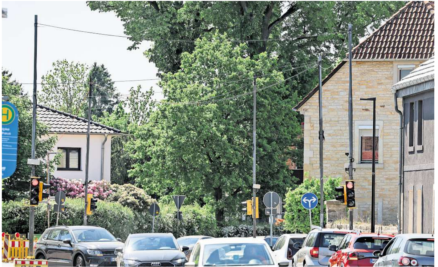
Baustellenärger in Velpke: Bürger halten die Ampeln für ein Hindernis, Landkreis und Polizei halten sie für dringend notwendig.

Die Polizei habe die Verkehrssituation in Velpke sehr genau im Blick, teilt Sprecherin Melanie aus dem Bruch auf Anfrage