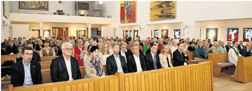
Zum 30-jährigen Bestehen gab es in der St. Bernward Kirche einen Gottesdienst und Grußworte.