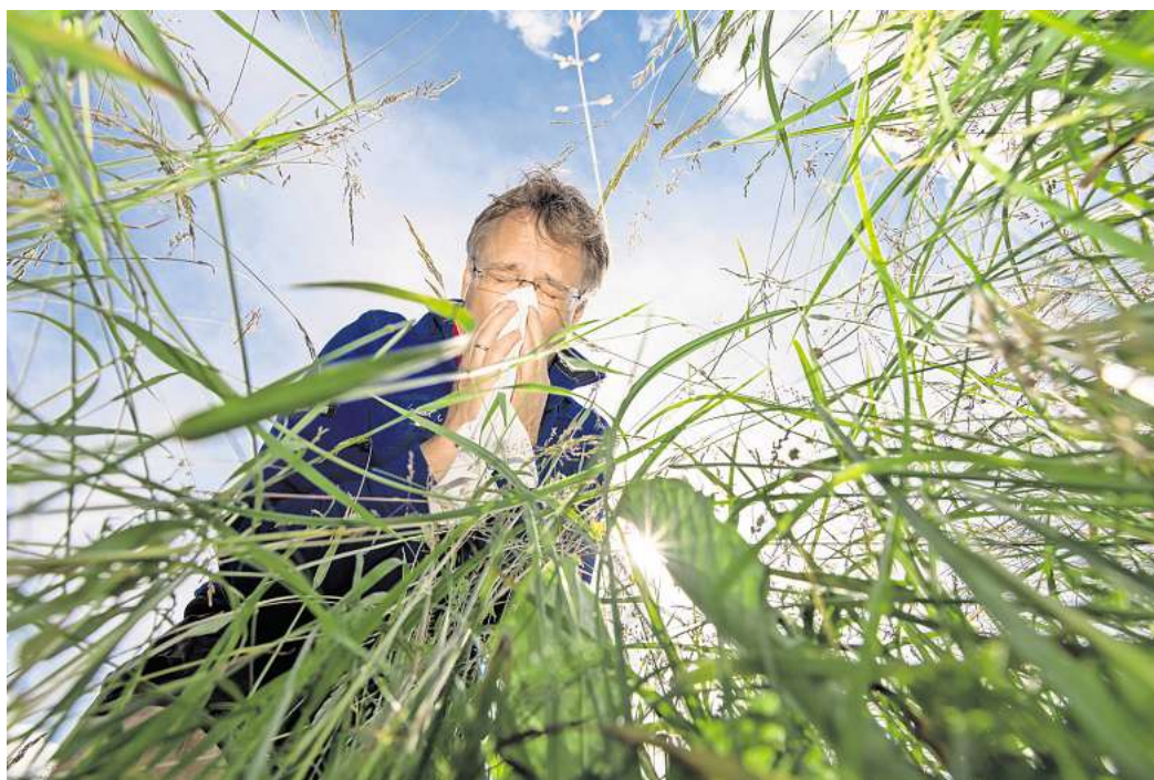
Heuschnupfen im Anflug.