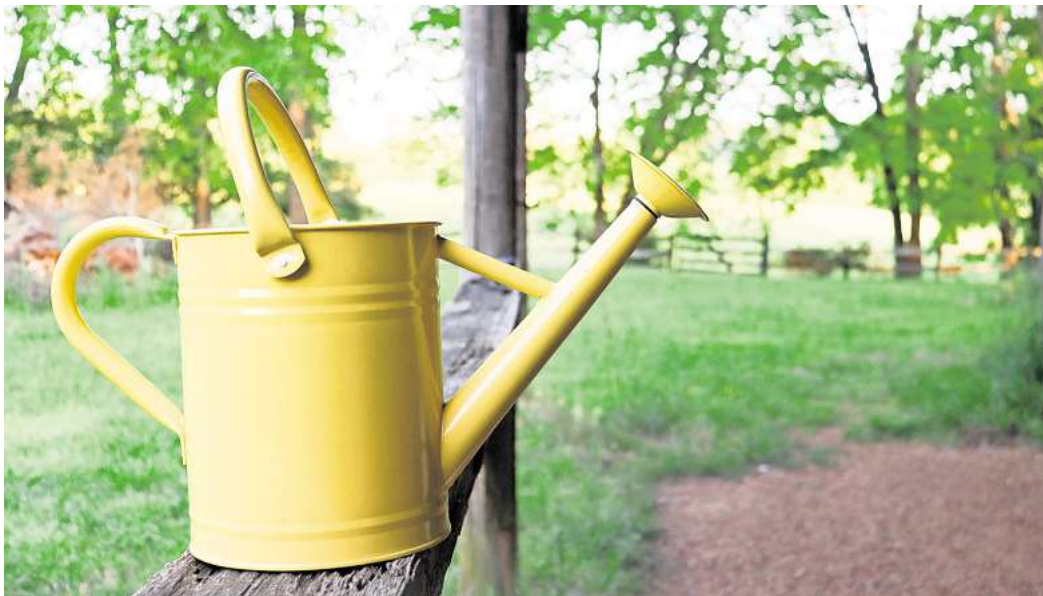
Der Klimawandel macht den Stadtbäumen zu schaffen, deshalb gibt es in vielen Städten Deutschlands Freiwillige, die Straßenbäume gießen.