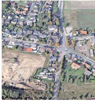
Die Sandkrugkreuzung von oben: Sie soll ausgebaut werden.

Die Folge: Der komplette Verkehr aus Richtung A2/Ochsendorf wird über die L 290 fließen. Die Stadt schlug vor, genau diese Landesstraße verlegen zu lassen, um Knotenpunkte wie die Sandkrugkreuzung nicht zu überlasten. Doch das Land legte sein Veto ein, nach Informationen unserer Zeitung war ihm das Millionenprojekt schlicht zu teuer. In einer Vorlage der Verwaltung heißt es jetzt dazu: „Für diese Variante konnte keine Einigung mit dem Land Niedersachsen erzielt werden. Da auch die Kostenübernahme durch das Land abgelehnt wurde und keine geeigneten Fördermittel eingeworben werden konnten, ist die Variante für die Stadt Wolfsburg finanziell nicht realisierbar.“