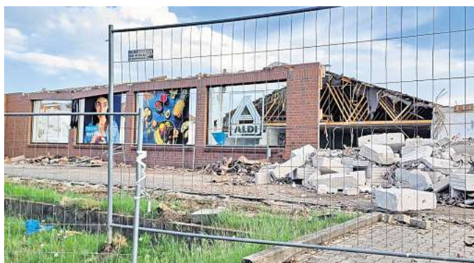
Bauarbeiten: Aldi Nord hat mit dem Abriss des bisherigen Marktes begonnen. Das neue Gebäude soll schon im November fertig sein.

Für neue Filialen habe Aldi-Nord ein einheitliches Konzept entwickelt: Die Einkaufsatmosphäre solle „hell und freundlich“ sein. Die Verkaufsfläche soll von aktuell 799 auf 1.290 Quadratmeter wachsen. In allen Märkten würden gleich hinter dem Eingangsbereich 120 frische