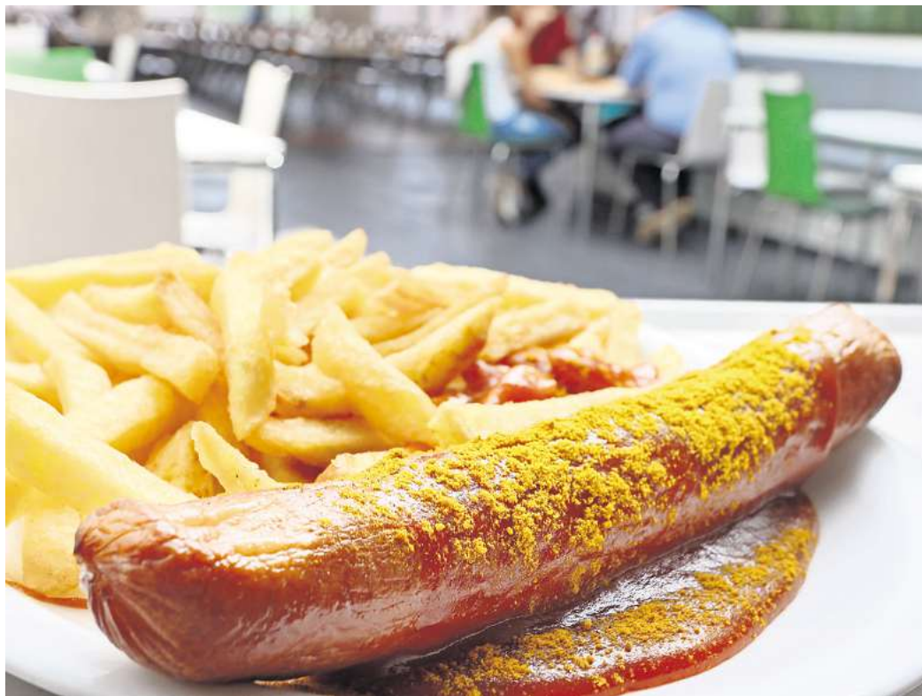
Currywurst mit Pommes ist nach wie vor als schnelle Mahlzeit beliebt.

Direkt zur Umfrage: Einfach den QR-Code mit dem Handy scannen.