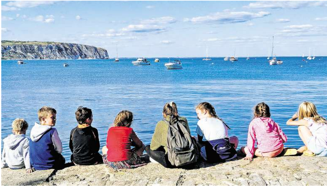
Zentral einheitliche Sommerferien haben Vorteile aber auch viele Nachteile.