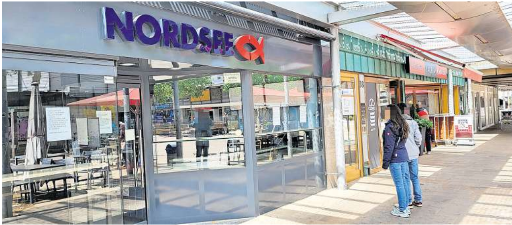
Vor verschlossenen Türen: Die Nordsee Filiale in der Porschestraße 40 in Wolfsburg ist geschlossen.

Bereits im März dieses Jahres hatte die besagte Filiale der Fisch-Restaurant- und Imbisskette vorübergehend geschlossen. Im