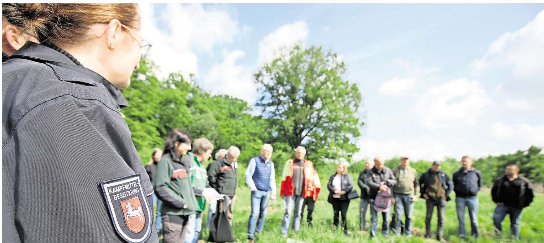
Ortstermin auf der „Neuen Wiese“ bei Lehre. Die mehrjährige Kampfmittelräumung konnte abgeschlossen werden.