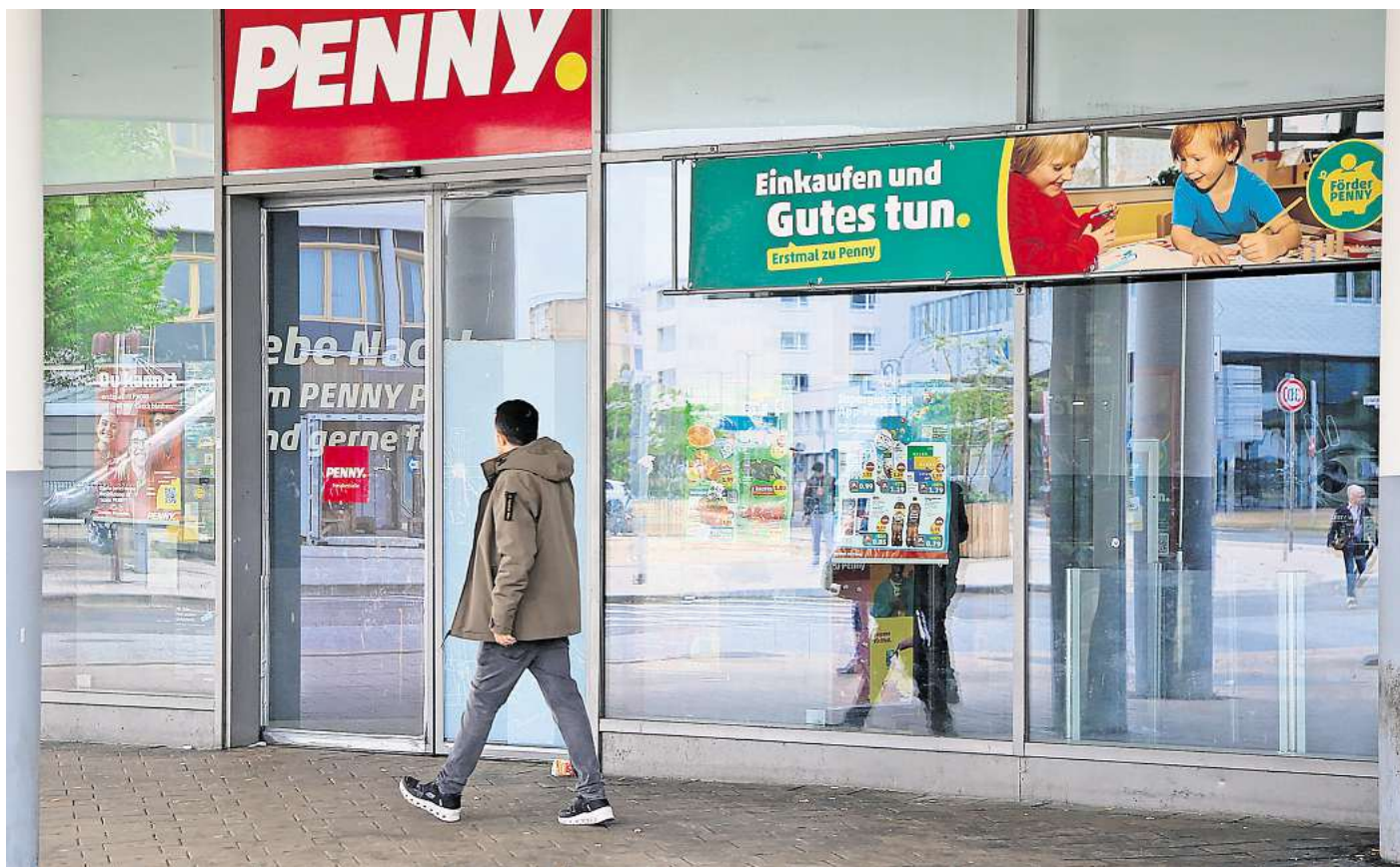
Ende Januar 2025 hatte der 26-Jährige bei Penny in der Porschestraße die Glastür mit einer Fußplatte eingeworfen.

Nach den ersten Taten kam der 26-Jährige in Untersuchungshaft, aus der er am 27. Januar dieses Jahres entlassen wurde. Noch in der Nacht auf den 28. Januar beging er erneut eine Straftat. Er warf bei Penny in der Porschestraße die Glastür mit einer Fuß-