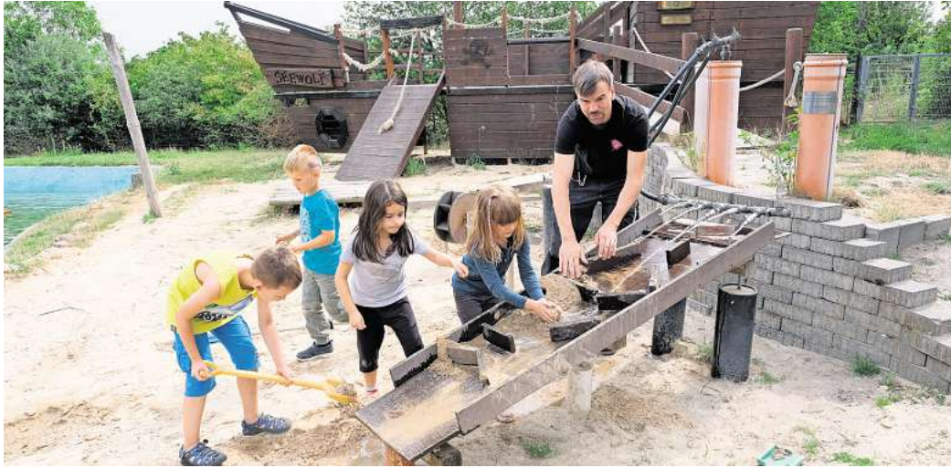
Fallersleben: Seit 50 Jahren gibt es den Aktivspielplatz.