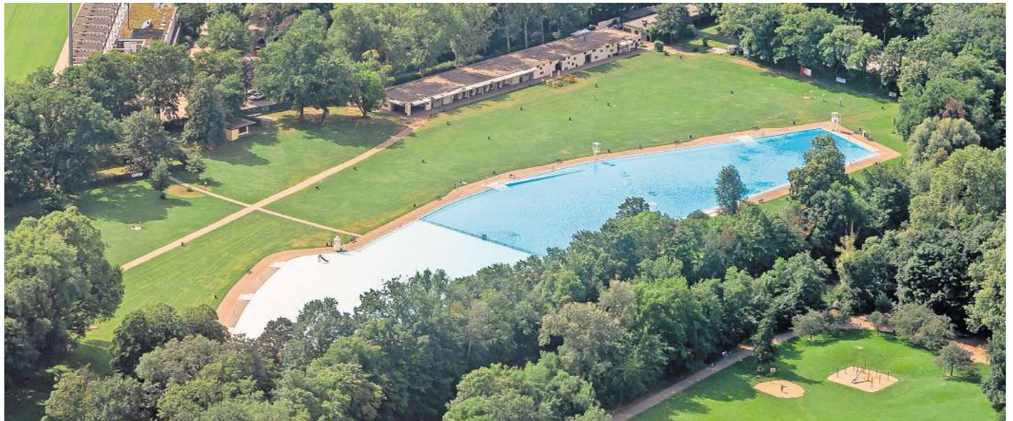
Das Brentanobad hat 14.500 Quadratmeter Wasserfläche.

Die Bäder Betriebe Frankfurt (BBF) nennen das Freibad „Frankfurts Mittelmeer in Rödelheim“ und bezeichnen das großzügige Becken als „wohl