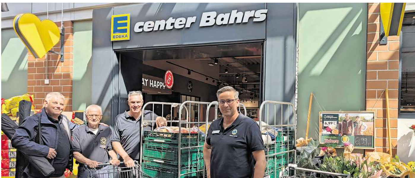
Ein Artikel mehr: Der Lions Club Wolfsburg-Vorsfelde sammelte Lebensmittelspenden vor dem Edeka Center Bahrs in Vorsfelde.