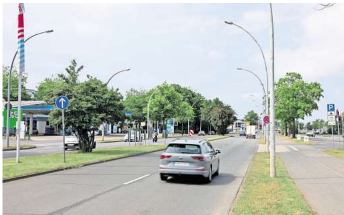
Die Heinrich-Nordhoff-Straße soll stadtauswärts zwischen den Kreuzungen mit der Saarstraße und der Lessingstraße saniert werden.

Stadt saniert in Ferien unter anderem die Braunschweiger Straße und die Heinrich-Nordhoff-Straße