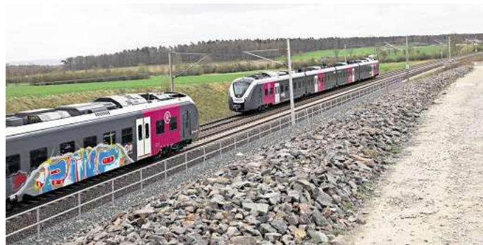
Eine Großbaustelle geht, die andere kommt bald: Nach dem Ausbau der Weddeler Schleife stehen in den kommenden Jahren neue Vollsperrungen auf der Strecke Hannover-Berlin bevor.

Die Sanierung der stark befahrenen Strecke zwischen Hamburg und Berlin wird als großes Projekt der Bahn angesehen. In den neun