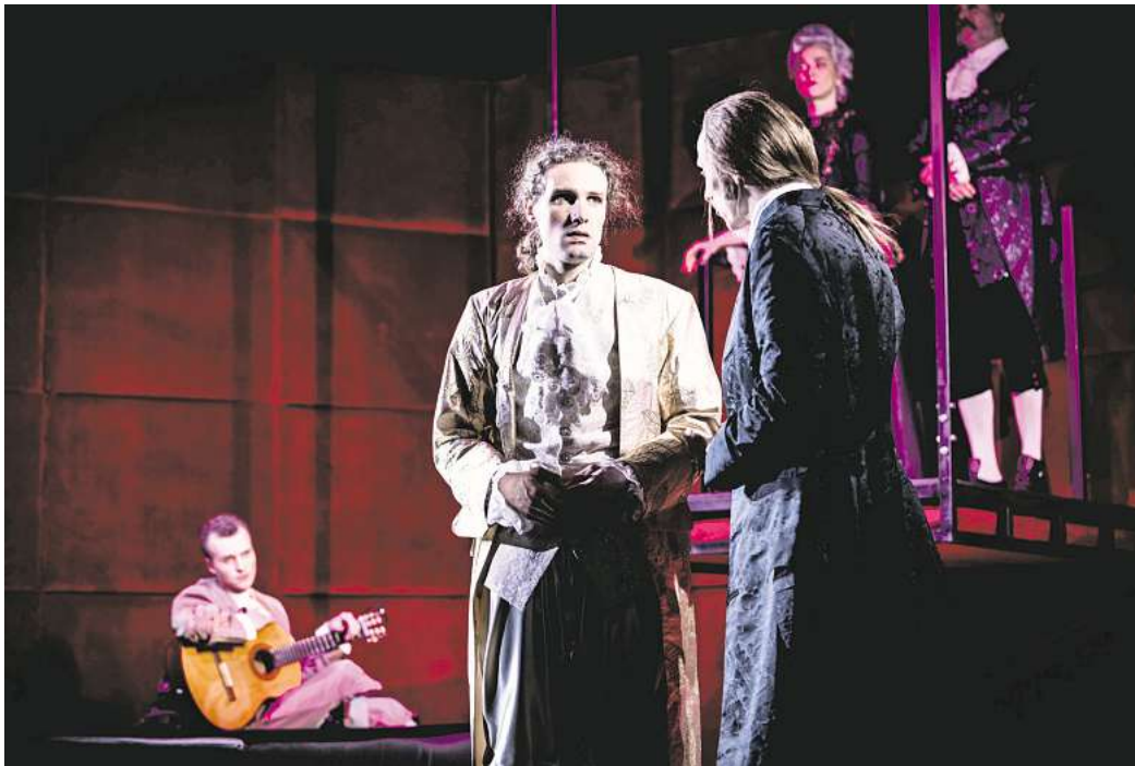
„Die Königin und der Besuch des Leibarztes“ im Schlosstheater Celle

Ein Stück voller Spannung, Humor und tiefgründiger Dialoge, dass dich in die Welt der höfischen Macht und menschlichen Schwächen entführt. Tauchen