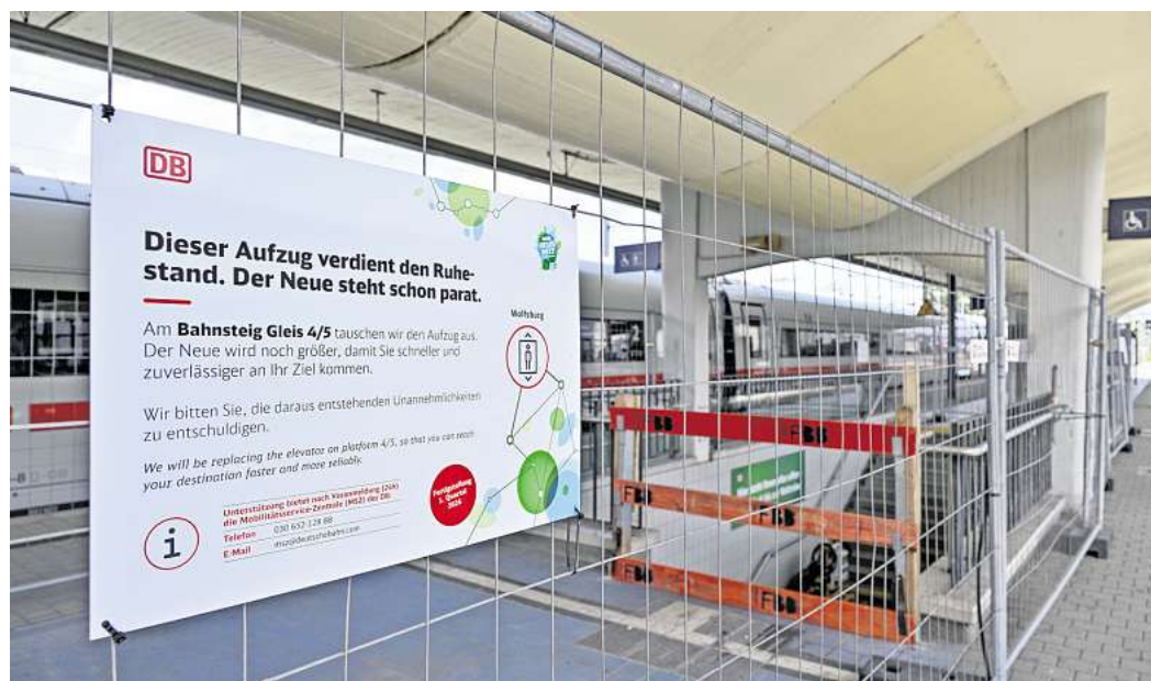
Mit dem Aufzug gelangt man derzeit nicht auf die Bahnsteige von Gleis 4 und 5.