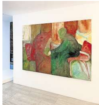
Der Kunstverein Wolfsburg zeigt aktuell die Ausstellung „Abenteuer Körper“.