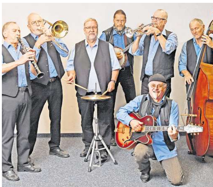
Seit vielen Jahren ist die Saratoga Seven Jazzband ein fester Bestandteil von Jazz & more.

„Seit vielen Jahren ist die Saratoga Seven Jazzband ein fester Bestandteil von Jazz & more