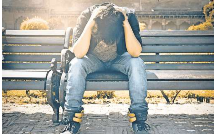
Fast die Hälfte der jungen Menschen in Deutschland fühlt sich moderat oder stark einsam.