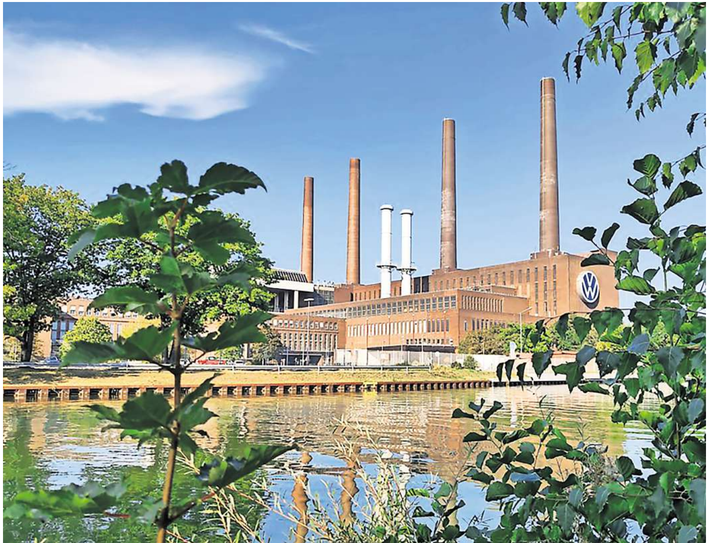
Neben den berühmten VW-Türmen hat Wolfsburg auch kulturell eine Menge zu bieten.

Das Kunstmuseum zeigt wechselnde Ausstellungen, bietet Vorträge, Finissagen, Workshops und öffentliche Führun-