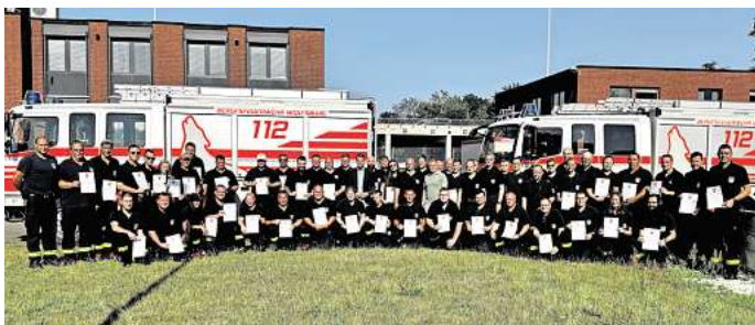
101 Feuerwehrfrauen und -männer wurden mit der Ehrennadel des Landes Niedersachsen ausgezeichnet.

Am Nachmittag des 26. Dezember 2023 war die Feuerwehr Wolfsburg gegen 13 Uhr alarmiert worden. Innerhalb einer Stunde standen drei komplette Züge sowie die Führungsunterstützungsgruppe auf dem Schützenplatz in Fallersleben bereit zum Abmarsch, um im benachbarten Landkreis Wolfenbüttel zu helfen. Die Kräfte rückten aus, um unter anderem ein Seniorenheim vor den Wassermassen zu schützen – auf einer Länge von rund 800 Metern. Sie errichteten Deiche, verlegten Sandsäcke und arbeiteten unermüdlich bis in die frühen Morgenstunden des