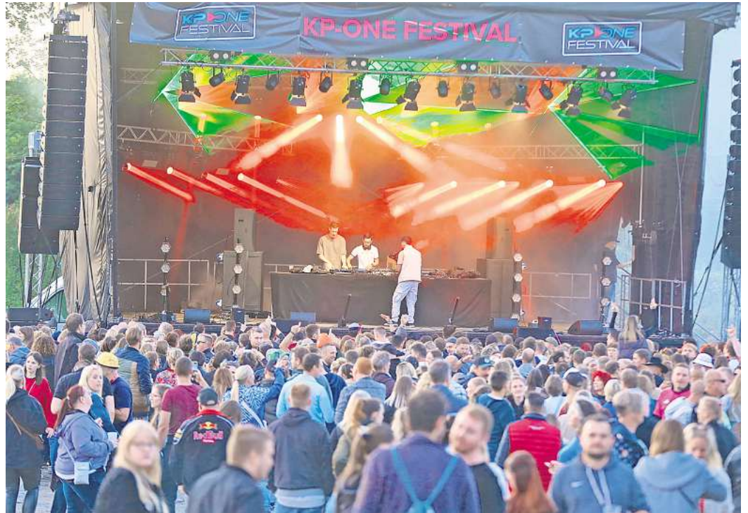
Mehr als 8.000 Menschen kamen im letzten Jahr zum KP-One Festival nach Neindorf.

Direkt zur Umfrage: Einfach den QR-Code mit dem Handy scannen