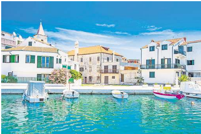
Das Küstenstädtchen Pirovac liegt idyllisch in einer tief eingeschnittenen Bucht der dalmatinischen Küste.

An der Grenze zu Serbien gelegen, ist Vukovar eigentlich kein klassisches Urlaubsziel – und genau darin liegt sein Reiz. In den 1990er-Jahren war die Stadt an der Donau das Zentrum des Kroatienkriegs, bei dem viele historische Gebäude zerstört und die Einwohnerinnen und Einwohner vertrieben wurden.