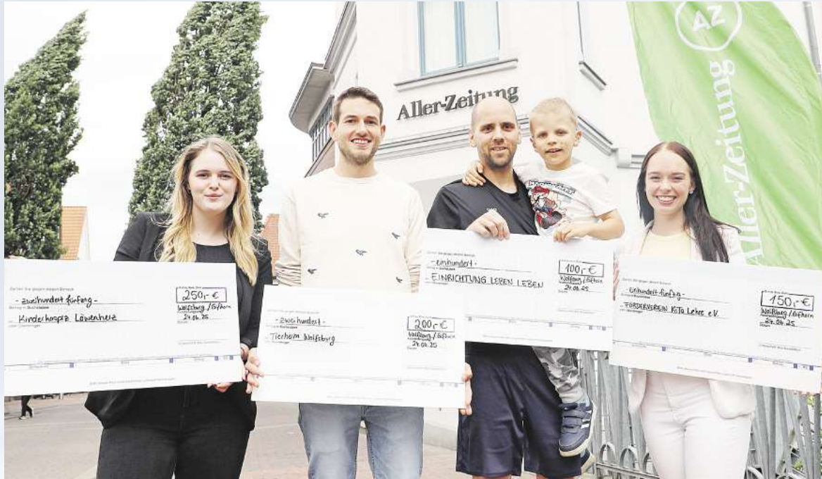
Ansporn und Gemeinschaftsgefühl erlebten die glücklichen Sieger und Unterstützer des AZ/WAZ-Pfingstlaufs.

S trahlende Gewinner, die sich für ihre Herzensprojekte stark machen: Insgesamt 120 Läuferinnen und Läufer starteten beim großen Pfingstlauf, den die AZ/WAZ zusammen mit ihren Partnern Audi BKK und Egger Kunststoffe GmbH und Co. KG auf die Beine gestellt hatten. Sie füllten das Konzept „Laufen und dabei Gutes tun“ mit Leben.