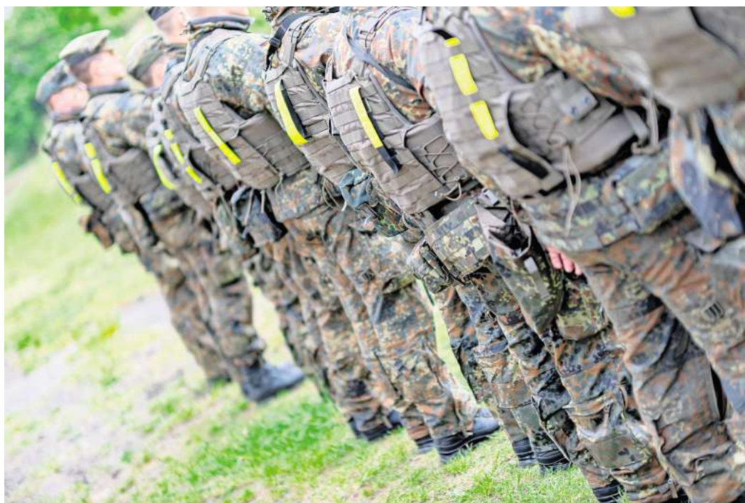
Bundeswehr-Soldaten bei einer Übung.

Direkt zur Umfrage: Einfach den QR-Code mit dem Handy scannen.