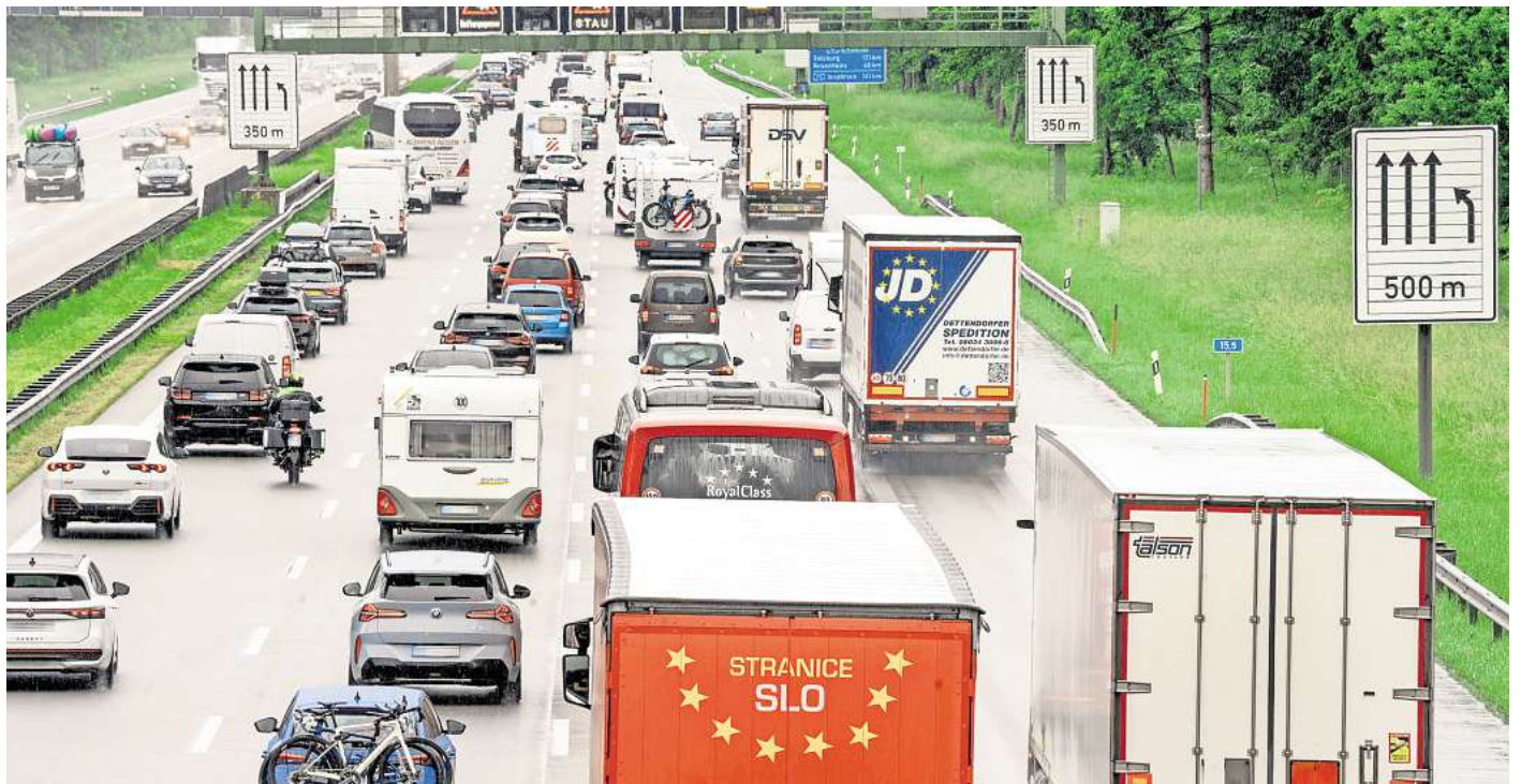
Sommerhitze und lange Staus können die Fahrt in den Urlaub zu einer Zerreißprobe für die Nerven werden lassen. Der TÜV Wolfsburg empfiehlt zehn smarte Helfer für heiße Tage.

2. Lenk- und Spurassistent: Diese Funktion unterstützt aktiv beim Spurhalten und reagiert, wenn Abweichungen registriert werden. Das entlastet