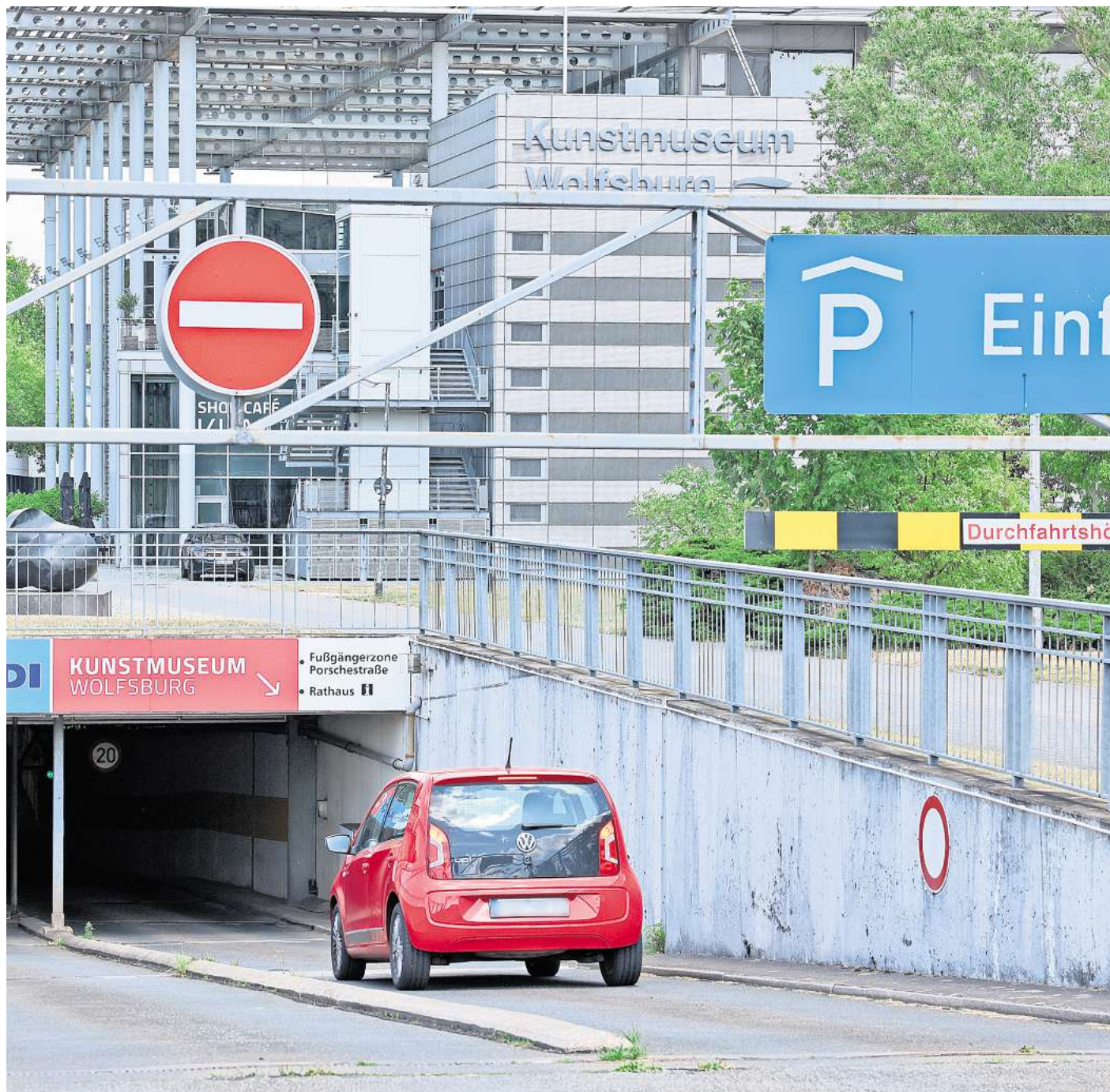
Wird auf ein neues, digitales System umgestellt: das Parkhaus Rathaus.