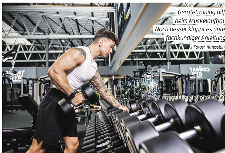
Gerätetraining hilft beim Muskelaufbau. Noch besser klappt es unter fachkundiger Anleitung.

Außerdem gibt es – nur am Eröffnungswochenende – den exklusiven Re-Opening-Deal: Nur an diesen beiden Tagen entfällt