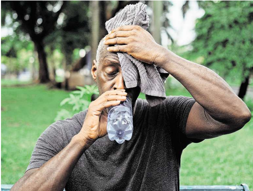
Die WMO erwartet, dass die weltweiten Durchschnittstemperaturen in den kommenden fünf Jahren auf oder nahe dem bisherigen Rekordniveau bleiben werden.

„Diese neuen Vorhersagen deuten darauf hin, dass wir sehr nah dran sind, dass 1,5-Grad-Jahre alltäglich werden“, sagte Scaife am Dienstag bei einer Pressekonferenz des britischen Science Media Centers. „Wir hatten 2024 schon eines, aber die Häufigkeit nimmt zu.“ Der „European State of the Climate 2024“-Report der WMO hatte zuletzt gezeigt, dass 2024 das erste Kalenderjahr war,