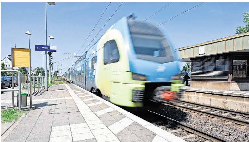
Viele Menschen reisen bequem mit dem Zug

Viele Deutsche setzen auf die Bahn, um entspannt und umweltfreundlich ans Ziel zu kommen. Die Zugfahrt ermöglicht es, die Landschaft zu genießen