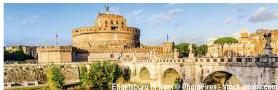
Engelsburg in Rom

Veranstalter An- und Abreise: Reisepartner Fuhrmann Mundstock international GmbH, Ernst-Böhme-Str.17b, 38112 Braunschweig Es gelten die aktuellen ARB auf fumu-reisen.de/files/ARB_2025.pdf .