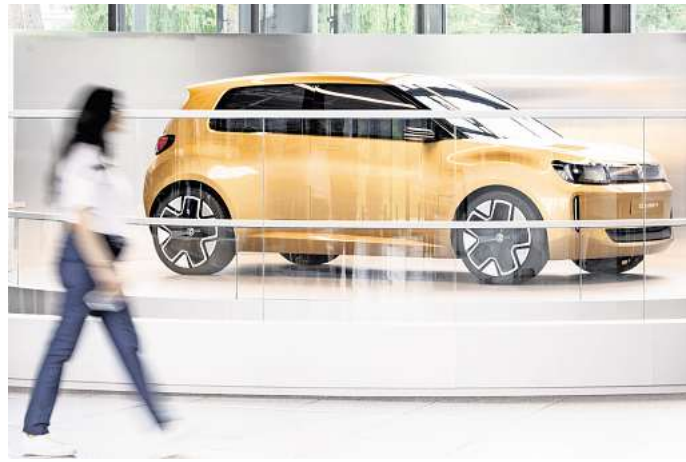
Volkswagens künftiges elektrisches Einstiegsmodell: Ab sofort ist das Showcar Volkswagen ID. Every1 auf der Piazza der Autostadt in Wolfsburg zu sehen.

In der Autostadt bekommt man den ID. Every1 nun erstmals aus der Nähe zu sehen. Die Ausstellung auf der zentralen Piazza ist frei zugänglich. Kein gläserner Turm, keine Virtual-Reality-Präsentation – einfach ein ech-