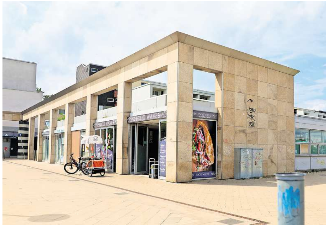
Schon jetzt sind einige Läden in Westhagen aufgrund des bevorstehenden Abrisses des Einkaufszentrums geschlossen.

stellen sich jetzt Fragen: Wann muss ich ausziehen? Wo finde ich Ersatzwohnraum? Wie wird die Nahversorgung in der Zwischenzeit sichergestellt? Der Eigentümer betont, dass individuelle Lösungen gemeinsam erarbeitet werden sollen. Auch die Öffentlichkeit könne sich mit Anliegen direkt an das Unternehmen wenden.