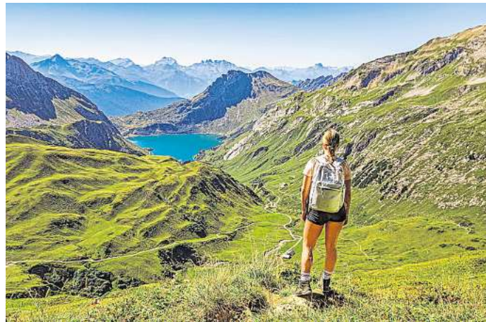
Eine junge Frau steht auf einem Berg und schaut auf den Spullersee. Er ist eine Station auf dem Lechweg.