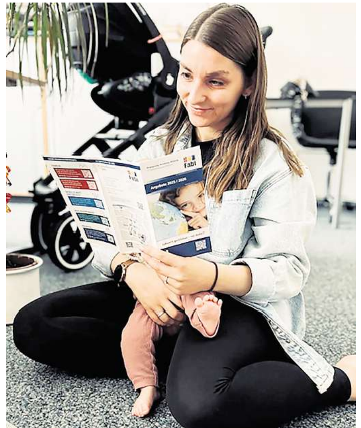
Die Evangelische Familienbildungsstätte Wolfsburg (Fabi) stellt ihr neues Programm mit über 400 Kursen vor.

Für Familien bietet die Fabi erneut ein breites Spektrum an Angeboten: vom Geburtsvorbereitungskurs, über Babycafé (dienstags, ohne Anmeldung) Eltern-Kind-Gruppen, Bewegungsangebote, kreative Vater-Kind-Tage bis hin zu saisonalen