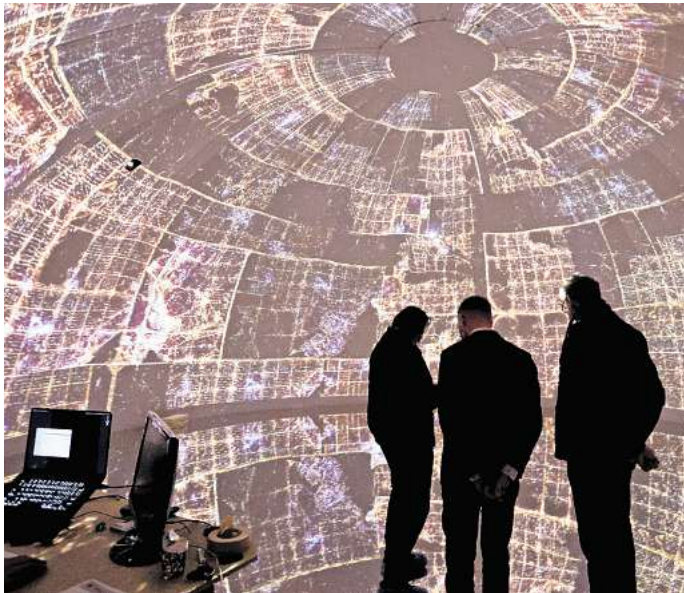
Publikumsrenner: Die faszinierende Ausstellung „Leandro Erlich: Schwerelos“ ist noch bis Mitte Juli geöffnet.