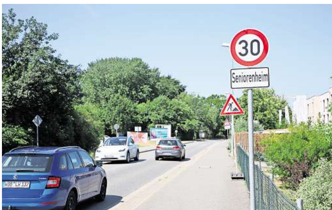
Seniorenwohnanlage „Schönes Leben“: Ab der Ecke Sandkrugstraße/Ostpreußenstraße gilt Tempo 30.

Zur Geschichte: Die Seniorenwohnanlage „Schönes Leben“ an den Sandkruggärten wurde im Frühjahr 2024 offiziell eröffnet. Sie befindet sich an der Sandkrugstraße 42 am Reislinger Windberg. Um die Sicherheit der Bewohner der Seniorenwohnanlage zu erhöhen, hat die Stadt Wolfsburg zwischen Ostpreußenstraße und der Zufahrt zum Kleingartenverein Schäferbusch eine Tempo-30-Zone eingerichtet.