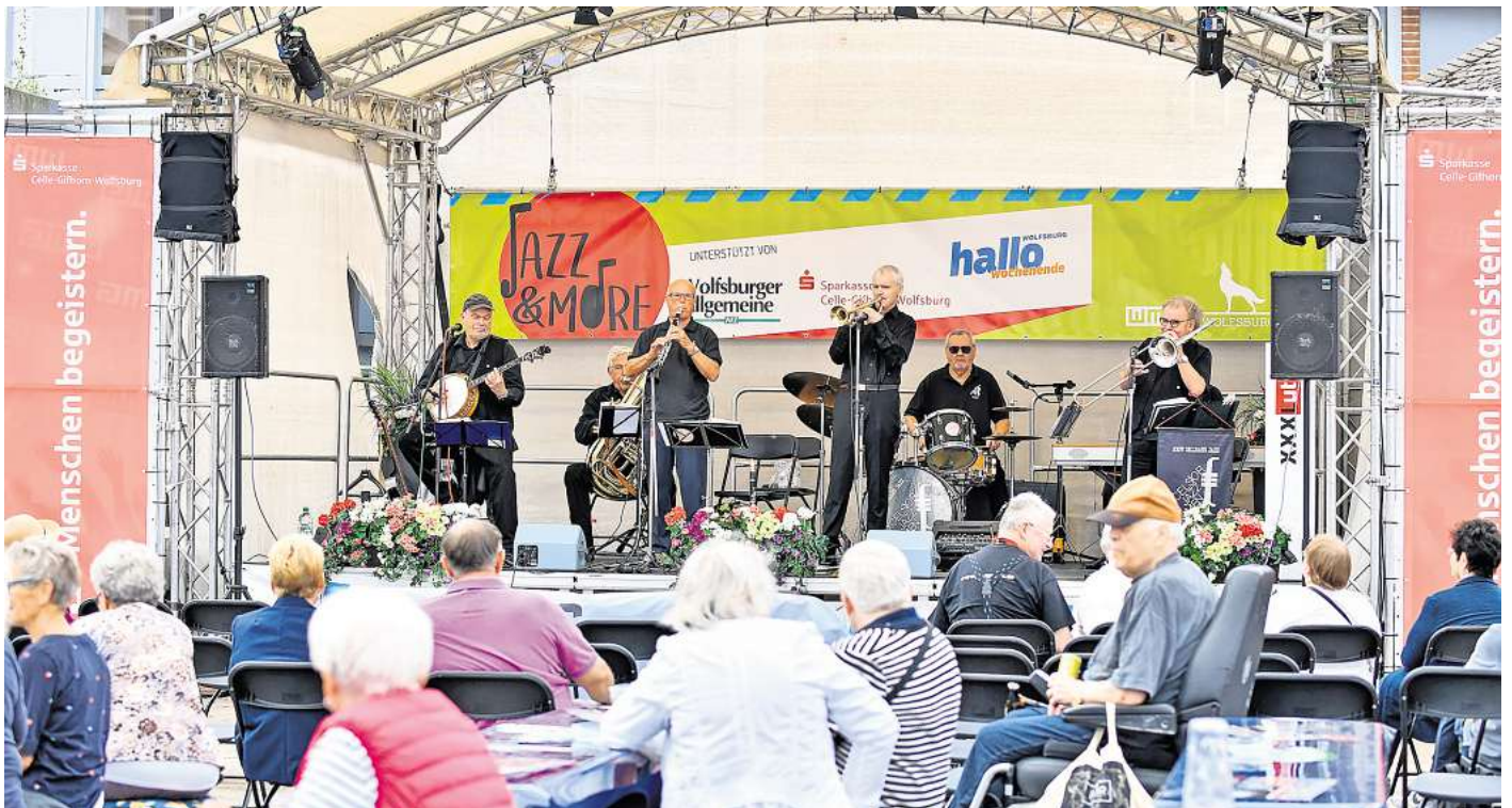
Bis zum 16. August geben verschiedene Jazz- und Bluesbands ihr musikalisches Können zum Besten.

Die Excelsior Jazzmen treten bereits seit mehreren Jahren bei Jazz & More auf und nehmen ihre Zuhörerinnen und Zuhörer musikalisch mit auf eine Reise in die 1920er und 1930er Jahre. 1992 in Schwülper gegründet, hat die Band seitdem viele Auftritte in der Harz-und-Heide-Region bestritten. Die Wolfsburger Jazzfans können sich auch in diesem Jahr wieder auf eine breites Repertoire mit Titeln aus den ersten Jahrzehnten des letzten Jahrhunderts mit den Schwerpunkten Dixieland, Swing, Blues, Gospel und Ragtime freuen. Die Band bietet ein abwechslungsreiches Programm mit Jazzklassikern wie „Sweet Georgia Brown“ oder „All Of Me“, Gospelsongs wie „Down By The Riverside“ und „Just A Closer Walk“, alten deutschen Schlägern wie „Hallo kleines Fräulein“ und die immer wieder gern ge-