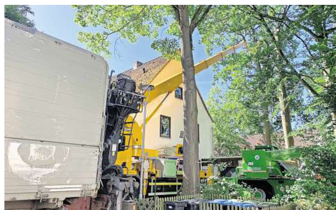
Mit schwerem Gerät rücken die Spezialisten an: Die beschädigten Bäume am Steimker Berg werden Stück für Stück abgetragen.

nungen zu fallen. Die Lösung: Die Bäume müssen gefällt werden. Das bedarf jedoch sorgfältiger Planung und Vorbereitung. Außerdem sind die Bäume sehr hoch und massiv, weshalb der Einsatz von Kränen nötig ist. Das gestaltet sich in einer dicht begrünten Wohngegend jedoch als Herausforderung.