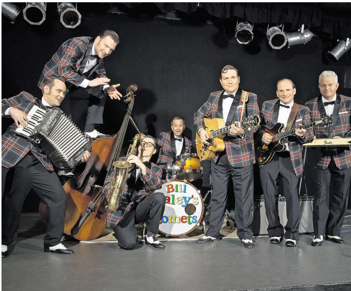
Pioniere des Rock'n'Roll: Bill Haley und seine Comets brachten seit den 1950er Jahren die Konzertsäle zum Kochen. Zwei Originalmusiker sind noch heute dabei und kommen am 30. Juli in die Autostadt.