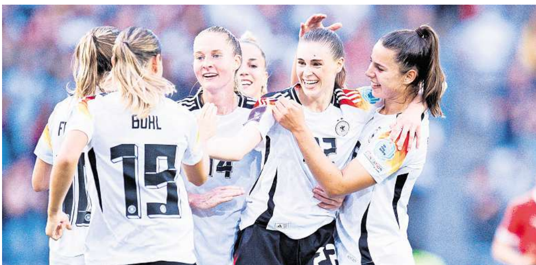
Die Frauen-Nationalmannschaft zeigt Einsatz und Zusammenhalt

Zahlreiche Spitzenmannschaften aus ganz Europa treten gegeneinander an, darunter die Titelverteidigerinnen, aufstrebende Nachwuchsteams und bekannte Fußballstars. Die Spiele versprechen spannende Begegnungen auf hohem Niveau und ziehen immer mehr Fans in die Stadien sowie