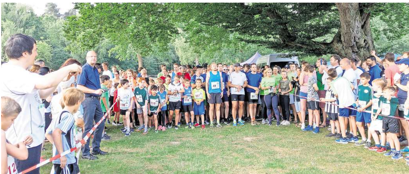
Unter dem neuen Namen Wolfsburg Staffellauf können Erwachsene und Kinder am 31. August gemeinsam laufen.

„Wir halten an dem bekannten Konzept fest, denn was die letzten Jahre gut geklappt hat, wird