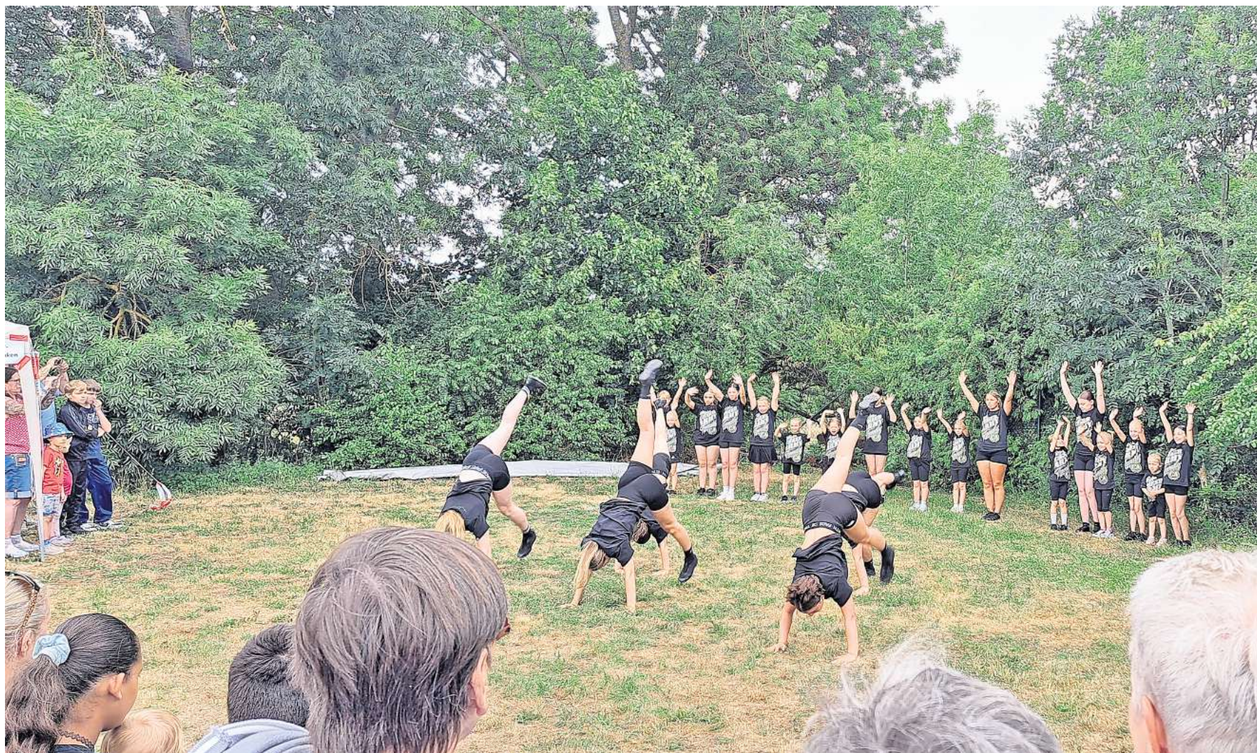
Programm für die ganze Familie wurde beim Sommerfest in Neindorf geboten.

überrascht hat uns die umfangreiche und großzügige Unterstützung vieler Unternehmen und Institutionen für die Tombola - weit über die Stadtgrenzen hinaus. Über die damit verbundene Wertschätzung unserer ehrenamtlichen Tätigkeit haben wir uns wirklich sehr gefreut.“