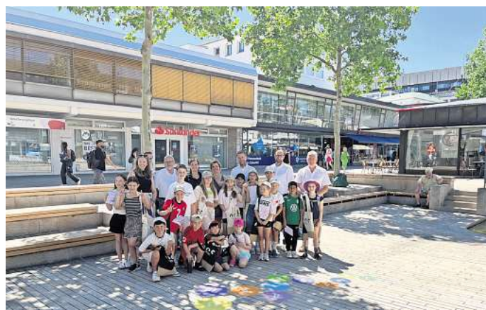
Die Porschestraße soll lebendiger werden: Die WMG einen Wettbewerb für Hüpf- und Springspiele gestartet.

Die Bürgerinnen und Bürger können die Maßnahme auf der Beteiligungsplattform „mein.wolfsburg“ bewerten. „Uns haben viele kreative Ideen