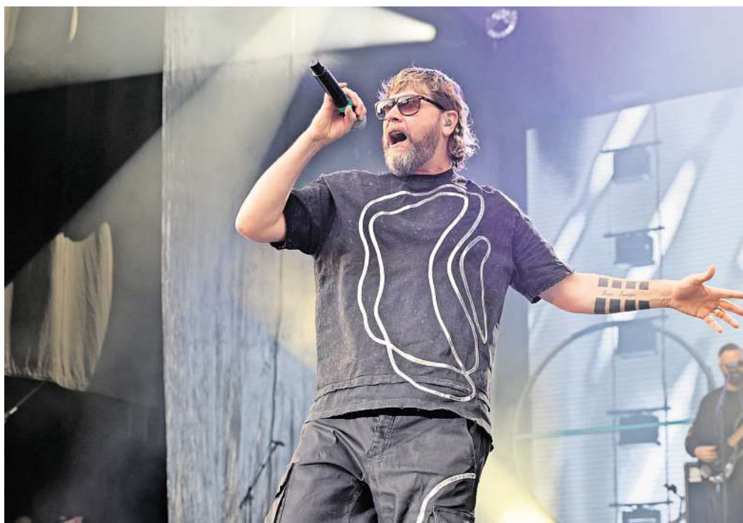
Rockte beim ersten Konzert des Sommerfestivals in der Wolfsburger Autostadt: Rea Garvey.