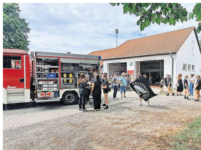
Die Feuerwehr demonstrierte eine Fettexplosion.

Bei den Neindorfern kam das Programm gut an. Über den Nachmittag war das Gelände der Freiwilligen Feuerwehr gut gefüllt und die Stimmung bei den Auftritten und Vorführungen sehr ausgelassen. Viele wür-