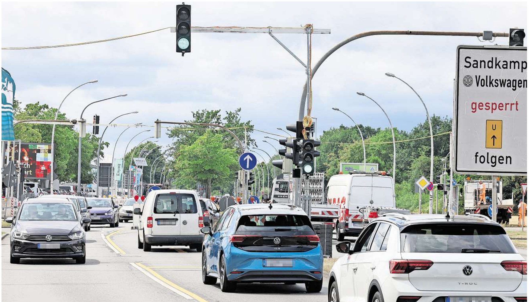
Autofahrer brauchen seit Montag in Wolfsburg Geduld: Auf der Heinrich-Nordhoff-Straße gibt es Verkehrsbehinderungen.