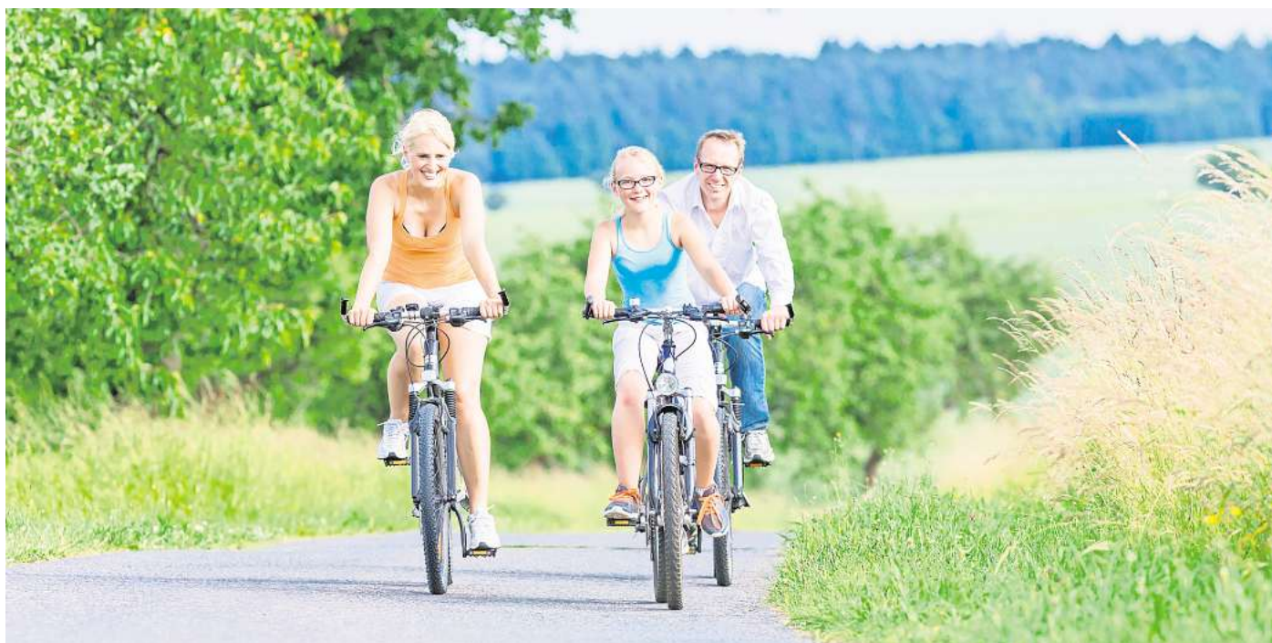
Sportlicher Erlebnistag für die ganze Familie: Rings um Wolfsburg und Gifhorn startet wieder „AZ/WAZ on Tour“.

Reizvoll ist: Sie können digitale Stempel sammeln und mit etwas Glück einen von drei Gutscheinen von Fahrrad Hahne in Vöhrum gewinnen. Der Zweirad-Fachhändler ist erneut Partner von „AZ/WAZ on Tour“ und schenkt dem Gewinner einen Gutschein im Wert von 500 Euro. Die Zweitplatzierte kann sich über einen Gutschein in Höhe von 250 Euro freuen, und der Dritte kann für 100 Euro einkaufen gehen. Jeder Teilnehmende kann sich seine persönliche Fahrstrecke mithilfe von Google Maps zusammenstellen und nach Lust, Laune oder Kilometersumme auswählen. Radelnde, die mindestens 10 an der Route liegende Stationen anfahren und ihren Besuch jeweils mit einem digitalen Stempel dokumentieren, können am „AZ/