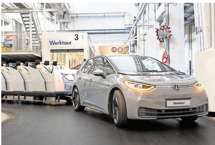
Besucherinnen und Besucher werden inzwischen mit ID.3-Fahrzeugen über das Wolfsburger Stammwerk transportiert.