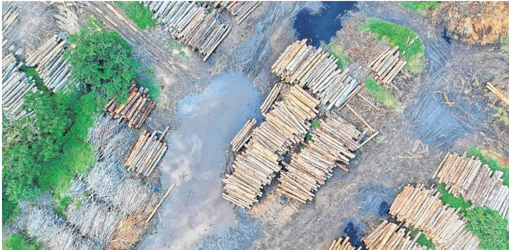
Wälder sterben oder werden abgeholzt: Ein Beispiel für den rabiaten Umgang mit der Natur. Das 1,5-Grad-Ziel ist kaum noch zu halten.

„Das Zeitfenster, um die 1,5-Grad-Marke zu halten, schließt sich rapide“, sagt Joeri Rogelj, Studienautor und Forschungsdirektor am Grantham Institute des Imperial College London. Im vergangenen Jahr wurde die 1,5-Grad-Marke bereits zum ersten Mal überschritten: Im Vergleich zum vorindustriellen Niveau