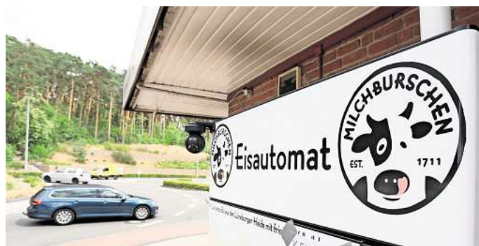
Gifhorn: am Calberlaher Damm in Gifhorn wurde ein Eisautomat aufgebrochen.

Die fünf Automaten, die in Gifhorn betroffen sind, stehen an der Hauptstraße in Müden (Aller), an der Gifhorer Straße in Wesendorf, auf dem Cal-