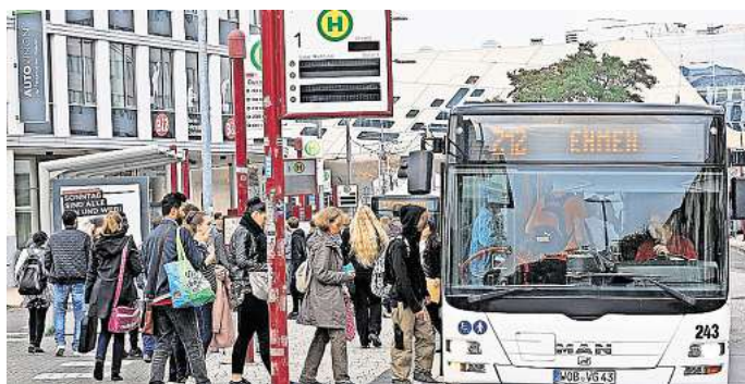
Durch Bauarbeiten auf der Braunschweiger Straße und der Heinrich-Nordhoff-Straße kommt es auch zu Änderungen im Busverkehr.

Von der Baumaßnahme auf der Heinrich-Nordhoff-Straße sind die Linien 211, 227,