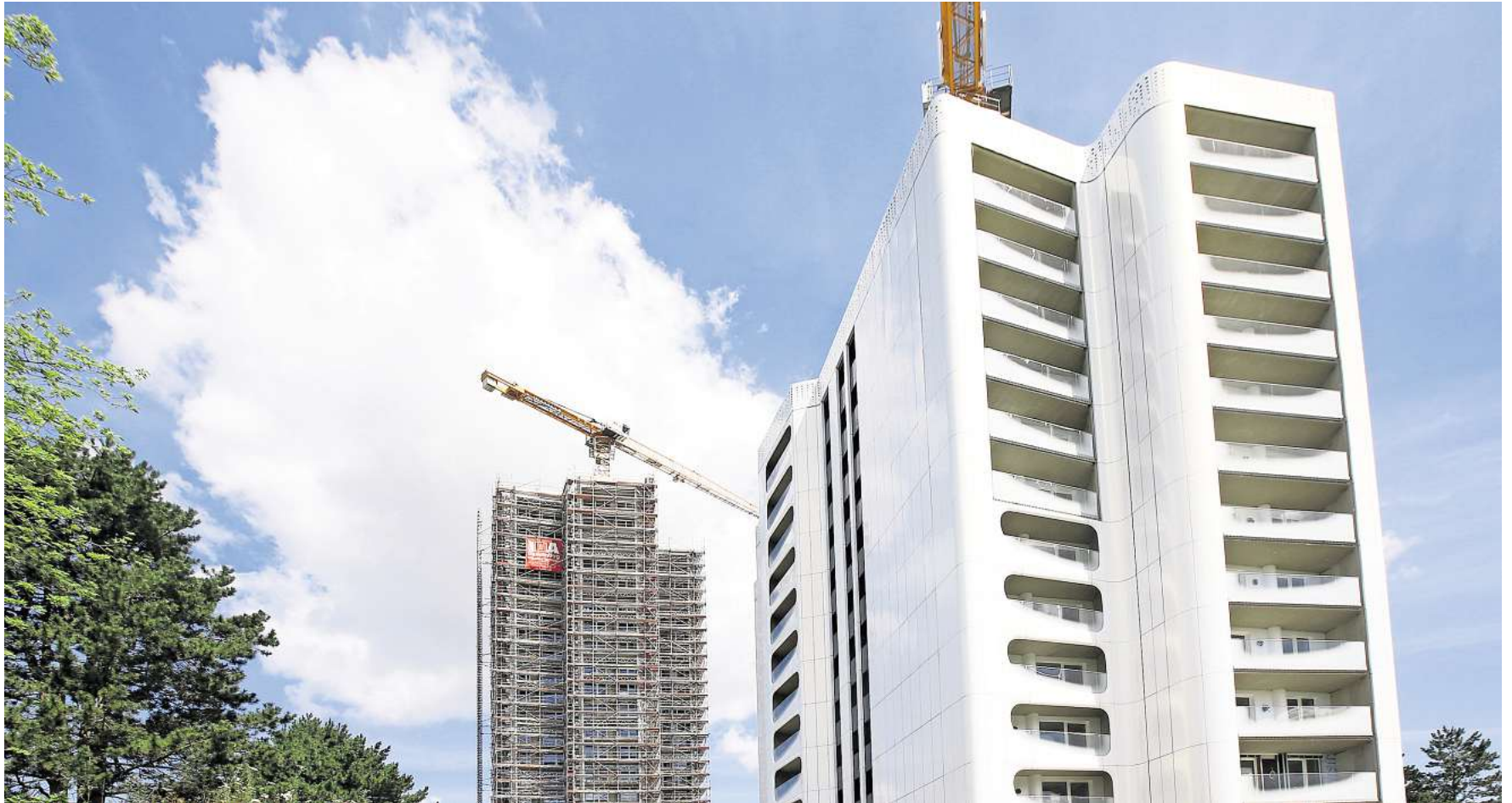
Werden modernisiert: die Hochhäuser Don Camillo und Peppone.