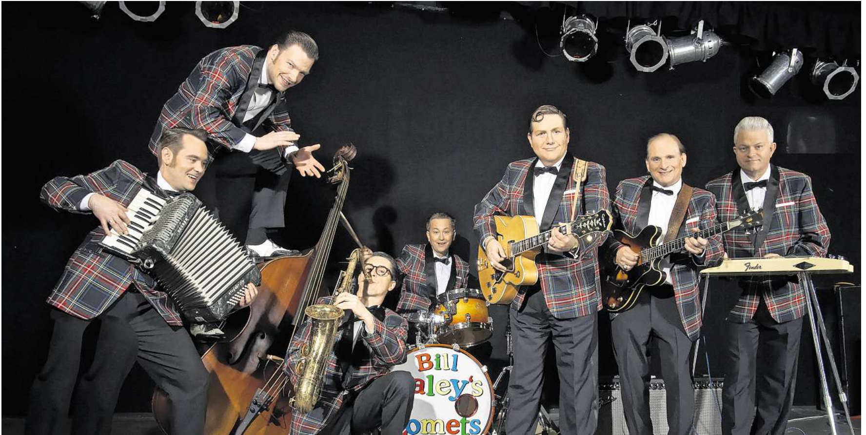
Pioniere des Rock'n'Roll: Bill Haley und seine Comets brachten seit den 1950er Jahren die Konzertsäle zum Kochen. Zwei Originalmusiker sind noch heute dabei und kommen am 30. Juli in die Autostadt.