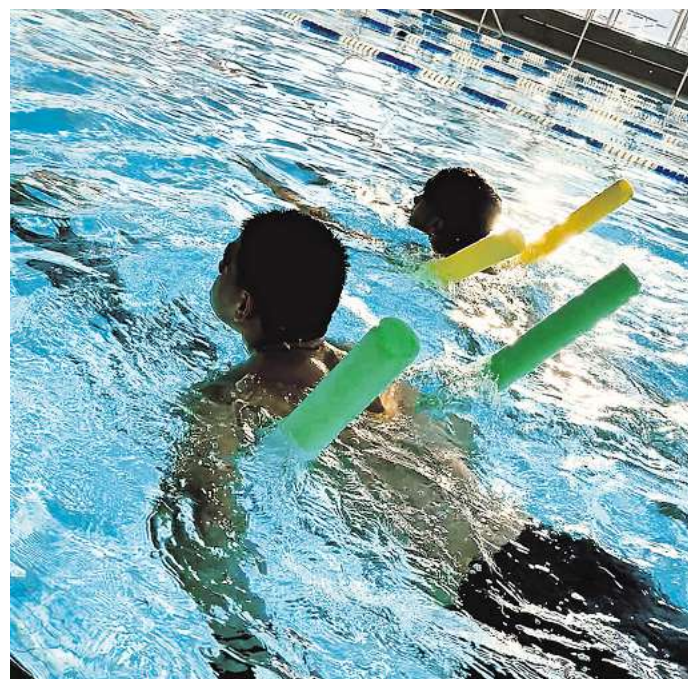
Ein stolzer Moment: Schwimmen zu können, ist nicht für jeden selbstverständlich.

So selbstverständlich es für manche klingen mag, die Angst vor dem Wasser war riesig und die Überwindung groß: Denn die Jugendlichen kommen aus verschiedenen Herkunftsländern und sind für schulische Schwimmangebote meist schon zu alt. Sowohl organisatorisch als auch finanziell ist es gerade für diese Altersgruppe besonders schwierig, passende Kurse zu finden. Nicht schwimmen zu können, erleben viele als belastend, vor allem dann, wenn sie älter werden.