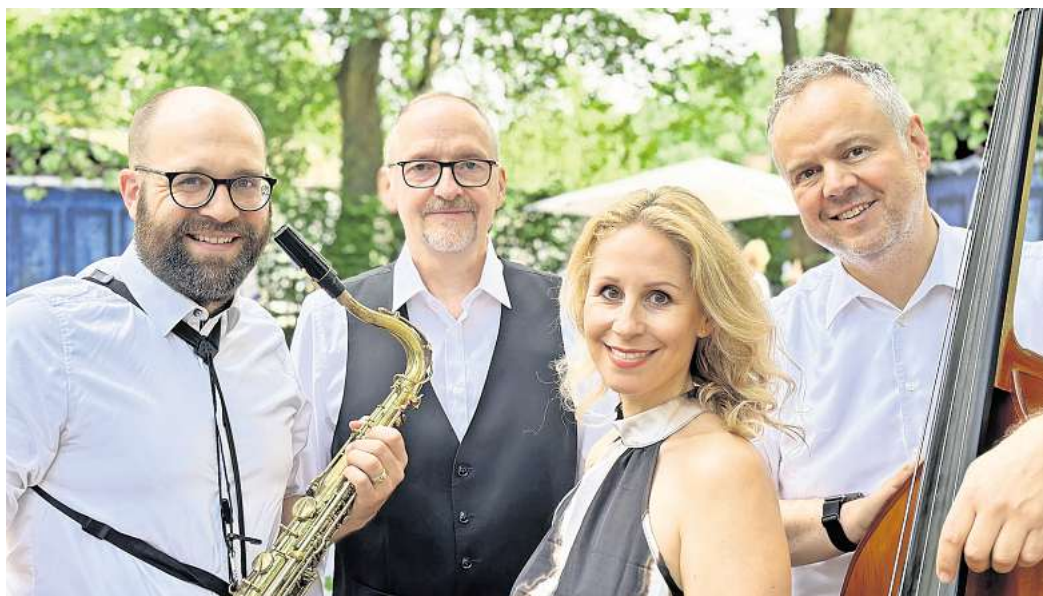
Die Ellingtones freuen sich schon auf ihren Auftritt in der Wolfsburger Innenstadt.

Die Jazzband Ellingtones aus Hannover und Hamburg hat sich nicht nur der Musiklegende Duke Ellington und den Klassikern aus Jazz und Swing verschrieben, sondern verwandelt auch große Hits aus Pop und Rock auf originelle Weise. Mit ihrem besonderen Mix aus populärer Jazzmusik und verjazzter Popmusik sorgen die Ellingtones seit über 20 Jahren für erstklassige musikalische Unterhaltung. Ihr breites Repertoire, die stilistische Vielfalt und flexible Besetzungsmöglichkeiten