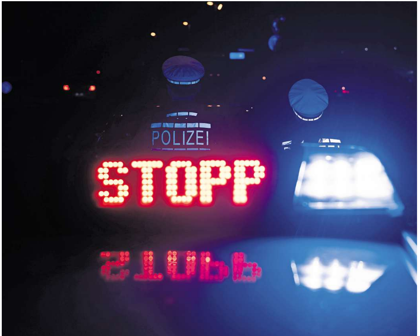
Auf der B248 zwischen Ehra und Brome hielt die Polizei die beiden jungen Männer an.

Er sei sehr nervös gewesen, als die Beamten die beiden Männer angehalten haben. Es war die erste Polizeikontrolle in der Art für mich“, sagte er. Beide Männer hätten Feierabend gehabt und denselben Weg nach Hause. So