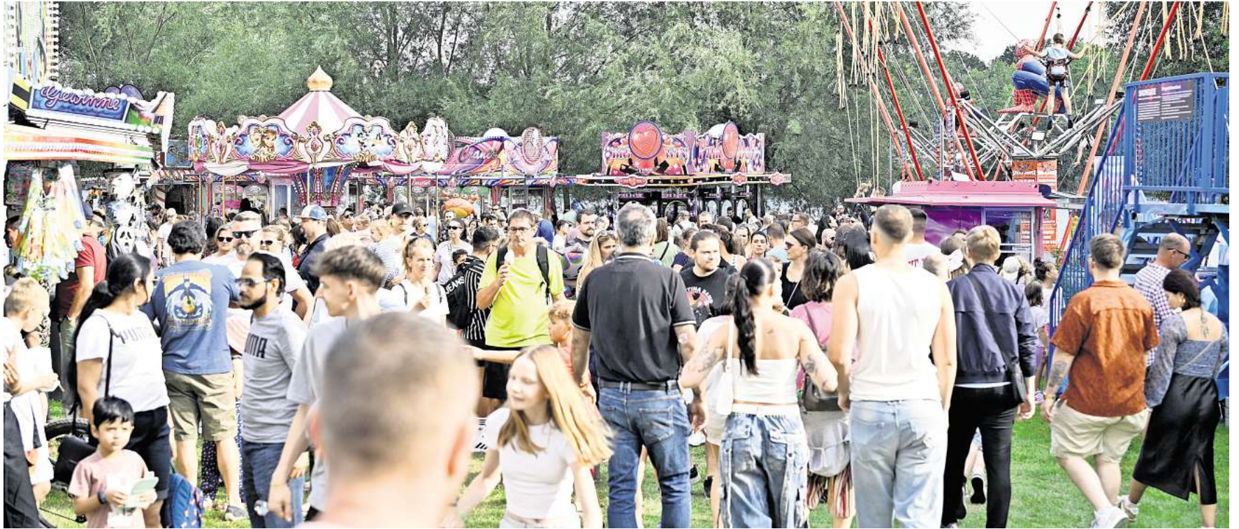
Gut was los war im vergangenen Jahr beim Seefest am Allersee.