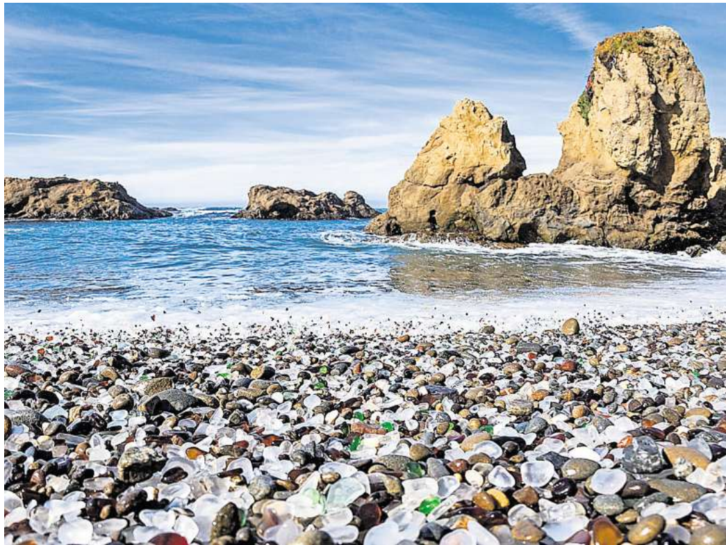
Bunte Steinchen, die einst Glasscherben waren, bilden diesen Strand in Kalifornien.

Einst eine Müllkippe, zieht der Glass Beach in Fort Bragg im Norden Kaliforniens heute Ba-