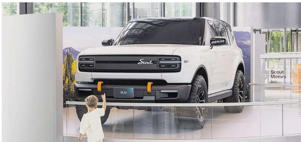
Hoffnungsträger: Die Wiederbelebung der Marke Scout soll den Geschäften von Volkswagen in den USA zu Gute kommen.

Die Wiederbelebung der Marke Scout lässt sich der Konzern einiges kosten und geht auch ins Risiko. Rund zwei Milliarden US-Dollar fließen allein in den Bau eines neuen Werkes in South