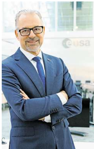
ESA-Generaldirektor Josef Aschbacher ESA-Generaldirektor Josef Aschbacher im iMai 2023 im neuen ESA-Hauptquartier in Paris.

Das sind Entscheidungen, die die US-amerikanische Regierung treffen muss. Die will ich nicht kommentieren. Wichtig zu wissen ist: 95 Prozent unseres Budgets sind nicht abhängig von der Nasa oder diesen Budgetentscheidungen. Sie betreffen lediglich 5 Prozent unserer Aktivitäten, in erster Linie den Bereich Exploration – also Missionen zum Mond, zum Mars und auf die Internationale Raumstation. Da kann natürlich eine Entscheidung, wie sie derzeit vorliegt, ein Einschnitt sein.