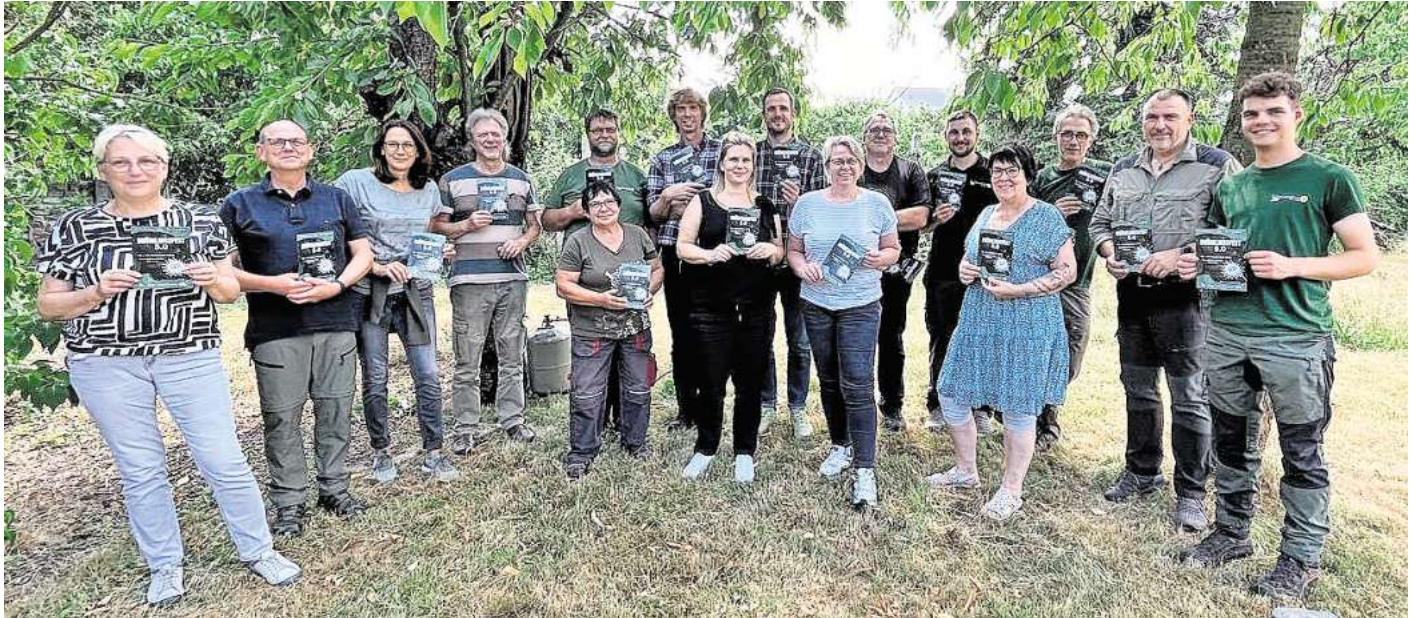
Die Vorbereitungen für das Drömlingsfest laufen auf Hochtouren – das Fest für Natur, Kultur und Familie wird in Wolfsburg im September veranstaltet.