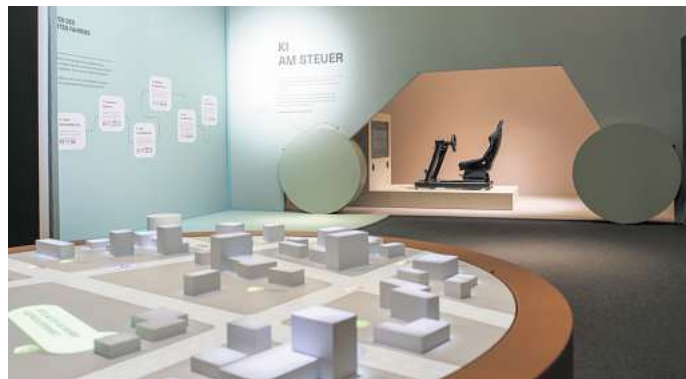
„KI und Du“: In ihrer Ausstellung demonstriert die Autostadt die Anwendungsbereiche Künstlicher Intelligenz.

Im Bereich „Du & KI“ stehen die Besucherinnen und Besu-