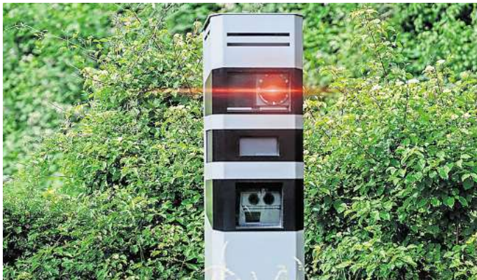
Blitzer-Fotos sind je nach Land ganz unterschiedlich teuer. Ein Tool verrät Reisenden, was beim Verkehrsverstoß in Europa auf sie zukommen könnte.

Absoluter Spitzenreiter ist jedoch Großbritannien. Dort kosten 20 Kilometer pro Stunde zu viel auf dem Tacho bis zu 1170 Euro. Generell ist das Land für seine überaus hohen Strafen im