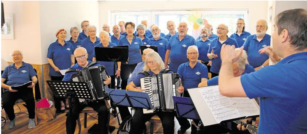
Der Maritime Chor Wolfsburg brachte Stimmung zur Jubiläumsfeier und begeisterten die schunkelnden Zuhörer im WIR.