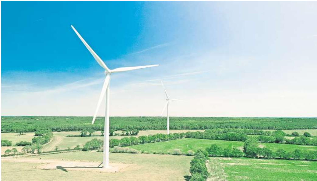
Klimafreundliche Energie: 409 moderne Windräder mit einer Gesamtleistung von 2,2 Gigawatt gingen 2024 ans Netz – so viel wie seit 2017 nicht mehr.

Dabei wurde im ersten Halbjahr kräftig gewerkelt: 409 moderne Windräder mit einer Gesamtleistung von 2,2 Gigawatt gingen ans Netz – so viel wie seit 2017 nicht mehr. Der Bundesverband Windenergie (BWE) und die Herstellerlobby VDMA Power Systems erwarten, dass dieses Jahr bis zu 5,3 Gigawatt hinzukommen. Das würde aber bedeuten, dass die Latte erneut gerissen wird. „Den positiven Entwicklungen zum Trotz klappt eine Lücke zwischen dem tatsächlichen