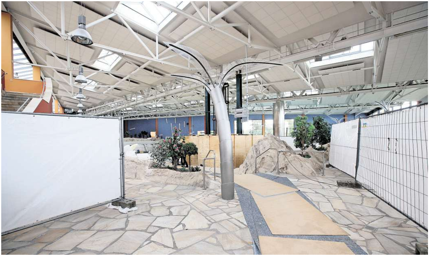
Hinter den Bauzäunen findet im Spaßbad der normale Betrieb statt.

Eine besondere Herausforderung sind die Wellenkammern, also der Bereich, in dem die Wellen für das Wellenbecken produziert werden. Unter Staub- und Hitzeentwicklung muss hier gearbeitet werden und das alles in sehr niedriger Höhe. Ebenso he-