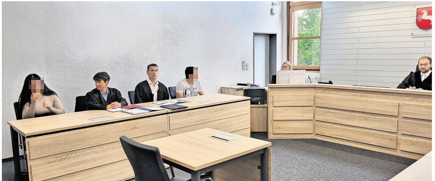
Vor dem Amtsgericht Wolfsburg mussten sich am Donnerstag eine 26-jährige Angeklagte und ein 24-jähriger Angeklagter wegen versuchter Erpressung verantworten.

Einen Tag später tauchte die junge Frau bei ihrem Opfer persönlich in Spielhalle auf und