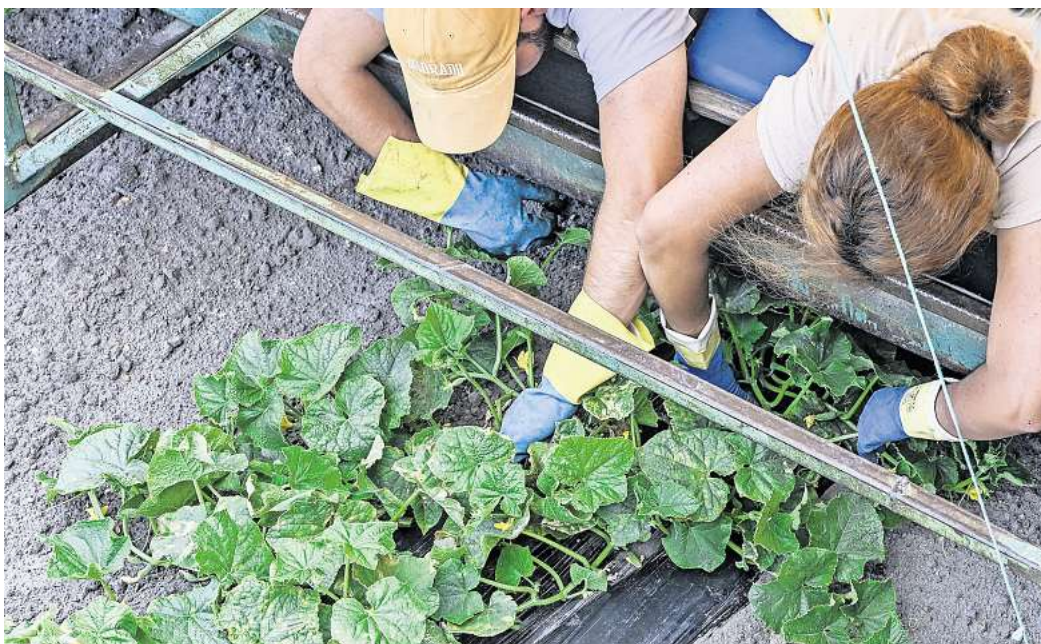
Die IG BAU fordert faire Arbeitsbedingungen für Erntehelfer.

Wer in Wolfsburg und der Region auf Saisonkräfte treffe, die Hilfe benötigten, könne sich an das Beratungsnetzwerk „Faire Mobilität“ vom Deutschen Gewerkschaftsbund (DGB) wenden: kontakt@faire-mobilitaet.de oder 030-219 65 37 21.