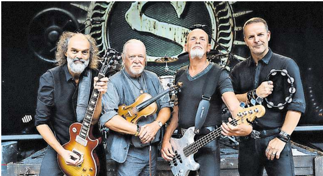
Im Rahmen ihrer „Doggerland! 2025“-Tour gibt die Rockgruppe Santiano am 30. August ein Konzert auf dem Burgdorfer Schützenplatz.

Die Band aus Schleswig-Holstein ist seit vielen Jahren eine feste Größe in der deutschen Musikszene und begeistert ihre Fans mit ihrem einzigartigen Shanty-Rock, einer faszinierenden Mischung aus traditionellen Seemannsliedern und modernen Rockelementen. Mit ihrer kraftvollen Stimme, mitreißenden