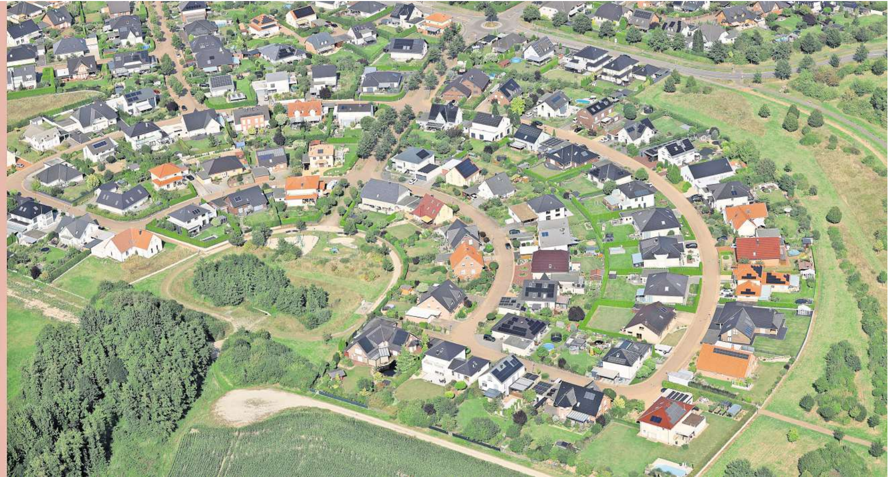
Platz 28 von über 400: In einer Studie zur Erschwinglichkeit von Wohneigentum schneidet die Stadt Wolfsburg weit vorne ab.