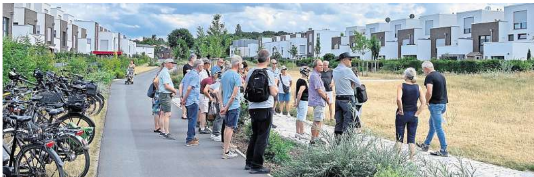
Die Radtour zu Wolfsburger Bauprojekten stieß auf so großes Interesse, dass ein zweiter Termin anberaumt wird.

Großer Andrang bei der Aktion der Stadt Wolfsburg