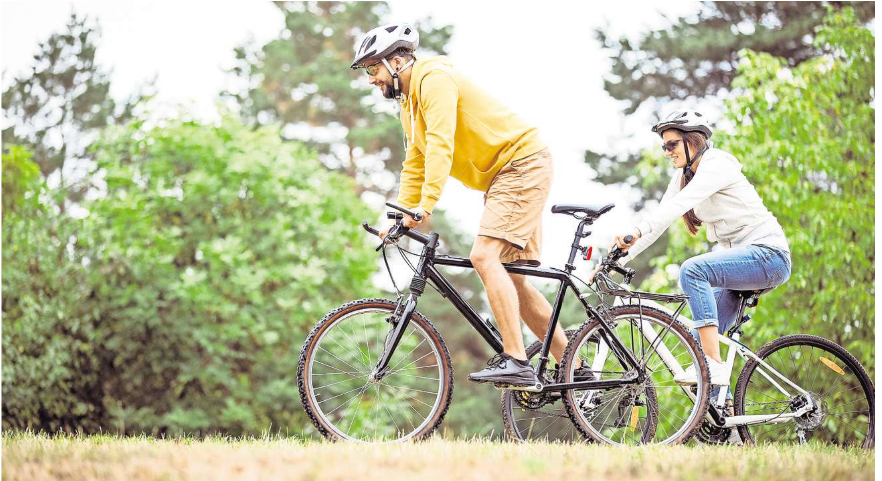
„AZ/WAZ on Tour“-Teilnehmer können Neues entdecken und mit Glück etwas gewinnen.