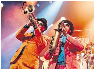
Brazzo Brazzone wollen mit außergewöhnlichen musikalischen Kombinationen begeistern.

Die 2012 von Jazz-Trompeter Daniel Zeinoun gegründete Italo-Brass-Band Brazzo Brazzone aus Hannover spielt bereits zum vierten Mal bei Jazz & more und sorgt mit ihrem modernen Sound und