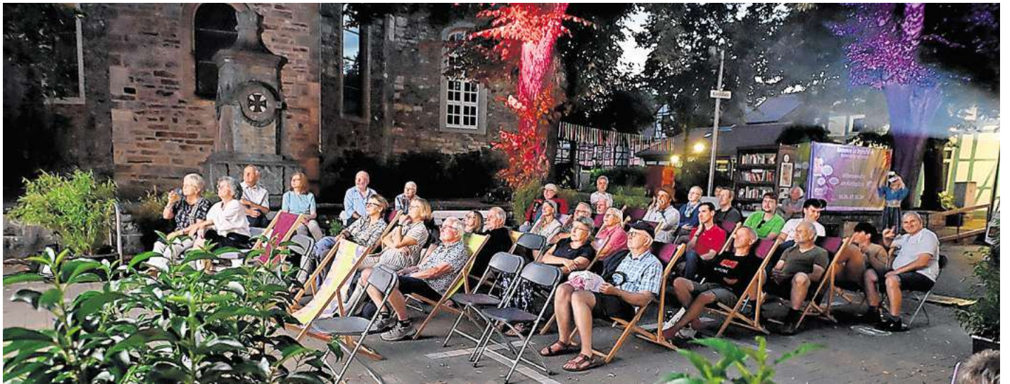
Die Sommerlounge im Stadtkern von Vorsfelde soll auch 2026 wieder stattfinden.

Mitfinanziert wurde die „Sommerlounge“ aus Mitteln des Förderprogramms „Zukunftsfähige Innenstädte und Zentren“ (ZIZ). Die Stadt Wolfsburg nimmt an diesem Förderprogramm teil. Aber: Das ZIZ-Förderprogramm läuft Ende 2025 nach drei Jahren aus. Das bedeutet, wenn es auch in Zukunft eine Sommerlounge geben soll, müssen alternative Finanzierungsmöglichkeiten und Unterstützungsmöglichkeiten her.