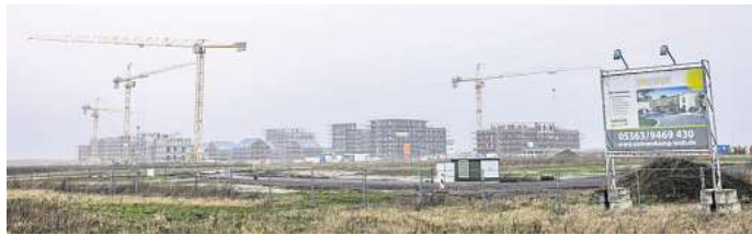
Das Baugebiet Sonnenkamp: Hier soll weiterer Wohnraum entstehen.

Gebrauchte Reihenhäuser seien besonders für Familien eine Möglichkeit, mit mehr Platz städtisch zu wohnen. Sie werden durchschnittlich zum Preis von 299.000 Euro angeboten (-11 Prozent). Die Bandbreite reiche hierbei von 250.000 Euro bis