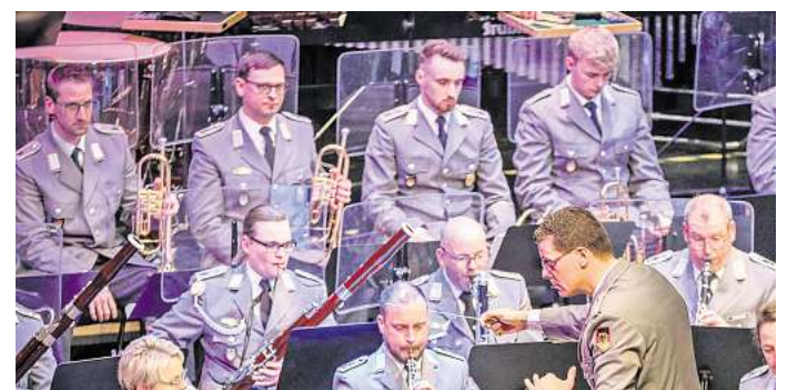
Für den guten Zweck spielt das Heeresmusikkorps im Scharoun Theater in Wolfsburg.

Tickets für das Benefizkonzert sind ab Montag, 28. Juli, erhältlich – online unter www.theater.wolfsburg.de , an der Theaterkasse in der Porschestraße 41 D oder direkt an der Abendkasse. Der Eintritt kostet 20 Euro.