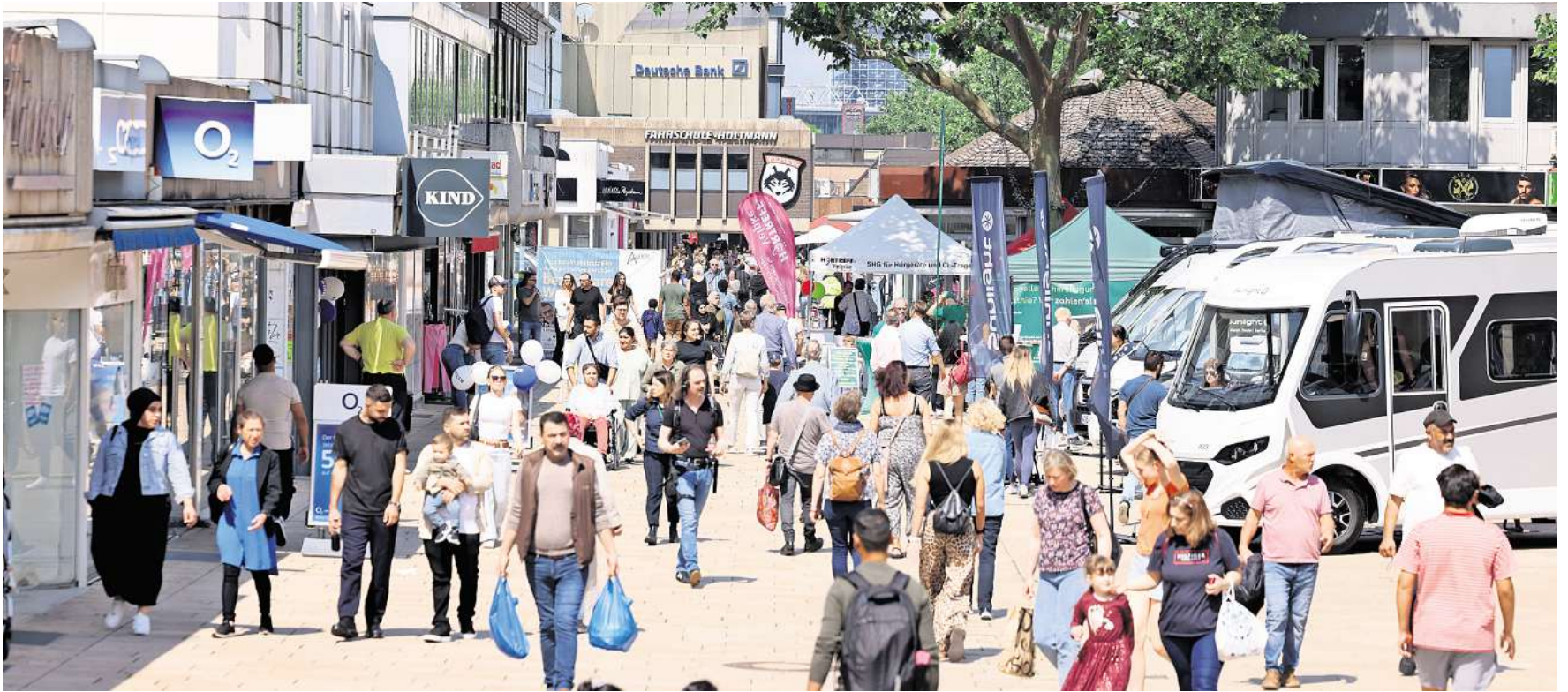
In der Porschestraße unterhalten Banken Filialen. Wer shoppen möchte, bekommt nicht zu jeder Tageszeit in der Fußgängerzone Bargeld, sondern zeitlich begrenzt.