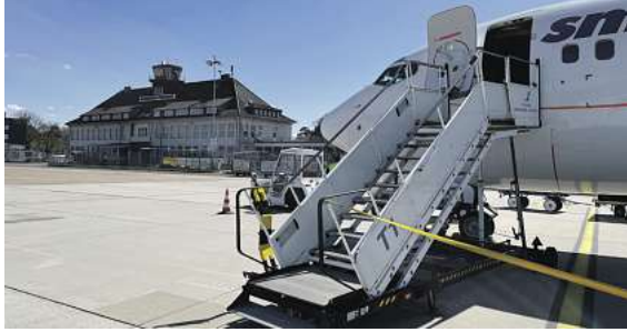
Entspannter Traumurlaub mit Flug ab Braunschweig

Angebote haben, sind Buchungen ab Montag, 11.8. von 9 Uhr an auf www.fliegen-ab-braunschweig.de , im Reisebüro oder unter der kostenfreien Buchungshotline (aus dem dt. Festnetz) T. 08 00 – 38 300 38 möglich. Und noch ein Tipp: Auch in den Herbstferien und mit Kinderfestpreisen werden zudem die griechische Trauminsel Zakynthos und die Costa del Sol in Spanien angefliegen.