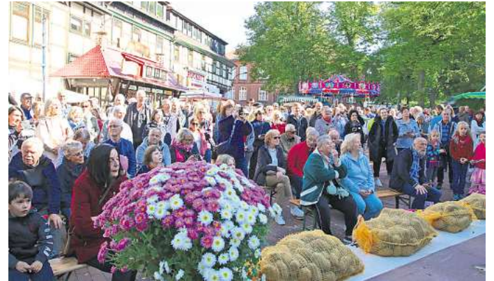
Der Denkmalsplatz wird ab 13. August drei Tage lang bespielt. Das Foto zeigt den Platz am Kartoffelsonntag.

Am ersten Tag soll dann auch um 18 Uhr die Open-Air-Sitzung des Ortsrates Fallersleben-Sülfeld auf dem Denkmalsplatz abgehalten werden. Erwartet wird Stadtbaurat Kai-Uwe Hirschheide. Bürger der Hoffmannstadt können in der Einwohnerfragestunde mit ihren Anliegen an die Stadtverwaltung