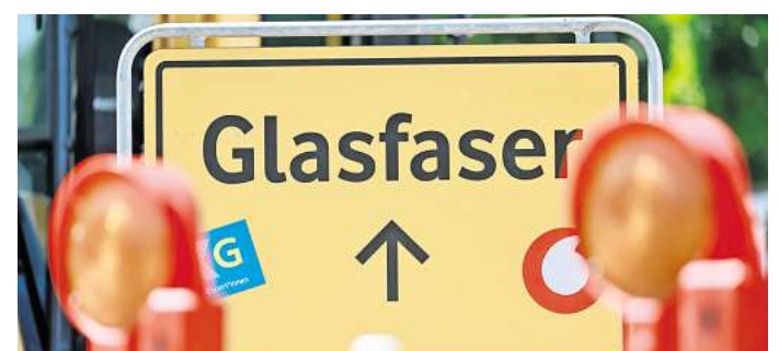
Niedersachsen gehört beim Glasfaserausbau bundesweit zur Spitzengruppe.

Sonderkonzert am 16.08. des Orchesters der Stadtwerke - 11-13 Uhr!