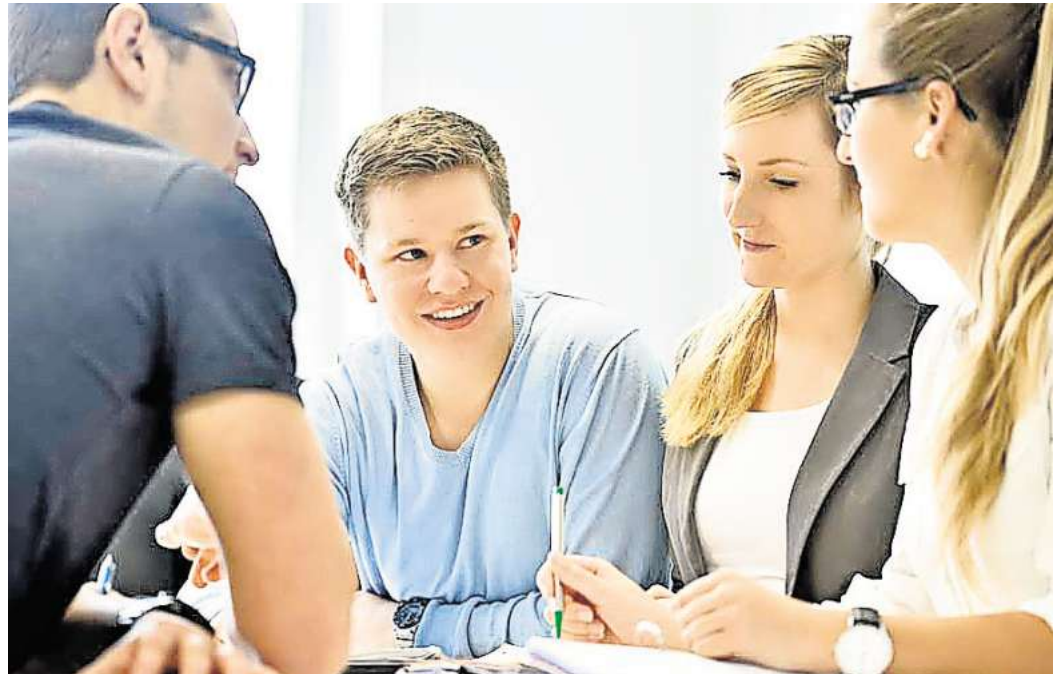
Haben junge Menschen eine andere Einstellung zum Thema Arbeit als ältere Arbeitnehmer?

Direkt zur Umfrage: Einfach den QR-Code mit dem Handy scannen.