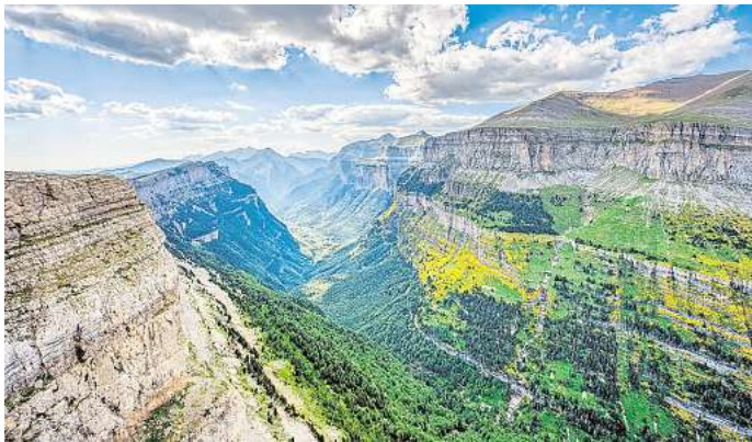
Die Klippen im Nationalpark sorgen für ein atemberaubendes Panorama.

Neben saftigen Wiesen, idyllischen Wanderwegen und entspannten Routen geht es im Nationalpark im äußersten Nordosten Spaniens auch hoch hinaus. Riesige Felsarme umschließen den mächtigen Monte Perdido, mit 3355 Metern der höchste Kalksteinberg Europas. Was den Nationalpark einzigartig macht, ist seine außergewöhnliche Geologie.