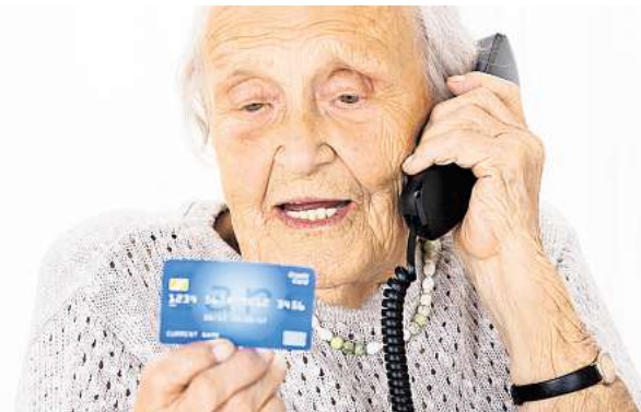
Ein Senior aus Wolfsburg ist skrupellosen Betrügern auf den Leim gegangen: Er verlor 10.000 Euro.

Wer den beschriebenen Mann im Bereich Obere Tor, Im Eichholz, Petristraße, Carl-Grete-Straße, Meinstraße oder im weiteren Umfeld gesehen hat, soll sich bei den Beamten unter der Telefonnummer (05361) 464 60 melden.