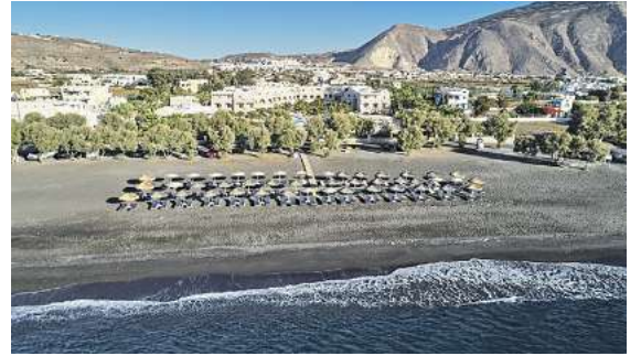
Traumhafte Hotelenerlebnisse, wie hier das 4,5* Santo Miramare auf Santorin, findet man im Katalog „Fliegen ab Braunschweig“

Nur solange der Vorrat reicht sind diese limitierten Angebote buchbar. Damit alle die gleichen Chancen auf die