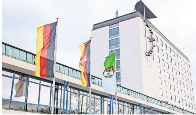
Die Stadt Wolfsburg begrüßt den Kabinettsbeschluss zum Kommunalfördergesetz.

„Mit dem Kommunalfördergesetz geht das Land einen wichtigen Schritt auf die niedersächsischen Kommunen zu. Finanzmittel können zukünftig einfacher und unbürokratischer weitergeleitet werden. Kurzfristig