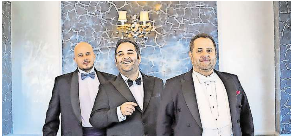
Die Opernsänger laden zur „Himmlischen Nacht der Tenöre“ ein.

Gespielt wird live und ohne technische Hilfsmittel – in Kirchen und Konzertsälen mit besonders klangvoller Akustik. Gerade die bewusste Reduktion auf das Wesentliche mache das Erlebnis so besonders: Die emotionale Kraft der Musik entfaltet