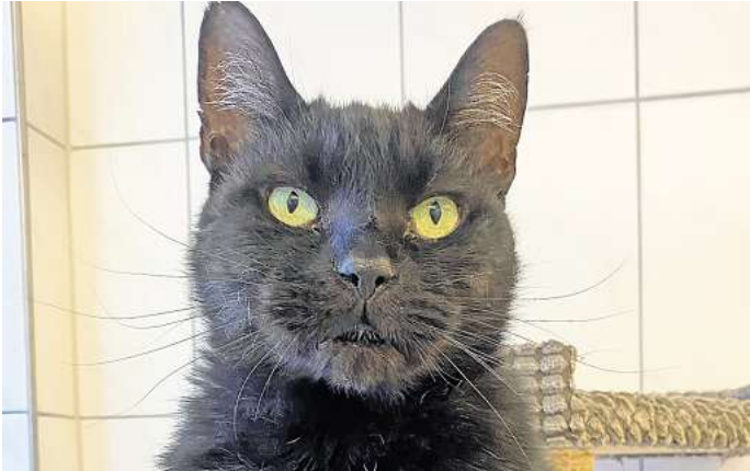
Wolfsburg: „Racina“ ist sehr menschenbezogen.

Sie braucht immer ein paar Minuten zum Auftauen und lässt sich eher nur von ausgewählten Menschen streicheln. Sie findet ruhige und freundliche Menschen toll. Bei Kindern bevorzugt sie dementsprechend auch eher ältere, ruhige Kinder. Laute Kinder und schnelle Bewegungen seien nichts für sie.