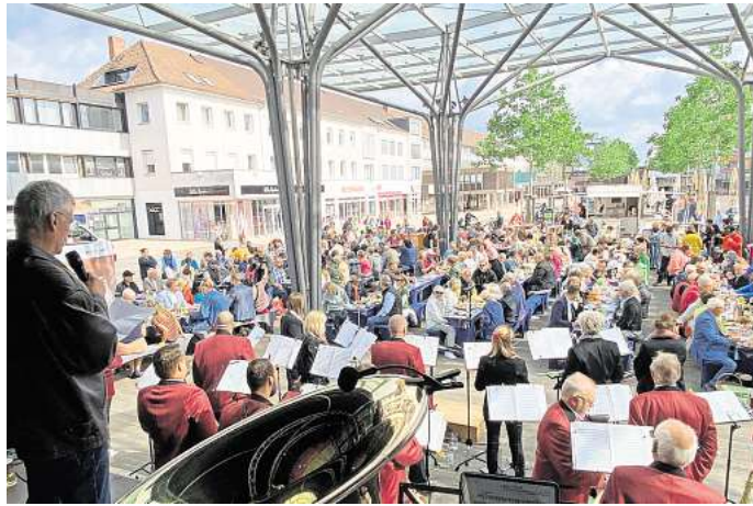
Das Abschlusskonzert der beliebten Konzertreihe Jazz & more wird das Stadtwerke-Orchester Wolfsburg gestalten.

„Der Vorstand der Bürgerstiftung freut sich, auch in diesem Jahr wieder gemeinsam mit der