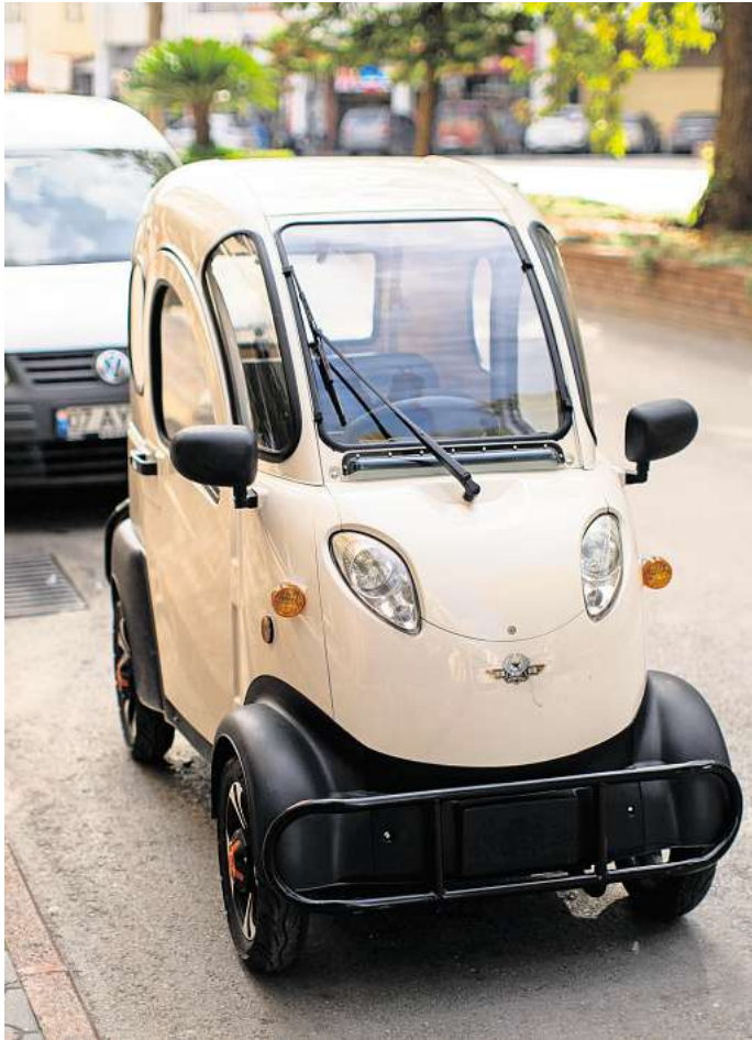
Elektroleichtfahrzeuge hinterlassen einen geringen CO 2 -Fußabdruck.

Der Begriff Ecomobilität umfasst einen bunten Strauß von Fahrzeugen. Dazu zählen E-Scooter und Cargobikes ebenso wie Light Electric Vehicles, kurz: LEVs. Sogar elektrische Rollstühle werden dazu gerechnet, also eigentlich alles, was einen Elektromotor besitzt und nicht Auto ist. „Diese Vielfalt von Fahrzeugen bildet die Vielfalt