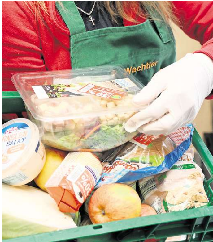
So lässt es sich sparen – Rabattcoupons für Lebensmittel.