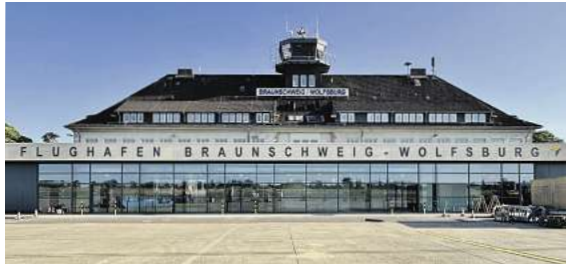
„Fliegen ab Braunschweig“ ab sofort noch komfortabler ab dem neuen Passagierterminal

Den Katalog, weitere Informationen und Buchungsmöglichkeit dieser exklusiven Angebote unter der kostenfreien (aus dem dt. Festnetz) Buchungshotline T. 08 00 / 38 300 38 (Mo-Fr. 9 – 18, Sa. 9 – 13 Uhr), im FIRST Reisebüro Schmidt und weiteren Reisebüros oder unter www.fliegen-ab-braunschweig.de .