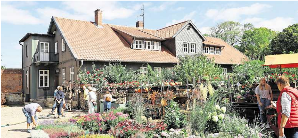
Buntes Markttreiben im historischen Ambiente: Die Gutstage auf dem Rittergut bieten eine große Vielfalt an Produkten.

Außerdem gibt es Möbel für drinnen und draußen, italienische Mode, Lederwaren, Kosmetik sowie handgefertigten Schmuck. Ein besonderes Highlight ist die exklusive Scheune