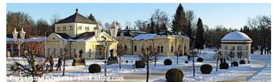
Herzog Anton Ulrich-Palais

Festtage in Berchtesgaden 11 Tage ✓ Fahrt im Luxusreisebus ✓ 10 x Ü/F im ***Hotel Schwabenhof in Berchtesgaden im DZ ✓ 8 x Abendessen als 3-Gang-Menü oder Buffet ✓ 1 x Weihnachtsfeier mit Gebäck, Musik und festlichem Menü am 24.12. ✓ 1 x Silvesterfeier mit 5-Gang-Menü und Musik ✓ Ortsführung Berchtesgaden ✓ Stadtführung Salzburg ✓ Ausflüge: Chiemsee mit Schifffahrt; Rund um das Steinerne Meer mit Reiseleitung; Wolfgangsee mit Reiseleitung; Königssee; Berchtesgadener Land mit Reiseleitung ✓ Stadtführung Bad Reichenhall ✓ durchgehende Reisebetreuung 23.12.25-02.01.26 ab 1.649,- €