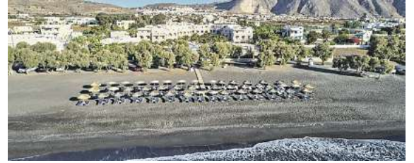
Die Trauminsel Santorin lockt mit vielfältigen Hotelangeboten, wie hier das 4,5* Premium Hotel Santo Miramare.

Zur Auswahl stehen – wie in allen ab Braunschweig angefliegenen Zielen – vielfältige, besondere Hotelangebote: Neben Premium, Best Preis und Top Lage Anlagen auch Flair Hotels mit acht Zimmern und eigenem Pool. Zum Jubiläum 10 Jahre „Fliegen ab Braunschweig“ gibt es ein besonderes Angebot nach Santorin. Schon ab € 599,- im Standard- (3 – 3,5*) oder ab € 899,- im Top Glückshotel (4,5 – 5*) kann man auf diese Trauminsel reisen.