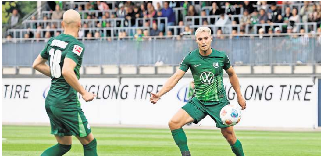
Der VfL Wolfsburg möchte im ersten Heimspiel der Saison punkten.

Direkt zur Verlosung: Einfach den QR-Code mit dem Handy scannen.