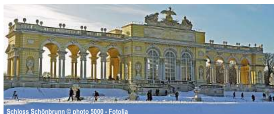
Schloss Schönbrunn

Silvester im Elsass 6 Tage ✓ Fahrt im Luxusreisebus ✓ 5 x Ü/F im ***Hotel Ochsen in Kehl-Kork im DZ ✓ 3 x 3-Gang-Abendmenü ✓ 1 x französisches 3-Gang Menü ✓ Silvesterball mit Musik und 6-Gang-Galamenü ✓ Neujahrfeuerwerk ✓ Neujahrsschnaps ✓ 1 x Glühwein "satt" ✓ Ortsführung Kehl-Kork ✓ Vogesenrundfahrt mit Reiseleitung ✓ Colmar mit Stadtführung ✓ Straßburg mit Stadtführung ✓ durchgehende Reisebegleitung 28.12.25-02.01.26 ab 869,- €