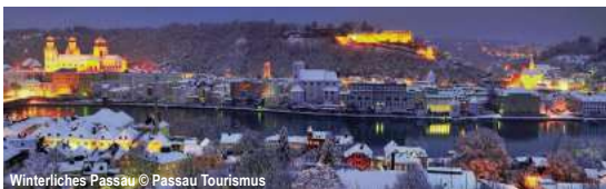
Winterliches Passau

Festtage á la Steigenberger 5 Tage ✓ Fahrt im Luxusreisebus ✓ 4 x Ü/F im ****Steigenberger Maxx Hotel Jena im DZ ✓ Begrüßungsgetränk ✓ 2 x Abendessen als Menü oder Buffet ✓ 2 x Festtagsessen als Menü oder Buffet ✓ Weihnachtliches Kaffeetrinken mit Besuch vom Weihnachtsmann am 24.12. ✓ Vorstellung im Planetarium ✓ Ausflug Thüringer Wald mit Reiseleitung ✓ Eintritt und Führung Leuchtenburg inkl. Shuttle-Service zur Burg und retour ✓ Kaffeetafel und ein Stück Burgenkuchen in der Burgschänke ✓ Eintritt und Führung Naumburger Dom ✓ Rundfahrt durch das Saale-Unstrut-Gebiet mit Reiseleitung ✓ durchgehende Reisebegleitung 23.12.-27.12.25 ab 729,- €