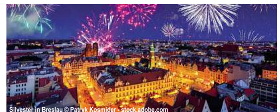
Silvester in Breslau

Silvester in Wien 5 Tage ✓ Fahrt im Luxusreisebus ✓ 4 x Ü/F im ****City Hotel in Stockerau im DZ ✓ 3 x Abendessen (3-Gang-Menü/Bufet und Salatbuffet) im Hotel ✓ 1 x Silvester-Gala mit 5-Gang-Menü, Live-Musik und Tanz im Hotel ✓ 1 Glas Sekt um Mitternacht und Suppenbuffet ✓ Stadtführung Wien ✓ Eintritt und Führung Schloss Schönbrunn ✓ Riesenrad-Fahrt im Prater ✓ Ausflug Wienerwald mit Reiseleitung ✓ Eintritt Stift Heiligenkreuz ✓ Eintritt Schloss Mayerling ✓ durchgehende Reisebegleitung 29.12.25-02.01.26 ab 959,- €