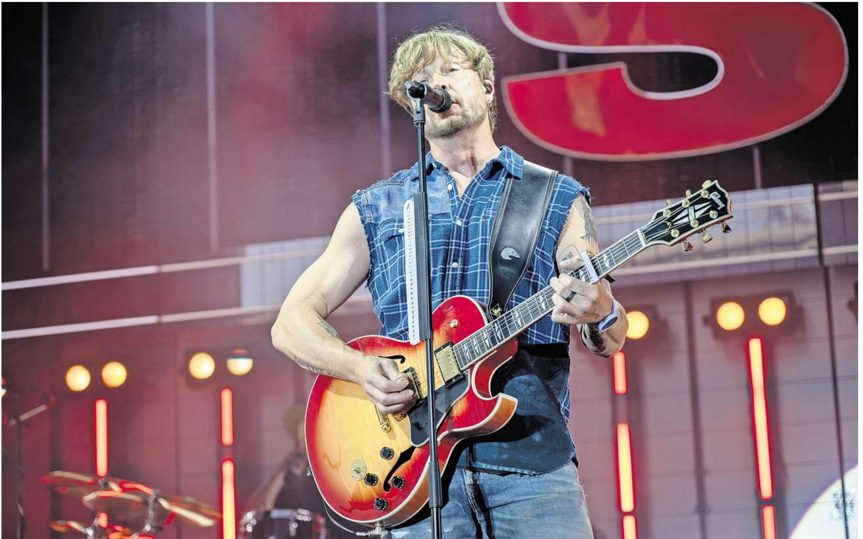
Bye, bye, Hollywood Hills: Samu Haber beendete mit seinem umjubelten Konzert das Sommerfestival der Wolfsburger Autostadt.

9.500 Fans feiern finnischen Popstar - Autostadt zieht positive Bilanz - Festival auch 2026 geplant