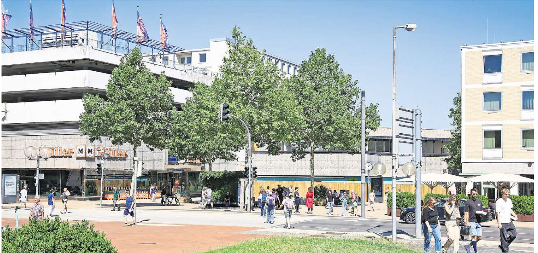
Setzen nach wie vor auf fachkundige Beratungen, um Kunden zu binden: Wolfsburgs Einzelhändler.

Wolfsburger Einzelhändlerstellen sehen Zuwachs von „Beratungsklaus“