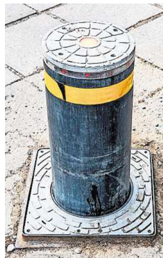
In der Wolfsburger Innenstadt sollen auch versenkbare Poller installiert werden.