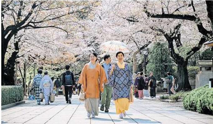
Zeit der Kirschblüte ist in Japan die beliebteste Reisezeit.

Wenn in Japan die Kirschblüten (Sakura) aufblühen, leuchten Parks, Alleen und ganze Städte in sanften Rosatönen. In der japanischen Kultur gilt diese Zeit als Highlight des Jahres, und beim traditionellen Hanami-Fest feiern Einheimische gemeinsam mit Besucherinnen und Besuchern unter den Blüten. Tokio, Kyoto und Osaka werden währenddessen zu regelrechten Foto-Hotspots – das wollen sich Millionen Menschen nicht entgehen lassen. Das Problem: Die Kirschblütenzeit dauert nur wenige Wochen im März und April. Die besten Unterkünfte sind oft schon Monate im