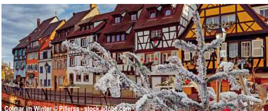
Colmar im Winter

Feiertage mit Herz 11 Tage ✓ Fahrt im Luxusreisebus ✓ Kofferservice im Hotel ✓ Begrüßungstrunk ✓ 10 x Ü/F im Hotel "Zum Ehem. Königlich-Bayrischen Forsthaus" in Waldsassen im DZ ✓ 8 x Abendessen als 3-Gang-Menü ✓ 1 x Weihnachtsfeier mit Festmenü, kleinem Geschenk, Feuerzangenbowle, Gebäck ✓ Weißwurstessen im Hotel ✓ 1 x Silvesterfeier mit 4-Gang-Menü, Live-Musik, 1 Glas Sekt ✓ Ortsführung Waldsassen ✓ Besichtigung Basilika und Klosterbibliothek Waldsassen ✓ Konzert in der Basilika ✓ Ausflug Böhmisches Bäderdreieck ✓ Stadtführungen Nürnberg, Regensburg ✓ Rundfahrt Oberpfälzer Wald mit Eintritt Museumsquartier ✓ Besichtigung Lebkuchenmanufaktur ✓ Neujahrsausflug ✓ durchgehende Reisebegleitung ✓ Ausflüge Bayreuth mit Stadtführung; Pilsen mit Stadtführung zubuchbar 23.12.25-02.01.26 ab 1.419,- €