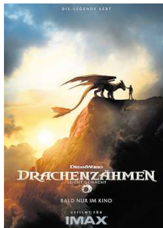
Drachenzähmen leicht gemacht.

mes, For All Mankind) als Außenseiter. Der einfallsreiche, jedoch unterschätzte Sohn von Häuptling Haudrauf (Gerard Butler) widersetzt sich jahrhundertalten Traditionen, als er sich mit dem gefürchteten Drachen Ohnezahn anfreundet. Ihre außergewöhnliche Verbindung stellt die Werteordnung aller Wikinger in Frage.