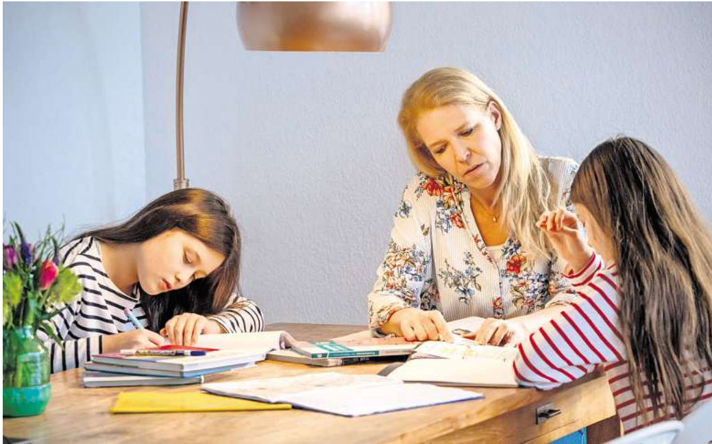
Hausaufgabenhilfe: Väter denken, die Verantwortung bei schulischen Themen sei gleich verteilt, Mütter sehen das anders.

Laut der Yougov-Umfrage hat mehr als jede zweite Frau (58