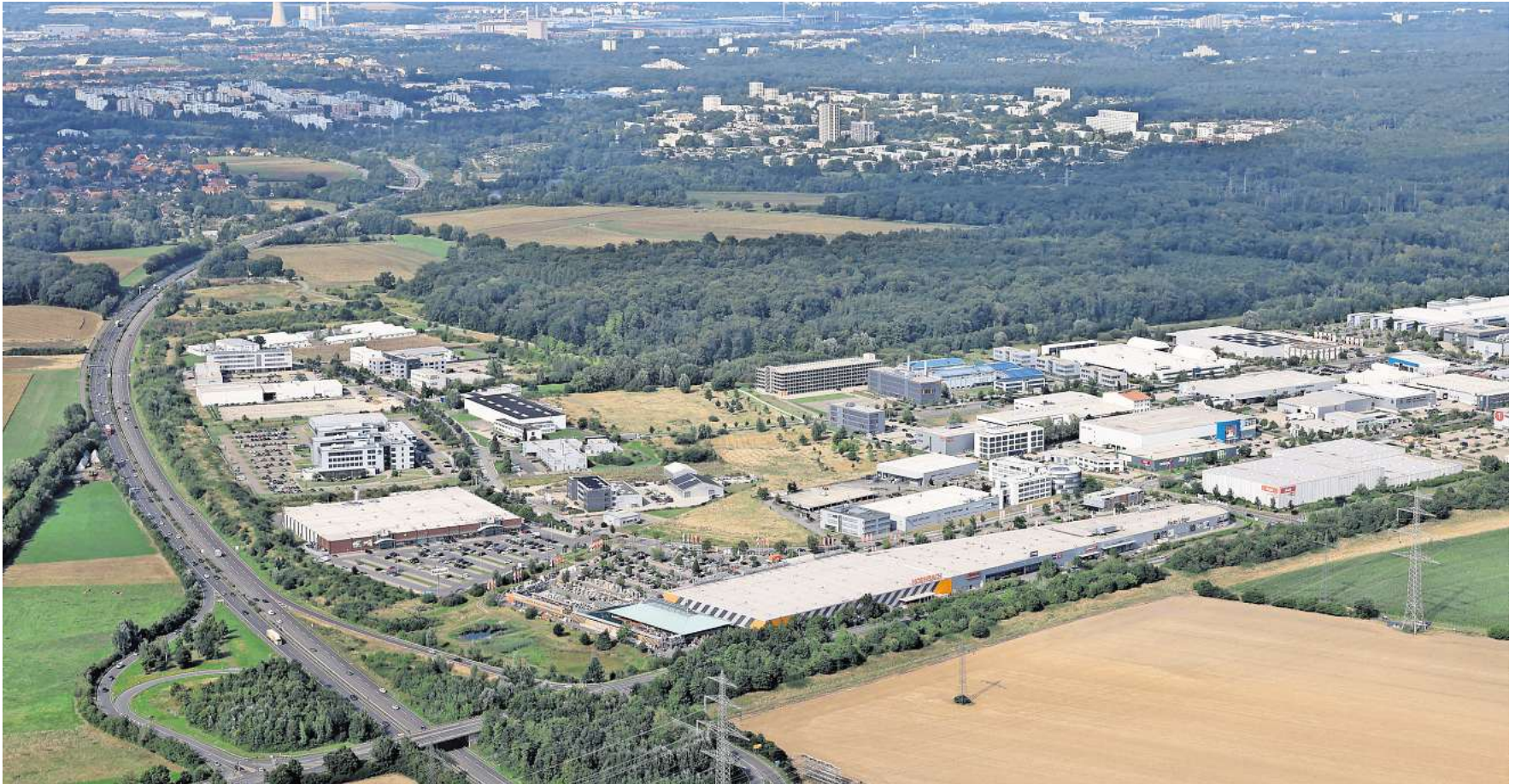
Für das Gewerbegebiet Heinenkamp plant die Stadt Wolfsburg neue Flächen für die Ansiedelung von Betrieben zu erschließen. Der Rat der Stadt muss im Oktober noch zustimmen. (Symbolfoto)