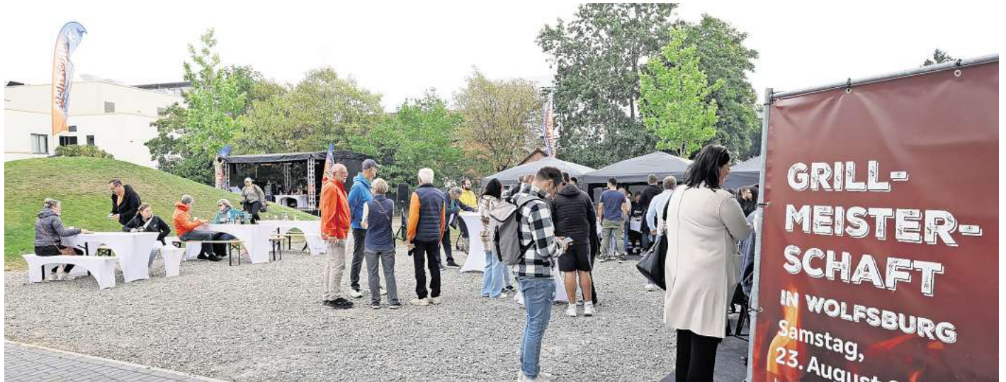
Auf dem Areal der Brawo City wurde die Grillmeisterschaft erstmals ausgetragen. Die Besucher wünschen sich weitere Veranstaltungen am Nordkopf.