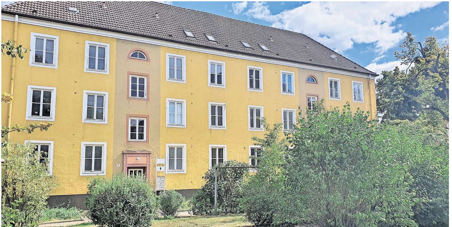
Das Gebäude in der Schillerstraße 7-9 wird grundsaniert.