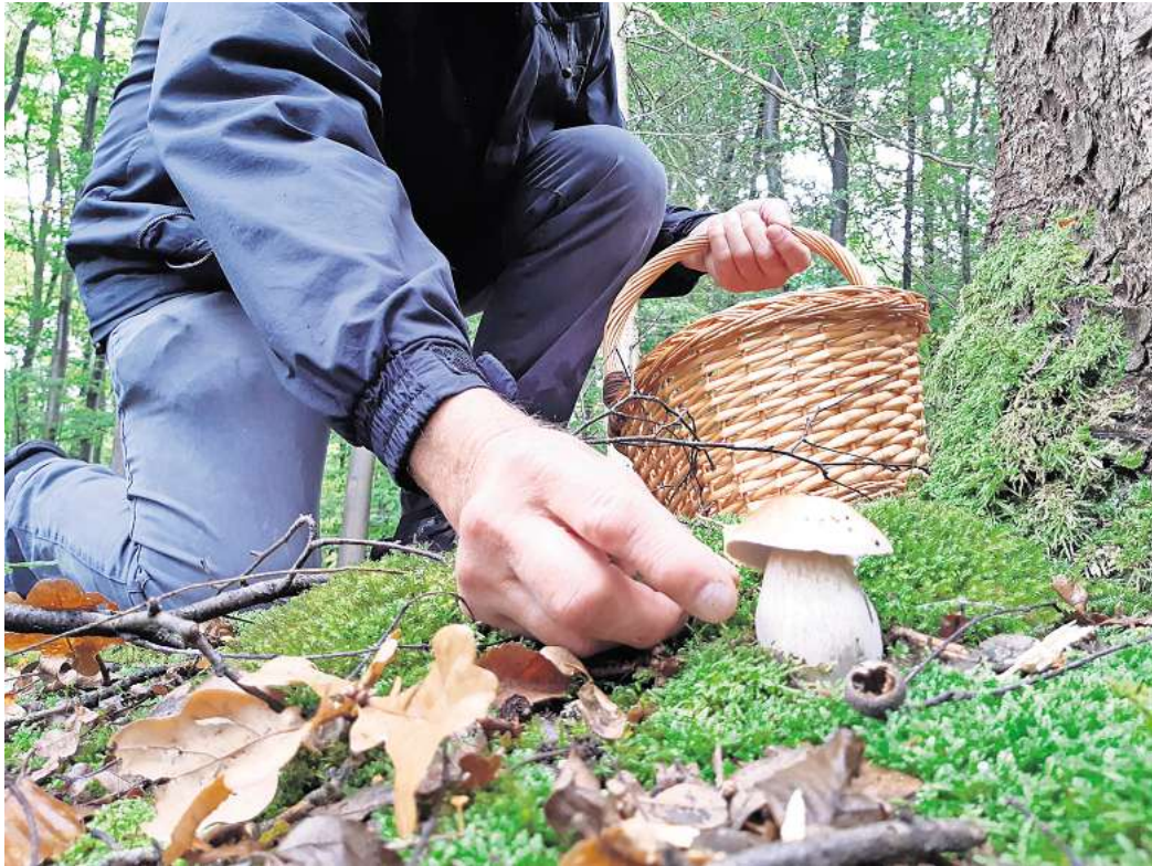
Pilze sammeln kann ein tolles Hobby sein, wenn sich an ein paar Regeln gehalten wird.

Wir möchten Ihre Meinung wissen: Wie stehen Sie zum Pilzsammeln? Ist es etwas für Sie – sammeln Sie Ihre Pilze selbst oder kaufen Sie sie lieber auf dem Markt oder im Supermarkt? Oder mögen Sie Pilze vielleicht gar nicht? Machen Sie mit bei