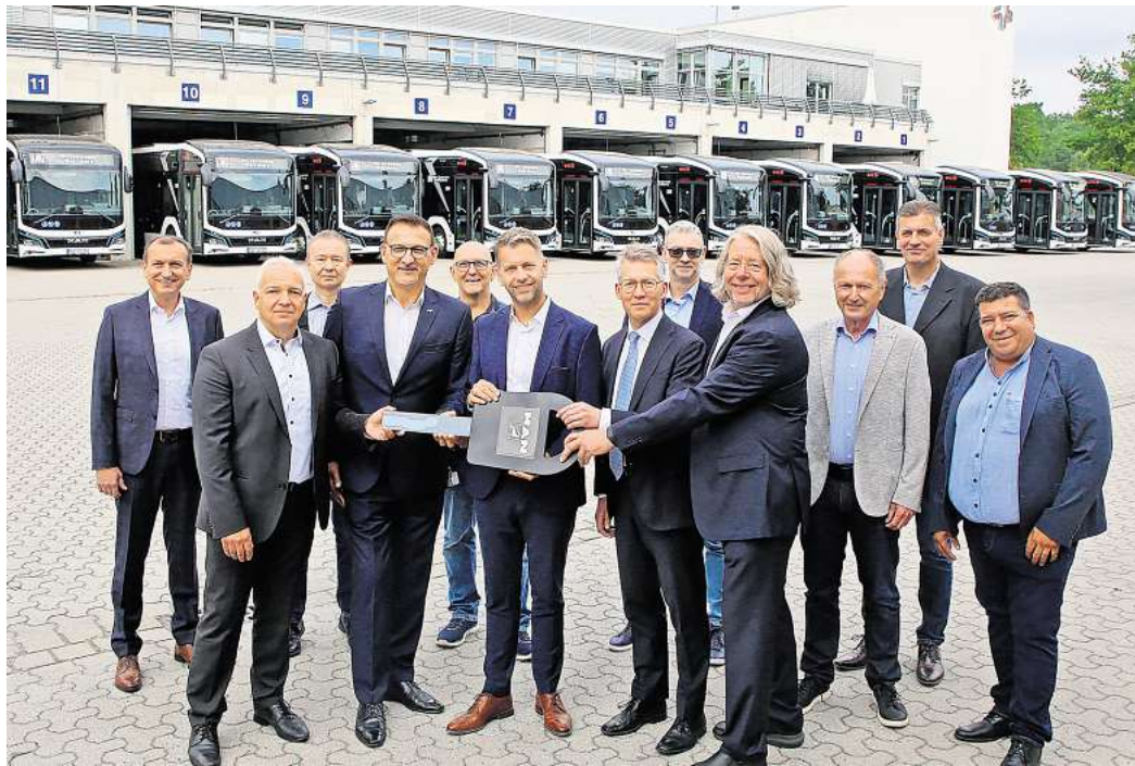
Die WVG freut sich über die neuen Busse vom Typ MAN Lion's City 18E.

Die neuen Elektrobusse verfügen über acht leistungsstarke Batteriepakete auf dem Dach, die eine garantierte Reichweite von 210 Kilometern mit vollgeladenen Batterien ermöglichen –