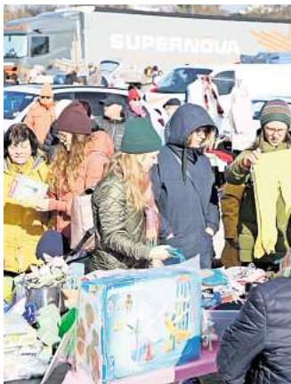
Der Großflohmarkt im Allerpark ist ein Mekka für Schnäppchenjäger.

Der Großflohmarkt im Wolfsburger Allerpark, einer der größten der Region, bietet den Flohmarktfreunden hier seit fast 30 Jahren eine beliebte Plattform zum Kaufen, Verkaufen oder Tauschen. Schallplatten, Bücher, Kinderspielzeug, Bekleidung, Antikes, Kurioses, Werkzeug, und mehr.