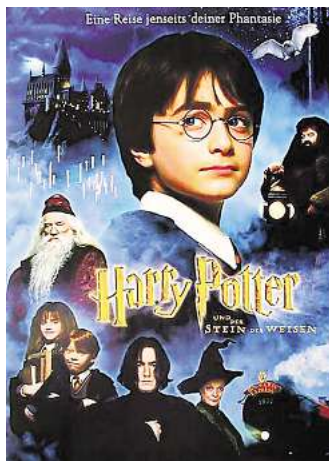
Harry Potter und der Stein der Weisen.