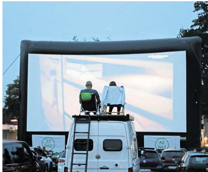
Das Autokino der Aller-Zeitung ist ein ganz besonderes Event, das Kinofans aus der ganzen Region anzieht.

Am Samstag sind zwei Vorführungen geplant: Zunächst läuft der Kinderfilm „Drachen-