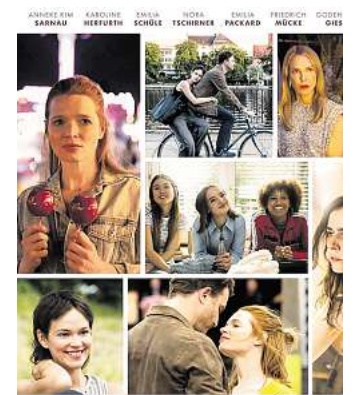
Wunderschöner

Wunderschöner ist die Fortsetzung der Komödie „Wunderschön“ von Regisseurin Karoline Herfurth und begleitet viele der lieb gewonnenen Figuren aus dem ersten Teil auf ihrem weiteren Weg zu sich selbst. Im Mittelpunkt stehen dabei fünf Frauen, die ihr Leben und ihren Selbstwert nicht länger danach ausrichten wollen, begrenzbar zu sein.