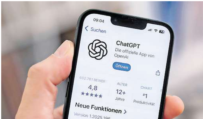
KI-Tools für die Reiseplanung zu verwenden, ist nicht grundsätzlich verkehrt.

Nachdem die beiden ihren Flug nicht antreten durften, erklärt Caldass weinend in einem Tiktok-Video, dass sie diesem Mistkerl (also ChatGPT) nie wieder vertrauen will. Vielleicht keine