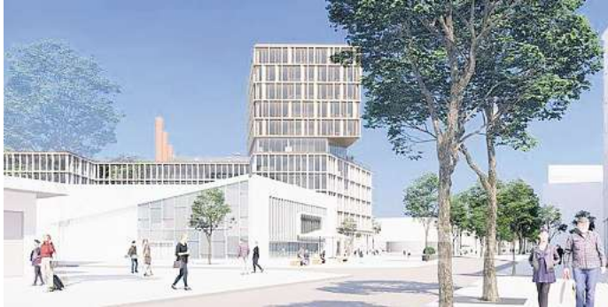
So sieht das „Lupus“ mit Blick von Süden von der Porschestraße gesehen aus.

Wolfsburg. Am Nordkopf soll ein neues Büro- und Geschäftsgebäude gebaut werden. Der Investor Outlet Centres International (OCI) steht vor dem Abschluss eines Kaufvertrages für das Grundstück. Das Projekt mit dem Namen „Lupus“ soll in Nachbarschaft von Markthalle, Jobcenter und Medical Office entstehen. Am Montag stellten Vertreter der Stadt Wolfsburg, der Investor und der Architekt das geplante Projekt vor.