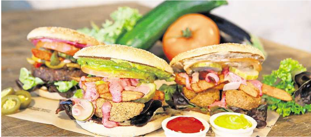
Burger mit veganem Patty – eine beliebte Alternative

Direkt zur Verlosung: Einfach den QR-Code mit dem Handy scannen.