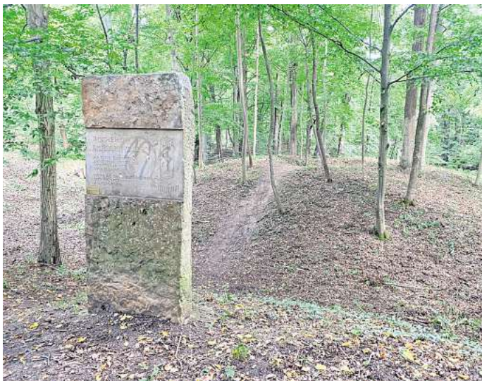
Die mittelalterliche Turmhügelburg steht im Mittelpunkt des Tages des offenen Denkmals.

Der gut erhaltene Turmhügel der Burg Rothehof liegt in Wolfsburg zwischen den Straßen Burgwall und Rothehof unmittelbar an einem Bachlauf im Wald. Die Burganlage stellt eines der ältesten mittelalterlichen Zeugnisse der Stadt Wolfsburg dar und wurde im 12. Jahrhundert errichtet. Zwar ist der repräsentative Turm nur noch in seinen Grundmauern erhal-