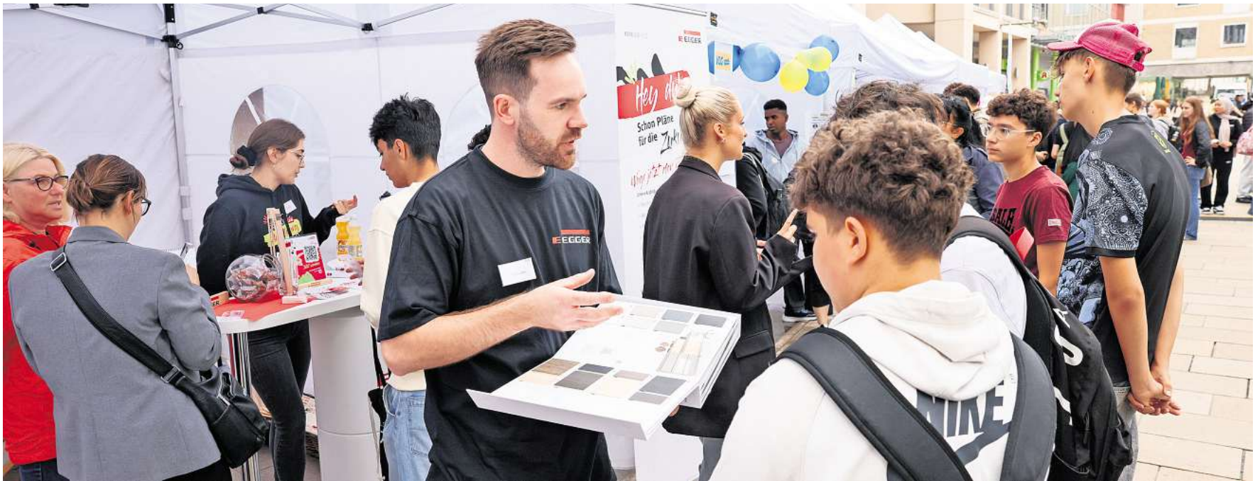
Die Schüler haben auf der „wobJOB“ viele Fragen gestellt: Beispielsweise am Stand der Firma Egger.