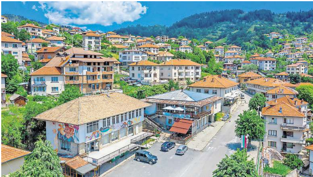
Momchilovtsi ist ein kleiner bulgarischer Ort, der sich bei chinesischen Reisenden großer Beliebtheit erfreut.

Joghurt so besonders macht Die Joghurtproduktion in Bulgarien hat eine lange Tradition, und die Einheimischen sind sich sicher, dass der bulgarische Joghurt der beste ist. Außerdem soll er das Leben verlängern. Das hat unter anderem mit Lac-