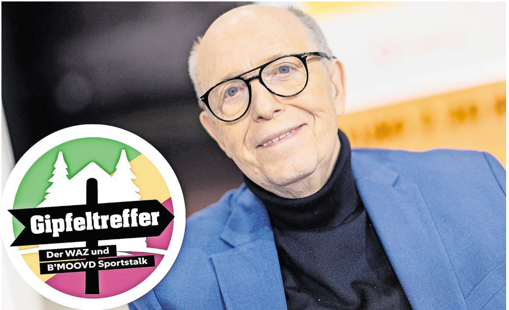
Klartext: Reiner Calmund ist einer der Gäste bei der Premiere des "Gipfeltreffer"-Talks am 16. September.