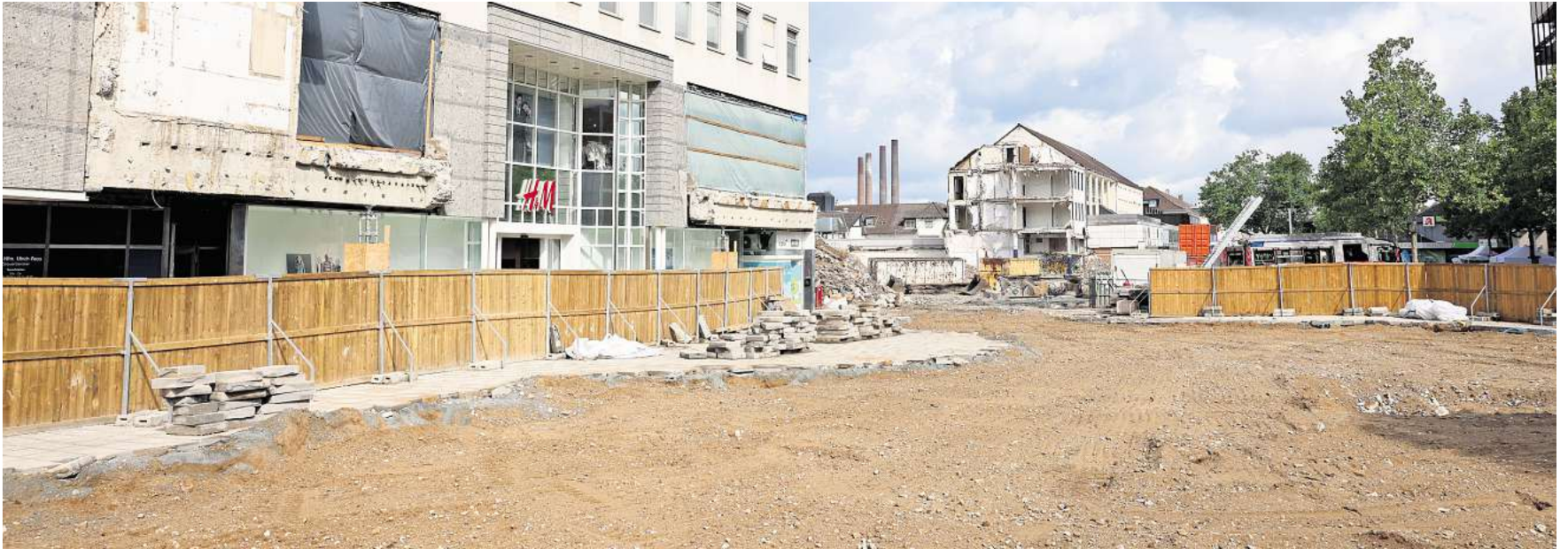
Ungewohnte Blickachsen auf der mittleren Porschestraße: Seit der Pavillon abgerissen worden ist, sind die Türme des VW-Kraftwerks wieder sichtbar.