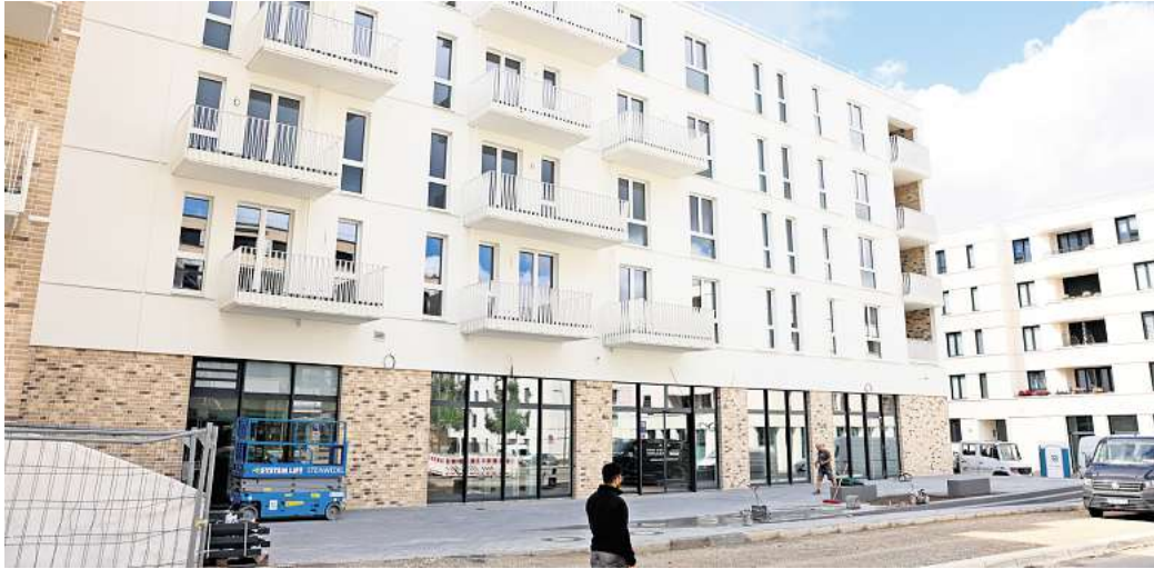
Im Neubaugebiet Steimker Gärten wird Edeka in Kürze das Lebensmittelgeschäft "nah & gut" eröffnen.

Waren wurden bereits angeliefert und auf der künftigen