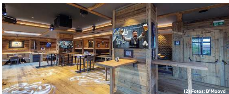
(2) Fotos: B'Moovd

Die Veranstalter erwarten, dass die Reihe sowohl für Freundesgruppen als auch für Firmen und Familien attraktiv ist. Karten sind für einzelne Abende erhältlich, einige Termine sind bereits ausgebucht.