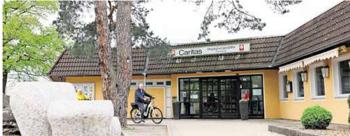
„Föhrenkrug“: Der historische Treffpunkt wird Anfang 2026 abgerissen und durch einen Neubau ersetzt.

An die Stelle des heutigen Föhrenkrug soll ein „moderner, einladender Ort der Begegnung, des Glaubens und der kulturellen Vielfalt“ entstehen. Im Neubau sollen künftig Ehe-, Familien- und Lebensberatung, der Gesamtverband für die katholischen Kitas, der Caritasverband und die Pfarrei gemeinsam ihre