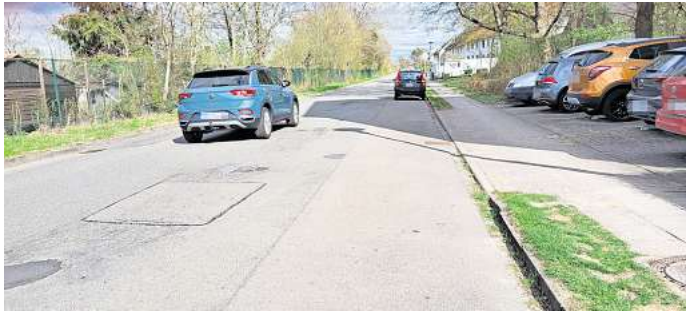
Die Königsberger Straße hat schadhafte Stellen und wird ab 8. September saniert.

Deshalb muss die Fahrbahn bei der Modernisierung teilweise bis