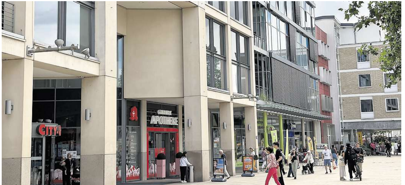
Porschestraße: Händler in der City klagen über weniger Kunden und Umsatzeinbußen. Aber sie sehen auch mögliche Lösungen des Problems.