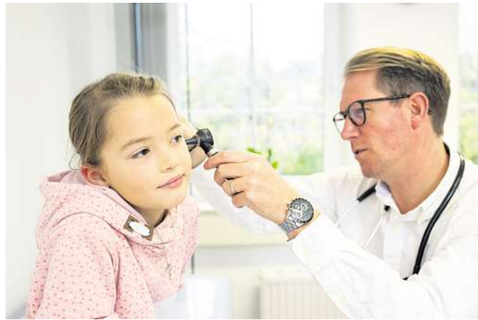
Wie zufrieden sind Sie mit den medizinischen Angeboten in Wolfsburg und Umgebung? Sagen Sie uns Ihre Meinung!

Um ein aktuelles, vielschichtiges Stimmungsbild einzuholen, haben wir den „Gesundheitskompass“ gestartet. Eine große, bundesweite Umfrage. Und Sie, liebe Leserinnen und Leser, sind herzlich eingeladen, daran teilzunehmen. Wir wollen damit