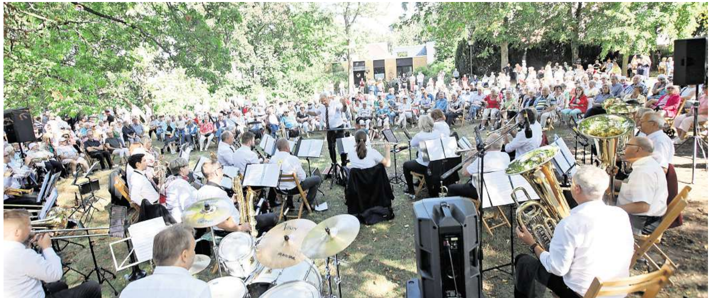
Mit dem Seneradenkonzert des Stadtwerkeorchesters fand das Jubiläumswochenende des Schwefelbades seinen Abschluss.

Bei der Jubiläumsfeier bot das Schwefelbad die Möglichkeit, in die Räumlichkeiten sowie das Angebot hineinzuschauen, zu testen und direkt zu erleben. Neben Massagen wurden auch Schnupperkurse für Yoga und weitere Einblicke in das Schwefelbad gegeben. Dass das Interesse groß war, zeigte sich in den ausgebuchten Massagen und dem allgemeinen Andrang an Besuchern. „Wir sind rundum