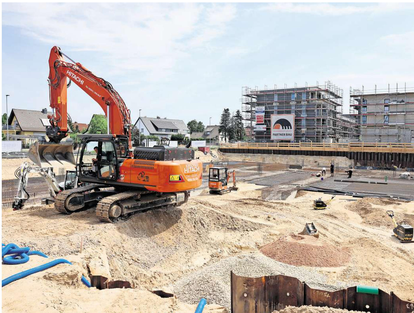
Wolfsburg verfügt bereits über einen überdurchschnittlich hohen Anteil an energieeffizienten Wohnungen. Und es wird weiterhin gebaut, etwa in den Hellwinkel-Terrassen.

Unter den deutschen Großstädten mit mehr als 100.000 Einwohnerinnen und Einwohn-