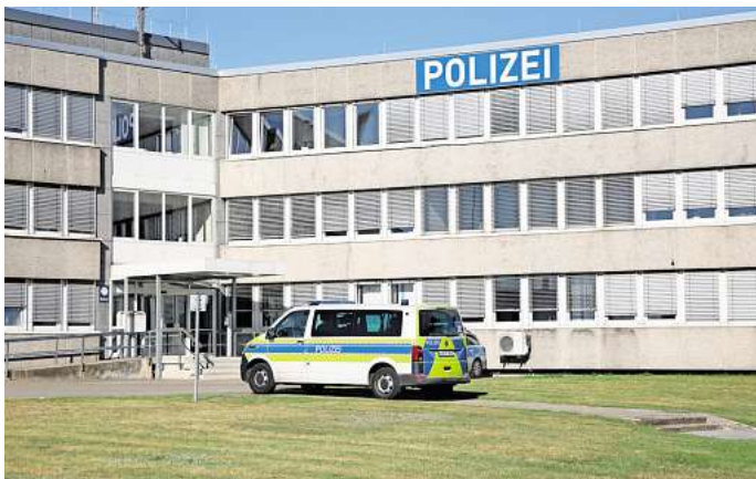
Die Polizeiinspektion Wolfsburg soll ab 2026 saniert werden.

„Die Polizei in Wolfsburg leistet tagtäglich enormes – trotz baulicher Zustände, die längst nicht mehr tragbar sind. Dass die Sanierung nun deutlich früher kommt, ist ein starkes Signal für die Beamtinnen und Beamten vor Ort und ein Gewinn für die Sicherheit unserer Stadt“, erklärt