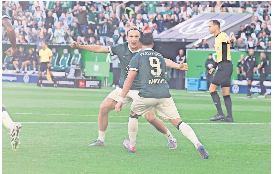
Für das Spiel des VfL Wolfsburg gegen den RB Leipzig können Leser Eintrittskarten gewinnen

Die Teilnahme an der Verlosung ist ganz einfach: Gehen Sie auf unsere Gewinnspielseite und hinterlassen dort Ihre Kontaktdaten. Unter allen Teilnehmern verlosen wir 2 x 2 Karten. Teilnahmeschluss ist der 23. September, um 12 Uhr. Die Gewinner werden ausgelost und im Anschluss benachrichtigt.