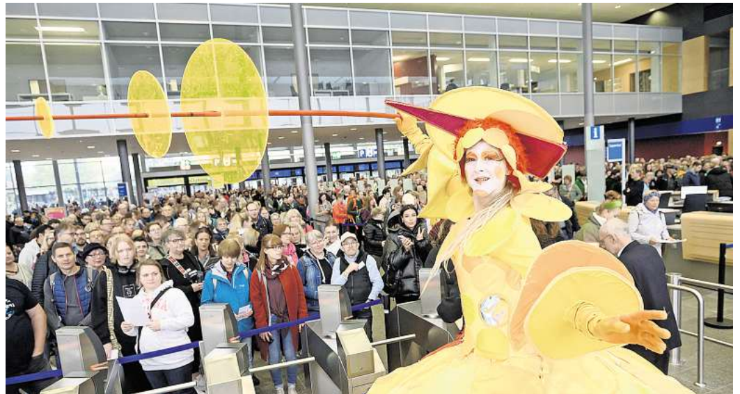
Auch in diesem Jahr werden bei der infa wieder Tausende Besucher erwartet

Direkt zur Verlosung: Einfach den QR-Code mit dem Handy scannen.