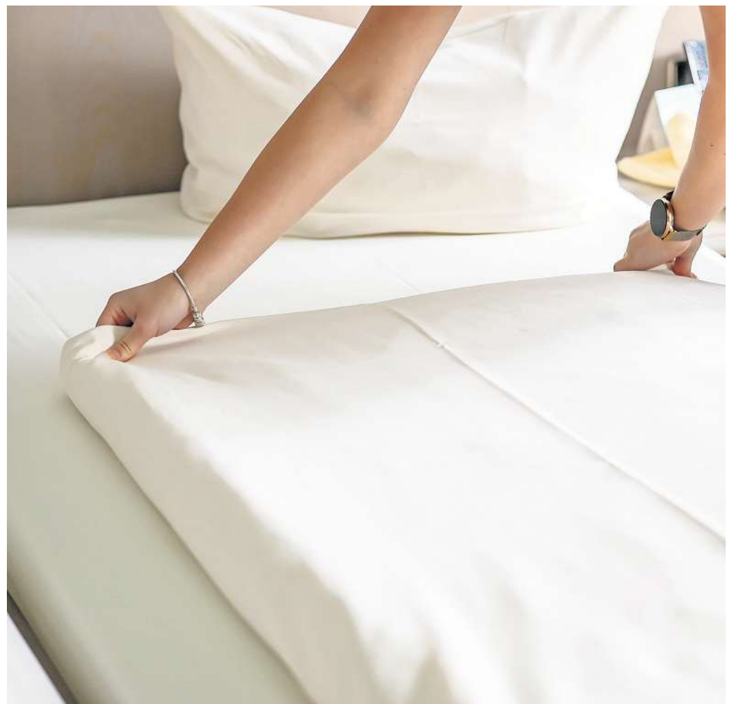
Nach dem Landesstatistikamt sind die Übernachtungszahlen in Wolfsburg um 20 Prozent zurückgegangen.