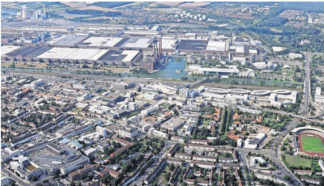
Wolfsburg: Das Defizit im Haushalt steigt um weitere 22,9 Millionen Euro.