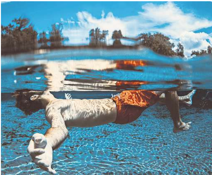
Immer weniger Kinder in Wolfsburg können schwimmen - das hat eine Umfrage an Wolfsburger Schulen ergeben.

kein Schwimmabzeichen. Laut der DLRG gelten Kinder als sichere Schwimmerinnen und Schwimmer, wenn mindestens die Disziplinen des Jugendschwimmabzeichens in Bronze sicher beherrscht werden.