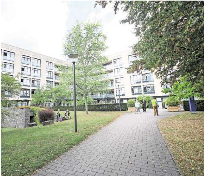
Das Wolfsburger: Trotz hoher Auslastung stieg das Defizit auf rund 20 Millionen Euro an.

Das Jahresergebnis belege zudem, dass seit Jahren generell die Finanzierung der Krankenhäuser