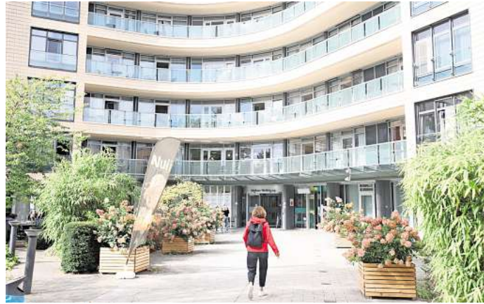
Das Klinikum Wolfsburg informiert anlässlich des Welt-Alzheimer-Tags.

In der Angehörigenprechstunde erhalten zudem Familienangehörige Raum für Fragen, Sorgen und können sich austauschen. „Viele Angehörige fühlen sich anfangs allein mit ihren Fragen. Doch das muss nicht so sein. Es tut gut, sich verstanden zu füh-