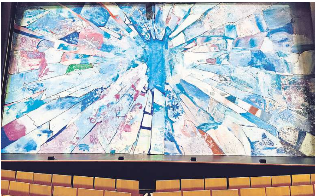
Das war der toll gestaltete Vorhang zum Weihnachtsmärchen des Vorjahres.

Die Maltermine für das diesjährige Weihnachtsmärchen Urmel aus dem Eis (Premiere ist am 14. November um 10 Uhr) finden am Samstag, 8. und Sonntag, 9. November, statt. Kinder zwischen 6 und 12 Jahren (jüngere Kinder können leider nicht teilnehmen) sind eingeladen, den großen Vorhang zu gestalten, der zur Märchenzeit vor den eigentlichen Bühnenvorhang gehängt wird.