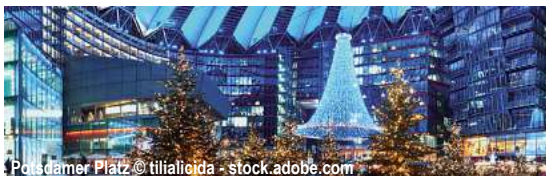
Potsdamer Platz

Weihnachtsmärkte rund um Berlin mit der MS Princess D-PRBEBE Berlin - Potsdam - Brandenburg - Berlin 5 Tage ✓ Fahrt im Luxusreisebus ✓ Flusskreuzfahrt laut Reiseverlauf ✓ Kofferservice an/von Bord ✓ 4 x Übernachtung in der gebuchten Kabine ✓ All-Inclusive-Verpflegung an Bord: 4 x Frühstück, 3 x 4-Gang-Mittagessen, 4 x Nachmittagskaffee/tee, 4 x 4-Gang-Abendessen, 1 x 5-Gang-Kapitänsdinner ✓ Getränkepaket: Hauswein, Bier vom Fass, alkoholfreies Bier, Softdrinks, Säfte, Kaffee/Tee u. Mineralwasser (10:00 Uhr - 22:00 Uhr) ✓ 1 x Willkommens-Sekt und 1 x Abschiedsgetränk im Rahmen des Kapitänsdinners ✓ Stadtrundfahrt Berlin ✓ Besuch der Weihnachtsmärkte in Potsdam, Brandenburg und am Schloss Charlottenburg in Berlin ✓ Bordmusiker ✓ durchgehende Reisebegleitung ✓ alle Schiffsgebühren