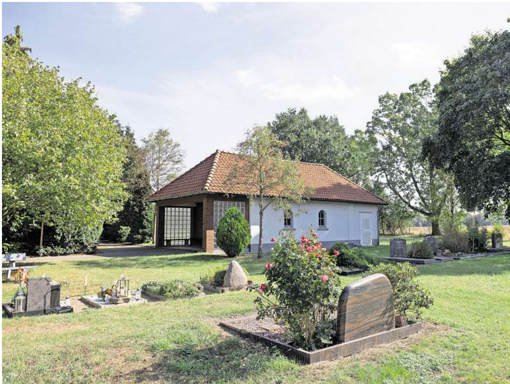
Bald in städtischer Verwaltung? Zur Übernahme des kirchlichen Friedhofs in Neindorf durch die Stadt Wolfsburg haben Teile der Politik noch offene Fragen.

Eine Zustimmung ist dabei kein Automatismus. Die Stadt könne sich nicht mehr alles leisten, gibt Bachmann zu bedenken. Gleichzeitig sei ein Friedhof ein hochemotionales The-