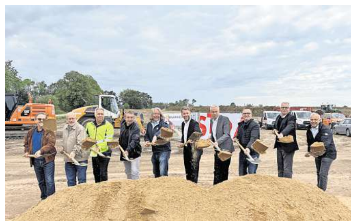
Oberbürgermeister Dennis Weilmann (6. v. l.) und Kai-Uwe Hirschheide, Erster Stadtrat und Stadtbaurat (7. v. l.) setzten gemeinsam mit Vertretern aus Politik und Verwaltung den ersten Spatenstich für den Bauabschnitt Süd 1 der Alternativen Grünen Route (AGR).

Kai-Uwe Hirschheide, Erster Stadtrat und Stadtbaurat, ergänzt: „Durch die Alternative Grüne Route können die Bürgerinnen und Bürger das Pendeln in die Innenstadt stressfreier gestalten und Zeit sparen. Wir