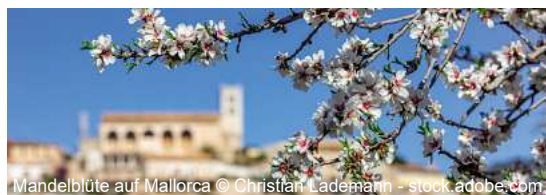
Mandelblüte auf Mallorca

Zur Mandelblüte nach Mallorca 8 Tage ✓ Transfer bis/ab Flughafen Hannover ✓ Flug mit TUIfly Hannover - Palma de Mallorca - Hannover inkl. Flughafensteuern und Sicherheitsgebühren ✓ Transfer Flughafen - Hotel - Flughafen ✓ 7 x Ü/HP im ****Hotel THB El Cid Class direkt am Strand von Can Pastilla im DZ ✓ Informationsveranstaltung inkl. Willkommenscocktail am Anreisetag ✓ Mandelblütenfahrt mit Reiseleitung ✓ deutschsprachige Reisebetreuung während des gesamten Aufenthaltes ✓ durchgehende Reisebegleitung ab/bis Deutschland ✓ Ausflüge Inselrundfahrt; Sineu & Formentor; Drachenhöhlen inkl. Eintritt; Bergdörfer & Olivenöl inkl. Vesper; Stadtführung Palma zubuchbar