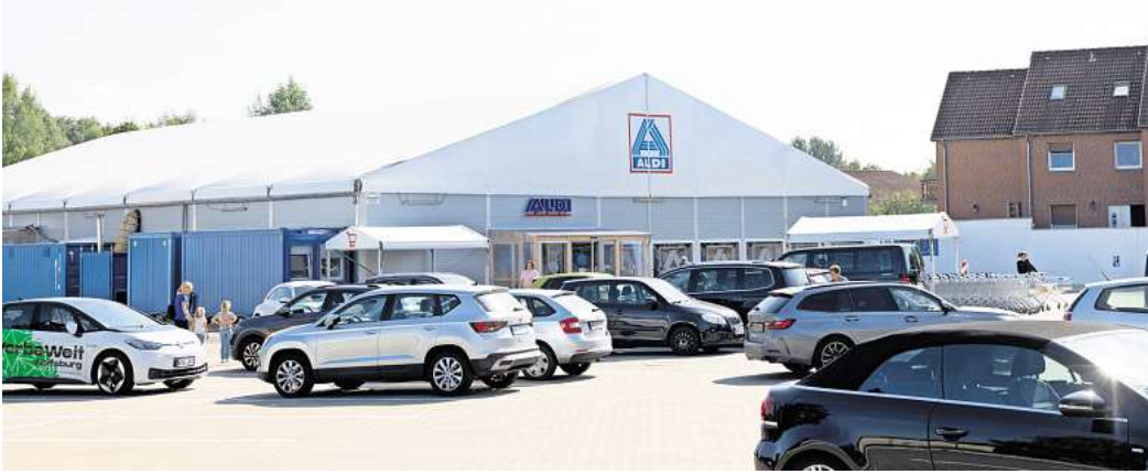
Während der Bauarbeiten am Aldi-Markt findet der Verkauf über ein großes Zelt statt.