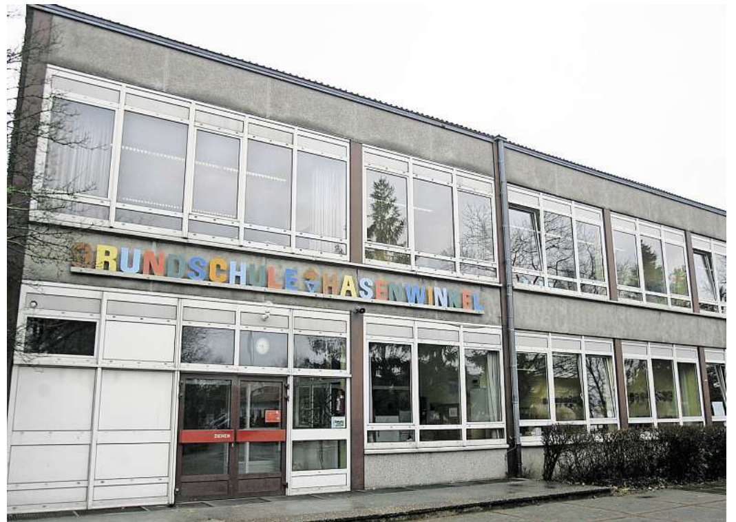
Weniger Bürokratie, mehr Verlässlichkeit: Die Auflösung des Zweckverbandes soll vieles leichter machen.

Für Schuldezernentin Iris Bothe ist das Vorhaben ein Beispiel gelungener Zusammenarbeit. Mit der Übernahme könne Wolfsburg bestehende Strukturen nutzen und Synergien ausschöpfen. Ziel bleibe, bestmögliche Rahmenbedingungen für Bildung zu sichern. Nach der Auflösung gehen Grundstück, Gebäude, Turnhalle und Inventar unentgeltlich an die Stadt Wolfsburg über. Auch Hausmeister und Sekretariat sollen übernommen werden. Für Kinder aus Königslutters Ortschaften – darunter Beienrode, Rhode, Rieseberg oder Uhry – wird eine dauerhafte Beschulungsvereinbarung abgeschlossen. Königslutter beteiligt sich weiterhin an