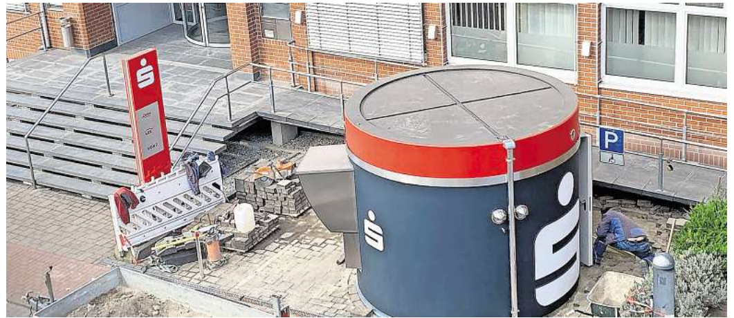
Die Sparkassen-Automaten im provisorischen SB-Container in Fallersleben fallen verkehrt aus, wie Leser berichten.

Bereits seit Anfang des Jahres befindet sich das Kompetenzzentrum Fallersleben der Sparkasse