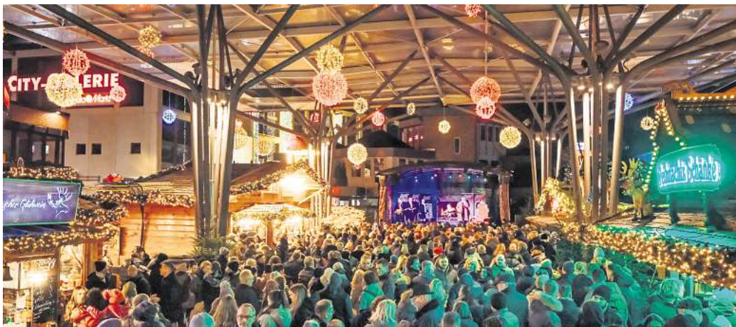
Gute Stimmung in der Innenstadt: Der Wolfsburger Weihnachtsmarkt startet am 24. November.

In Fallersleben findet auch noch allerhand statt: Los geht's am 12. Oktober mit dem Kartoffelsonntag . Bei dem Event wird die neue Kartoffelkönigin inthronisiert. Die Geschäfte öffnen ihre Türen