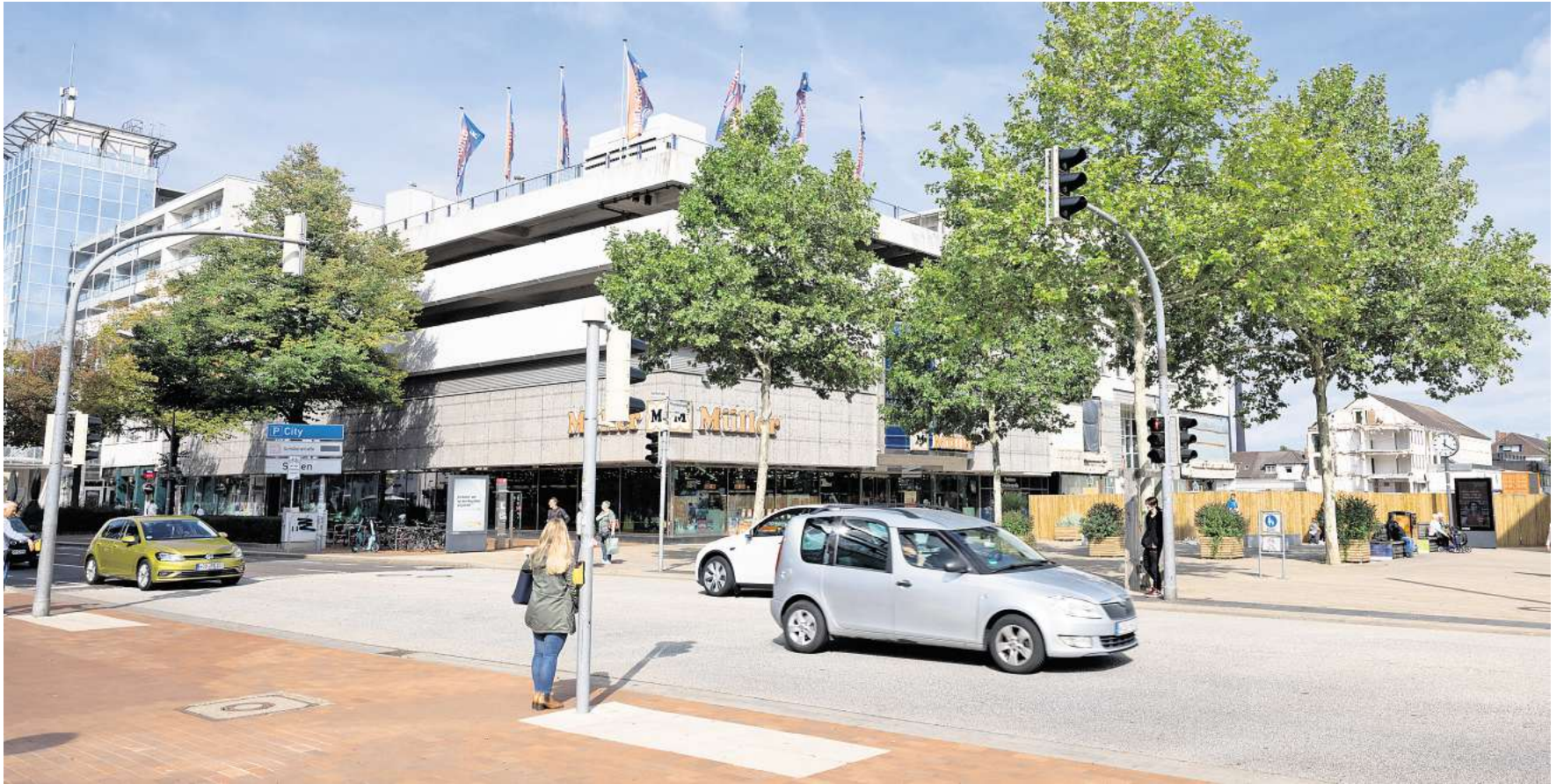
An der Pestalozziallee werden zum Eingang der Fußgängerzone Poller aufgestellt. Allerdings wird zunächst die Fertigstellung des 1. Bauabschnittes der Brawo-Arkaden abgewartet.