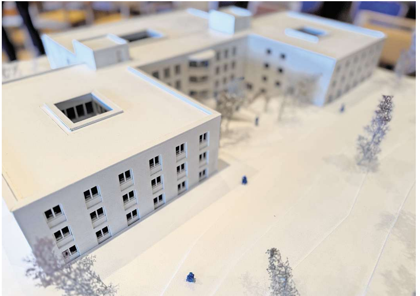
Das neue Kompetenzzentrum für ein Leben mit Demenz: So soll das Gebäude aussehen.

Das Projekt „Wohnen mit Demenz“ verfolgt dabei mehrere übergeordnete Zielsetzungen: Die Planung erfüllt nicht nur die Anforderungen an Energieeffizienz und Klimaschutz (etwa im Hinblick auf Energiebedarf,