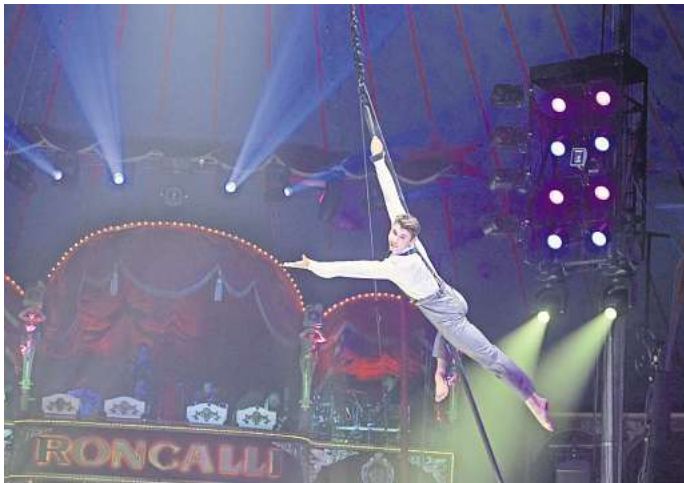
Roncalli - die Premiere von ArtisArt in Hannover

Das Circus-Theater präsentiert seinen Gästen die wohl magischste Hommage an die Kunstwelt, die ein Circus je geboten hat. In dem – laut Andy Warhol – „wundervollsten Circus der Welt“ verneigen sich die Roncalli-Künstler vor Größen