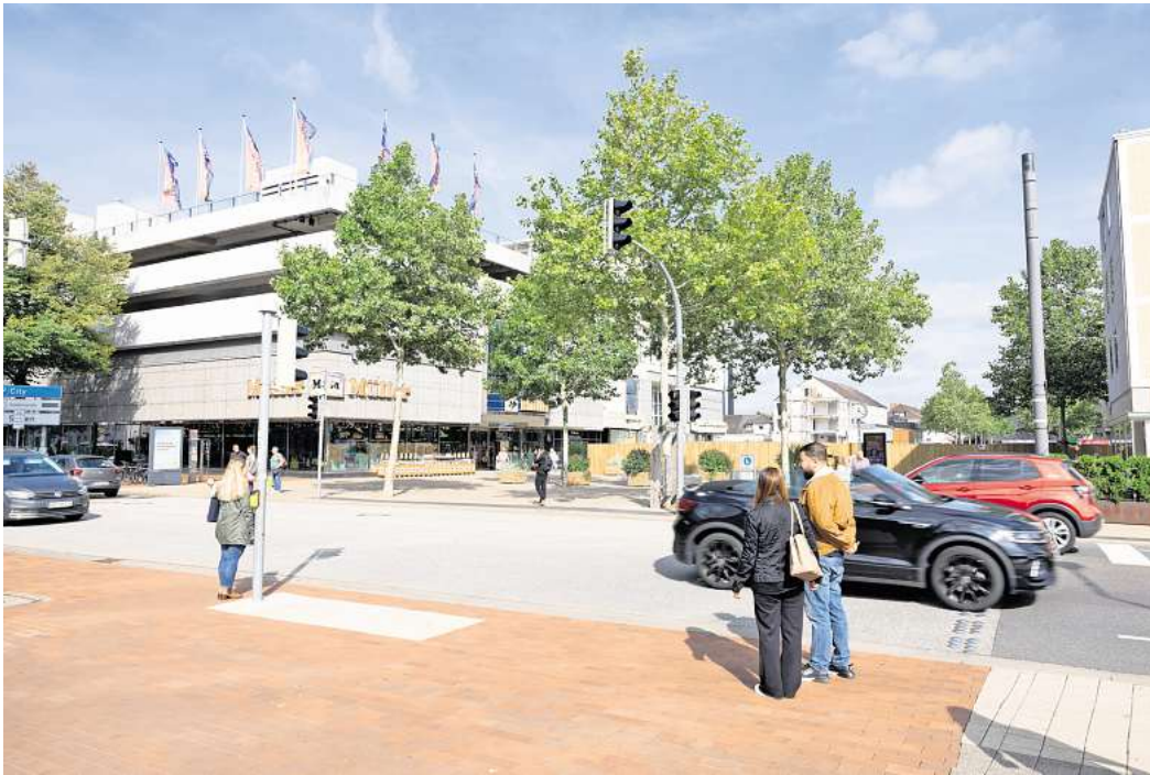
Vorrang für Fußgänger? Die SPD möchte, dass an der Ampel an der Pestalozziallee bei Müller die Autofahrer im Zweifel als zweites dran sind.