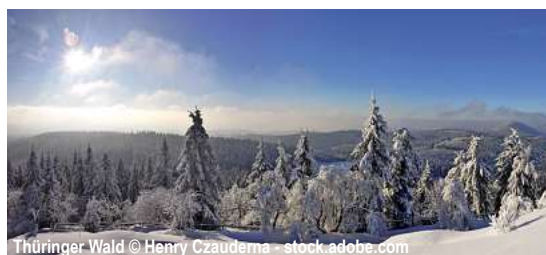
Thüringer Wald

Jahreswechsel im Thüringer Wald 4 Tage ✓ Fahrt im Luxusreisebus ✓ 3 x Ü/F im ***Achat Hotel Suhl im DZ ✓ Begrüßungsdrink im Hotel ✓ 1 x Katerfrühstück (i. R. d. HP) ✓ 2 x Abendessen als 3-Gang-Menü oder Buffet ✓ Silvesterfeier mit 5-Gang-Menü, Musik, Mitternachtsnack ✓ Stadtführung Erfurt ✓ Ausflug Oberhof und Meinungen mit Reiseleitung ✓ Ausflug Suhl und Rennsteig mit Reiseleitung ✓ durchgehende Reisebegleitung