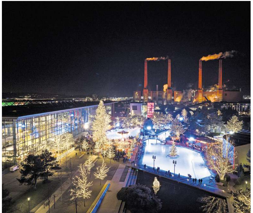
Unter dem Motto „Probier's mal mit Besinnlichkeit“ lädt die Autostadt in Wolfsburg vom 28. November 2025 bis zum 4. Januar 2026 zu ihrer jährlichen Winterinszenierung ein.

Für den Besuch der Winterwelt wird eine gültige Eintrittskarte für die Autostadt benötigt. Die Pavillons sind im Veranstaltungszeitraum täglich von 9 bis 17 Uhr geöffnet, am 24. und 31. Dezember bleibt die Autostadt geschlossen.