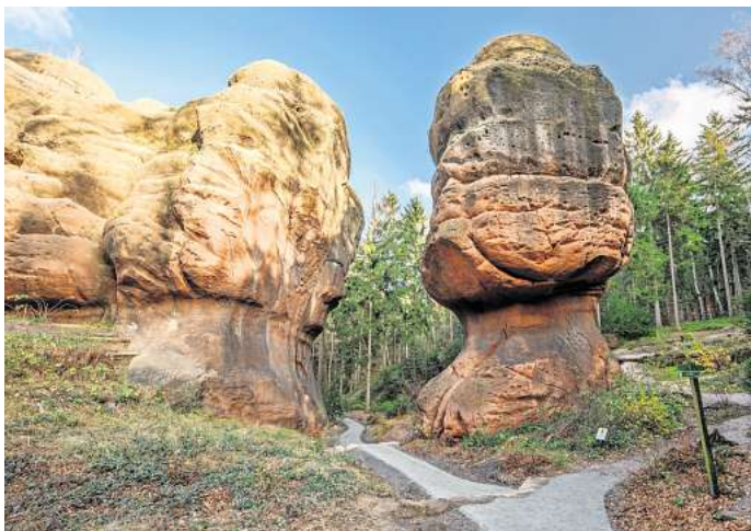
Der Kelchstein bei Oybin ist ein Wander-Highlight im Zittauer Gebirge.

Das Zittauer Gebirge ist zwar klein, aber dafür umso abwechslungsreicher. Wander- und Naturbegeisterte finden in Sachsens Südosten ein dichtes Netz aus rund 500 Kilometern Wanderwegen, die durch dichte Wälder, offene Wiesen und zu bizarr geformten Sandsteinfelsen führen. Besonders eindrucksvoll ist die Jonsdorfer Felsenstadt, ein Labyrinth aus hohen Sandstein-