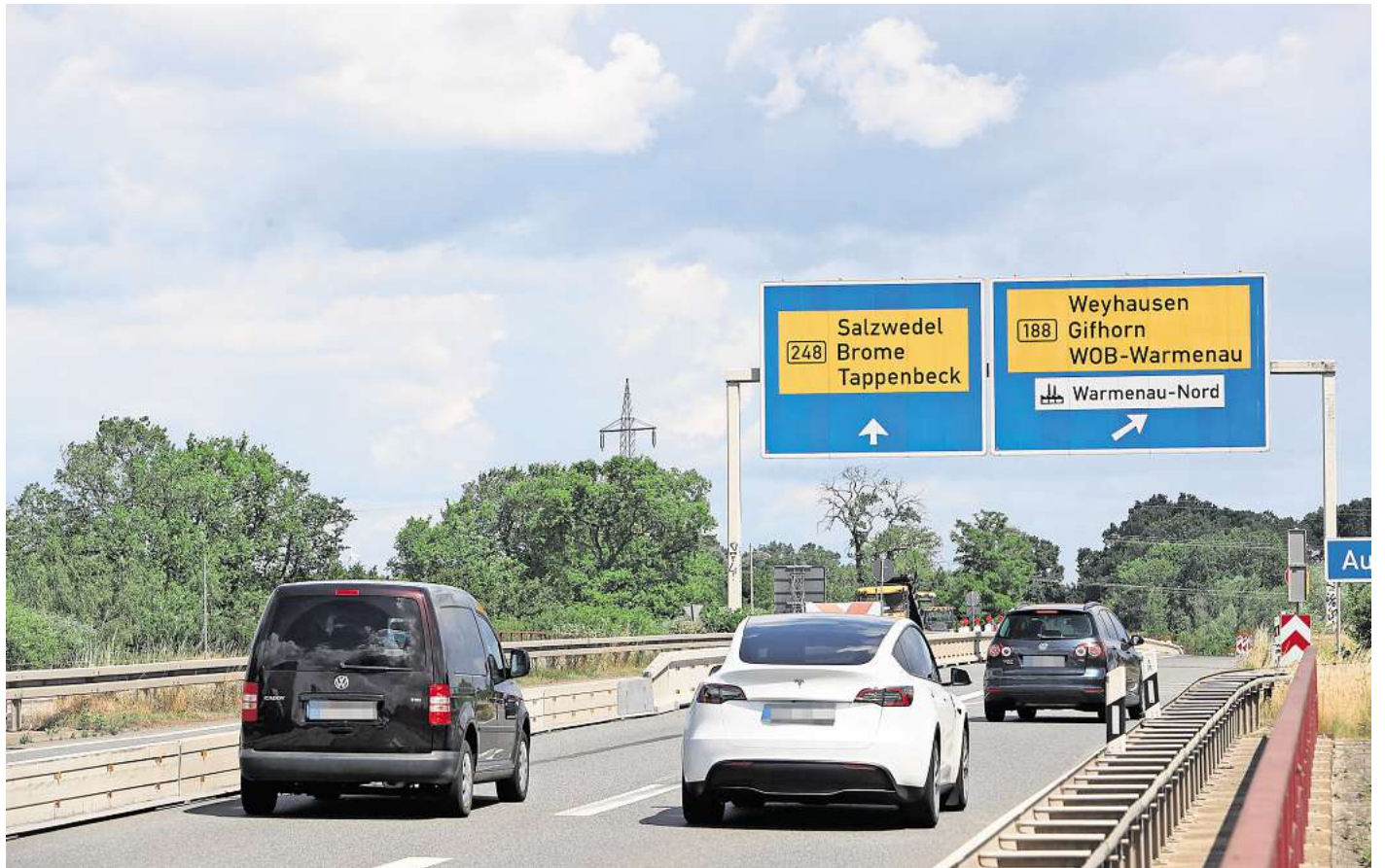
Der Ausbau der A39 soll nun doch erfolgen. Die Entscheidung der Bundesregierung spaltet die Gemüter im Landkreis Gifhorn.

Dass die Bundesregierung nun Handlungsbereitschaft signalisiert, sei nicht nur ein wichtiges Zeichen an die Wirtschaft, sondern auch für die Bevölkerung, die seit Jahrzehnten auf den Lückenschluss der A39 warte, betont Kirschenmann: „Unsere Unternehmen brau-