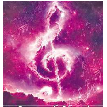
Die neue Musikshow „Stars of Classic“ feiert Premiere.

Die Show richtet sich an Musikliebhaber, Bildungsinteressierte und Familien. Sie wird für Besucher ab 10 Jahren empfohlen. Tickets sind im Onlineshop des Planetariums erhältlich.