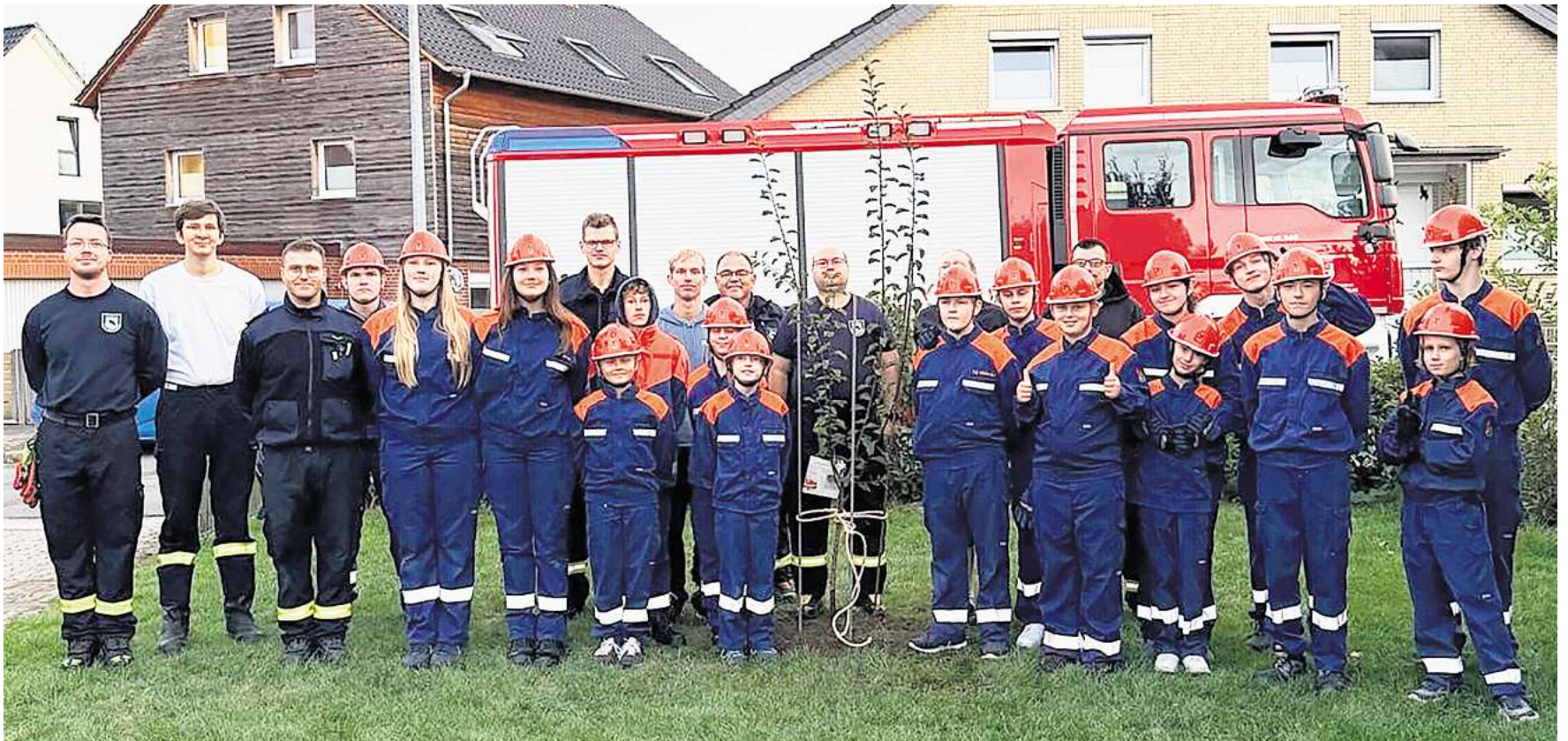
Jugendfeuerwehr Vorsfelde: Die Nachwuchskräfte sollen behutsam an die Arbeit einer Freiwilligen Feuerwehr herangeführt werden.