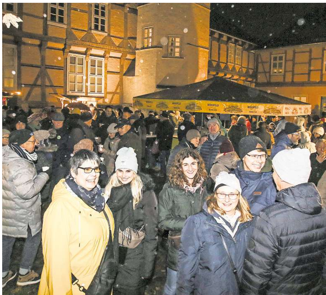
Der VfB Fallersleben organisiert erstmals den Weihnachtszauber. Dabei bewahrt der Sportverein die Tradition.

besetzen, um das Sportangebot vorzustellen. „Vielleicht sprechen wir auch die Abteilungen an, um die Vielfalt zu zeigen. Aber eigentlich kennt uns jeder“, sagt Heidtke und lächelt. Auf jeden Fall werde sich der VfB personell mehr einbringen, dabei sein werden beispielsweise die dualen Studenten.