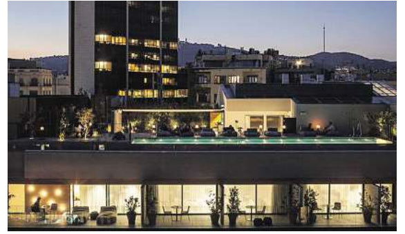
Viele Top Hotels, wie hier das 5* Ohla Eixample in Barcelona, stehen in allen Zielen zur Auswahl.

In allen Zielen hat der Gast die Auswahl aus einem vielfältigen Hotelangebot. So kann man vom Flair-Hotel bis zur Luxusherberge,