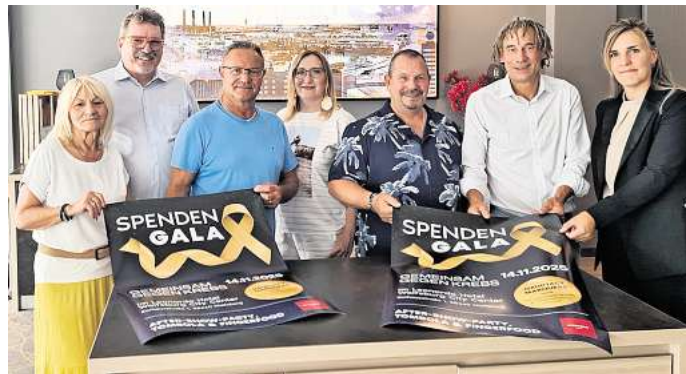
Das Team der Wolfsburger Spendengala „Gemeinsam gegen Krebs“ freut sich auf eine besondere Veranstaltung.

Die Einnahmen der Spendengala fließen an regionale Projekte. Unterstützt wird unter anderem der Heidi Förderverein für krebskranke Kinder in Wolfsburg. Auch für Einzelfälle, in denen Menschen durch eine Krebsdiagnose plötzlich in eine schwierige Lage geraten, sollen Mittel bereitgestellt werden – schnell, direkt und ohne bürokratischen Aufwand. Ziel ist es, den Betroffenen in einer schweren