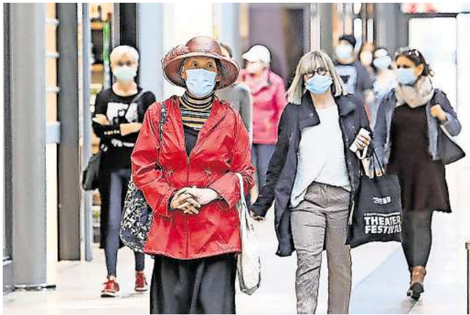
War lange Pflicht: Das Tragen von Schutzmasken, zeitweise sogar im Freien.

In den Workshops werden zentrale Themenbereiche wie Kultur und Freizeit, Kinder und Jugendliche, Gesundheit und Pflege sowie die Arbeitswelt in den Blick genommen. Die Stadt hat dazu Vertreter aus Verwaltung, Politik, Vereinen, Verbänden, Einrichtungen und der Wirtschaft eingeladen, um ihre