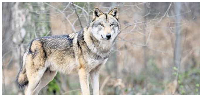
Experten für den Wolf: Für Wolfsburg gibt es nun drei Wolfsberater.

Auf das Monitoring schauen die Wolfsberater ganz genau. Demnach können sich Leute bei einer Sichtung bei ihnen melden. Wolfsberater sind vom Land geschulte und ehrenamtlich tätige Personen, die daran mitwirken,