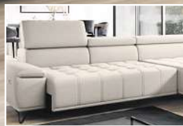
INKLUSIVE motorischem Sitzvorzug