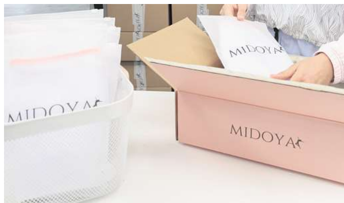
Modemarke Midoya: Wolfsburger Unternehmen verschickt Bestellungen.