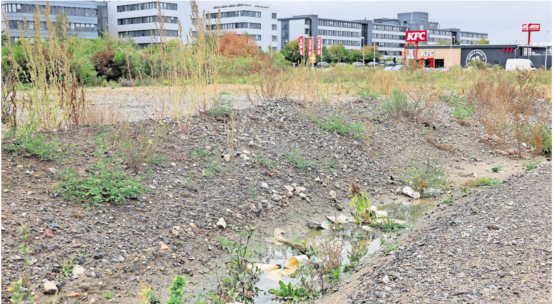
Fallersleben: Hinter McDonald's und KFC wird viel Verpackungsmüll entsorgt.