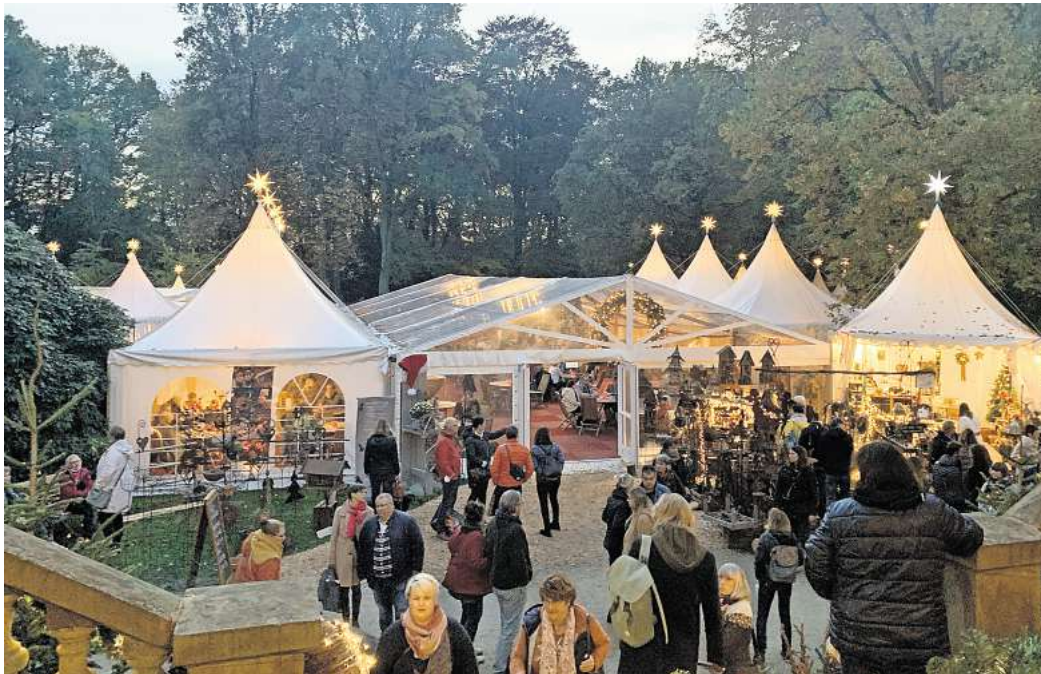
Winter-Träume auf Schloss Eldingen: hallo Wochenende verlost Freikarten für die Ausstellung.

Zahlreiche Aussteller präsentieren im und rund um das Herrenhaus, das in privatem Besitz ist und nur einmal im Jahr für die Öffentlichkeit öffnet, Wohnkultur, Kunst und Design, Antiquitäten,