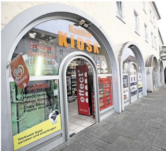
Auch der Kaufhof Kiosk hat flexible Öffnungszeiten für Spätkäufer.

Der Kiosk „38 To Go“ befindet sich am Schlesierweg. Neben