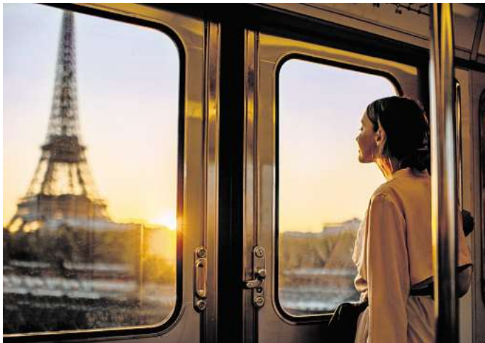
Nur vier Stunden Fahrt entfernt wartet der Eiffelturm.

Wusstest du, dass du vom Stuttgarter Hauptbahnhof in fünf verschiedene Länder fahren kannst, ganz ohne Umstieg? Die baden-württembergische Lan-