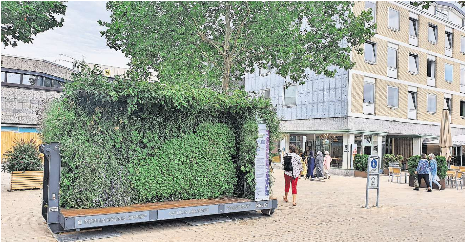
Das „Mobile grüne Zimmer“ stand im Sommer 2025 testweise in der Wolfsburger Innenstadt und sollte für mehr Grün und Schatten sorgen.

In Mainz landete die Begrünung im Schwarzbuch – Stadt setzt nach Probelauf auf Alternativen