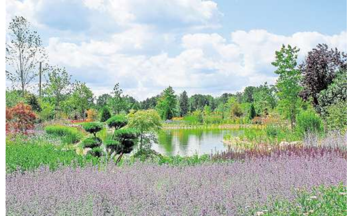
Opa Erny lädt am Samstag und Sonntag zum Herbstfest in seinen üppigen Garten ein.

Kinder bis zwölf Jahre haben freien Eintritt. Der Eintrittspreis ist familienfreundlich, denn Riesenrad & Co. kosten einmalig pro Person 5 Euro und können allesamt genutzt werden – so oft man möchte. Und der Besuch des Gartens ist inklusive. Ein Vergnügen für die ganze Familie.