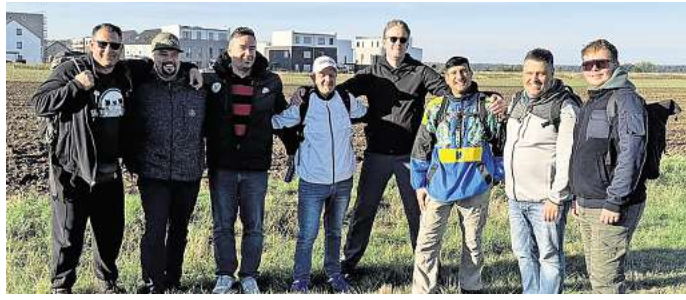
Neue Sparte des VfL: Am Tag der Gründung, am 3. Oktober 2025, ging es gleich auf eine Wandertour.

Die neue Abteilung versteht sich als offenes Angebot für alle Altersgruppen. Neben regelmäßigen Wanderungen sollen auch gemeinsame Boßelrunden stattfinden. Monatliche Treffen, ein jährliches Großevent und die Pflege lokaler Wege gehören ebenso zum Programm wie die Kooperation mit Schulen, Vereinen und Umwelteinrichtungen.