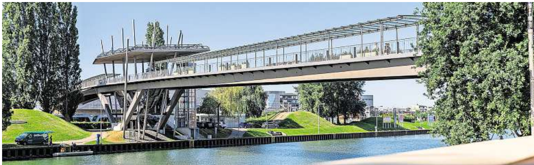
Die Sanierung der Stadtbrücke befindet sich auf der Zielgeraden.

Nach 25 Jahren habe die Stadtbrücke ein „umfassendes Update“ erhalten, erläutert Felber: „Neben dem neuen Bodenbelag, der das Erscheinungsbild aufwertet, laden Sitzgelegenheiten und eine Begrünung nun auch zum Verweilen ein.“ Der Rückbau der Laufbänder senke den Energieverbrauch. An ihre Stelle