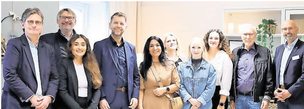
Der neu gestaltete Abschiedsraum wurde offiziell eingeweiht.

Bei einem Rundgang durch die Pathologie war den Auszubildenden der Abschiedsraum aufgefallen, der bis dato eher schlicht und funktional wirkte. Daraus entstand die Idee, ihn neu zu gestalten. „Wir wollten einen Raum schaffen, in dem Angehörige sich wirklich wohlfühlen und in Ruhe Abschied nehmen können. Deshalb haben