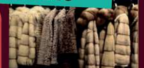
Für Pelze zahlen wir bis zu 12.000€