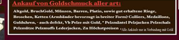
Ankauf von Goldschmuck aller Art:

Altgold, Bruchgold, Münzen, Barren, Platin, sowie gut erhaltene Ringe, Broschen, Ketten (Armbänder bevorzugt in breiter Form) Colliers, Medaillons, Golduhren, - auch defekt, Vb Pelze mit Gold, * Pelzmäntel Pelzjacken Pelzschals Pelzmütze Pelzmuffs Lederjacken, Zu Höchstpreisen *Alle Ankäufe nur in Verbindung mit Gold