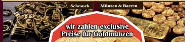
wir zahlen exclusive Preise für Goldmünzen