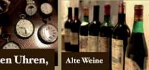
Taschen Uhren, (auch defekt)