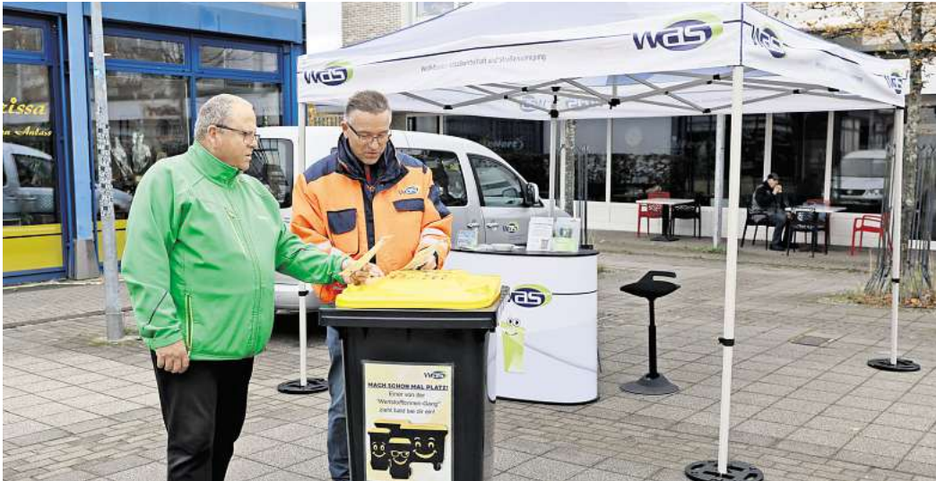
Nicht nur die Wertstofftonne ist 2026 in Wolfsburg neu, sondern auch die Abfallgebührensatzung ändert sich.