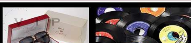
Ankauf von Luxus Brillen