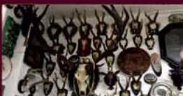
Geweihe mit Höchstpreisen von 1200,-€