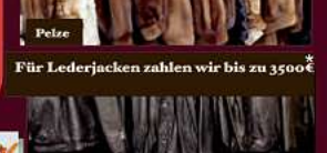
Für Lederjacken zahlen wir bis zu 3500,-€