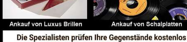
Ankauf von Schalplatten