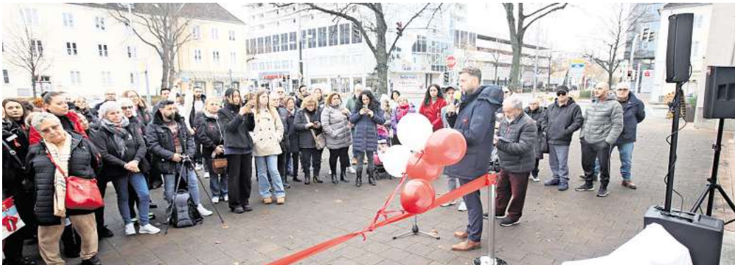
Einweihung der Roten Bank in der Goethestraße: Der Verein „Herz, Träumen und Lachen“ hat sich für das Mahnmal eingesetzt.

Verein „Herz, Träumen und Lachen“ setzte sich für das Symbol ein - Emotionale Einweihung auf der Piazza Italia