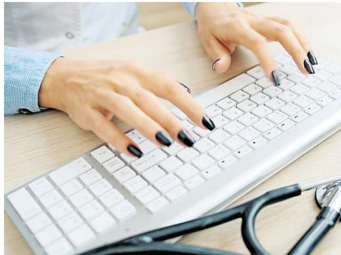
Die absolute Sicherheit gibt es nicht: Am 1. Oktober 2025 wurde die elektronische Patientenakte (ePA) eingeführt.

„Aktuell ist das Einzige, was für einen Zugriff auf eine ePA notwendig ist, eine Menge Wissen“, erklärt Kastl. „Lösbar wäre das Problem dadurch, dass nur signierte, authentische Daten von der Gesundheitskarte gelesen werden. Damit ließe sich kryptografisch zweifellos nachweisen, dass auch wirklich eine von einer Krankenkasse ausgegebene Karte gelesen wird – eine sichere Technik existiert also