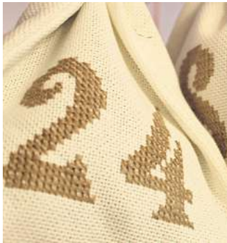
Mit jedem geöffneten Türchen steigt die Vorfreude auf Weihnachten

Wer seinen Liebsten eine Freude machen will, bastelt auch schon einmal selbst und überlegt sich akribisch, welcher Inhalt in die 24 Türchen kommen soll. Online finden kreative