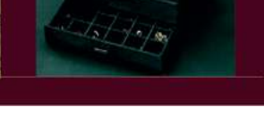
Silber und Trachten Schmuck aller Art