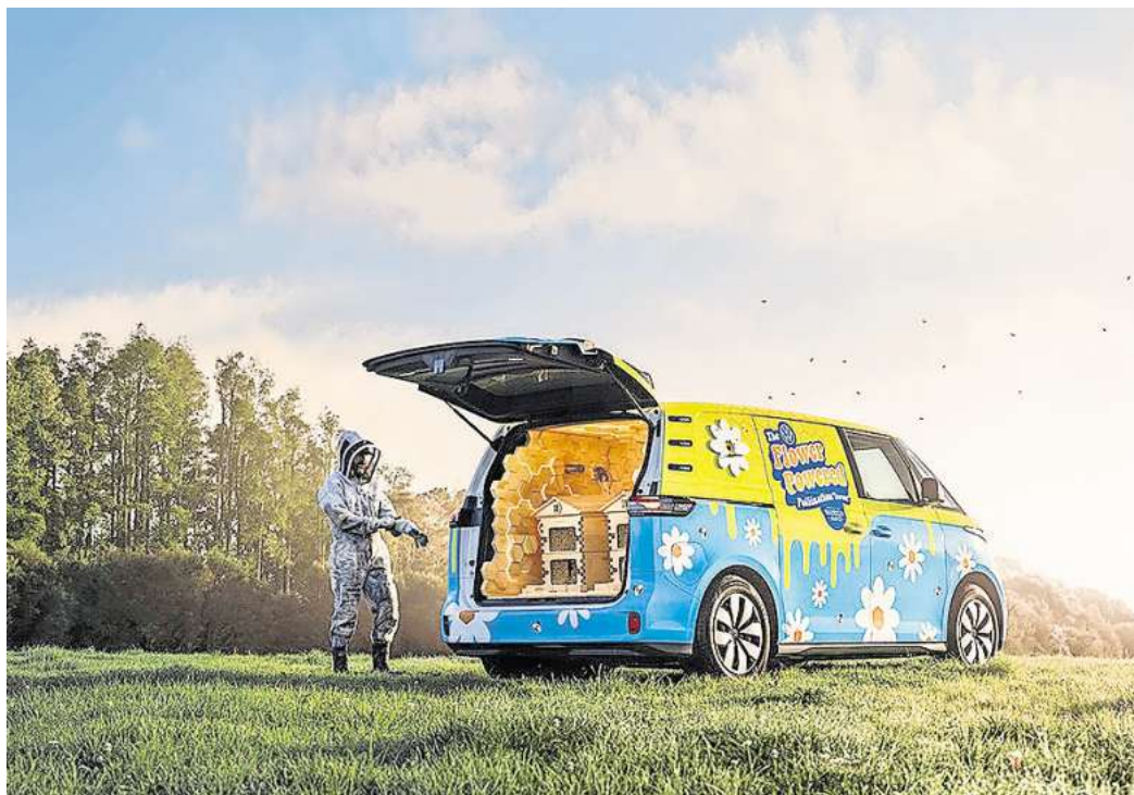
Ein bisschen Flower-Power in Neuseeland: Dieser ID.Buzz wurde zu einem mobilen Bienenstock umgebaut.

Ein Großteil der neuseeländischen Lebensmittelproduktion ist auf Bestäubung angewiesen. Doch mit dem Rückgang blühender Lebensräume und veränderter Landnutzung sinken die Bestäubungsraten in Teilen des Landes, was Ökosysteme und Nahrungsmittelproduktion unter Druck setzt.