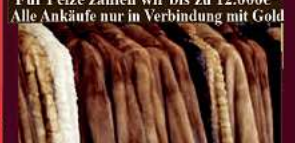
Alle Ankäufe nur in Verbindung mit Gold