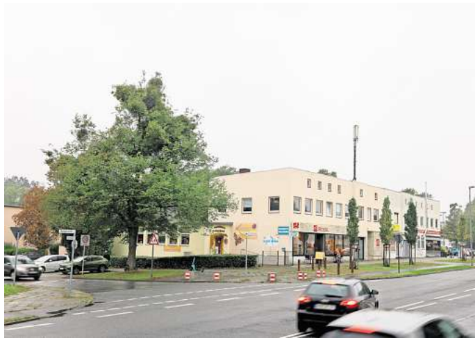
Am Dunantplatz in Wolfsburg will Supermarktkriese Edeka einen Vollsortimenter betreiben.

In den vergangenen Jahren hatte es immer wieder Kritik gegeben, dass alles viel zu lange dauert. Allerdings sind, was die Supermarkt-Pläne betrifft, noch immer nicht alle Fragen geklärt. Zwar herrscht Klarheit bei den Grundstücken, die der Wohnungsgesellschaft Neuland und der Stadt Wolfsburg gehören. Bekannt ist auch, dass ein privater Investor die Gebäude an der Röntgenstraße 83 und 85 abreißen und dafür neu bauen will. Ebenso ist klar, dass Edeka den Markt betreiben will. Zudem hat die Politik in diesem Jahr den Satzungsbeschluss für den Bebauungsplan gefasst, also den finalen Beschluss in Sachen Bauleitplanung. „Es muss aber noch eine