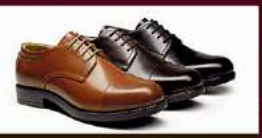
Lederschuhe - mehrere Farboptionen