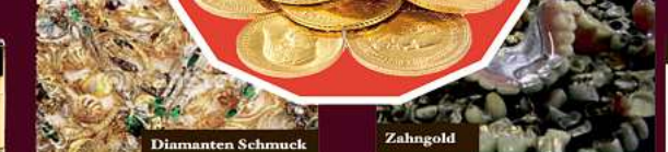
Diamanten Schmuck Zahngold