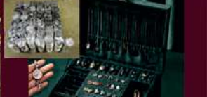
Silber und Trachten Schmuck aller Art