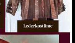
Armbänder auch defekt, Lederkostüme