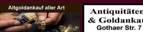
Altgoldankauf aller Art