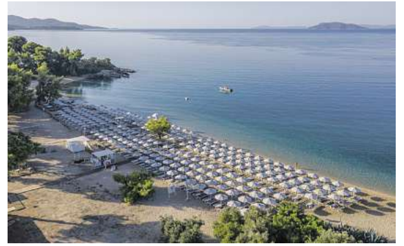
Viele Top Hotels an Traumstränden, wie hier das 4* Lagomandra Beach auf Chalkidiki, sind in allen Zielen buchbar.

Doch nicht nur diese Badedestinationen werden im Frühjahr/Sommer 2026 ab Braunschweig angefliegen. Die Jets starten auch in Richtung Rom, Barcelona, Amalfiküste, Ischia, Liparische Inseln, Malta oder nach Madeira. Alle Destinationen sind so ausgewählt, dass sich bei besten klimatischen Bedingungen