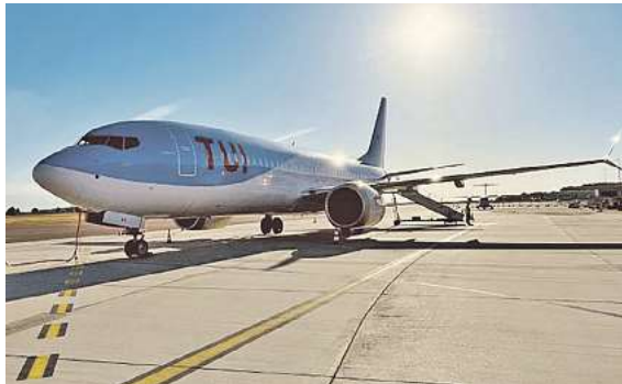
Exklusiv für momento ab Braunschweig im Einsatz: Die deutsche TUIfly

keiten dieser exklusiven Angebote erhalten Sie unter der kostenfreien Buchungshotline T. 08 00 / 38 300 38 (Mo–Fr. 9–18, Sa. 9–13 Uhr) in den FIRST Reisebüro Schmidt und weiteren Reisebüros der Region oder unter www.fliegen-ab-braunschweig.de .