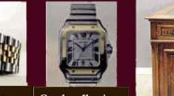
Alte Rolex Uhren ( auch defekt)