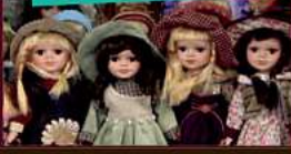
Puppen zu Höchstpreisen von 1500,-€

Kristalle, Gläser, Teller, Vasen, Geschirr, Sets, auch einzeln Antike Möbel, Ölgemälden, Bronzen, Porzellan, Puppen, Orientteppiche, Instrument, Piano, Orgel, Trompete Charivari, u.v.m.