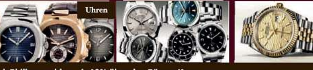
Bei patek Philippe zahlen wir 40% über den Börsen Kurs