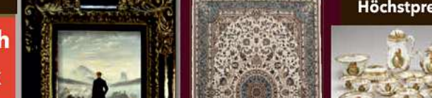
Gemälden, und, Teppiche,